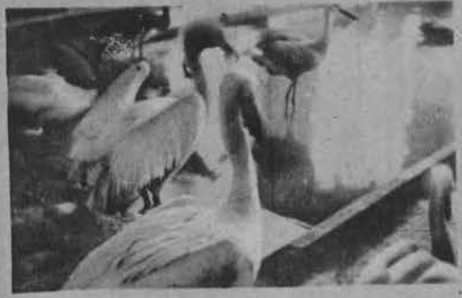
Okazy ogrodu zoologicznego.