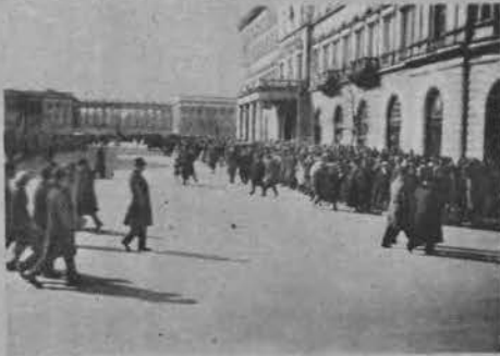
Plac Józefa Piłsudskiego.