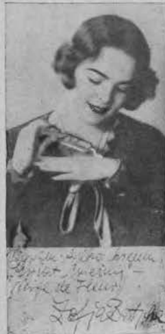
Najpiękniejsza koleżka Polski — używa stale na twarzy i ręk kremu „Neige de Fleurs“, „Kwiat śnieżny“ który działa cudownie na upiększenie cery.