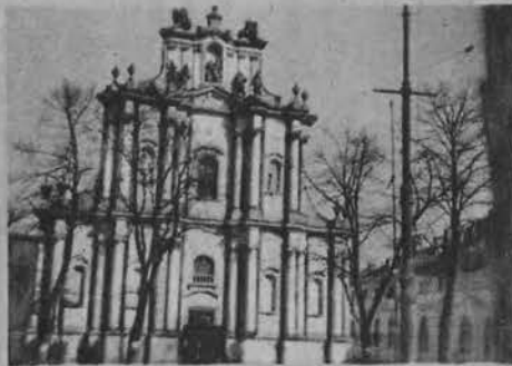
Kościół Panien Wizytek.