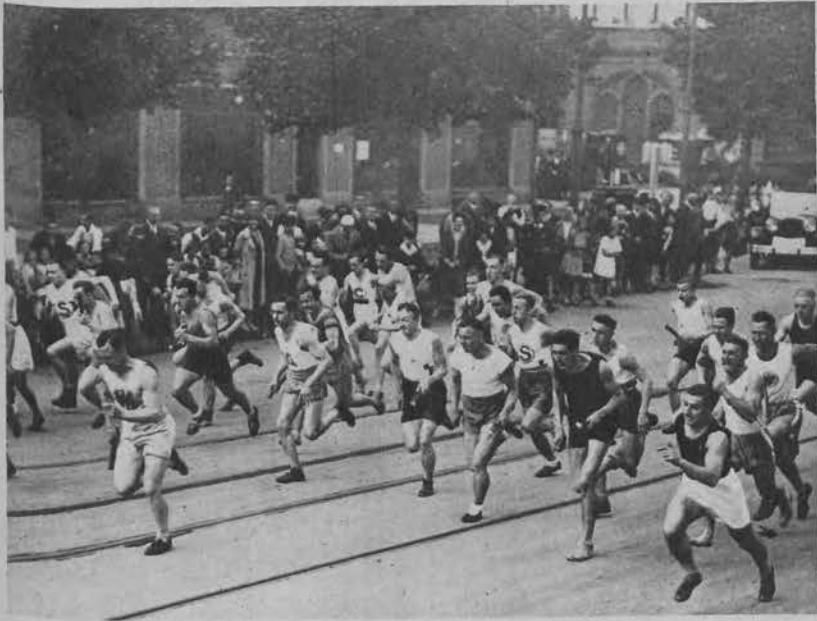
Największy okrężny bieg sztafetowy świata urządzono niedawno w Berlinie. Trasa wynosiła 25 km., startowało 5250 biegaczy i biegaczek.