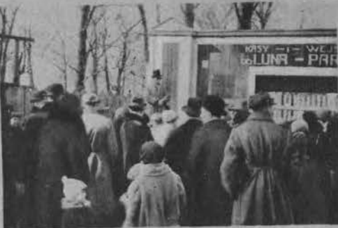
Przed wejściem do luna-parku na Pradze.