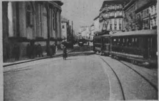
Plac Trzech Krzyży.