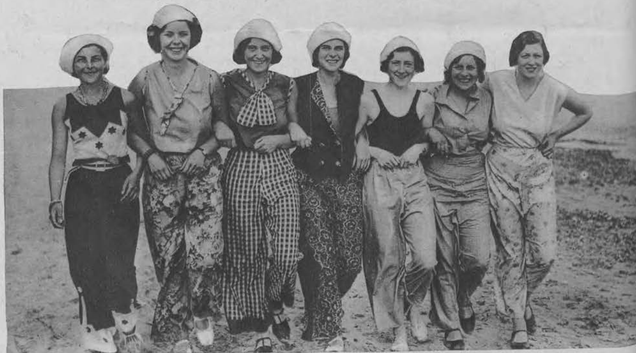
Pełne humoru angielski na plaży w Bournemouth zaadaptowały pokaz swych oryginalnych kostjumów plażowych i pyjam.