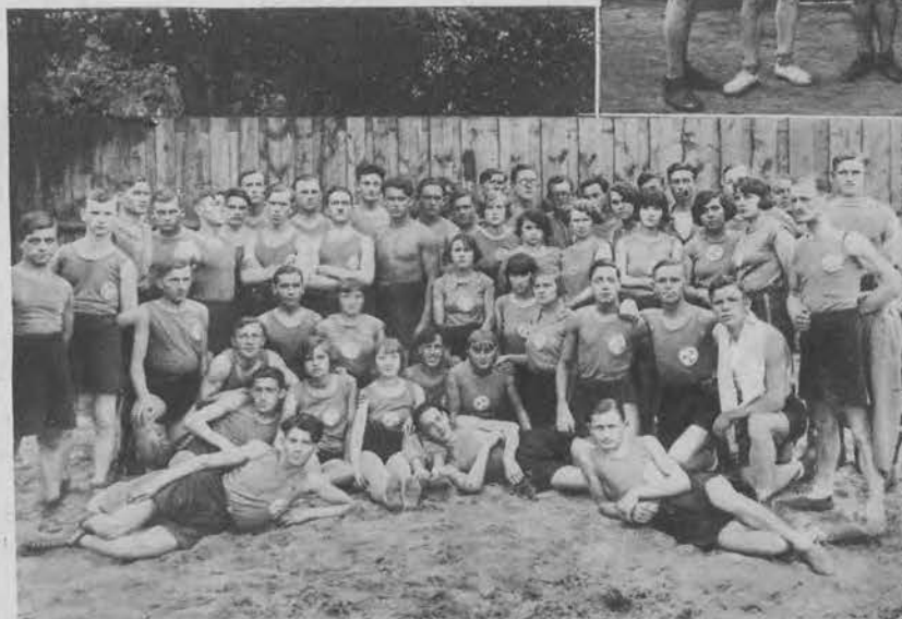
Na lewo: Klub Sportowy „Widzevska Manufaktura“.