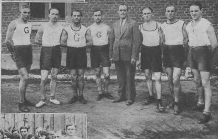
Na prawo: Seksja lekkoatletyczna Kl. Sport. „Gentleman“.