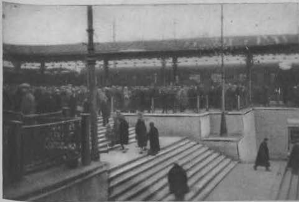
Ożywienie niedzielne na dworcu Łódź-kał., spowodowane masowym wyjazdem łodzian na „zieloną trawkę“.