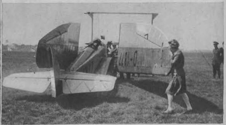
Na zakończenie raidu awjonetek odbył się w Berlinie pokaz techniczny. Oto rozmontowany samolot musi przejechać wąską bramę.