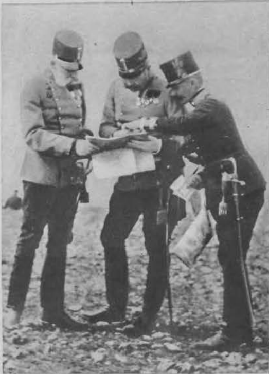
W roku bieżącym mija 100 lat od urodzenia cesarza Franciszka Józefa. Na zdjęciu (od lewej) cesarz i zamordowany następca tronu arcyks. Ferdynand.