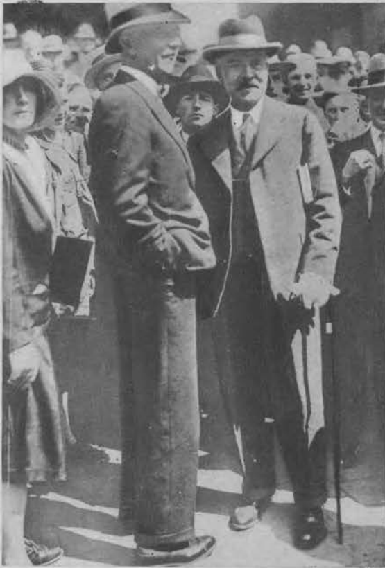
Angielski premier Ramsay Mac Donald udał się na widowiska pasyjne do Oberammergau.