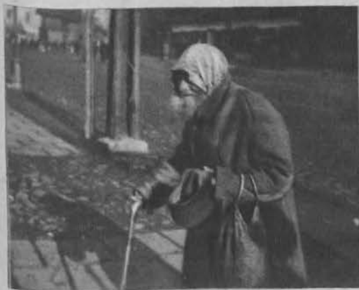
Żebrak z ul. Piotrkowskiej chroni głowę przed upalnym słońcem.