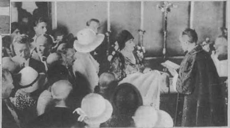
Chrzest syna Marconiego, genialnego wynalazcy radja.