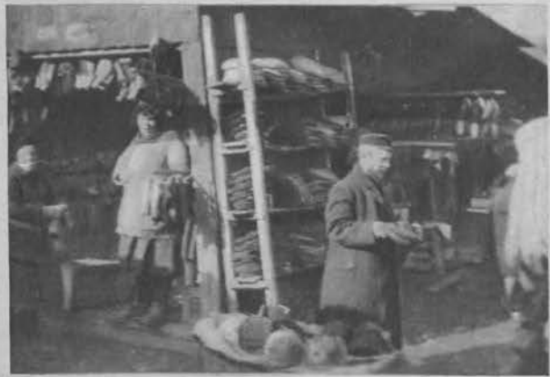
W handlu obuwiem — cisza. Szewcy i „nieszewcy“ chodzą bez butów.