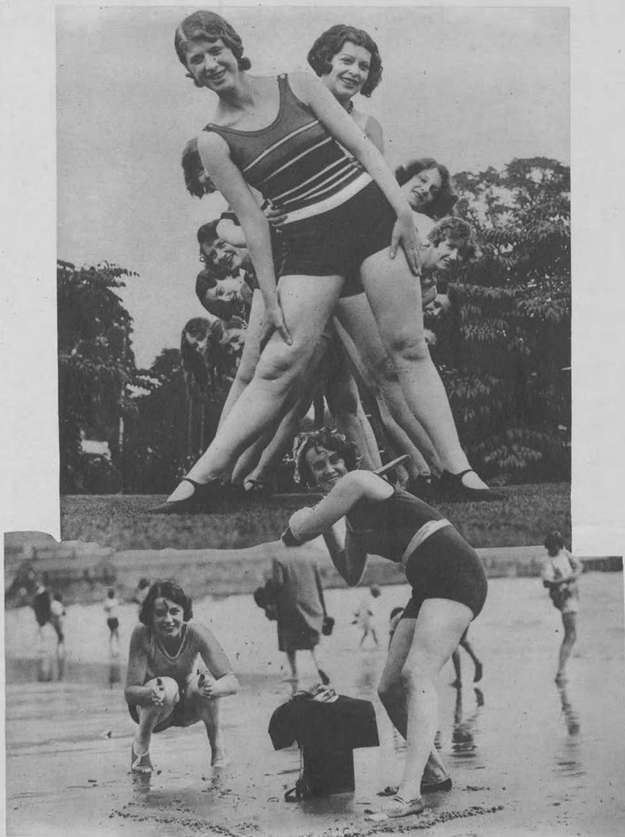
Nietylko na modnych morskich plażach można się wesoło bawić. Oto dwa zdjęcia z plaży nad Tamizą pod Londynem dowodzą, że i tam można zażyć wesołości i zdrowego ruchu na świeżym powietrzu.