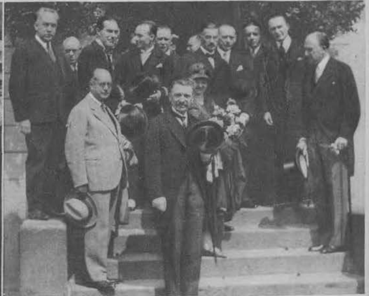
Do Warszawy przybył francuski minister robót publicznych G. Pernot. Na zdjęciu min. Pernot przed dworcem głównym w Warszawie, małżonka ministra, minist. Kühn, ambasador francuski Laroche, hr. Przeździecki.