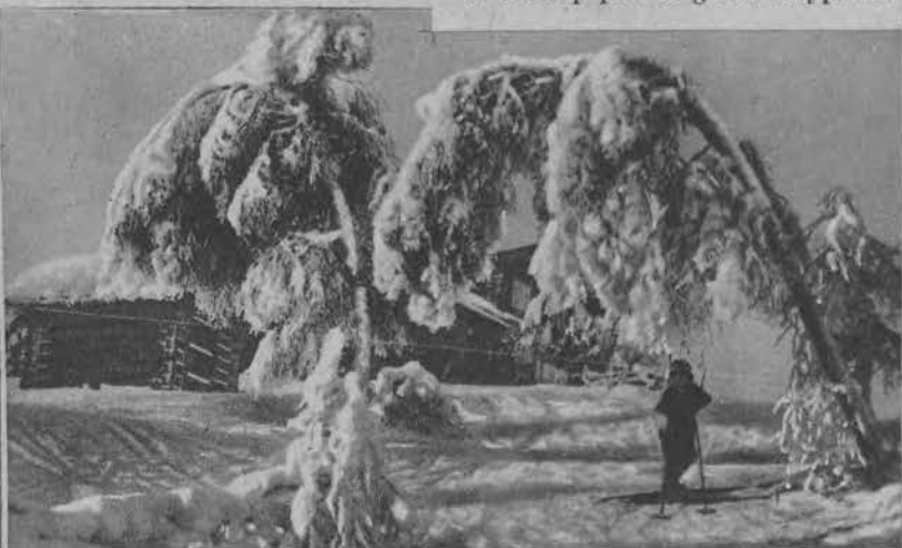
Cudowne zdjęcie pierwszego opadu śniegu w Finso w Norwegii.