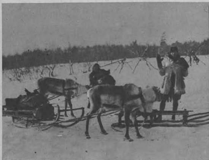
Karawana reniferów angielskiego attaché Finlandji, który spełniając swój urząd, przebywa nieraz 40 milowe przestrzenie.

Na prawo: Mieszkaniec Laponji posiadający największą reniferów zwany przez tubylców królem ze swoim „ministrem finansów”.