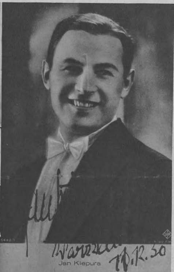
Jan Klepura, znakomity śpiewak polski bawi na występach w kraju.

— Pani ma cudowną cerę! — Tak, bo od urzędzenia pielęgnowano mnie MYDEŁ BÉBÉ SZOFMANA!