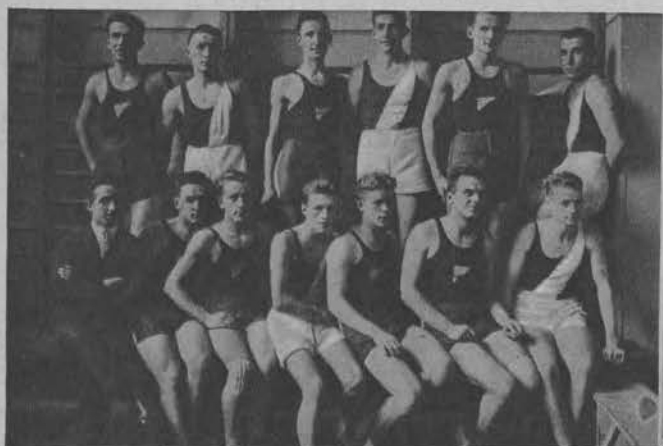
L. K. S. — Polonia mecz w koszykówkę zakończył się zwycięstwem łodzian 23:16.