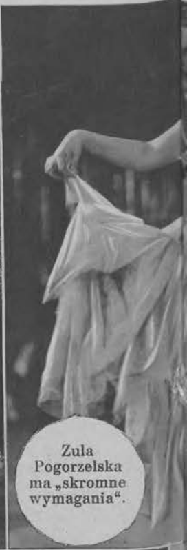
Zula Pogorzelska ma „skromne wymagania“.