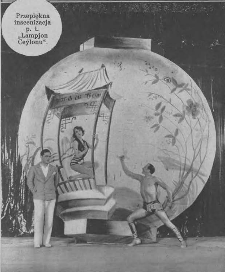
Przepiękna inscenizacja p. t. „Lampjon Ceylonu“.