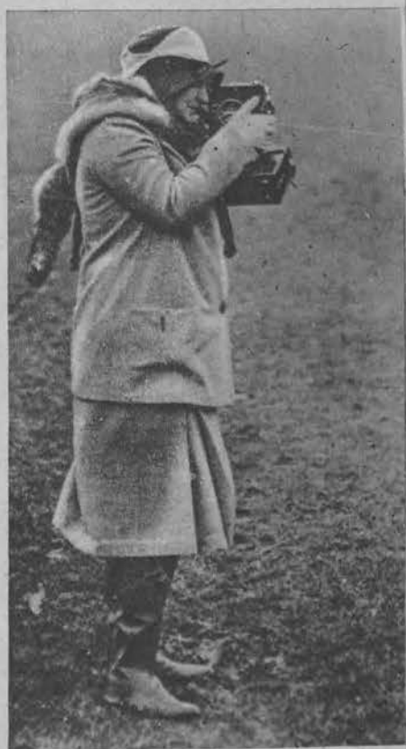
Królowa Danji fotografuje defiladę kadetów w Kopenhadze.