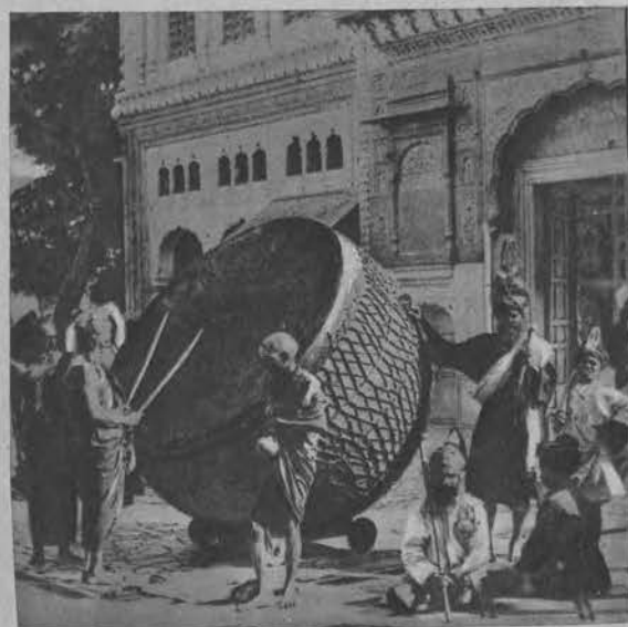
Kapłan indyjski zwołuje ludzi do świątyni bijąc w olbrzymi bęben, zwyczaj nieistniejący już w świecie cywilizowanym.