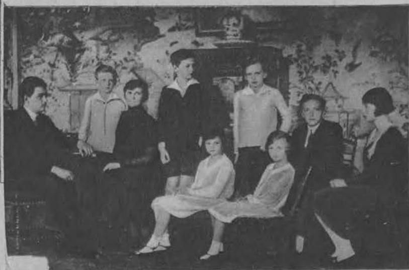
Na prawo: Ekscesarzowa Zyta węgierska z ośmiorgiem dzieci na zamku Ham w Belgji. Na lewo arekksiążę Otto.