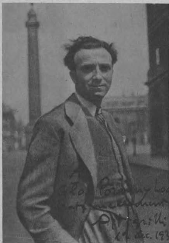
Pitigrilli w Łodzi. Specjalne zdjęcie zaofiarowane Redakcji „Głosu Porannego”.