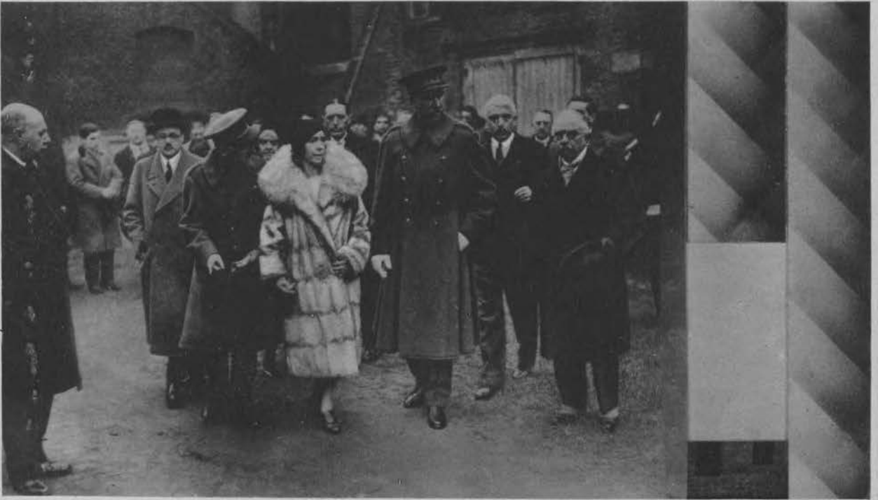
Król Belgów Albert z żoną na kopalni Bois Longpré pod Charleroi gdzie przy eksplozji 16 górników straciło życie.