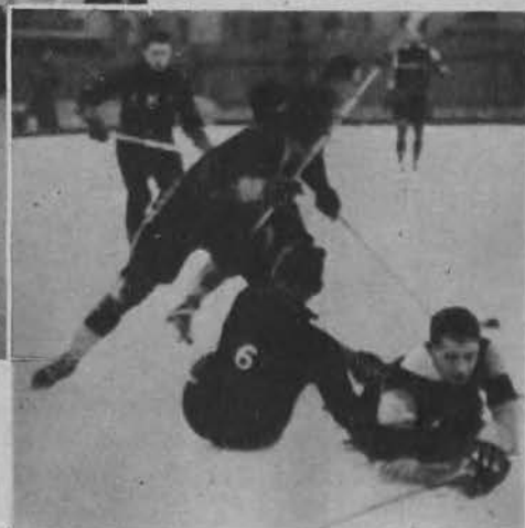
Na prawo: Karambol.