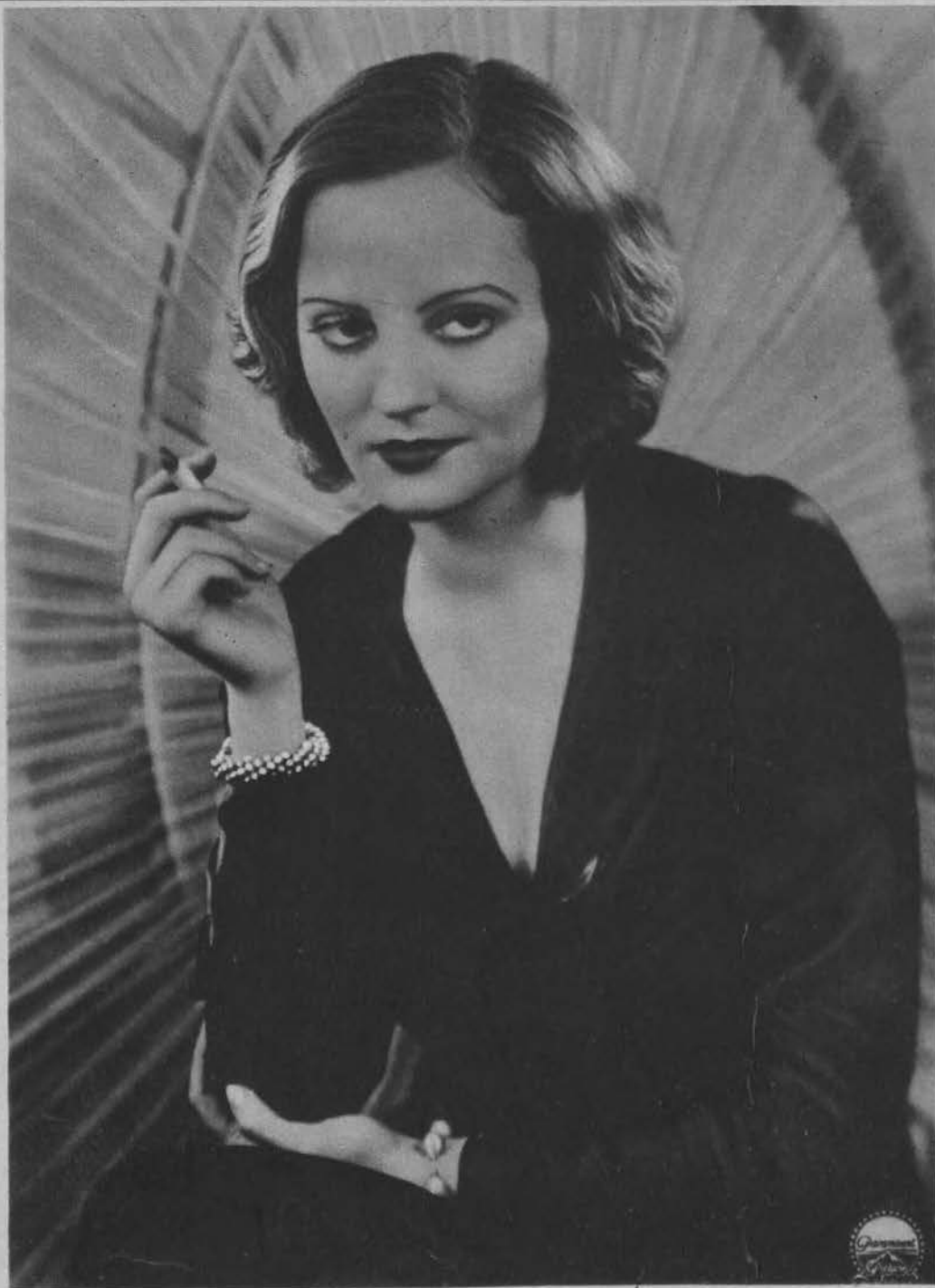
Artystka filmowa Tallulah Bankhead.