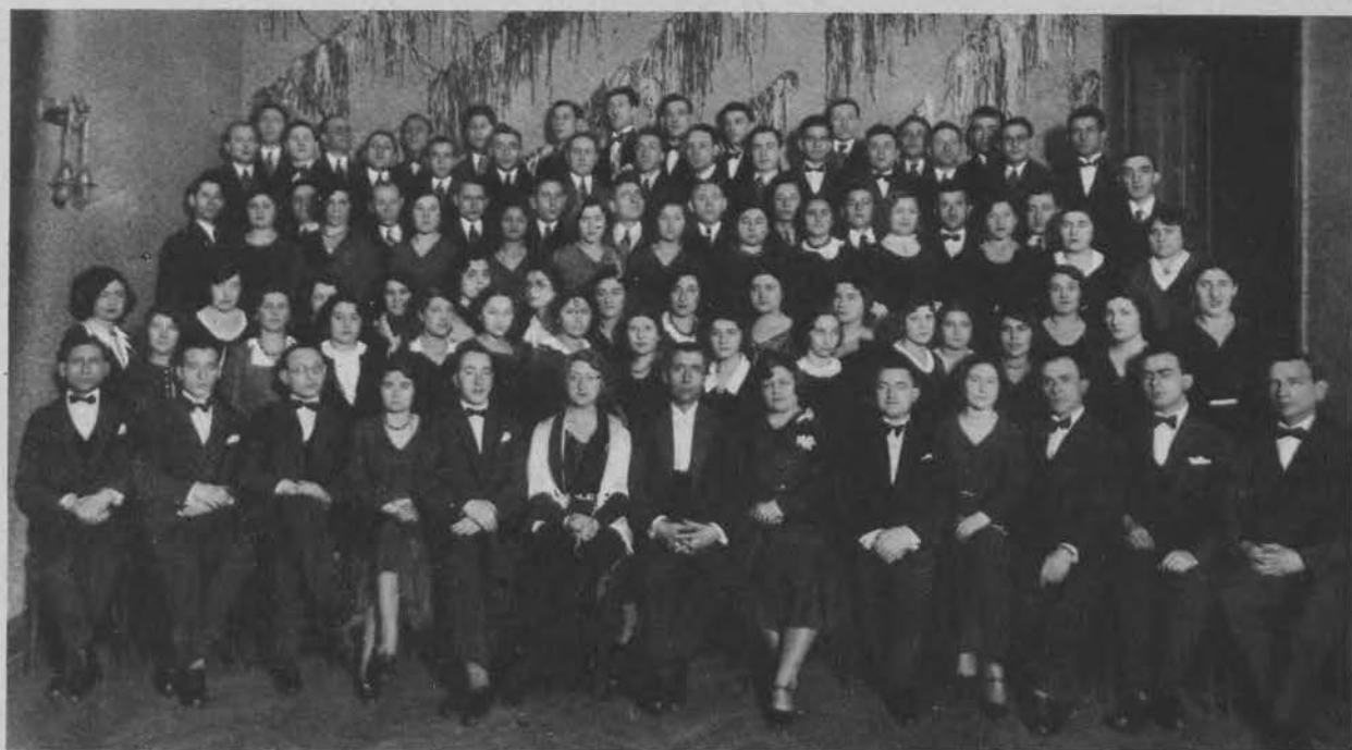
Chór tow. muzycznego „Szir“ założony przed rokiem wystąpił z powodzeniem z szeregiem koncertów w Łodzi.