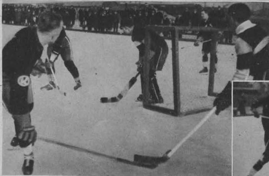
Niebezpieczny moment przed bramką Ł. K. S.