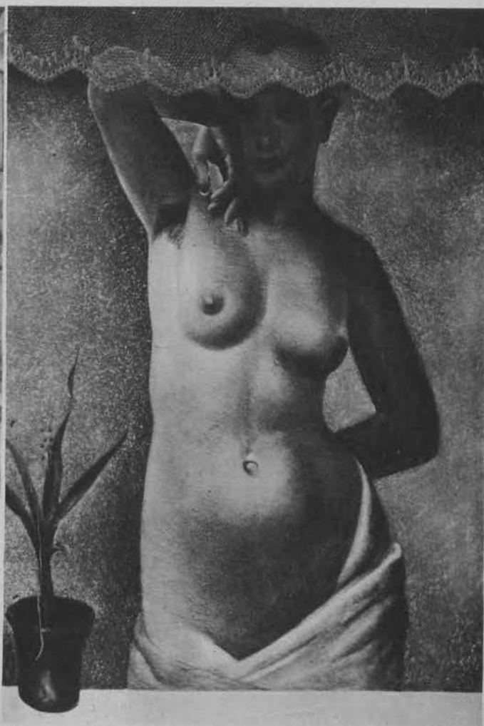
Na prawo: „Poranek“ Bolesław Cybis.