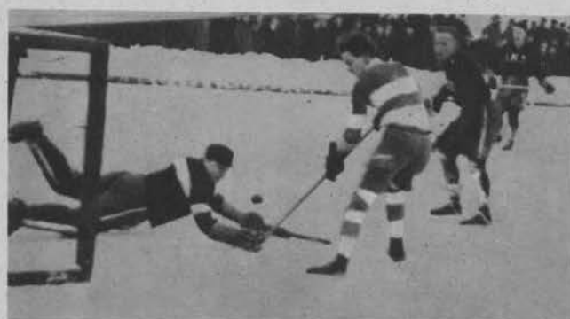
Kto wcześniej zdąży.