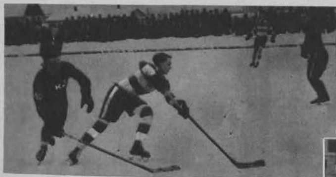
Walka o krążek.

Na prawo: Basen Ł. K. S. u służy zimą z powodzeniem jako tor łyżwiarski.