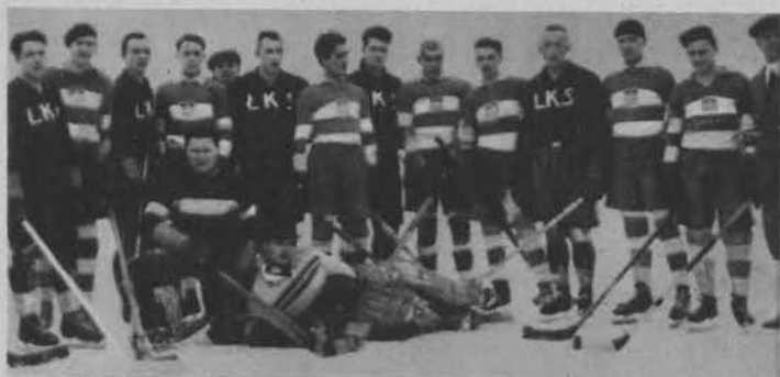
Zespół AZS i LKS przed meczem.