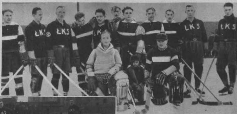
Drużyny gości i gospodarzy przed meczem.