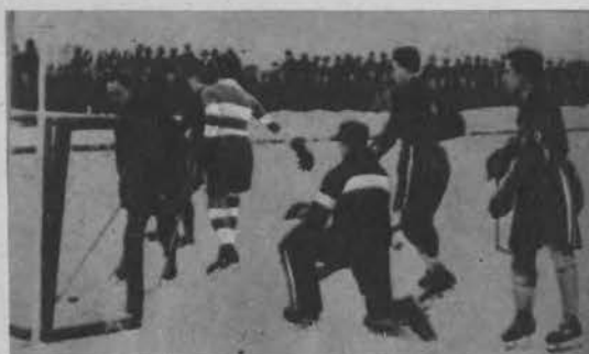
Wygarnianie krążka po bramce.