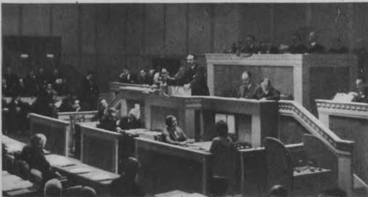
Italski delegat na Konferencję rozbrojeniową w Genewie min. Grandi przy pulcie mówcy.