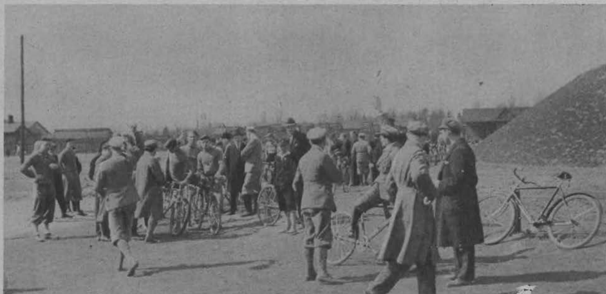
Honorowy start na boisku Ł. K. S. do biegu kolarskiego na przełaj.