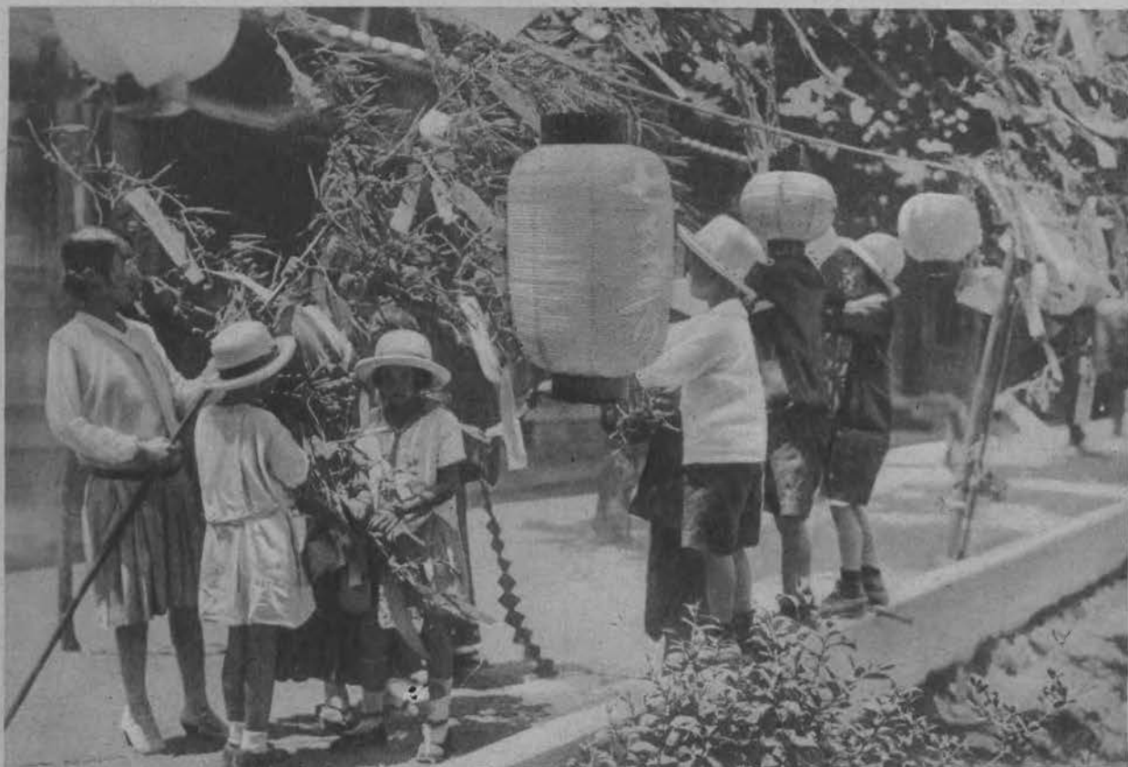
W tym roku dzień 8 maja przeznaczony jest czci matki. Obrazek przedstawia dzieci japońskie ozdabiające park lampionami z odpowiednimi napisami na „Dzień Matki“.