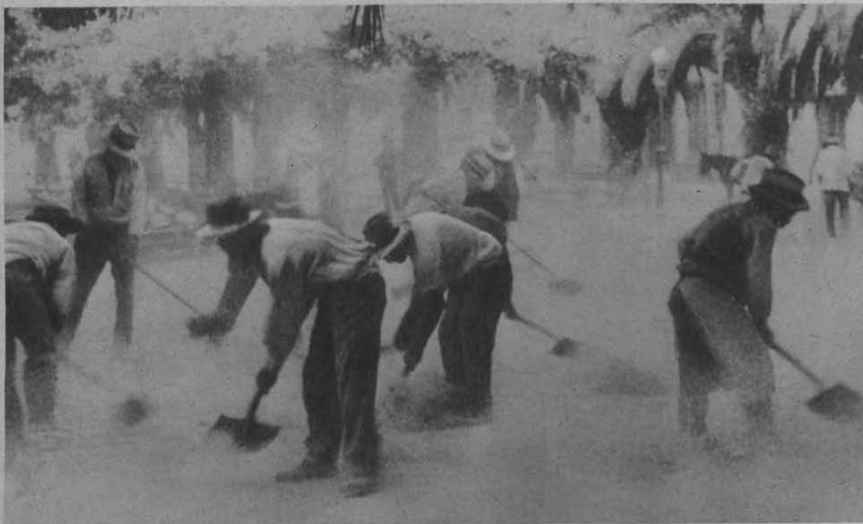
Z terenów nawiedzonych katastrofą wybuchu wulkanów. Robotnicy czyszczą ulice miasta Curico (Czile) z białego popiołu wszystko pokrywającego.