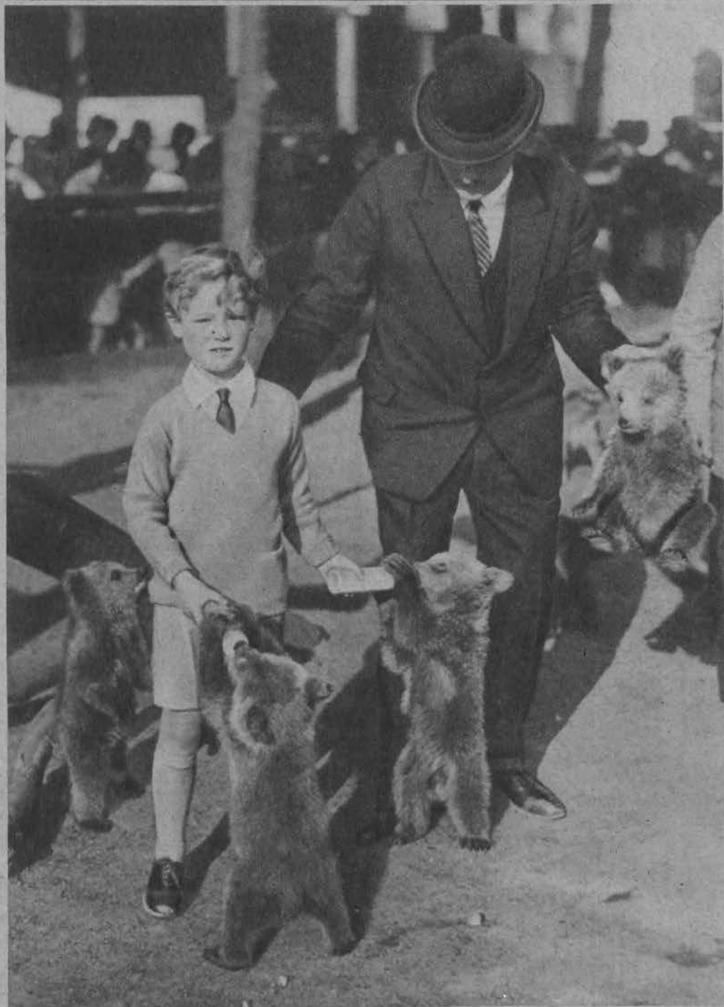
Chłopczyk karmiący mlekiem malutkie niedźwiadki w dniu pokazu dzieciom zwierząt ogrodu zoologicznego.