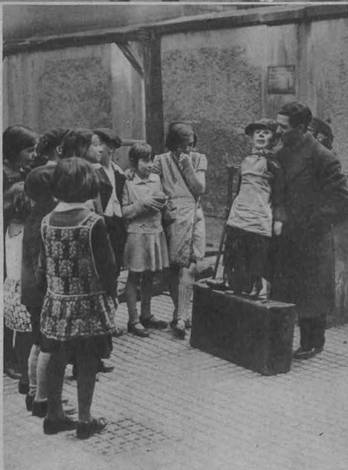
Bezrobotny artysta brzuchomówca popisujący się na podwórzach Berlina.