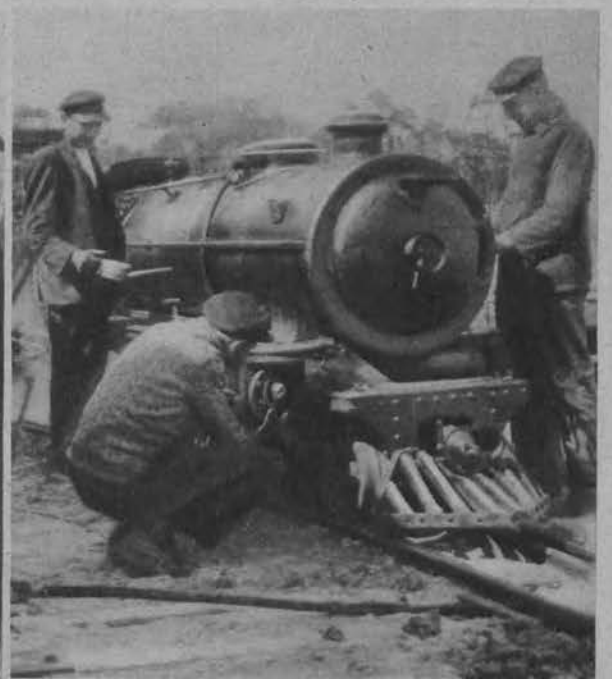
Lokomotywa lilipuciego pociągu z wystawy wiosennej w Berlinie, otwartej pod tytułem „Słońce, powietrze i dom“.

Na lewo: W Berlinie przeprowadzono eksperyment z jasnowidzem Hanussenem którego użyto jako reklamy jednego z teatrzyków. Mianowicie Hanussenowi polecono odnaleźć lalkę schowaną w Berlinie przez medjum, co mu się zresztą całkiem udało.