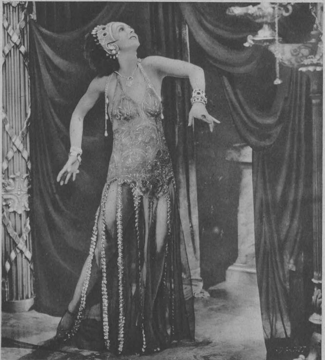
Tancerka Joyzelle Jaynor, występująca w filmach Paramountu.