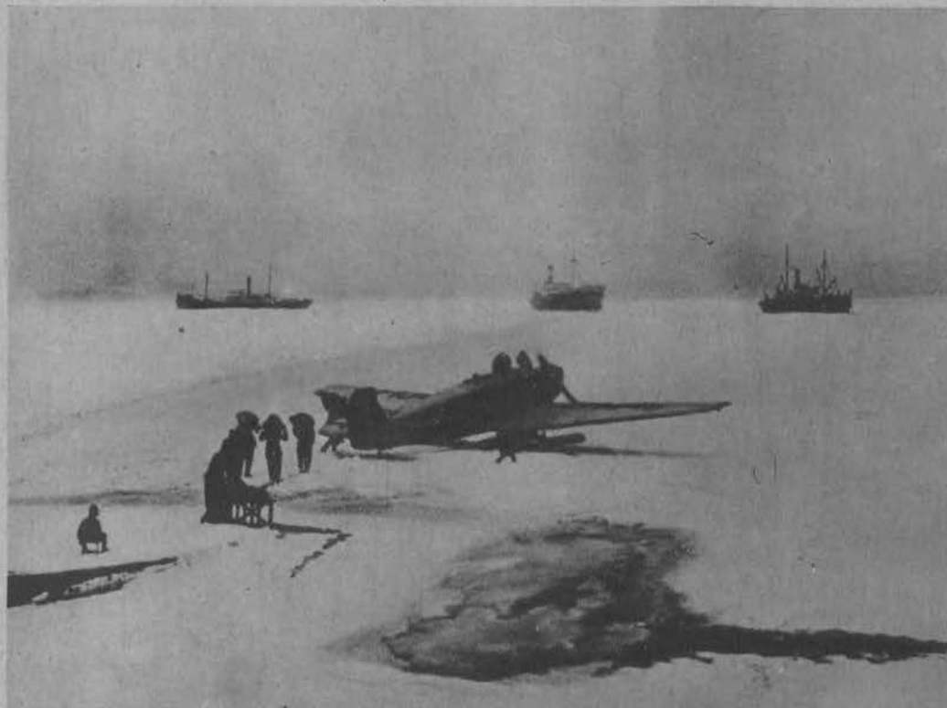
Na lewo: Samoloty przywożą żywność dla statków, które utknęły w łodziach Bałtyku.