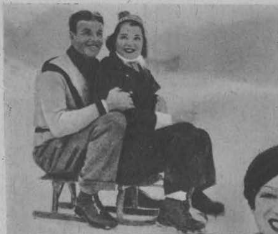
Klara Bow z swym mężem Rex Bell'em.

Na prawo: Zuzanna Lenglen, b. mistrzyni świata w tenisie i Sonia Henie, mistrzyni świata w jeździe sztucz- nej na łyżwach.