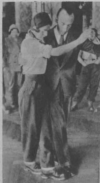
Na prawo: Po powrocie z nart godzinka tańca.