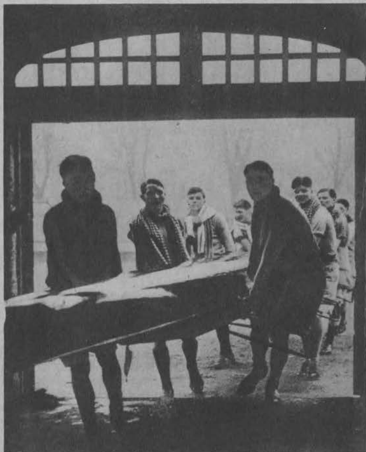
Drużyna „Oxfordu“ rozpoczęła już trening przed tradycyjnym wyścigiem wiosłarskim z drużyną uniwersytetu w Cambridge.