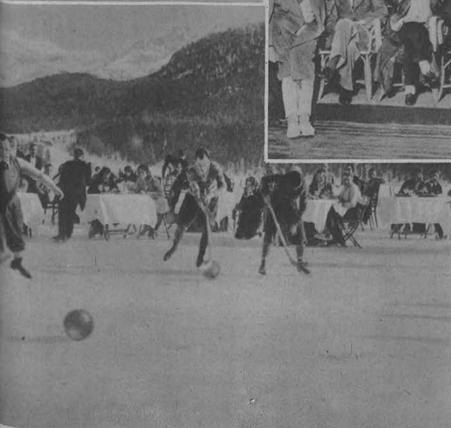
Na lewo: Gymkhana na lodzie.