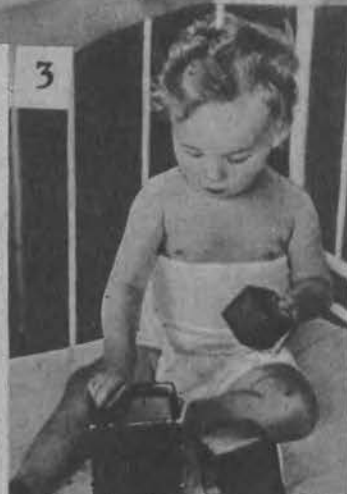
3. Dziecko które poraz pierwszy ogląda swe odbicie w lustrze, szuka go pod spodem, natomiast dobrze się już orientuje w wielkości i formach swych klocków.