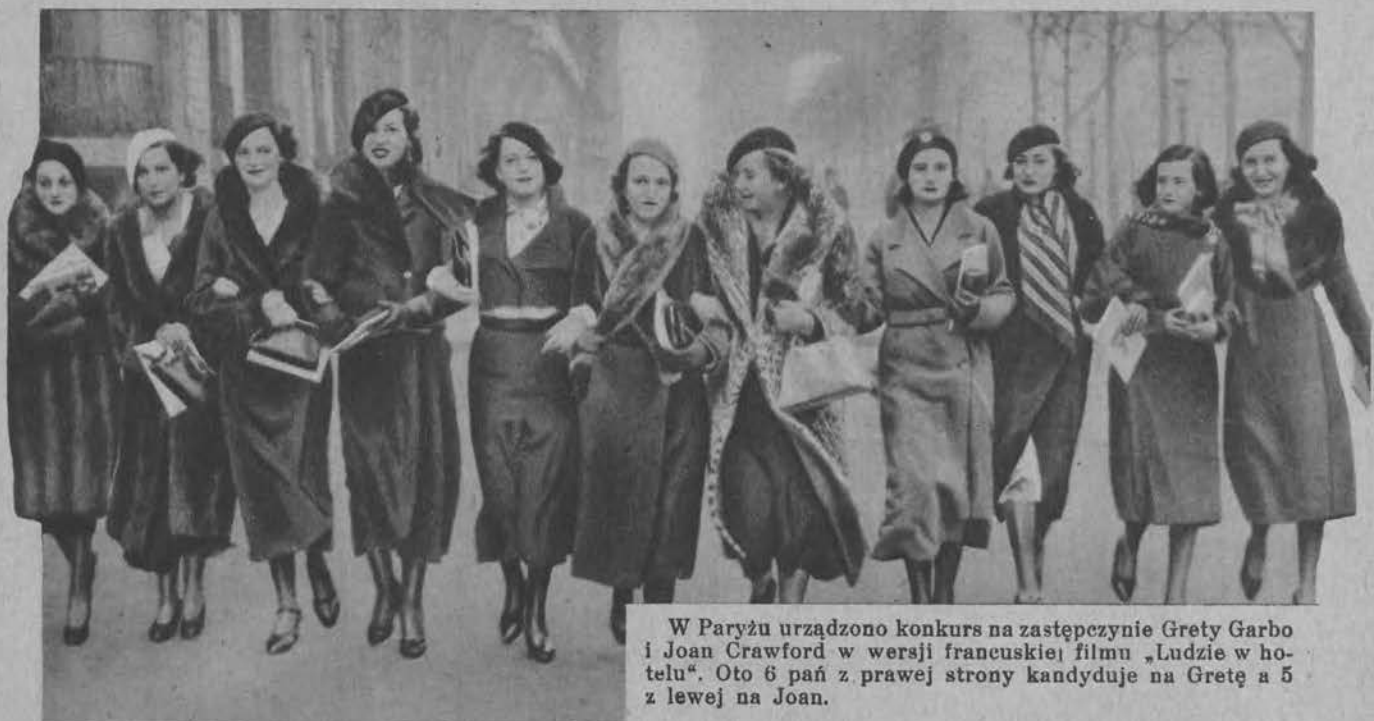
W Paryżu urządzono konkurs na zastępczynię Greta Garbo i Joan Crawford w wersji francuskiej filmu „Ludzie w hotelu“. Oto 6 pań z prawej strony kandyduje na Gretę a 5 z lewej na Joan.