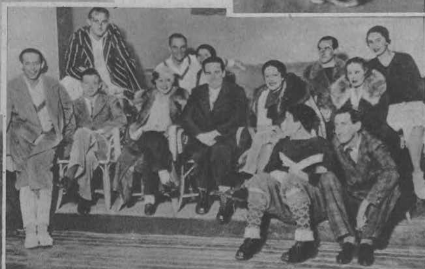
Na turnieju tenisowym w hotelu „Palace”. Od lewej: Borotra, Mayer, Sonia Henie, Harold Lloyd, Zuzanna Lenglen.