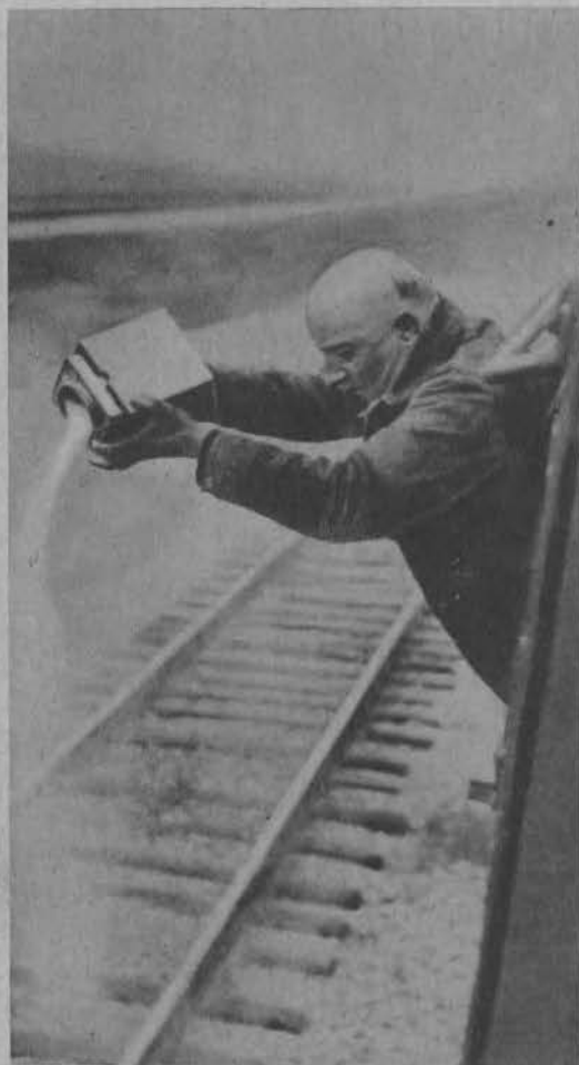
Pewien zmarły w Chicago maszynista kolejowy wyraził przed śmiercią życzenie by jego zwłoki spalić a popioły rozsypać na trasie kolejowej, którą jeździł 25 lat.