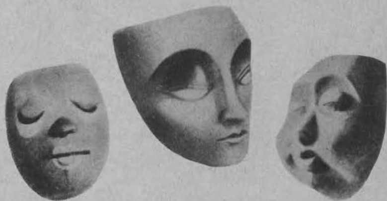
Maski karnawałowe. Od lewej: Zadowolony, Wampir, Żartowniś.