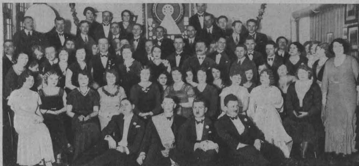
Bal z okazji rozdania nagród motocyklistom Łódzkiego Klubu Motocyklowego.