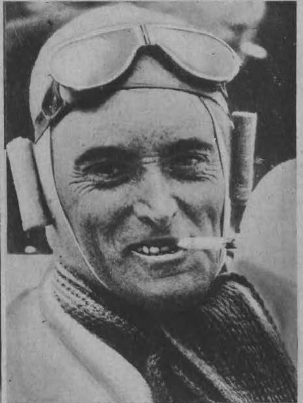
Campbell ustanawia nowy rekord światowy na samochodzie 440 km. na godzinę.

Na lewo: Nowa „męska” moda u kobiet, przyjmuje się w Paryżu.