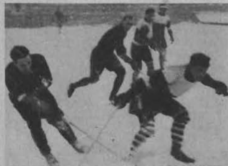
Walka o krążek.