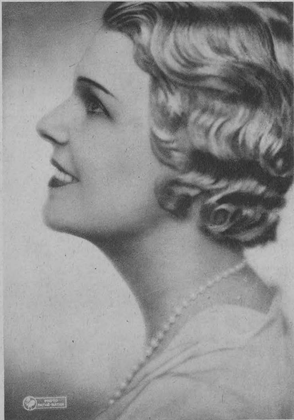
Elvire Popesco artystka rumuńska, występująca w filmach francuskich.