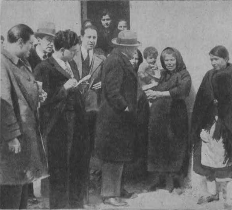
Hiszpańska komisja parlamentarna przesłuchuje rodziny 20-stu zamordowanych syndykalistów.

-Dni ma cudowną corę! -Tak, bo od urodzenia pielegnowano mnie HYDEEN BÉBÉ SZOFHANA!