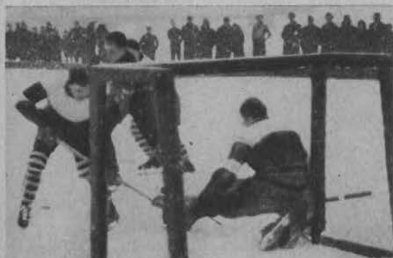
Groźny moment pod bramką.