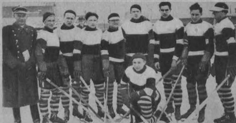
Na lewo: Drużyna Ł. K. S.