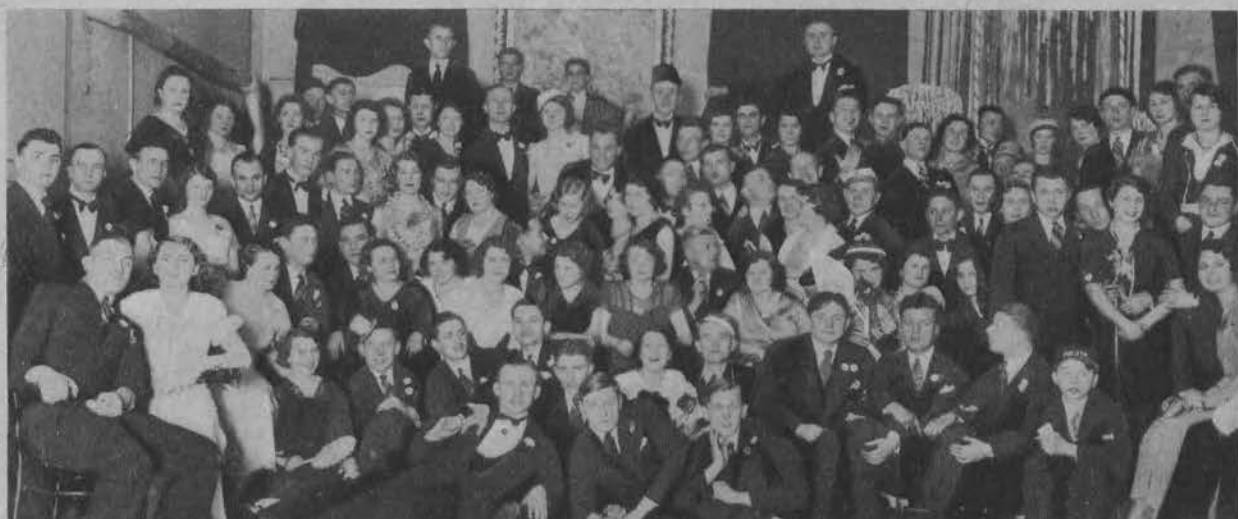
Bal zorganizowany przez kolarzy Łódzkiego Klubu Sportowego.