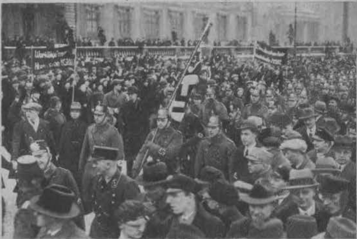
W pochodzie demonstracyjnym hitlerowców, bierze oficjalny udział polleja.