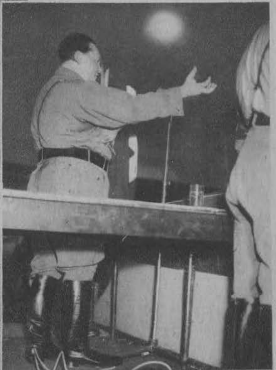
Minister Göring przemawia.