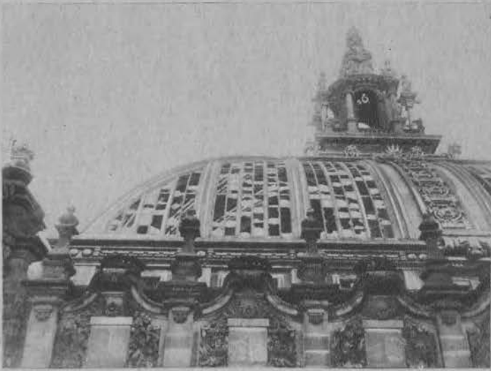
Zniszczona przez pożar kopuła Reichstagu.