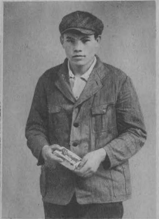
Rzekomy sprawca pożaru komuniasta holenderski Marius van der Luebbe.