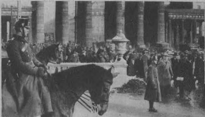
Na lewo: Tłumy cisną się przed budynkiem Reichstagu.