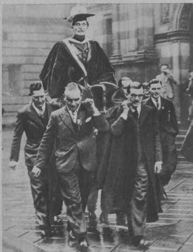
Nowy rektor uniwersytetu w Edynburgu, udaje się na barkach magistrów i uczniów na objęcie władzy.

Na prawo: Niebezpieczny transport rannego turysty wśród ścian alpejskich.