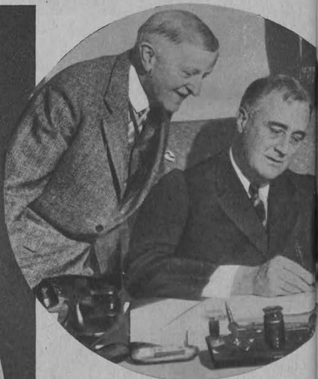
Prez. Roosevelt w obecności min. skarbu podpisuje rozporządzenie oddające mu dyktando w sprawach finansowych.