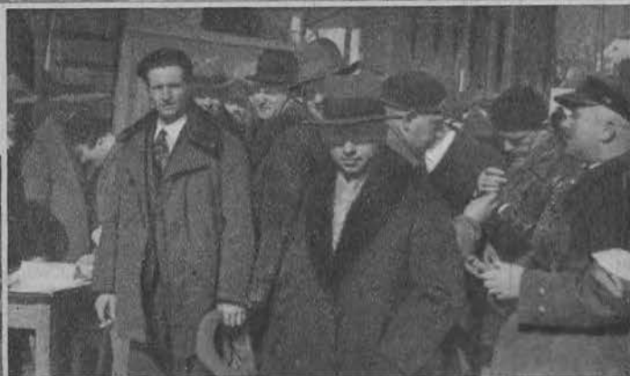
Na punkcie kontrolnym.