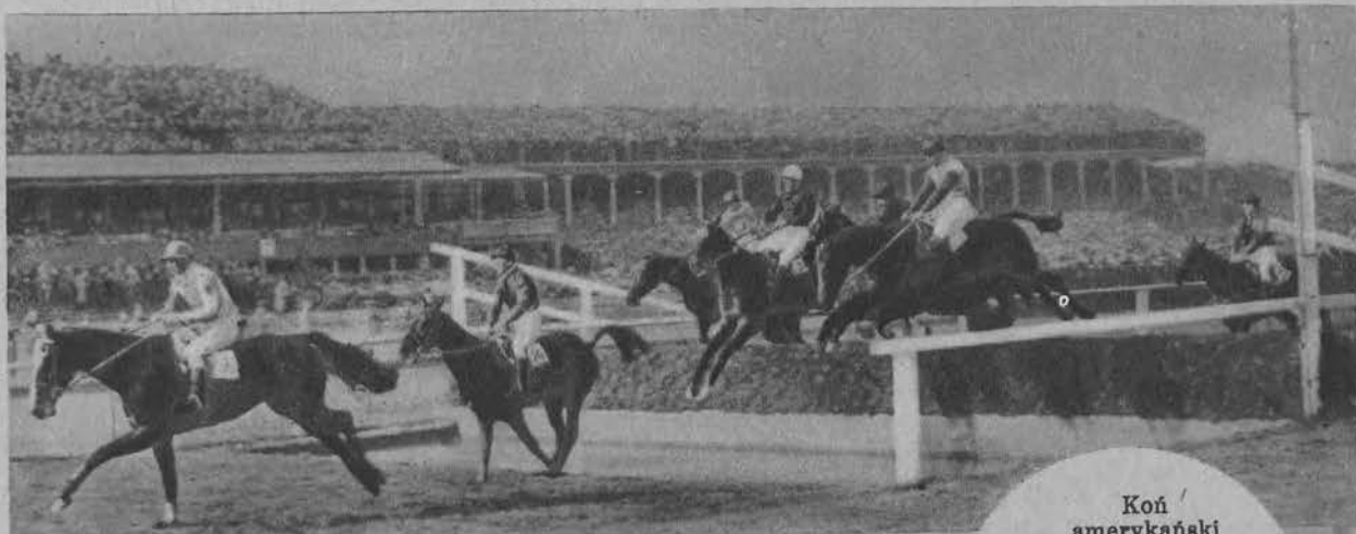
Koń amerykański „Kellsboro Jack“ zwycięża w słynnym angielskim biegu z prze- szkodami „Grand Na- tional Steeplechase“ pod Liverpoolem.