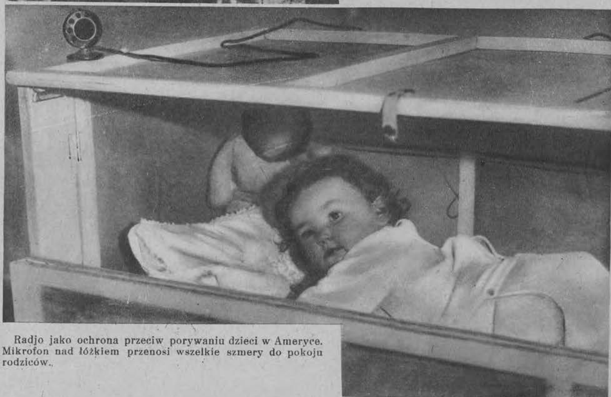
Radjo jako ochrona przeciw porywaniu dzieci w Ameryce. Mikrofon nad łóżkiem przenosi wszelkie szmery do pokoju rodziców.

Na lewo: Słynny pułk. ang. Lawrence, który zorganizował w czasie wojny bunt Arabów, wystąpił obecnie z armji angielskiej.