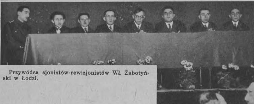
Przywódcą sjonistów-rewizjonistów Wł. Żabotyński w Łodzi.