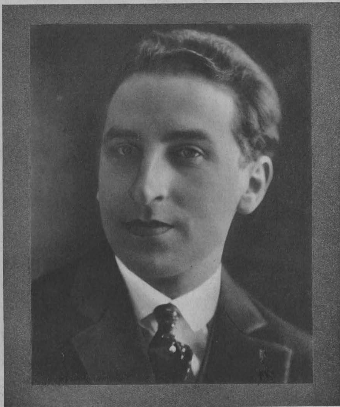
KAROL SZRETER przedwcześnie zmarły pianista-wirtuoz.