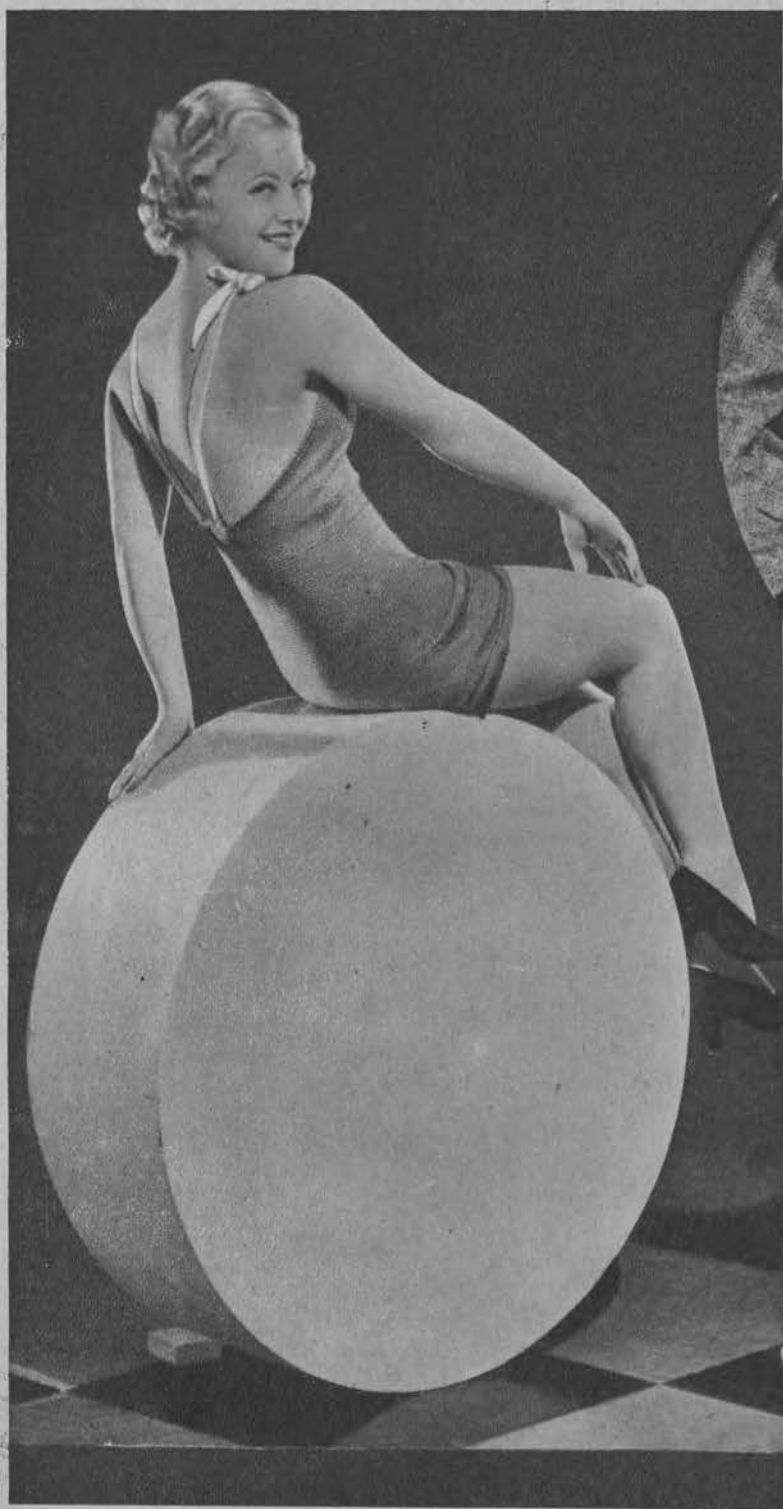
Uśmiech Mary Carlisle.

Na prawo: B. burmistrz Gdańska, obecnie burmistrz Berlina dr. Sahm, udaje się na otwarcie nowowybranej rady miejskiej.