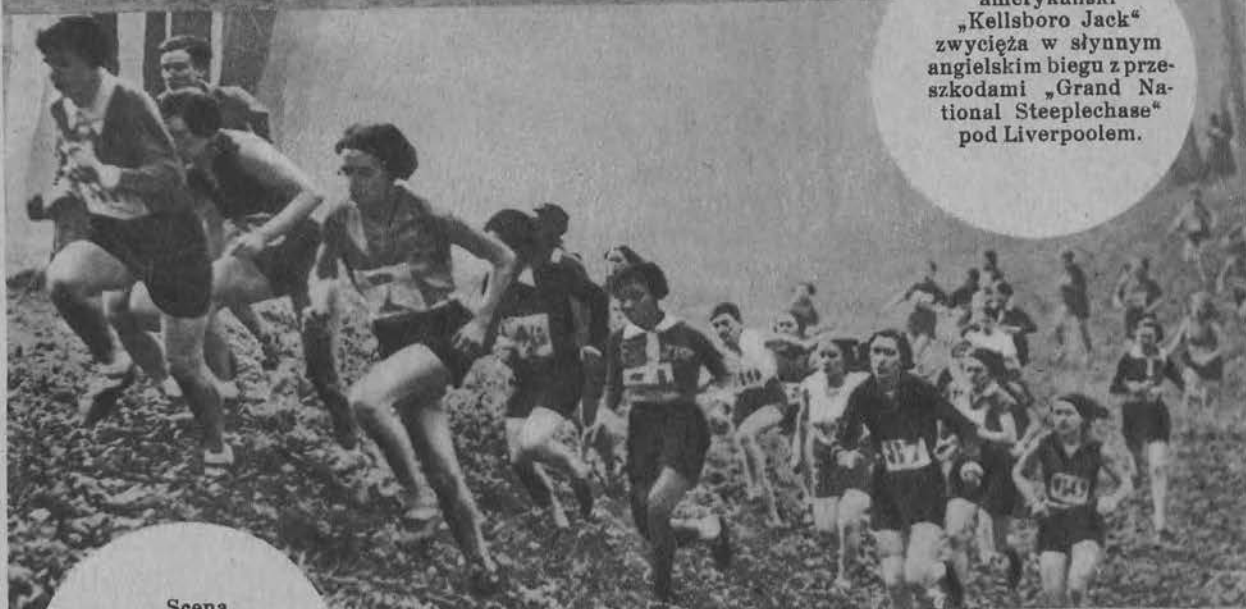
Scena z biegu na prze- łaj dla kobiet w St. Claud pod Pary- żem.