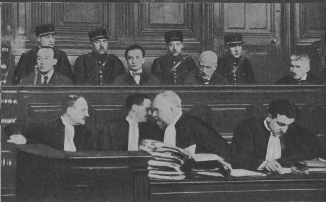
Scena z sensacyjnego procesu w Paryżu przeciw urzędnikom poczty lotniczej.