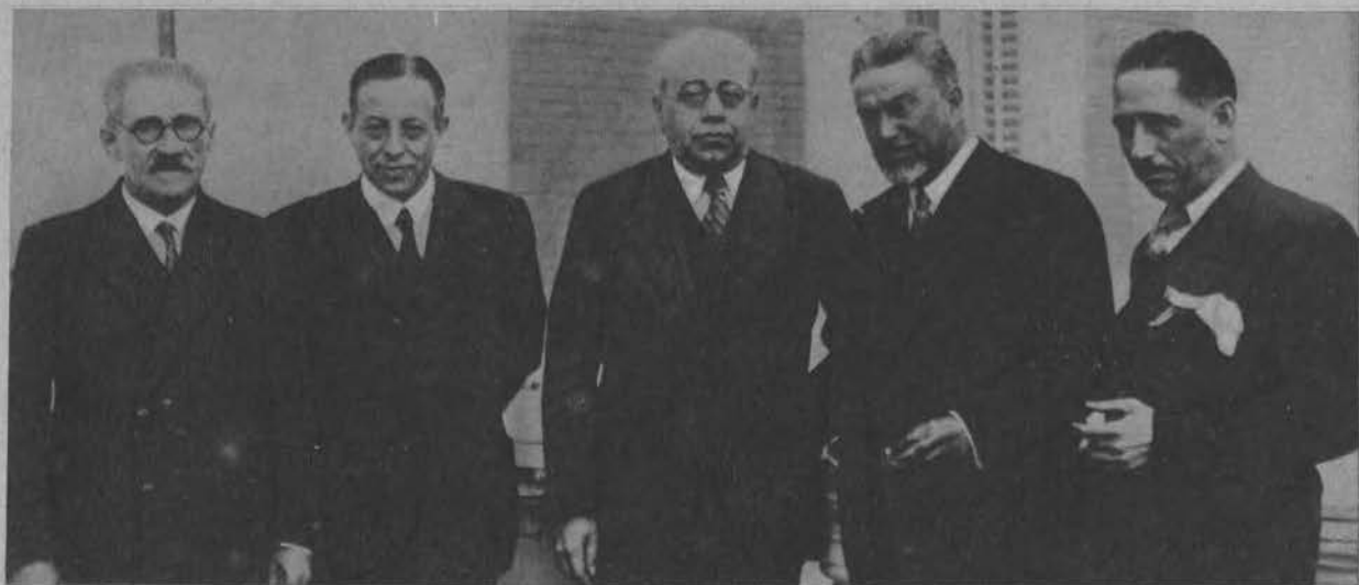
Nowy gabinet hiszpański z premierem Azana pośrodku.