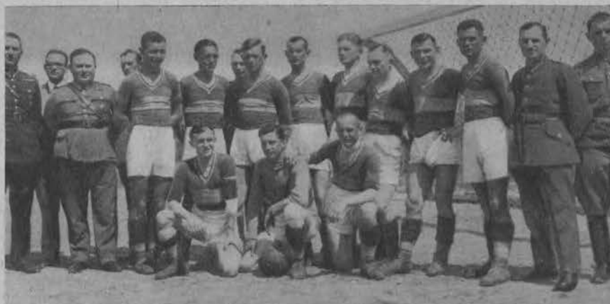
Drużyna piłkarska WKSu, pewny faworyt do mistrzostwa w A klasie. Ł. O. Z. P. N.