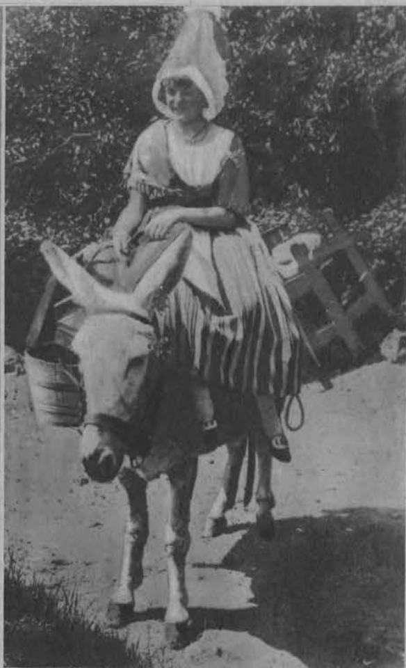
Piękność normandzka w drodze na targ.

Na lewo: Kąpiel słoneczna po kąpieli. Zdjęcie z francuskiego basenu w Le Touquet.