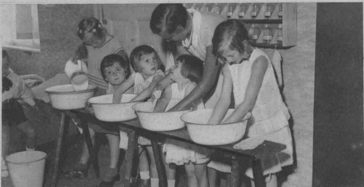
W Berlinie otworzono hotel dla samotnie podróżujących dzieci.