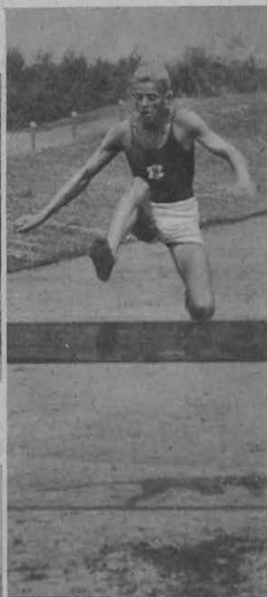
Polak (ŁKS) zwycięzca biegu z przeszkodami (steple chase).