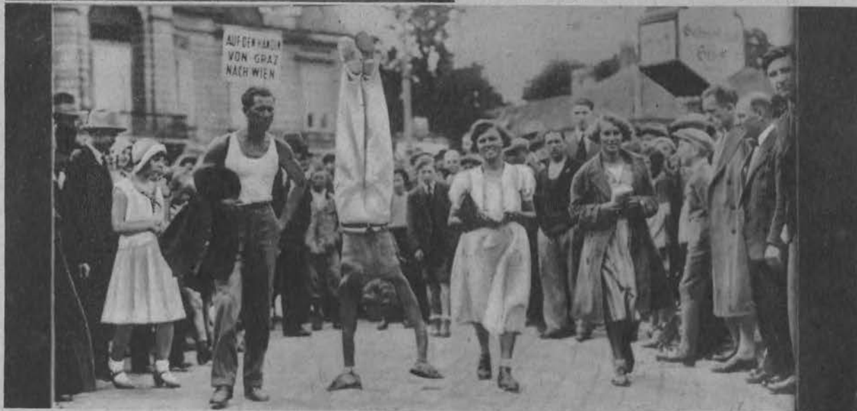
Pewien bezrobotny z Grazu przebył na rękach w 6 tygodni drogę do Wiednia.

Na lewo: Kąpiel słoneczna po kąpieli. Zdjęcie z francuskiego basenu w Le Touquet.