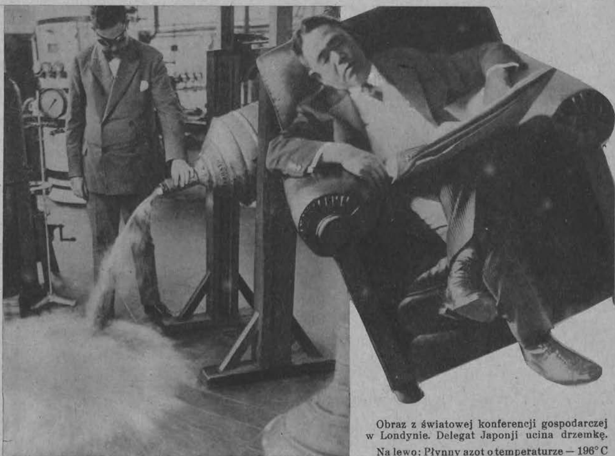
Obraz z światowej konferencji gospodarczej w Londynie. Delegat Japonji ucina drzemkę. Na lewo: Płynny azot o temperaturze -196^{\circ}\text{C}