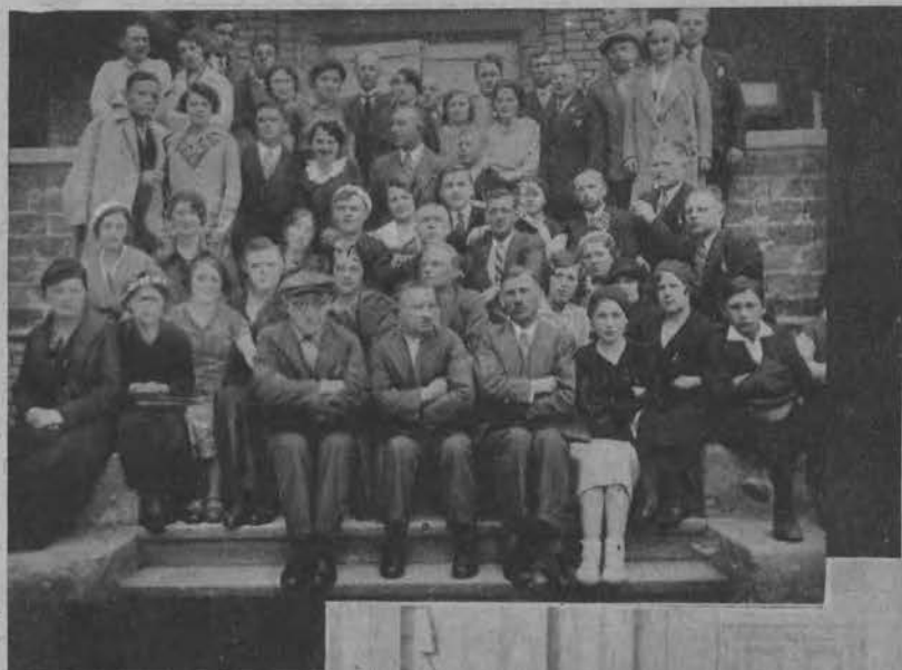
Robotnicy z Bałt nad morzem polskim. Wycieczka II Miejskiego Ogniska Oświatowego do Gdyni i Helu.