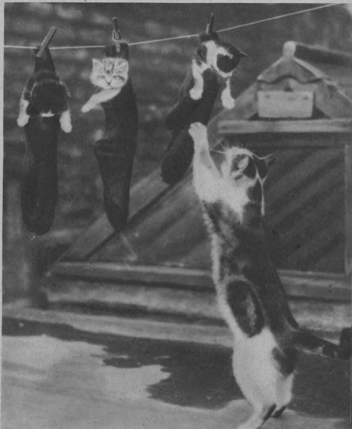
„Kocia-mama“ spogląda żałośnie ku swym młodym wywieszonym po kąpielach do suszenia.