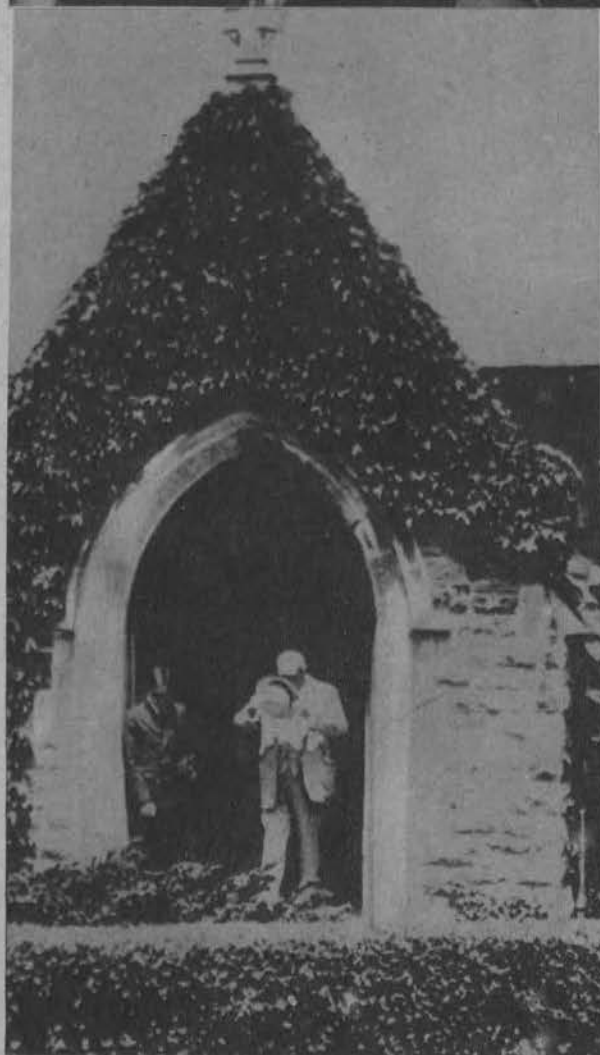
Miljarder John Pierpont Morgan przed udaniem się do sądu odwiedza zawsze kościół.

Na prawo: Na uniwersytecie bostońskiej jest zwyczaj, że wysokość pożyczek studenckich zależy od wagi staraiącego się.