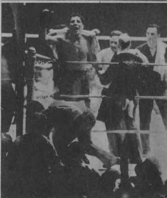
Bokser amerykański Baer wydaje okrzyk radości po pokonaniu Schmellinga.