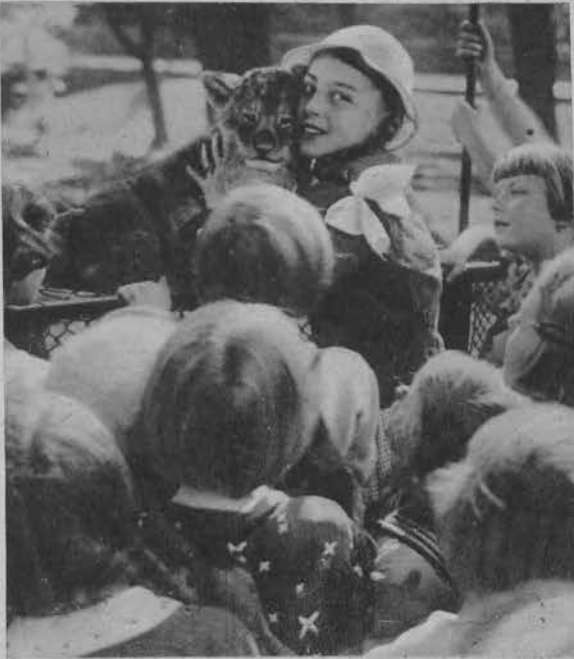
Młode lewki w zwierzyńcu chętnie bawią się z dziećmi.

Na lewo: Stylowa toaleta wieczorowa z purpurowego jedwabiu.