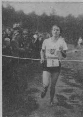
Kasperska (ŁKS) zwyciężczyni na 1000 m w biegu na przełaj dla kobiet.