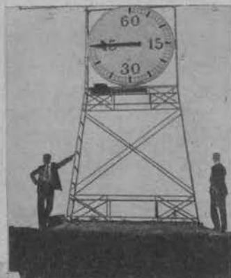
Decydującym momentem dla Cracovii, była ostatnia minuta, w której była strzelona jedyna bramka dnia i wygrana drużyny krakowskiej.