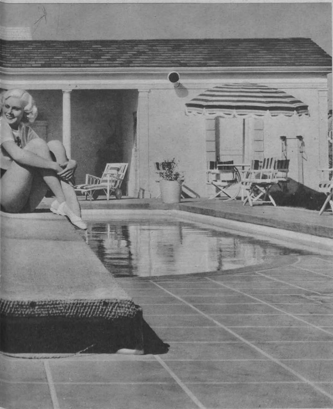
awych rolach wszystkie ujemne cechy współczesnej kobiety Stanów Zjednoczonych — na tle pływalni swej willi w Hollywood.