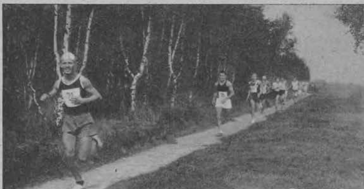
Trasa prowadziła przez las.