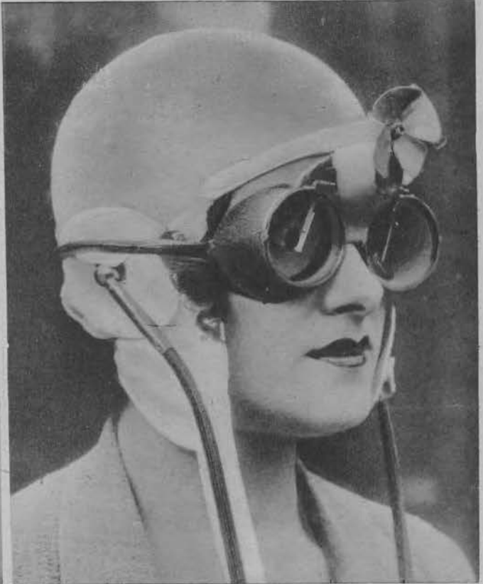
Okulary dla motocyklistów z ruchomymi wycieraczami. Poruszane są śmigłą, którą wprawia w ruch przeciwny prąd powietrza.

Na lewo: Stylowa toaleta wieczorowa z purpurowego jedwabiu.