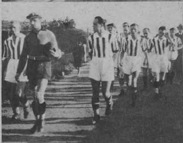
Na lewo: Cracovia rozegrała w ubiegłą niedzielę mecz z ŁKS-em w Łodzi.