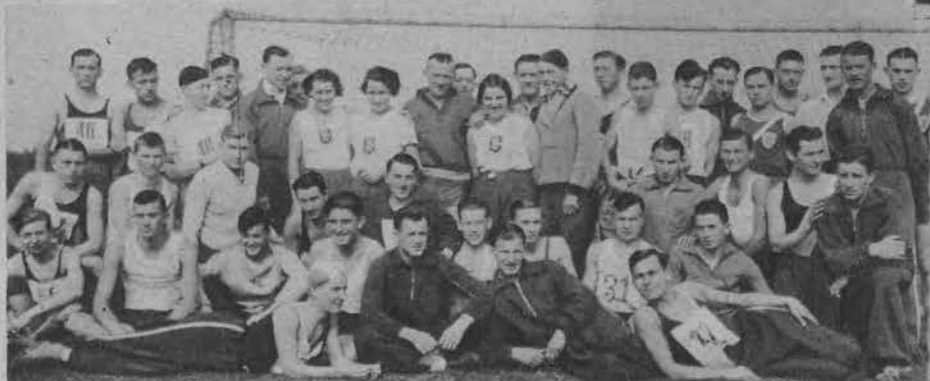
Na lewo: ŁKS zdobywa poraż drugi nagrodę nauczycieli WF w biegu na przełaj. Na zdjęciu zawodnicy wszystkich sekcji i kibice.