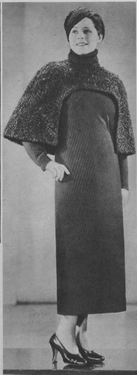
Zimowy płaszcz z pelerynką z czarnych karakółów.