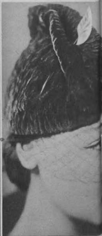
Na lewo: wieczorowa czarna z czerwonego aksamitu przybrana piórkami czerwonej i białej. Na prawo: kokarda przybrana piórem.