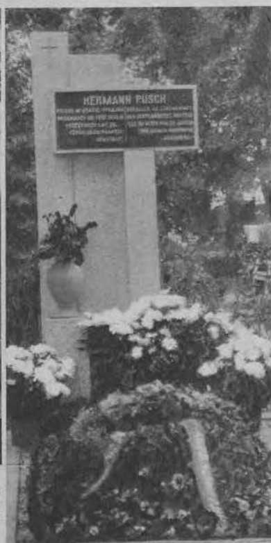
Pomniki na grobach ofiar zajęć w Pabjanicach podczas strejku włóknarzy w dn. 17 marca r. b, których uroczyste odsłonięcie odbyło się w ubiegłym tygodniu na cmentarzach pabjanickich.