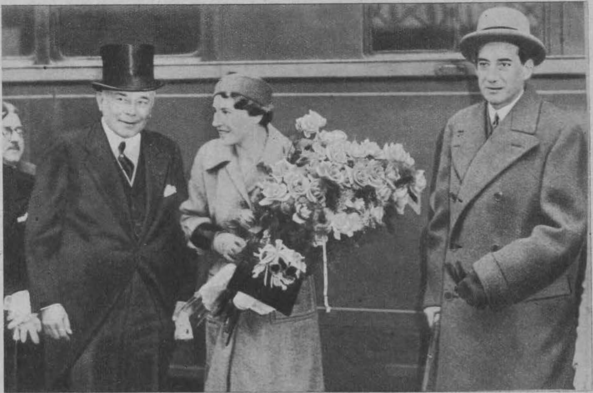
Ambasador Chłapowski oraz minister Beck (na prawo) ze swą małżonką na dworcu w Paryżu.