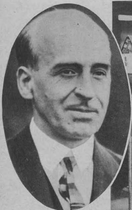
Irlandzki delegat do Ligi Narodów Lester, został mianowany wysokim komisarzem dla m. Gdańska.

Na prawo: Hitler przed mikrofonem radiowym.