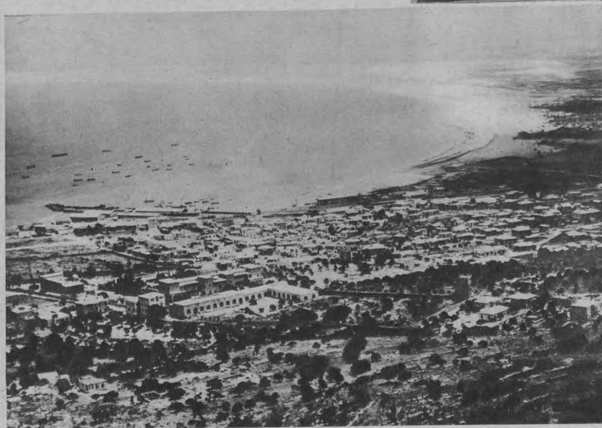
Masowe demonstracje Arabów w Palestynie przeciwko wzrastającemu osiedlaniu się żydów w Palestynie, objęły obecnie też port w Hajfie. Przyszło tam do krwawych starć z policją, podczas których padło 22 zabitych i ponad 100 osób zostało rannych.