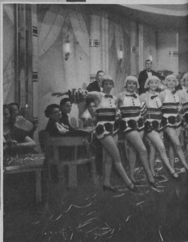
Ostatnie kreacje paryskie. Suknia wieczorowa z czerwonego jedwabiu z kokardą u boku w tym samym tonie.