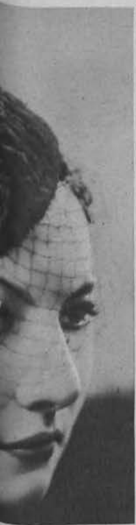
czka z brą- na jasnym wełny rów-