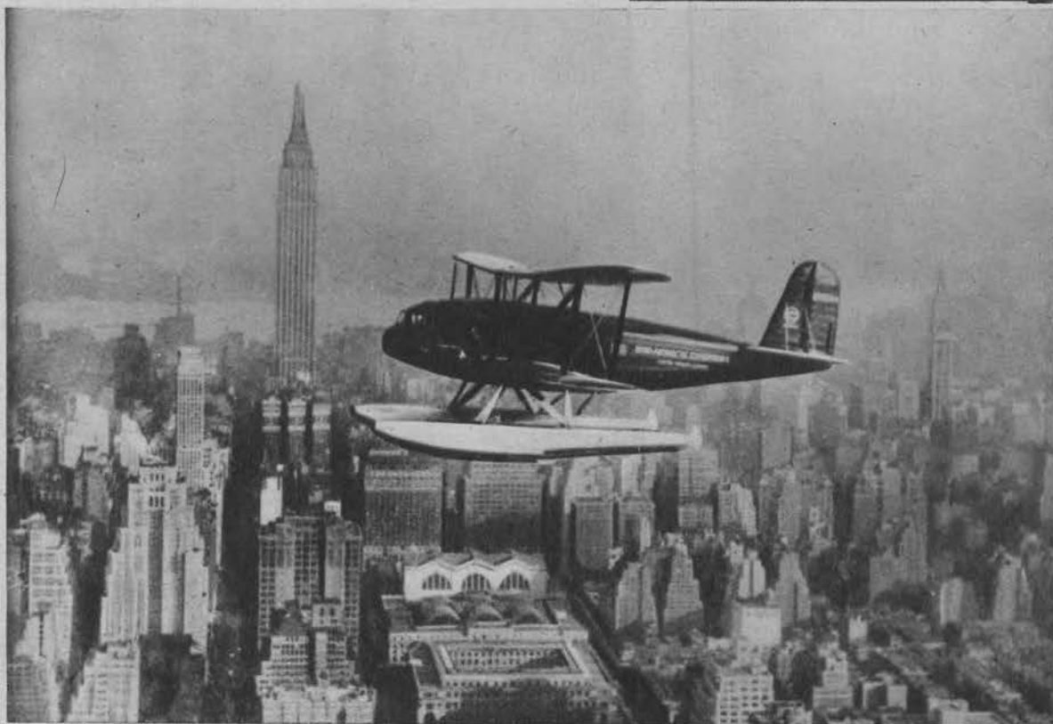
Próbny lot hydroplanu Byrda nad N. Jorkiem, przed podróżą na biegun południowy.