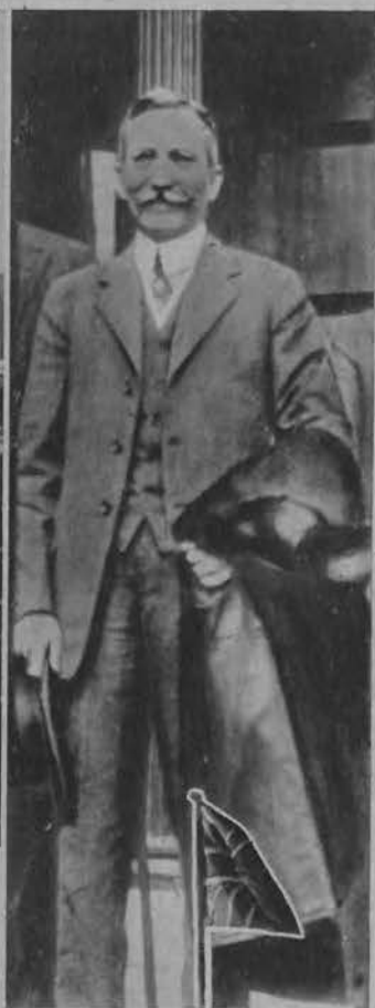
Na prawo: Czwarty z rzędu od wybuchu rewolucji, prezydent Kuby Carlos Hevia.