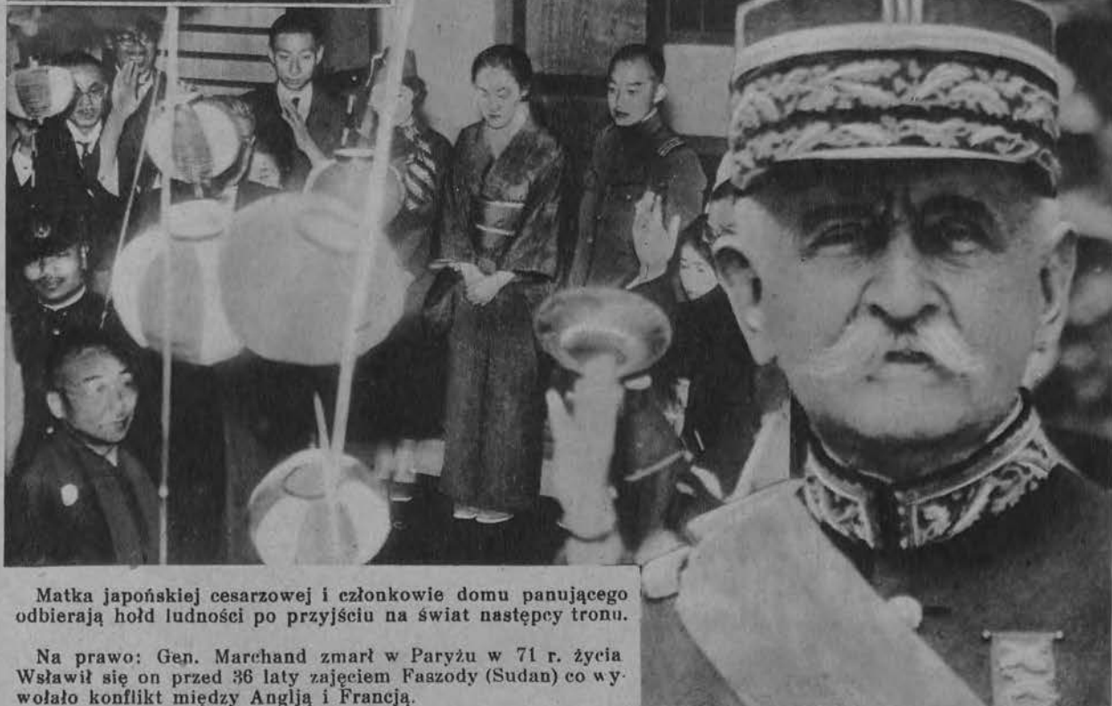
Matka japońskiej cesarzowej i członkowie domu panującego odbierają hołd ludności po przyjeździe na świat następcy tronu.

Na lewo: Postać Mickiewicza z pomnika wykonywanego dla Wilna przez Henryka Kunę.