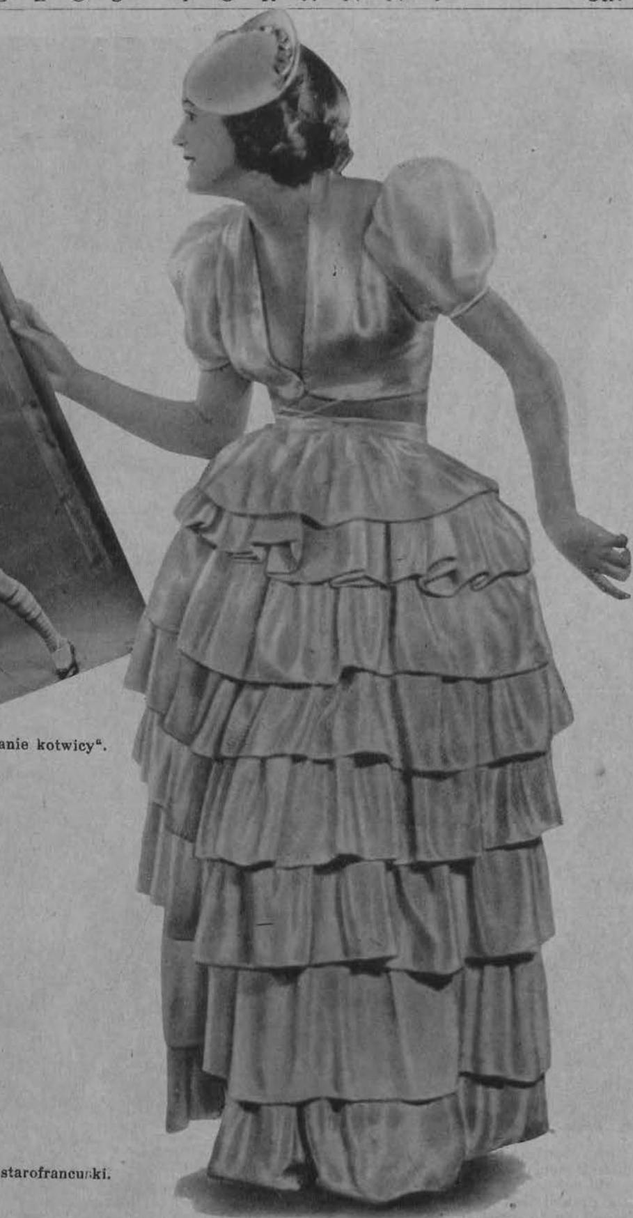
Na prawo: Kostjum starofrancuski.