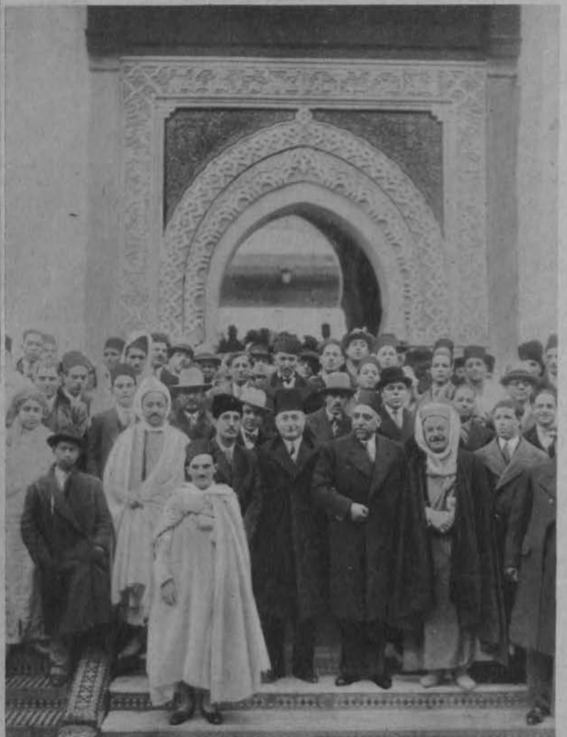
Muzułmanie zamieszkali w Paryżu obchodzą święto „Ait-el-Seghir”.