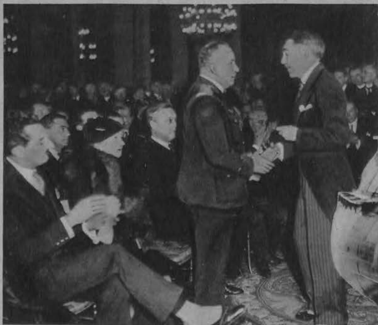
Paryska Rada Miejska przyjmuje uczestników afrykańskiego raidu lotniczego.