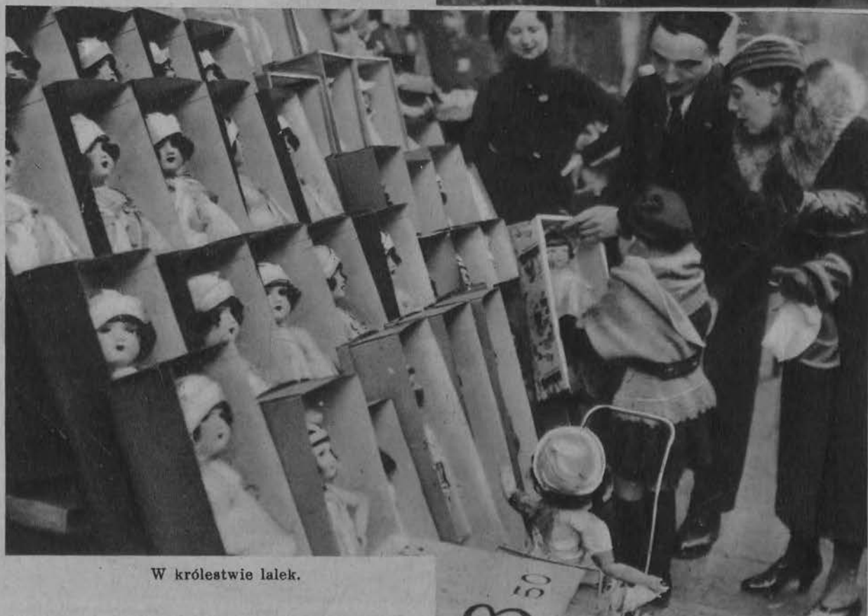
W królestwie lalek.