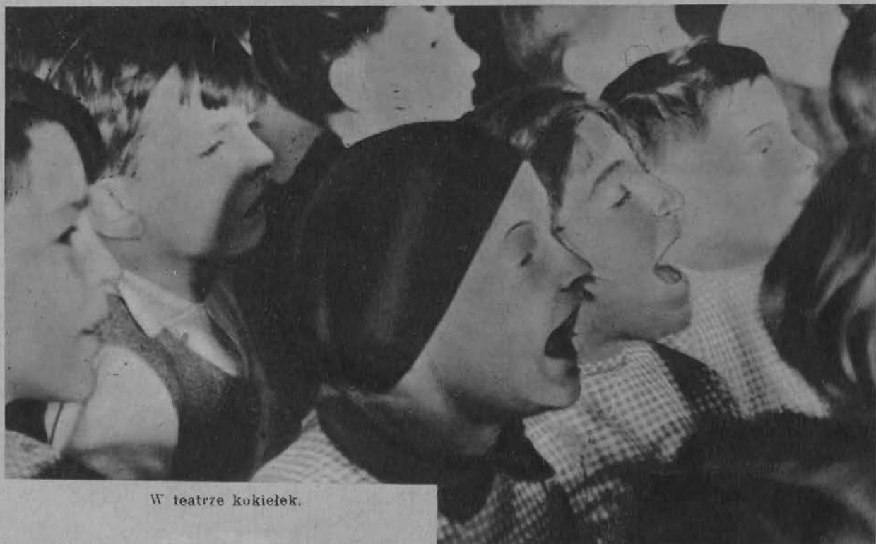
W teatrze kukiełek.