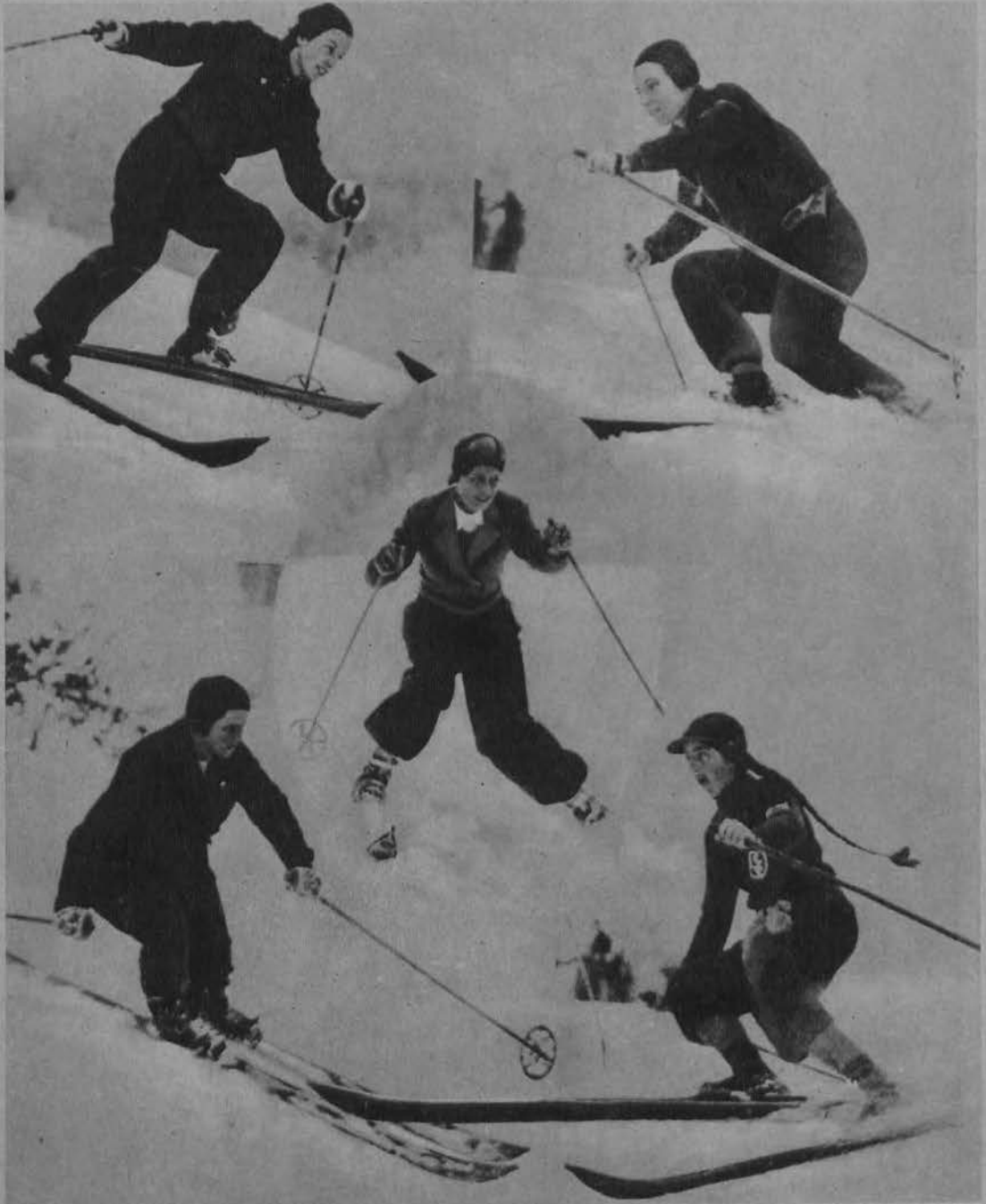
Rozkosze zimowego sportu.