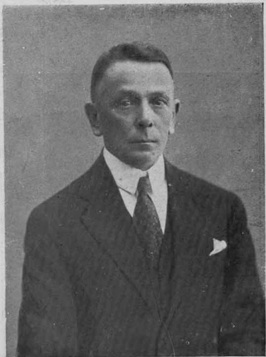
LEON SUPIŃSKI Pierwszy Prezes Sądu Najwyższego