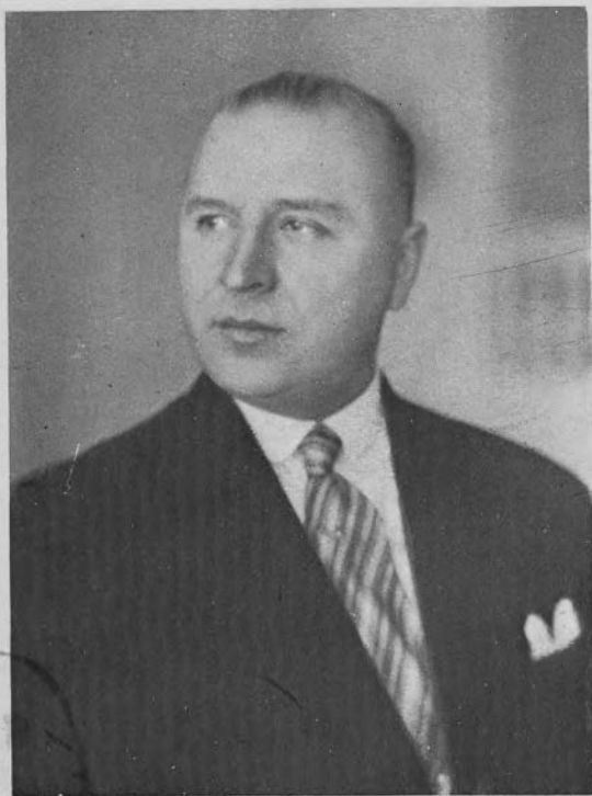
STANISŁAW CAR Minister Sprawiedliwości