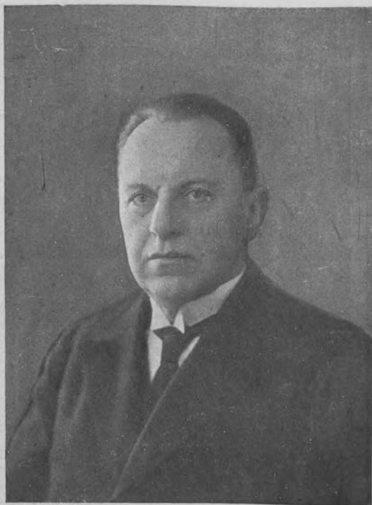
JÓZEF PROKOPOWICZ Pierwszy Prokurator Sądu Najwyższego