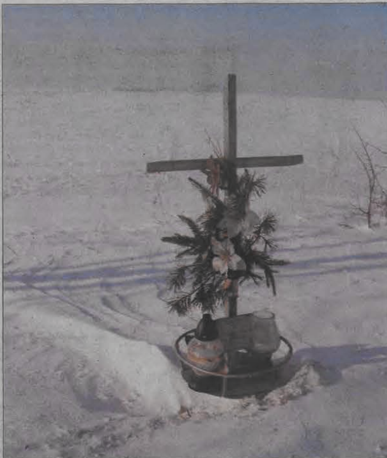
W miejscu wypadku pod Goleńskiem, w którym w marcu ubiegłego roku zginęły cztery osoby stoi krzyż, a przy nim kwiaty i znicze.

Zdaniem policji najbardziej niepokojący jest wzrost 700%-owy liczby ofiar w wypadkach na terenie gminy Chaśno. Do wypadków tych doszło na drodze 584 prowadzącej z Łowicza do Kiernozia.