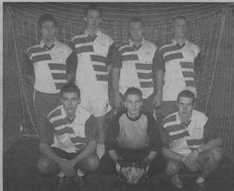
Nowym liderem IV ligi została ekipa WBC Łowicz.