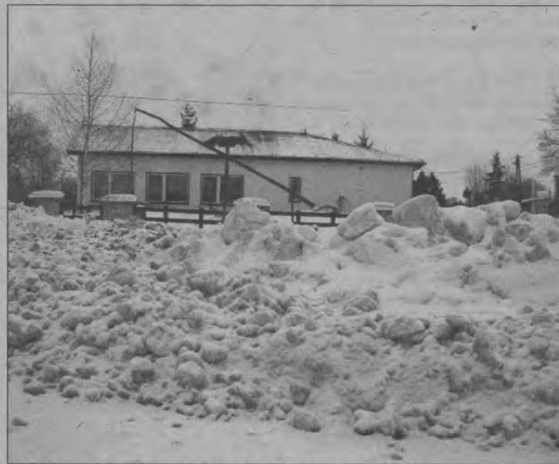
Na parkingu w pobliżu przedszkola leży zgarnięty śnieg.