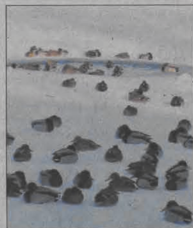
Kaczki krzyżówki przesiadują na lodzie oczekując na rzucany z mostu chleb, kilka metrów za nimi rzukuty przez myśliwych „basen”.

Niejedna osoba, która dokarmia kaczki z mostu na rzece Bzurze przy ulicy Mostowej zastanawiała się, jak to jest możliwe, że mimo niskich temperatur, kaczki cały mają w lodzie oczko wodne, w którym mogą pływać. Czy ono nie zamarza? - pytali Nowego Łowiczana.