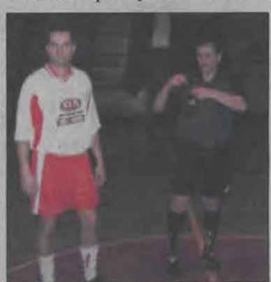
Kia Motors na razie zajmuje ostatnie miejsce w grupie mistrzowskiej.