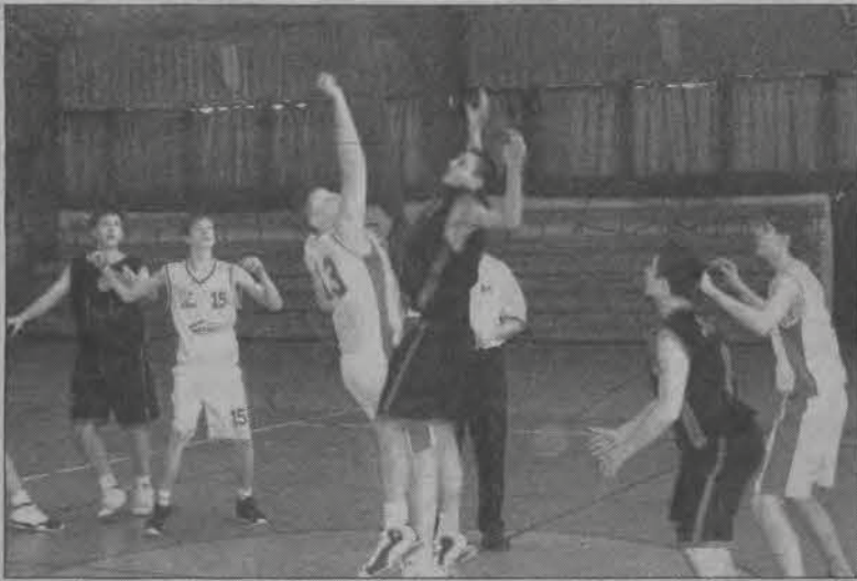
Rywalizacja z rok starszymi rywalami od początku skazana była na porażkę.

Podopieczni trenera Zbigniewa Łazińskiego zagrali świetnie w pierwszej kwarcie. Rywale wyszli na plac drugą piątką i po czterech minutach przegrywali 0:10. Na parkiecie pojawili się szybko podstawowi gracze, ale łowiczanie radzili sobie dobrze. Tak było do 13. minuty, kiedy to jeszcze Księżak wygrał 22:21. W 14. minucie kontuzja palca wykluczyła z gry Macieja Pie-