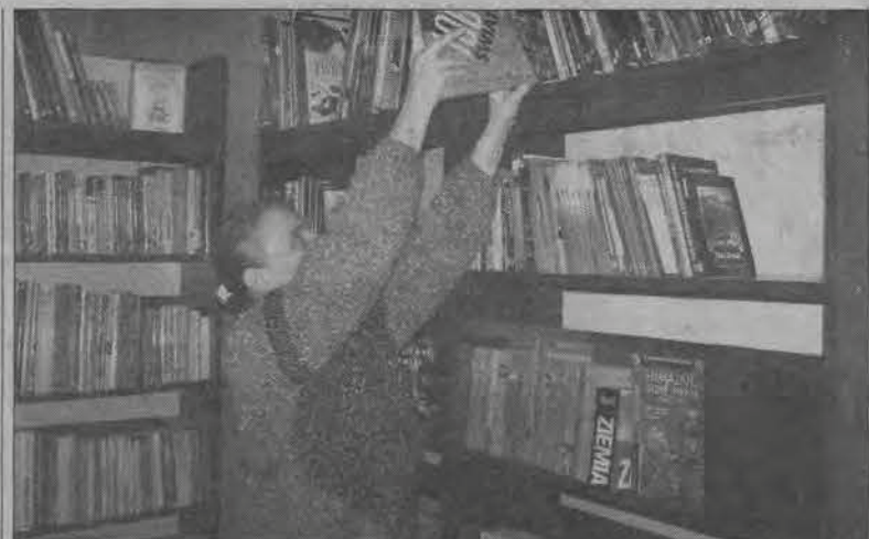
Nowych książek przybywa w księgarni na Starym Rynku z dnia na dzień.

W historii łowickiego więzienia zdarzały się podobne sytuacje, np. nie powrócenie z przepustek. Było ich zwykle kilka w ciągu roku. Więźniowie, którzy nie wracali z przepustek, zwykle sami, czasami po kilku dniach, skrzeszeni, postanawiali jednak wrócić. Czy tak będzie również w przypadku Roberta K.? - W takich sytuacjach jest zwykle tak, że gdzieś go namierzy policja. Wpadnie... - usłyszeliśmy w więzieniu. (mak)