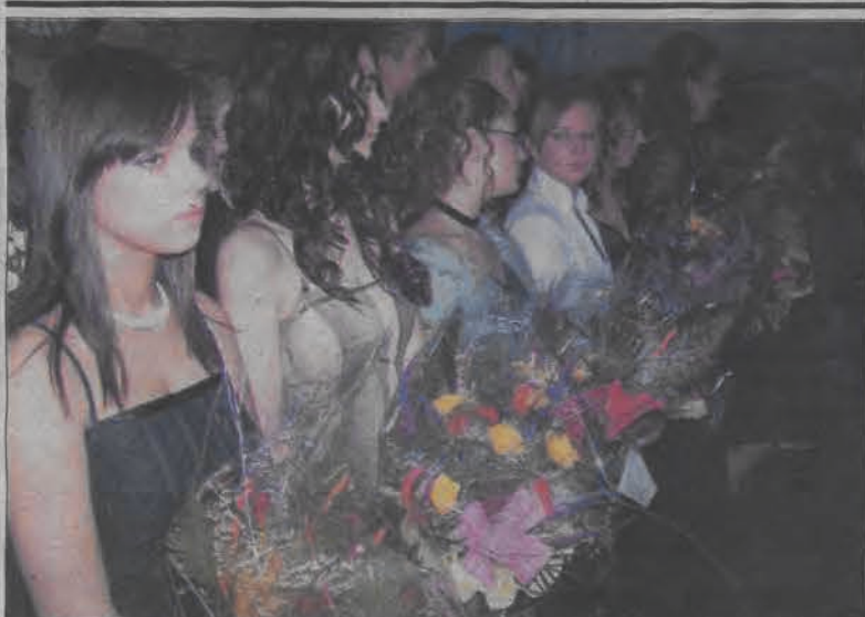
Na balu klas trzecich w Gimnazjum nr 2 dziewczęta zachwycały elegancją. Na zdjęciu na chwilę przed wręczeniem kwiatów nauczycielom.

Prace wykonuje Przedsiębiorstwo Produkcyjno-Usługowe „HEGOR” z Sochaczewa. Koszt inwestycji - 853.424,52 złotych brutto. Koszt ten dotyczy jednak całej inwestycji, a drugą jej częścią jest rozbudowa szkoły. Kiedy skończą się roboty na dachu, nastąpi rozbudowa zaplecza kuchennego oraz rozbudowa części dydaktycznej. Szkoła zyska między innymi o wiele większą świetlicę, na której w razie potrzeby prowadzić można będzie nawet zajęcia wf. (wcz)