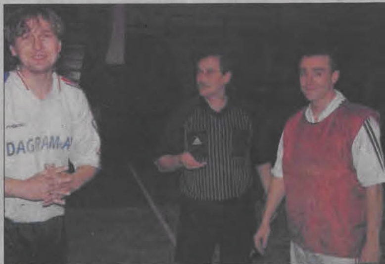
W meczu na szczycie Pędzące Imadła okazały się lepsze od Dagramu-AT.

Tak pogmatwanego kalendarza nie mieliśmy nigdy w historii I Łowickiej Ligi Piłki Nożnej Pięciosobowej! Niemal każda kolejka odbywa się na raty - mecze są przekładane albo rozgrywane awansem. Ale tak już