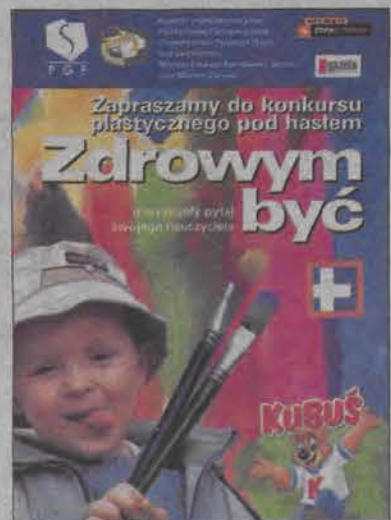
Plakat konkursu „Zdrowym być”.

Cel konkursu to propagowanie właściwych postaw zdrowotnych wśród dzieci już od najmłodszych lat. Uczniowie mają przygotowywać prace plastyczne, w których zaprezentują hasło konkursu - „Zdrowym być”. Spośród wszystkich przygotowanych prac grono pedagogiczne każdej ze szkół wybiera jedną i przesyła ją na wskazany adres (Tauber Promotion, ul. Gombowicza 15, 01-682 Warszawa). Termin nadesłania prac mija w piątek 24 lutego. Następnie jury wojewódzkiego finału konkursu wylo-