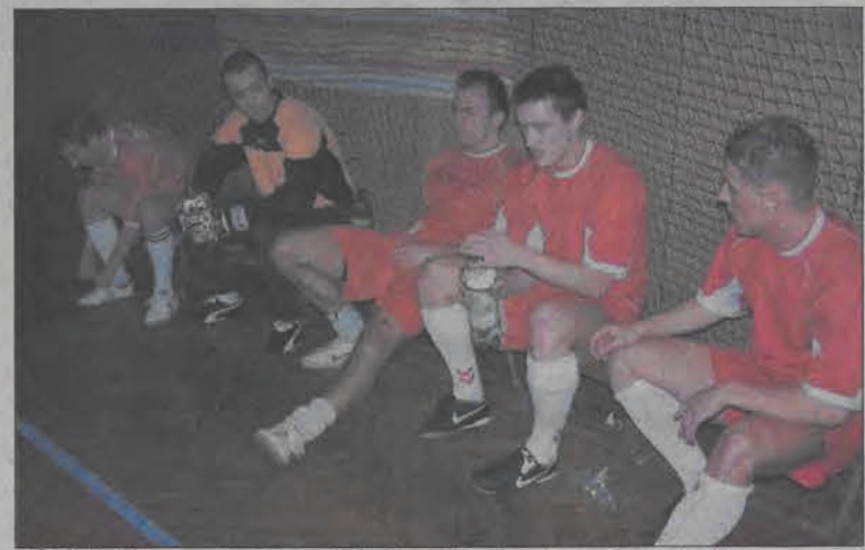
Ambicji piłkarzom Budowy nie brakowało, ale nie wystarczyło sił...