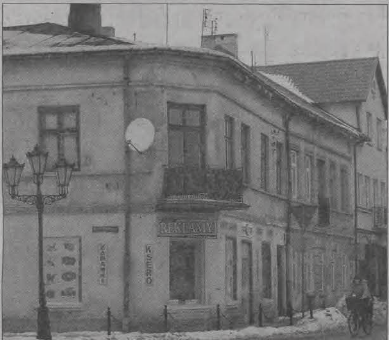
Z daleka już widać, że tej kamienicy przy rondzie w Łowiczu przydałoby się malowanie. Widzą to również turyści odwiedzający nasze miasto.

Budowany obecnie gmach przeznaczony jest dla prokuratury i dla sądu, w którym pracować może do 17 sędziów. Powierzchnia użytkowa na trzech jego kondygnacjach (parter, I piętro i poddasze użytkowe) wyniesie będzie 3.686 m 2 , z czego sąd zajmie 3.127 m 2 , prokuratura - 559 m 2 . Sąd będzie miał do swojej dyspozycji 8 sal rozpraw, 3 dla wydziału karnego, 2 - cywilnego, po jednej - dla wydziałów: rodzinnego, pracy i grodzkiego. (eb)