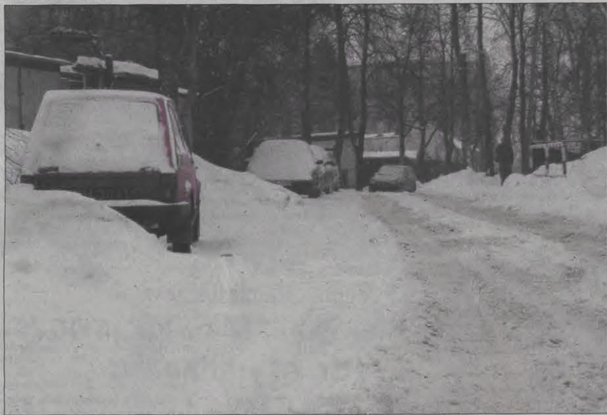
Ulica Nowa w Łowiczu we wtorek. Potem ten śnieg topniał. Jeśli zamarznie - będzie bardzo ślisko.