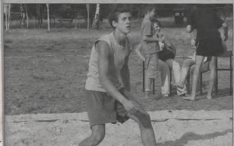
Wakacyjne Mistrzostwa Szkół Ponadgimnazjalnych stały na całkiem wysokim poziomie.

W tabeli kolejne kolumny oznaczają czas: pływanie, rower, bieg i wynik końcowy.