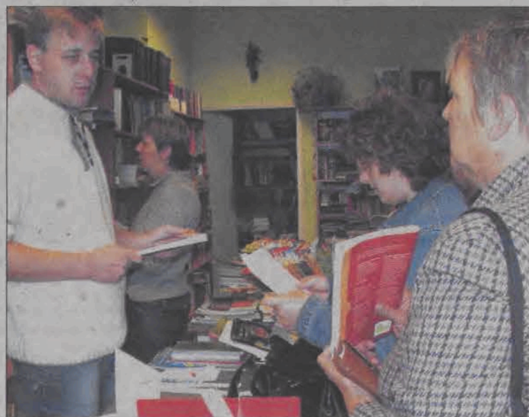
W antykwariacie na ul. Browarnej takiego ruchu jak przed rozpoczęciem roku szkolnego dawno nie było.

Dla wielu rodziców stanowi to poważny problem. Komplet książek dla pierwszaka kosztuje nieraz ponad 150 złotych. Dla ucznia rozpoczynającego naukę