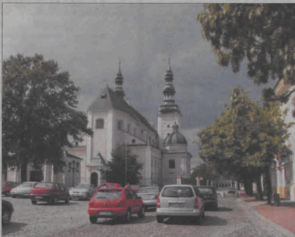
Parkując samochody na Starym Rynku wielu z nas nawet nie pomyśli, że otaczają go zabytki: katedra, ratusz, kamienice, kanonie... Częściej dostrzegają to odwiedzający Łowicz turyści.

Dziwił mnie język. Po raz pierwszy słyszałem, jak żona mówi do swej córki o swym mężu „on”. Usłyszałem, że można być rodziną „do” kogoś, a nie po prostu czyjaś rodzina. Uczylem się, że książkę „do ludzi”, to taki, który ich słucha i ma do nich szacunek, a jeśli gdzieś ktoś postawił „galanty” dom, to znaczy, że duży, ładny i zasobny. Że po warzywa chodzi się