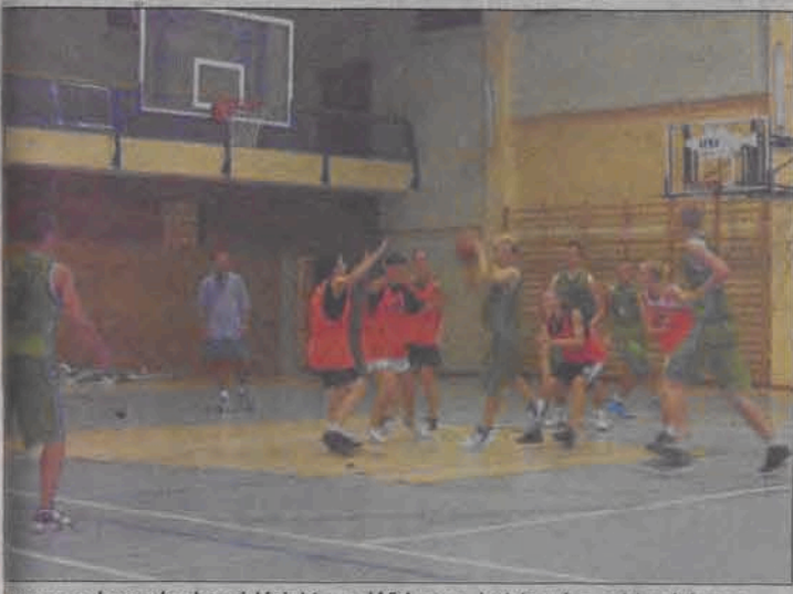
Mecz z koszykarkami łódzkiego Widzewa był bardzo widowiskowy.