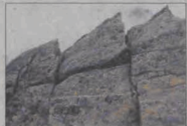
Jedno ze zdjęć, które będzie można oglądać podczas wystawy prezentuje mało znane Tatry po słowackiej stronie. (eb)

Zdjęcia gór będzie można podziwiać do 22 października. Fotografie Piotra Drewniaka prezentują osobiste spojrzenie autora na Tatry. Można w nich odnaleźć dwie pasje autora - fotografowanie i wędrówkę po górach. Zgromadzone w Muzeum w Łowiczu fotografie, powstałe w ciągu ostatnich lat, przedstawiają przede wszystkim Tatry po stronie słowackiej, coraz częściej i chętniej odwiedzane przez Polaków. Tamtejsza przyroda wydaje się być bardziej tajemnicza niż tłumnie już odwiedzane góry okolic Zakopanego. - Fotografie Piotra Drewniaka w subtelny i wyważony sposób ukazują Tatry - mówi Marzena Kozanecka-Zwierzy, kurator wystawy.