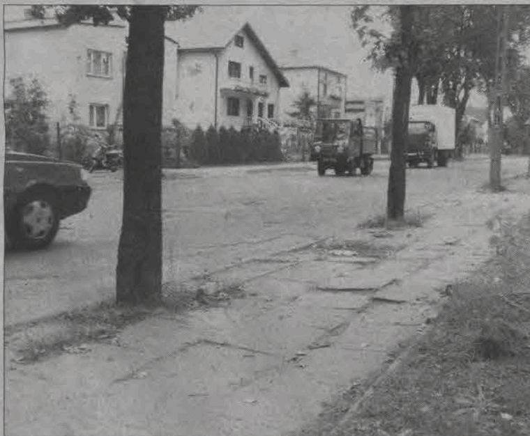
Dziurawa jezdnia, nierówne chodniki - ul. Kaliska miałaby duże szanse w konkursie na najbardziej dziurawą ulicę w mieście.