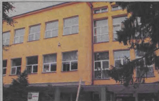
Barwa elewacji / LO zmieniła się na ciepłą piaskowo-żółtą.