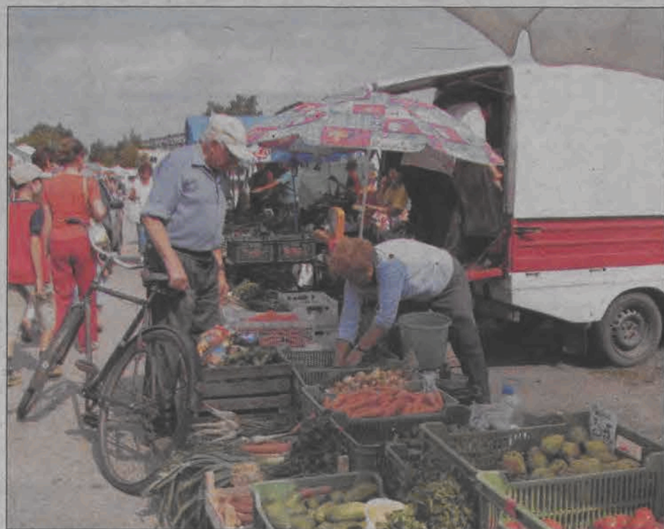
W Łowiczu są owoce i warzywa chodzimy nie na „rynek”, lecz na „targowicę”. Obie formy gramatycznie są poprawne, a najważniejsze - aby kupić warzywa smaczne i świeże - wprost od producenta.

Inni przybysze odczuli ten dystans bardziej. Nauczycielka jednej z łowickich szkół, od 20 lat wraz z mężem, który także nie pochodzi z naszego terenu, mieszkająca w Łowiczu mówi, że stosunek Księżaków do obcych naprawdę dobrze