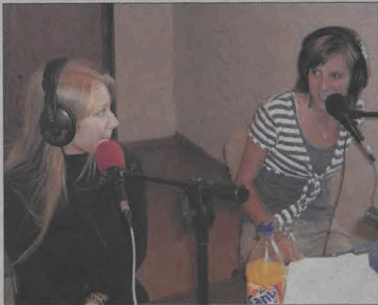
Studio Radia Rewal działa tylko w wakacje, a pracują w nim młodzi ludzie z warsztatów dziennikarskich „Potęga prasy”.

Oboz ma charakter warsztatów, a 20 jego uczestników samodzielnie, ale pod kierunkiem dziennikarzy, zbiera materiały, pisze i lamie teksty, robi korektę, pozyskuje ogło-