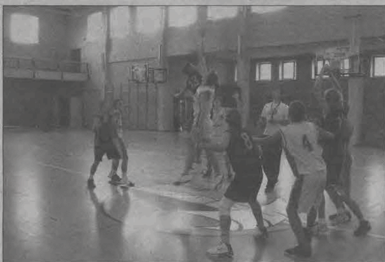
Podczas obozu kadeci Księżaka rozegrali w Pucku dwa mecze ze swoimi rówieśnikami z Odry Wodzisław Śląski. Łowiczanie dwa razy okazali się lepsi od swoich rywali.

Po zakończeniu meczu ci zawodnicy, którzy mniej grali zmierzli się w mini-mecz