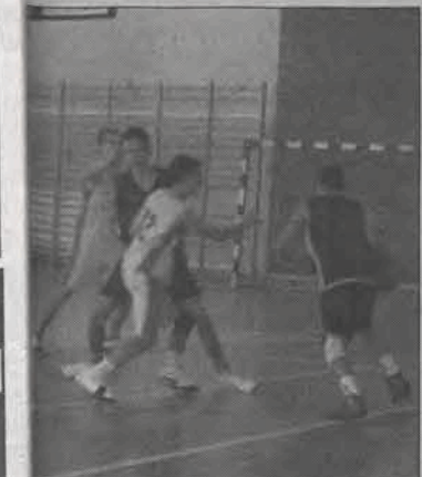
Podopieczni trenera Cezarego Włuczynskiego czynią wciąż systematycznie postępy.