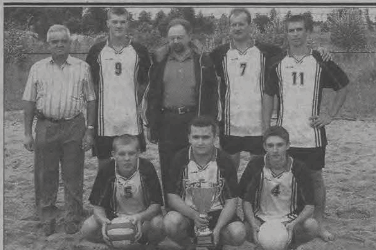
Zwycięzcami turnieju plażówki okazali się gracze Borowianki Borów.