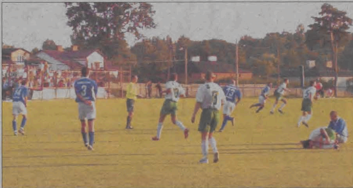
Piłkarze obu zespołów nie oszczędzali swoich „kości”.