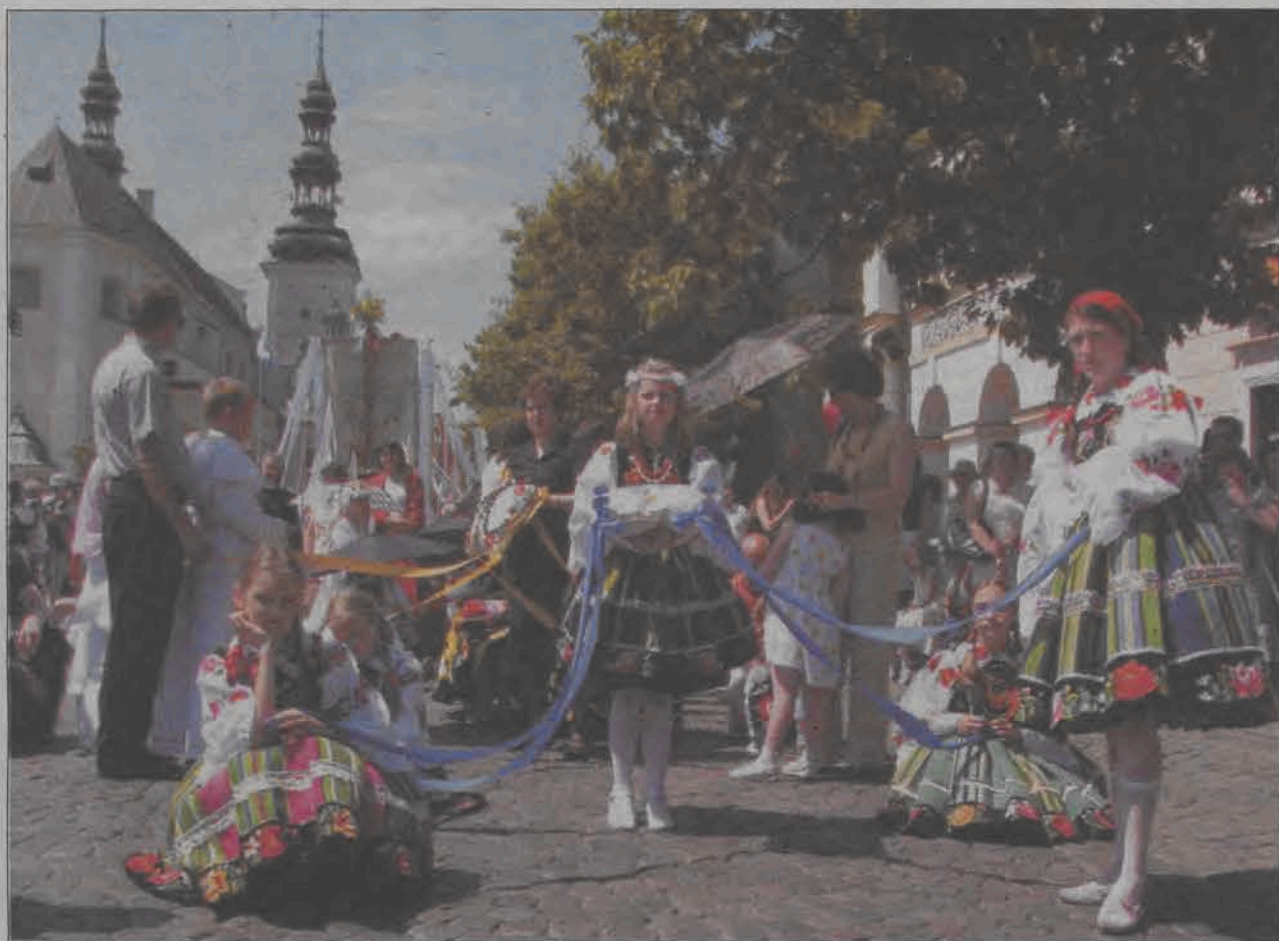
Przywiązanie do tradycji, umiłowanie folkloru - to cechy autentyczne. Rzesze turystów przyjeżdżają do Łowicza w Boże Ciało również dlatego, aby napatrzeć się na nasze pasiki.