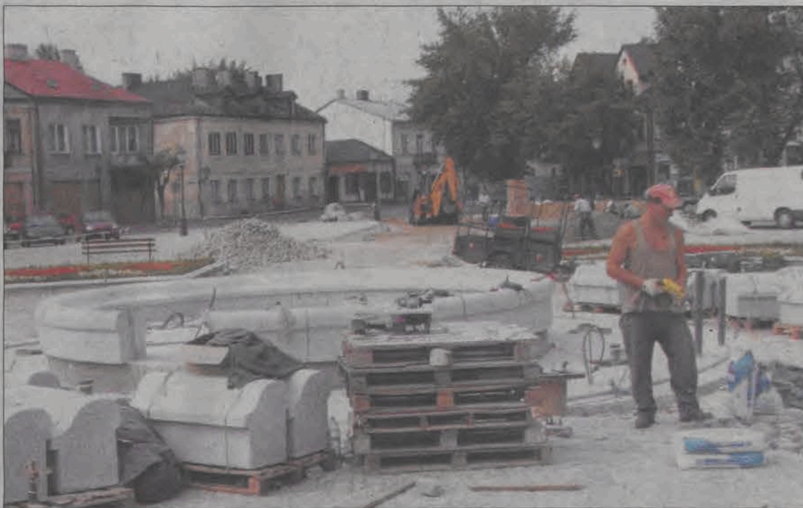
Na Nowym Rynku w poniedziałek prace szły na całego, na pierwszym planie wykonany już wewnętrzny pierścień fontanny.

Prace przy renowacji Nowego Rynku dobiegają końca, choć nie ma szans, by miały się definitywnie zakończyć dzisiaj, tj. 31 sierpnia. Dzień ten miał być dla wykonawcy - Zakładu Projektowo-Remontowo-Budowlanego Andrzeja Malczyka z Łowicza nieprzekraczalny.