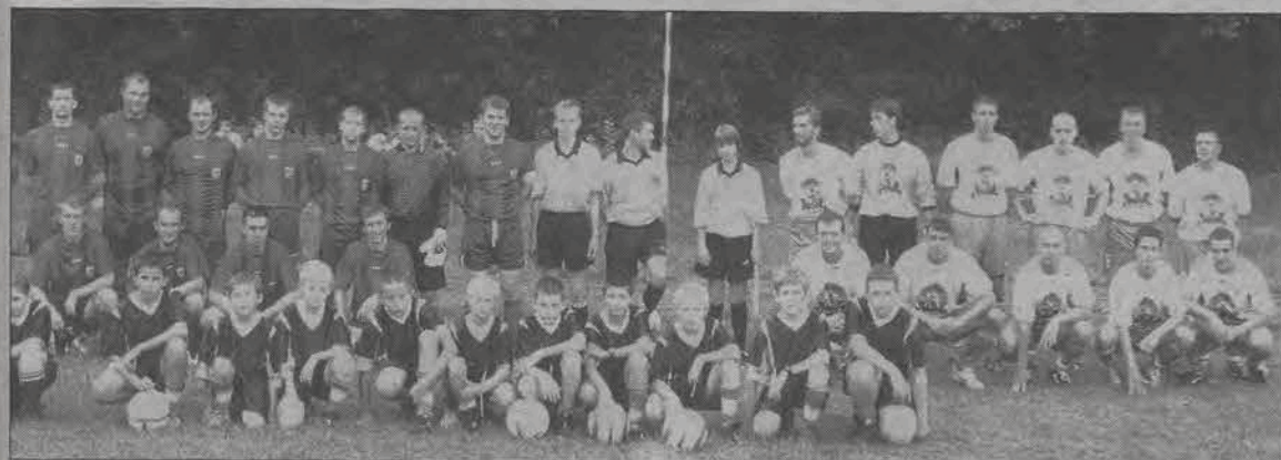
Dla graczy Macovii Maków (z lewej) mecz z Pelikanem był prawdziwym piłkarskim świętem