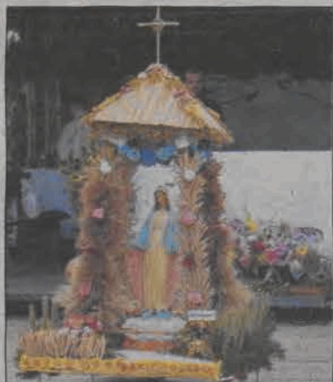
Wieniec dożynkowy z Wierznowic.