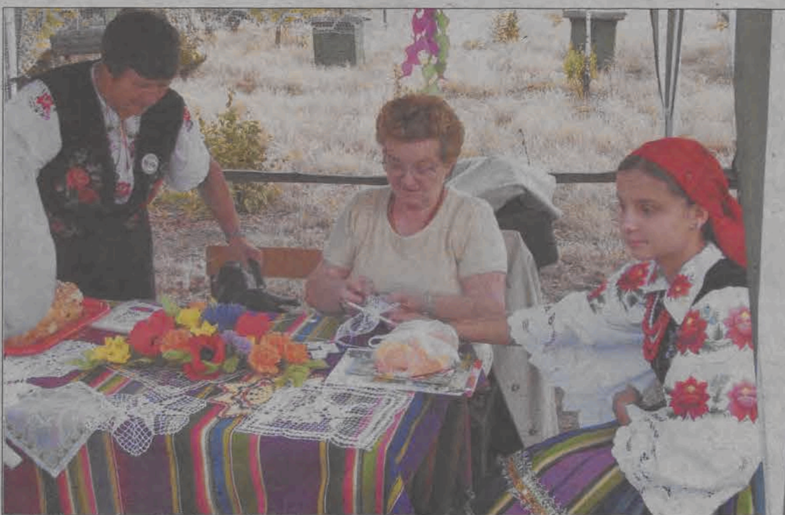
Na każdym kroku można było spotkać się z pięknymi łowiczankami...

Tegoroczna biesiada rozpoczęła się w centrum Łowicza. W sobotę około godziny 13 delegacje z trzech współpracujących ze sobą powiatów: łowickiego, kartuskiego i zakopiańskiego, zespoły folklorystyczne oraz inni goście, zebrali się przed budynkiem starostwa przy ulicy Stanisławskiego. Kolorowy korowód przeszedł ulicami miasta na Stary Rynek, gdzie czekały autobusy, które zawiozły gości do skansenu. Od razu po oficjalnym otwarciu biesiady przez starostę i burmistrza - obydwoj byli w strojach ludowych - wystąpił łowicki Zespół Pieśni i Tańca „Blichowiacy”. Tym samym był to początek bloku folklorystycznego, w którym zaprezentowały się również zespoły folklorystyczne z zaprzyjaźnionych powiatów. Z ludowych rytmów publiczność wyrwała dziewczęta ze „Zgierskiej Grupy Tancerznej”, które zaprezentowały na scenie w kusych strojach odważny taniec nowoczesny przy muzyce dyskotekowej. Zaraz po występie dziewcząt na scenę wkroczyli prawdziwi mężczyźni z klasy o profilu obronnym z Zespołu Szkół Licealnych w Zdunach. Ubrani w czarne stroje uczniowie dali pokaz zasad obrony przed napastnikami z nożami, pałkami itp. Pokaz zorganizowany został w rytm głośnej muzyki, a odgłosy pola walki „wytwarzał” instruktor ze szkoły w Zdunach, wrzucając w pobliże sceny mini petardy. Pokaz wypadł imponująco. Dziewczęta ze Zgierskiej Grupy Tancerznej od razu po występie chłopaków