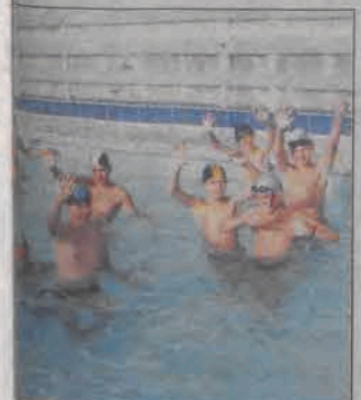
Koszykarze mieli do dyspozycji w swoim otoczeniu basen kąpielowy.

Łeba, 26 sierpnia. W pojedynku rewanżowym żacy Książaka odnieśli jeszcze bardziej przekonujące zwycięstwo z rywalami ze Słupcy.