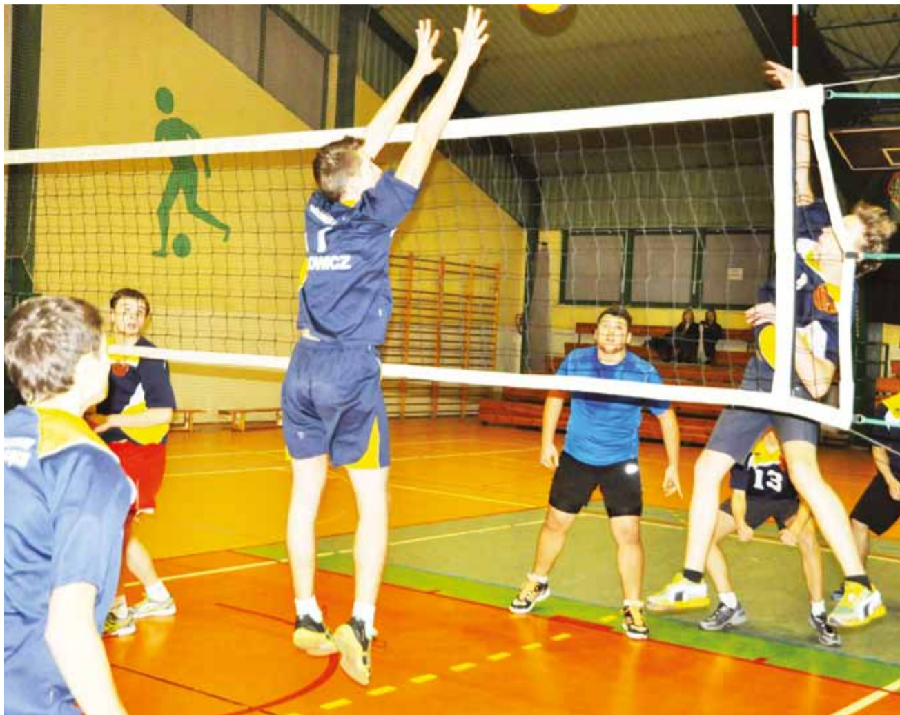
Ekipa Pijarskiej pokonała po pięciu setach UKS II Korabka.

Kolejne zmagania siatkarzy w hali sportowej OSiR nr 2 przy ul. Topolowej 2 w już weekend 24-25 stycznia. W piątek 24 stycznia o godzinie 18.15 zagrają: UKS Bzura I Sobota – UKS Bzura II Sobota, UKS Korabka I Łowicz – Pijarska Łowicz, Volleyball Gimnazjum Głowno – Rawka Bolimów. W sobotę o godzinie 13:00 odbędą się kolejne trzy mecze: Volleyball Gimnazjum Głowno – UKS Korabka II Łowicz, UKS Bzura I Sobota – LKS Retki, UKS Bzura II Sobota – Rawka Bolimów. zł