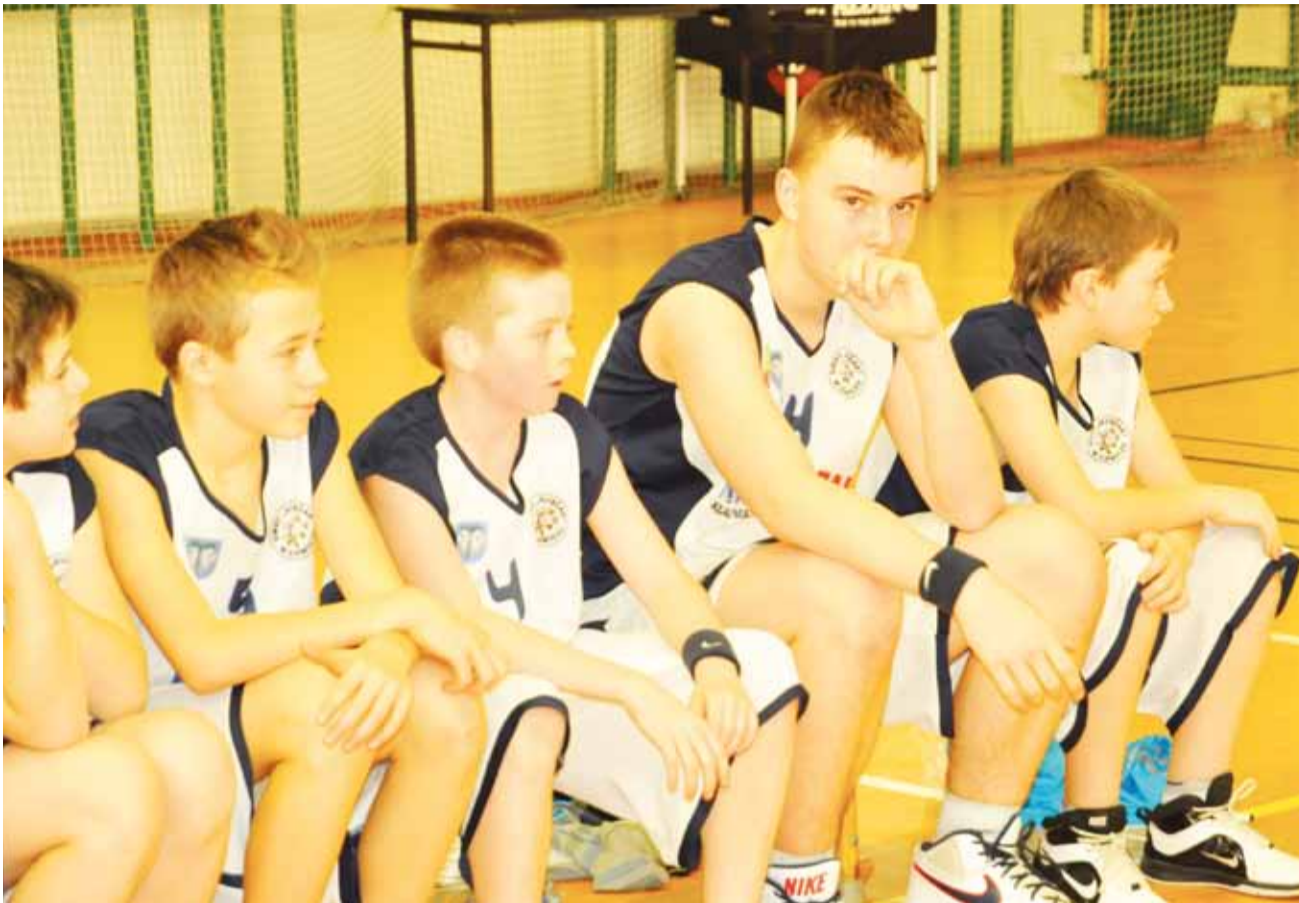
Młodzicy Księżaka zakończą rundę wstępną na 7. miejscu w grupie A.

Koszykówka | 14. kolejka Wojewódzkiej Ligi Młodzików U-14