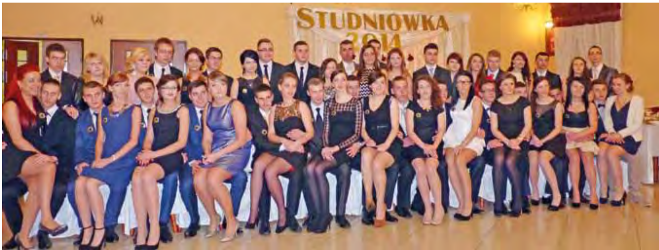
Tegoroczni maturzyści z ZS nr 1 im. Adama Mickiewicza wraz z osobami towarzyszącymi.