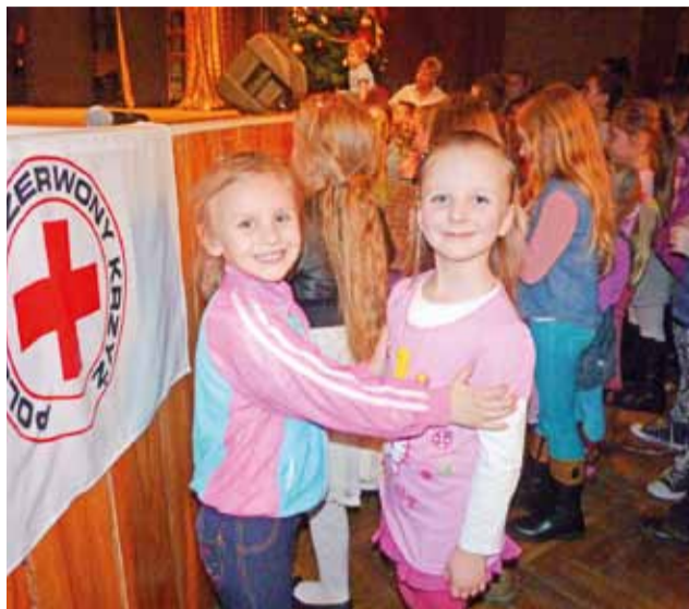
Oddział PCK w Żychlinie od prawie 20 lat bez przerwy organizuje bale karnawałowe z Mikołajem dla dzieci z najuboższych rodzin.

Przygotowanie zabawy oraz paczek było możliwe dzięki dofinansowaniu z Urzędu Gminy Żychlin w wysokości 3,7 tys. zł. Pomagali też wolontariusze z Zespołu Szkół nr 1 im. Adama Mickiewicza w Żychlinie, którzy w grudniu kwestowali w TESCO, przekazując PCK 1200 zł oraz 97 zł ze sprzedaży ciast. Tradycyjnie sponsora-