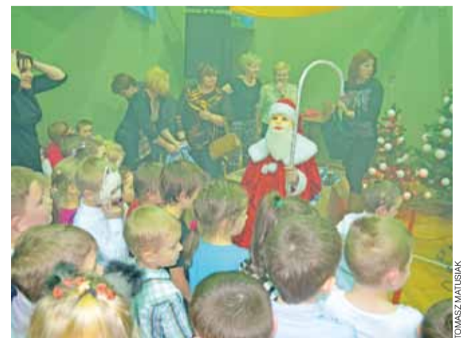
Dzieci ustawiają się w kolejce po prezenty od Mikołaja.