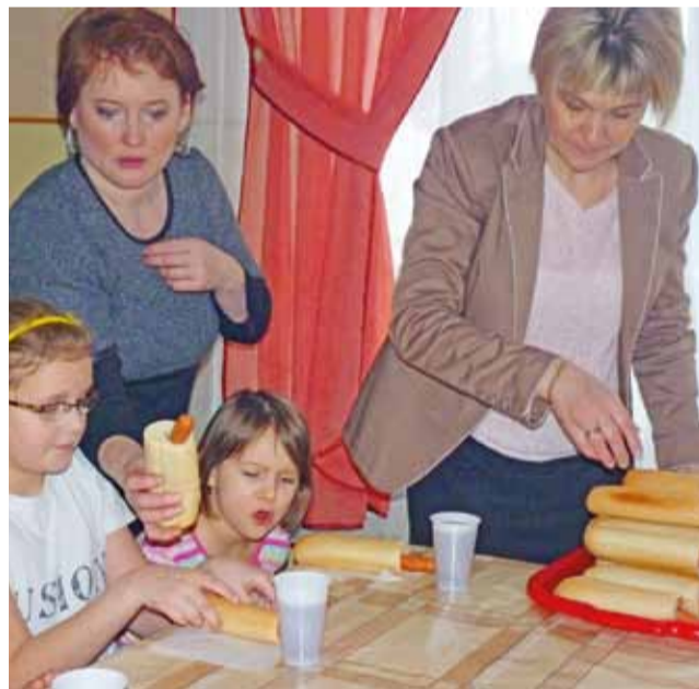
Uczniowie klasy III zostali zaproszeni do zjedzenia hot-dogów przygotowanych przez rodziców.