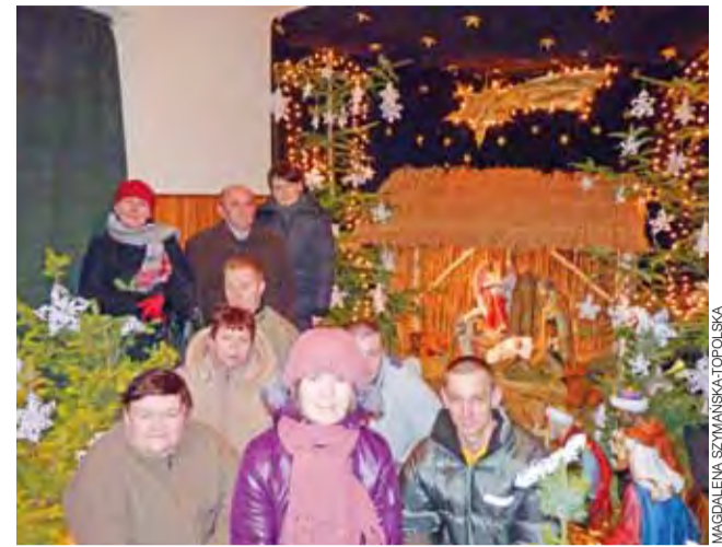
Piękna szopka bożonarodzeniowa i jej twórcy – niepełnosprawni uczestnicy Warsztatów Terapii Zajęciowej.