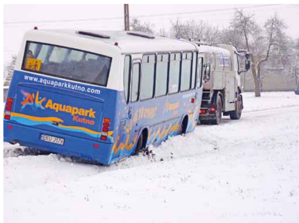
W piątek, 17 stycznia, przed godziną 8.00 , na drodze do Żabikowa autobus komunikacji miejskiej zakopał się na rozmiękczonej skarpiie pobliskiego rowu.