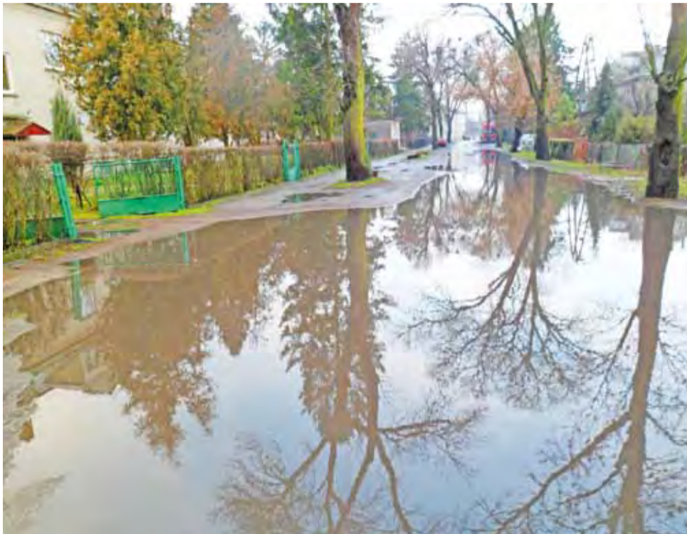
Tak wyglądała ulica Jabłonkowa w Dobrzelinie 5 stycznia. Po każdym deszczu część ulicy zamienia się w potężne jezioro, które zalewa nawet chodniki.

– Kanalizacja nie jest nasza, choć oficjalnego przekazania nie było – przyznaje dyrektor. – Bloki oddaliśmy, mieszkańcy gminy Żychlin korzystają z ka-