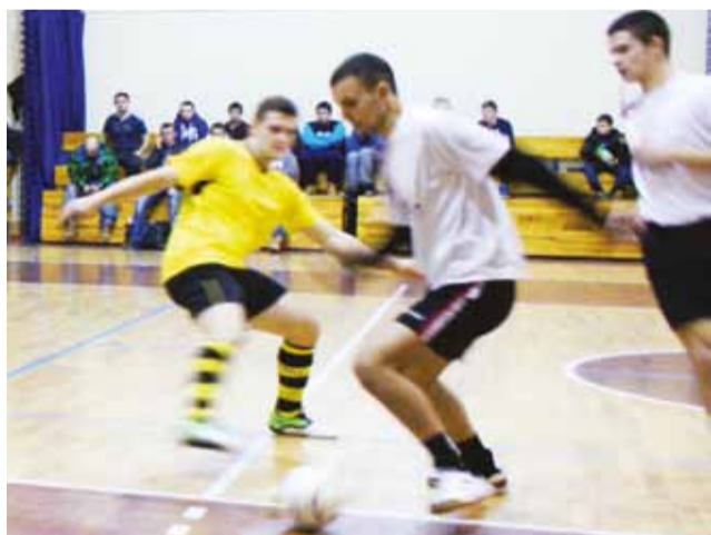
Mecz Bakugan - Olimpia zakończył się wynikiem 6:3.

W jednym z ciekawszych spotkań 2. kolejki przez pierwsze minuty drużyny sprawdzały na co mogą pozwolić sobie w ofensywie. Pierwsi na prowadzenie wyszli zawodnicy BS Skład. Wynik do przerwy to 2:3 dla niebieskich. W drugiej połowie dobra gra w obronie i skuteczne kontrataki powiększyły prowadzenie