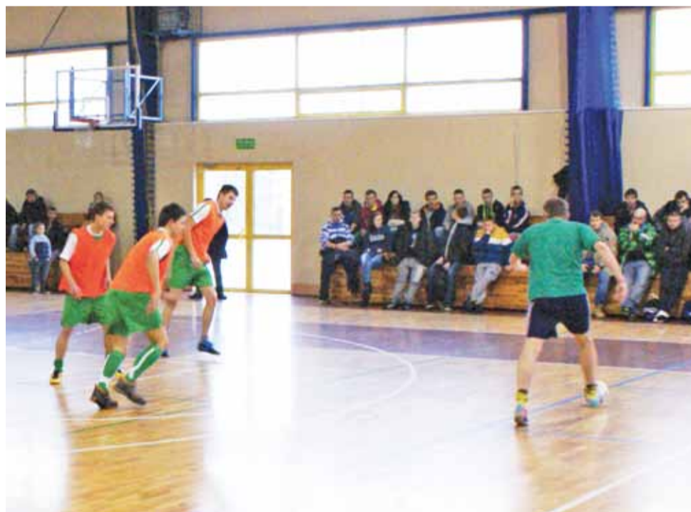
Akcja z meczu ŻHLPN 2014 pomiędzy Nieustraszonymi a Familią, który zakończył się wygraną Familii 7:0.

Nowy Łowiczanie Tygodnik Ziemi Łowickiej członek Stowarzyszenia Gazet Lokalnych