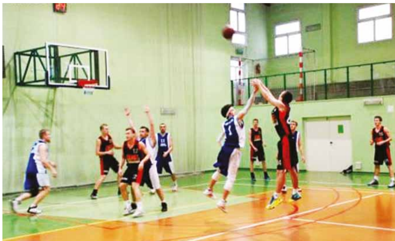
Spotkanie koszykarzy UKS M-G SKS Żychlin z zespołem Primdruk Basket Gostynin, zakończone wygraną żychlinian 63:53.

Było to wyrównane spotkanie począwszy od pierwszych minut, aż do jego zakończenia.