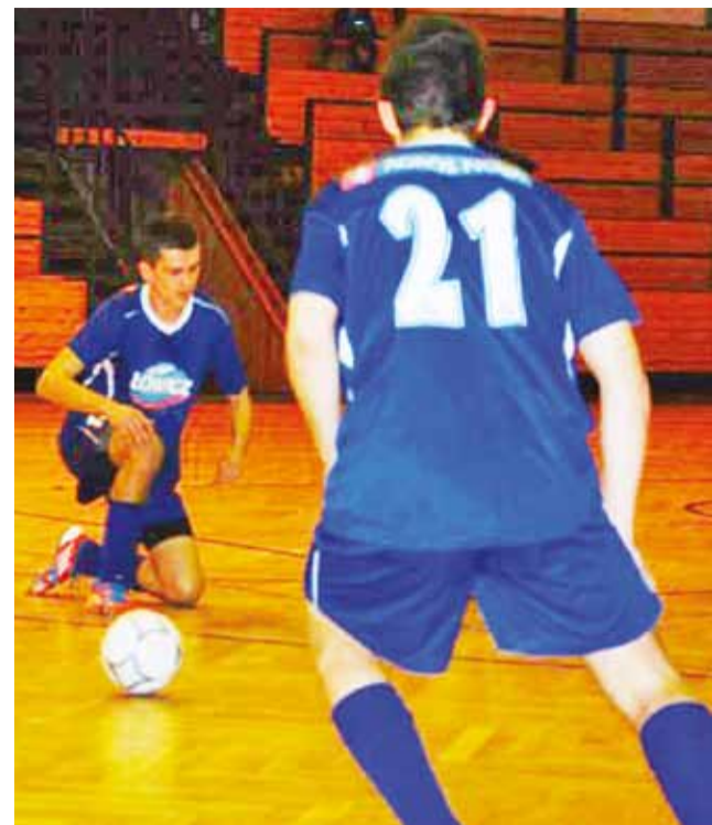
Zawodnicy Agrosu wstali z kolan. Wygrali z Bo Dachem 3:2, przegrywając 0:2.