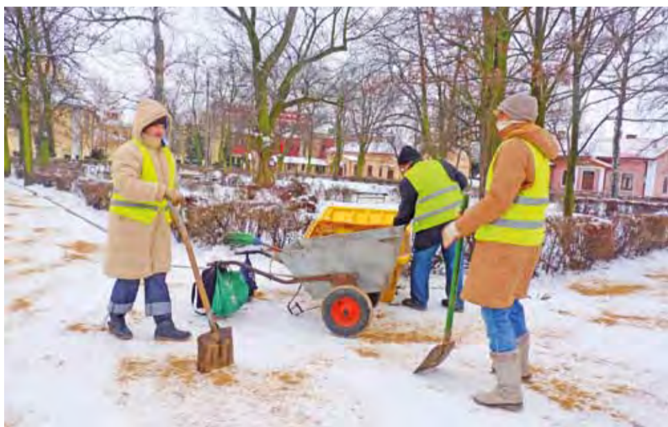
Pracownicy, zatrudnieni w ramach aktywizacji zawodowej przez Urząd Gminy Żychlin, od rana posypują miejskie chodniki. Ich praca w ostatnich, trudnych dniach jest nieoceniona.

Do pierwszej kolizji doszło w sobotę, 18 stycznia, ok. godz. 11.30 w Pleckiej Dąbrowie. Kierowca osobowego auta uderzył w drzewo. Został zabrany do szpitala. Na miejscu była jed-