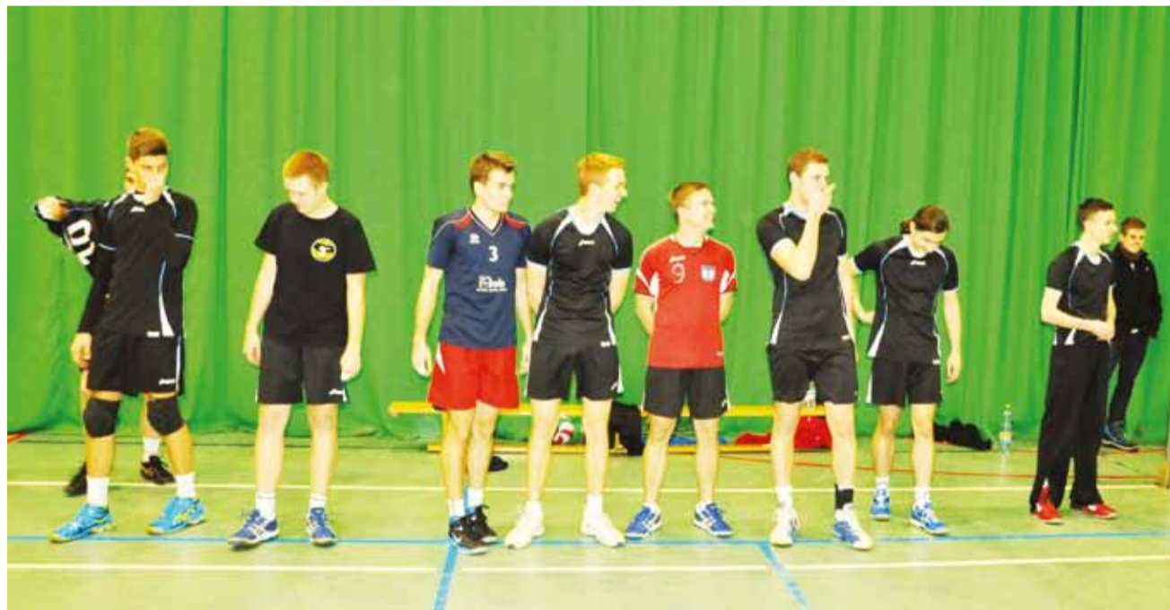
Zespół UKS I Korabka pewnie zmierza po mistrzowski tytuł.

■ UKS Korabka II – Pijarska 2:3 (17:25, 25:19, 16:25, 25:20, 12:15)