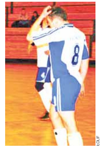
Zawodnicy Zatorza III mają o czym myśleć. Nie wygrali drugiego meczu z rzędu.

(12:30), SMS – Ha!Ha!Ha! (13:00), Szkiełka – Laktoza (13:30), Górki – Dream Team (14:00), Ostrowiec – Stefan (14:30), Akacja – Halo (15:00) i Zet Ka – Zatorze III (15:30).