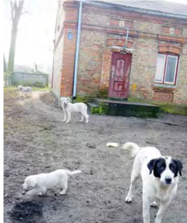
Na niezamieszkałej posesji w Pniewie są trzy duże i jeden mały pies. Zwierzęta nie wyglądają na zagłodzone, choć wszyscy na wsi je dokarmiają. Jedni twierdzą, że właścicielka nie dba o zwierzęta jak należy, inni, że ludzie bez potrzeby się czepiąją.

– Kiedyś wezwano nawet policję, że nie opiekują się psami, zarzucano, że psy nie mają budy – opowiada kobieta. – To kompletna bzdura. Psy mają dwie duże ocieplane budy, każdy ma swoją miskę, a ja codziennie przywożę im jedzenie. Jestem o różnych porach, ale przecież nie będę się meldować sąsiadom, że przyjechałam. Faktem jest, że ludzie czworonogi dokarmiają, bo nieraz na bramie wisi kanka czy wiaderko po jedzeniu. Psy już tak się nauczyły, że byle czego nie jedzą, nawet kości ich nie bardzo interesują.