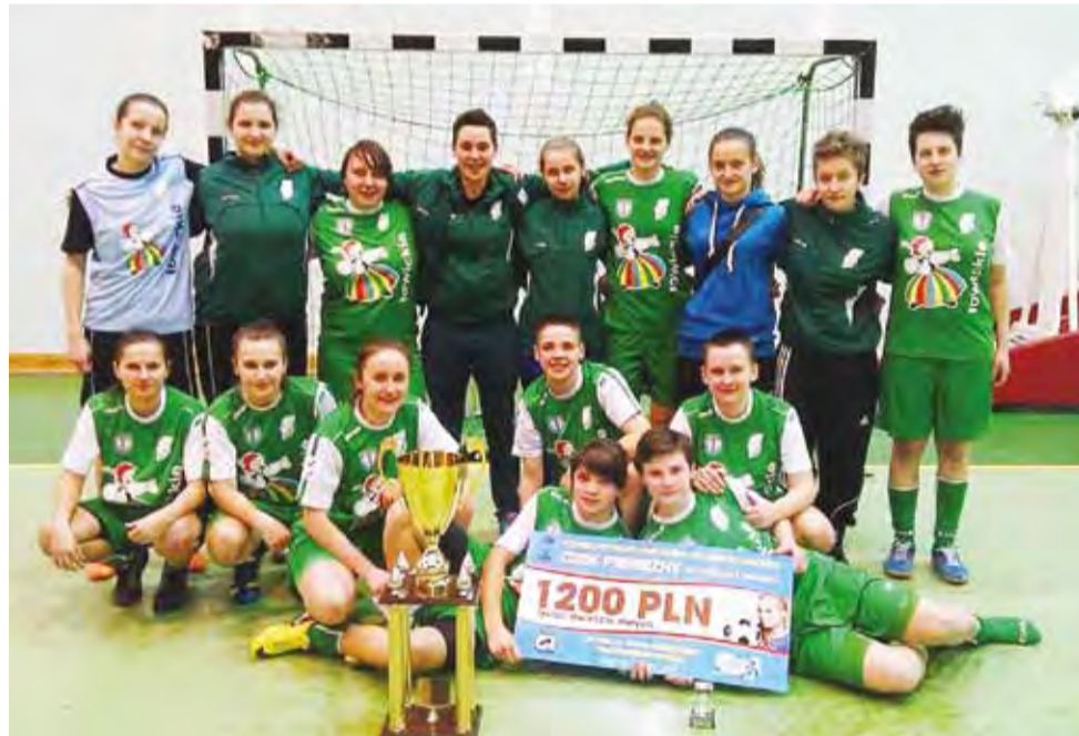
Drużyna Pelikanek od początku była jedną z faworytek turnieju.