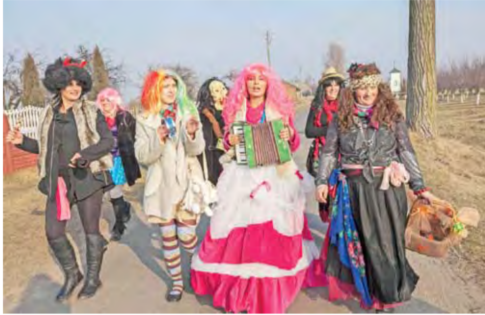
Kolorowy korowód w Strzebieszewie.