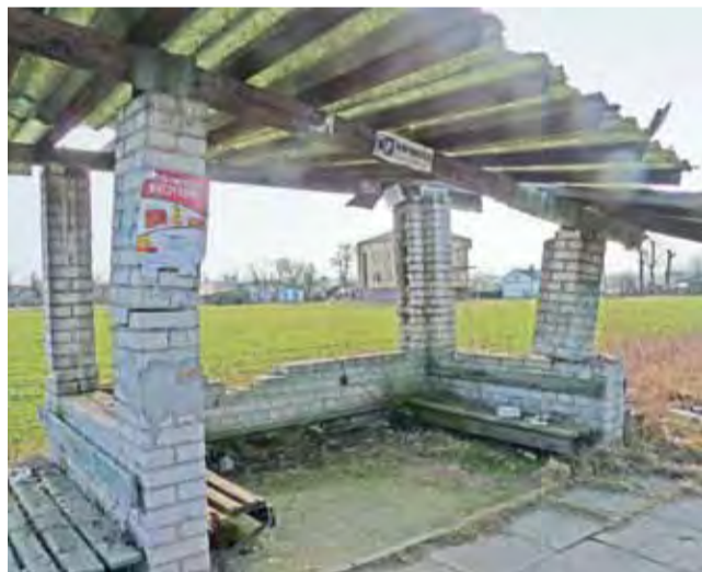
Przystanek przy drodze powiatowej z Oporowa do Żychlina w Kolonii Oporów grozi zawaleniem.

– Myślę jednak, by przystanek odbudować, a nie całko-