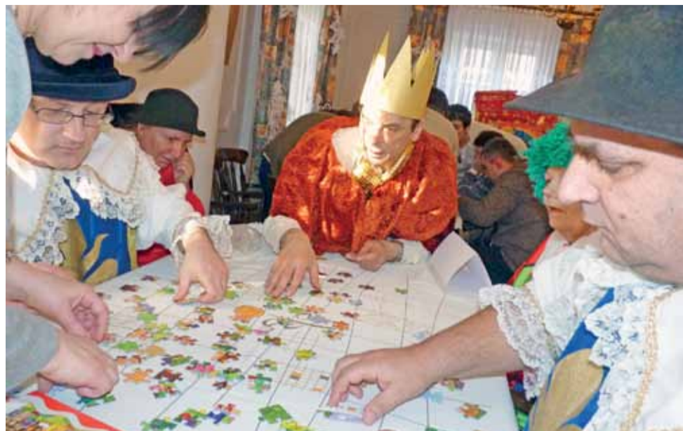
Podopieczni DPS w Wojszycach podczas układania puzzli.