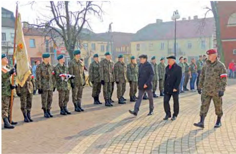
Uroczyste obchody Dnia Żołnierzy Wyklętych w Żychlinie przygotowane przez grupę mundurową LO im. Adama Mickiewicza w Żychlinie.

Ten ból składam u stóp Boga i Polski (...). Bogu dziękuję za to,