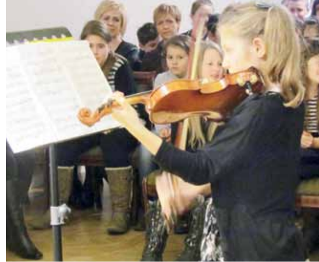
Uczniowie z Gąbina mieli okazję po raz pierwszy wystąpić we wnętrzach pałacu w Sannikach.

Projekt „Kalina – utrwała tradycję” zrealizowano w ramach programu Działaj Lokalnie VIII Polsko-Amerykańskiej Fundacji Wolności, który realizuje Akademia Rozwoju Filantropii w Polsce oraz Stowarzyszenie Lokalna Grupa Działania POLCENTRUM. ■