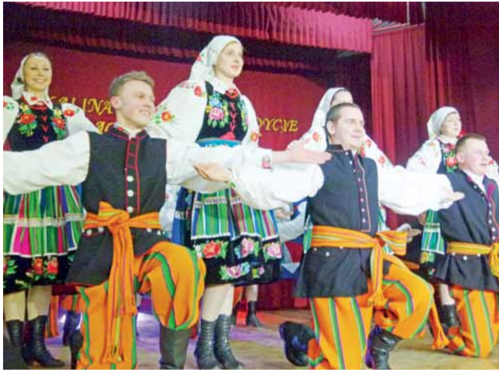
Zespół Pieśni i Tańca Kalina w trakcie występu (suity tańców łowickich) na gali podsumowującej projekt.