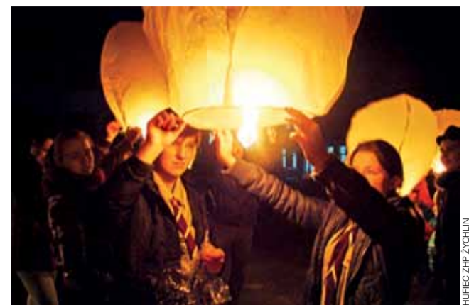
Zuchy i harcerze z Hufca Żychlin puszczili w niebo 20 płonących lampionów, które symbolizowały harcerską, rodzinną więź i bliskość.

Trudno jednak było przekonać zebranych jak żyć bez szalibu, karkówki, bigosu... To może przynajmniej je ograniczyć? ■