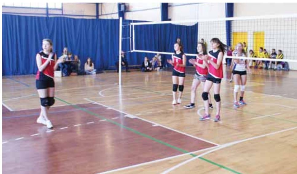
Reprezentacja dziewcząt Gimnazjum Żychlin w meczu z Gimnazjum Nr1 Kutno.