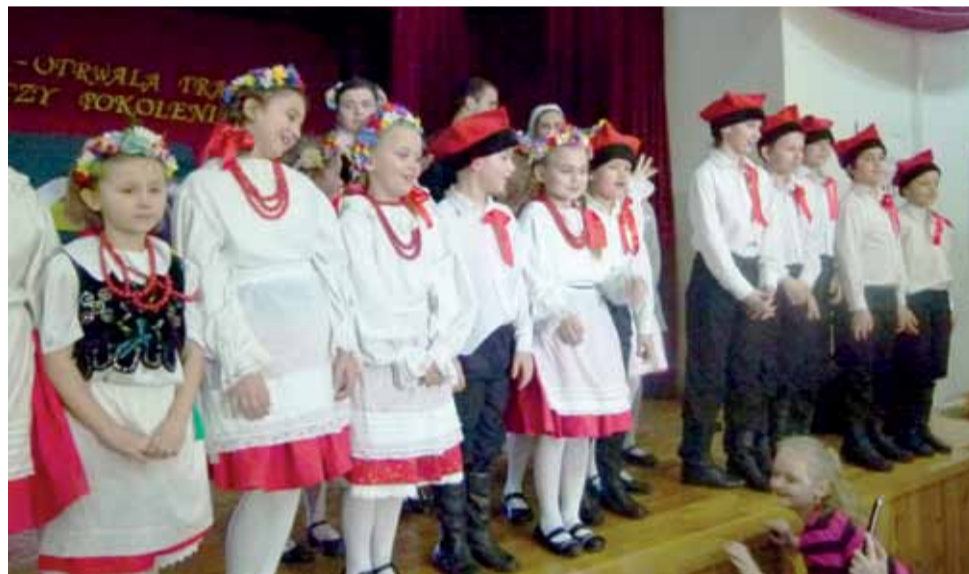
Dumni młodzi tancerze po swoim brawurowym występie.