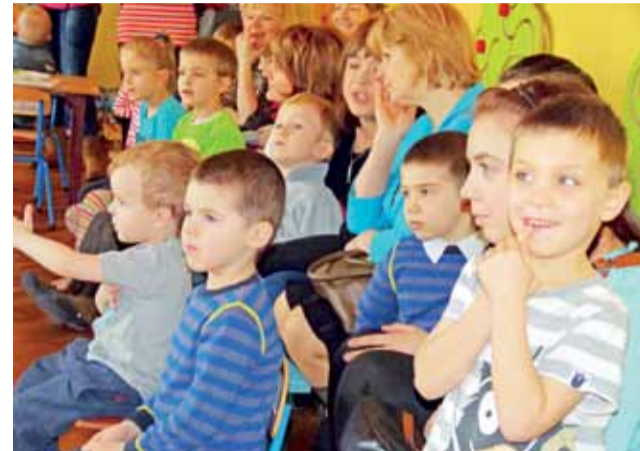
Dzień otwarty cieszył się sporym powodzeniem.

Zapraszamy do obejrzenia galerii zdjęć na www.lowiczanie.info