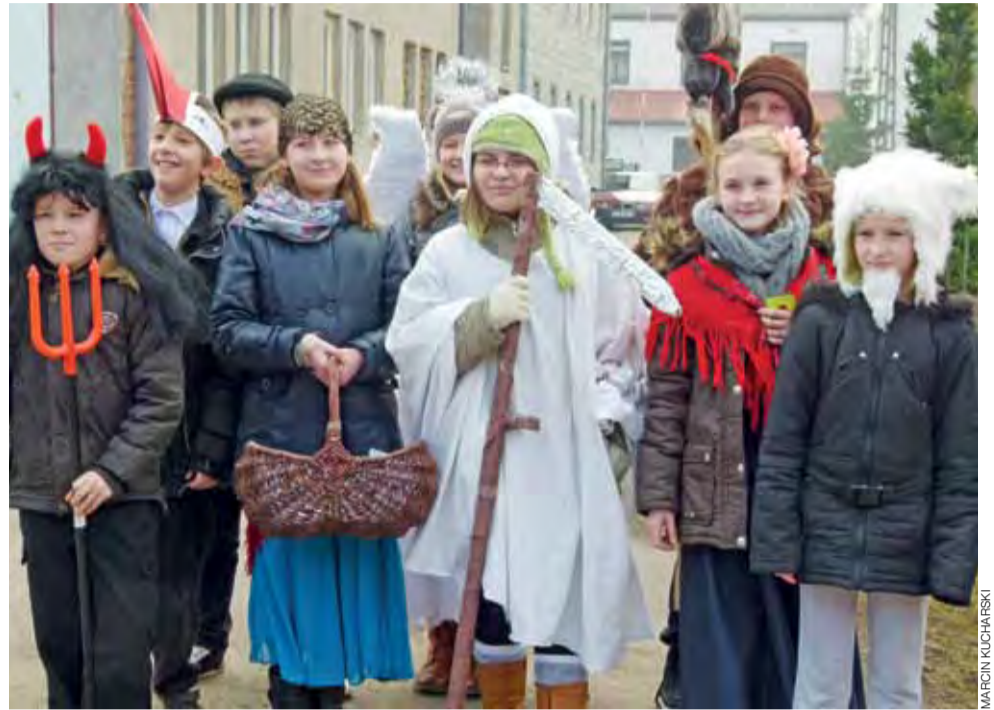
Zapustnicy z podstawówki odwiedzali gospodarzy w Łaguszewie w piątek, 28 lutego.

Zapraszamy do obejrzenia galerii zdjęć oraz filmu na stronie www.lowiczanie.info