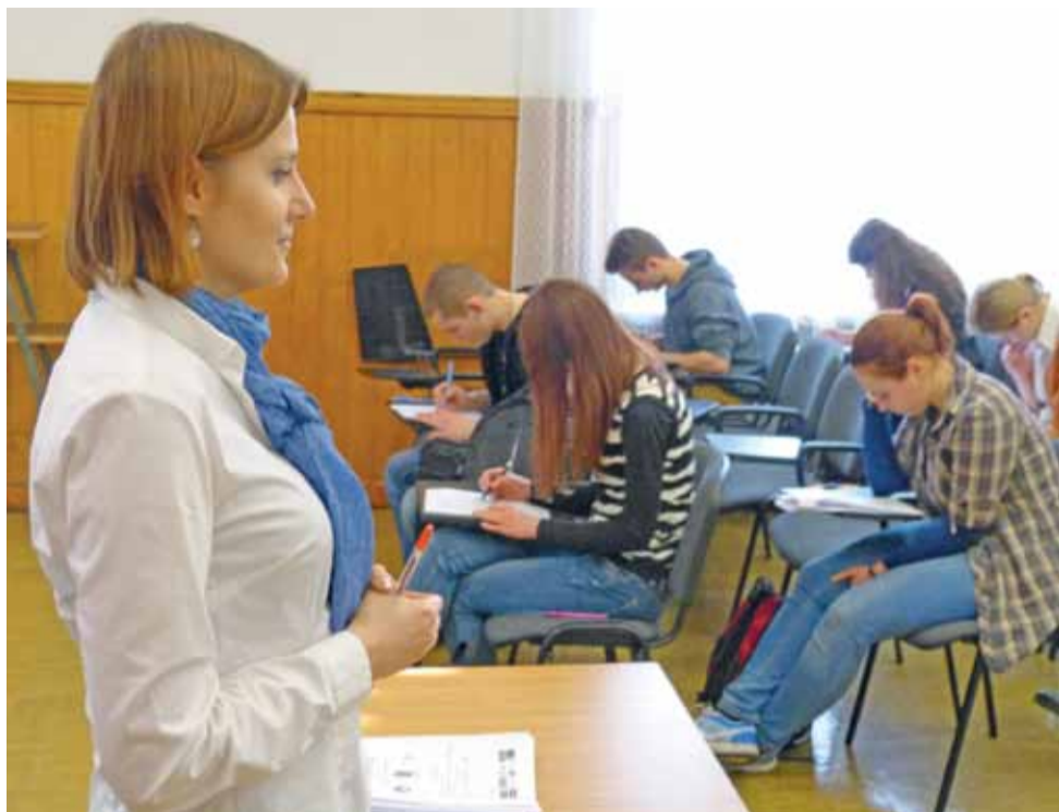
Etap pisemny konkursu, 13 lutego.

Łowicz, Sieradz | Konkurs językowy w Kolegiach