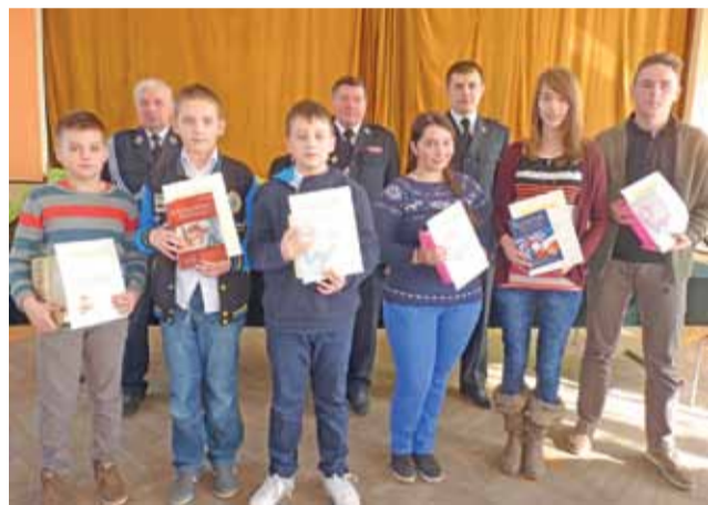
Zdobywcy trzech pierwszych miejsc w kat. szkół podstawowych i gimnazjów wraz z komisją konkursową.