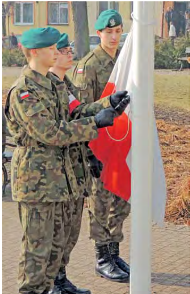
Uroczyste obchody Dnia Żołnierzy Wyklętych w Żychlinie przygotowane przez grupę mundurową LO im. Adama Mickiewicza w Żychlinie.

Bohaterowie powracają z odmetów niepamięci, bohaterowie skazani niegdyś na porażkę wobec potęgi, bohaterowie odważni, walczący za miliony; bohaterowie utopieni we własnej krwi,