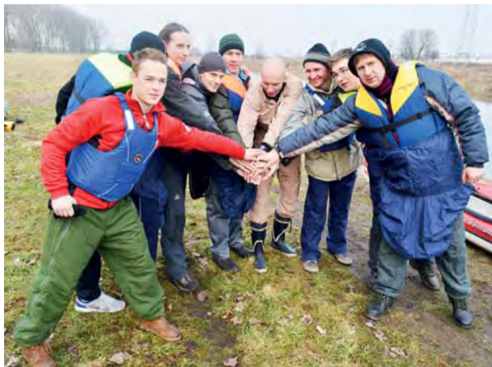
Ekipa życzy sobie powodzenia przed wypłynięciem na Bzurę.

Uczestnicy spływu spotkali się przed godziną 9 w pobliżu restauracji Szkiełka, dokładnie w miejscu, w którym jeszcze w tym roku ma się pojawić miejska przystań kajakowa. Było ich czterem, a kajaków osiem (6 „dwójek” i 2 pojedyncze). O bezpieczeństwo na spływie wszyscy byli spokojni, w grupie płynęło bowiem 3 instruktorów kajakarstwa, 2 ratowników WOPR, 2 strażaków (z PSP i OSP Ratownictwo Wodne), instruktor pływania i 2 pletwonurków. – To niezwykle ważne przy tego typu spływach, żeby zawsze znaczna część grupy to byli ludzie z kwalifikacjami – mówił