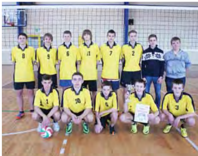
Mistrzowie Powiatu w siatkówkę - drużyna chłopców Gimnazjum w Żychlinie.