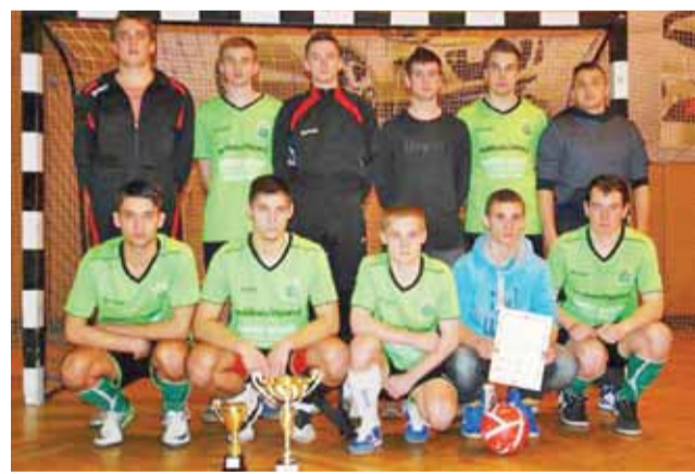
SMS Dąbkowice dotarł do półfinału Pucharu Burmistrza. To wielki sukces tej drużyny.