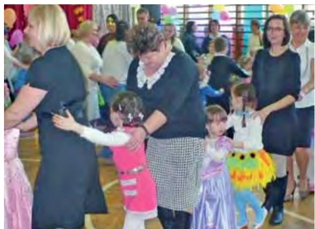
W zabawie na sali gimnastycznej uczestniczyły nie tylko dzieci, ale także rodzice i opiekunowie.

Uczniowie Szkoły Podstawowej nr 1 Łowiczu bawili się 27 lutego na balu karnawałowym. Najpierw zabawę mieli uczniowie klas 0 - III, potem IV - VI. Zabawa dla każdej z grup została przewidziana na dwie godziny. Młodzi uczniowie w większości przebrali się za bajek i filmów, na sali nie brakowało batmanów, spidermanów, kowbojów, policjantów strażaków i rycerzy, za których przebrali się chłopcy. Dziewczęta w przeważającej części swoje kreacje stworzyły, inspirowane filmem Monster High, było więc upiornie.