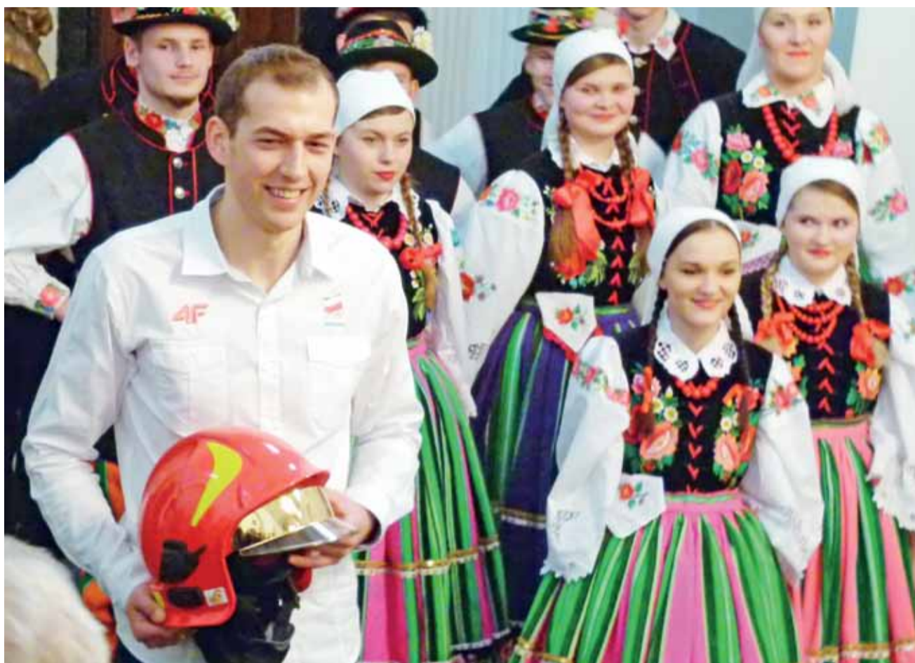
Jednym z prezentów był strażacki hełm.

– Jeśli w Domaniewicach powstanie „Biały Orlik”, to dekla-