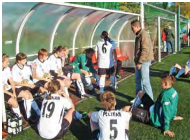
Piłkarki Pelikana Łowicz bardzo dobrze spisują się w sparingach.

– Przygotowania do rundy rewanżowej przebiegają zgodnie z planem. Dziewczyny pracują na treningach na 100% swoich możliwości z czego jestem zadowolony. Nie chciałbym wyróżniać poszczególnych meczów kontrolnych, były zagrane w dobrym tempie. Znam mój zespół bardzo dobrze, jeśli każda zawodniczka zagra na swoim poziomie i nie będziemy popełniać dziecinnych błędów to wyniki będą dobre. Ligę rozpoczynamy 13 kwietnia więc przed nami jeszcze