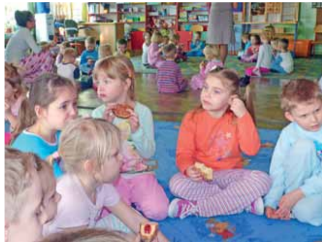
Chwila przerwy w zabawie na degustację pączków. Jak widać, wszystkie dzieci ubrane są w strój obowiązkowy na tym balu – czyli piżamy.

W karnawale przedszkolaki z placówki przy ul. Chełmońskiego mają dwa bale: bal przebierańców z wodzirejem lub zespołem muzycznym, w którym biorą udział również rodzice oraz bal piżamowy, podczas którego każda z grup pozuje do zdjęcia na wielkim łożu, zrobionym z materaców. mwk