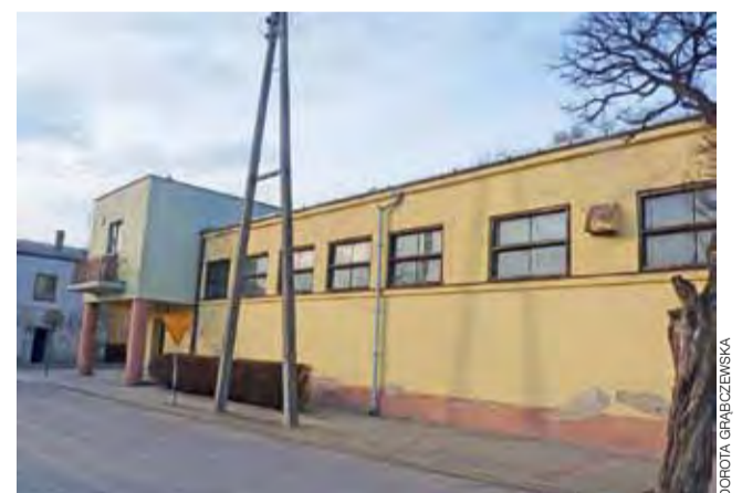
Jest szansa , że w tym roku zostanie wyremontowana sala gimnastyczna po dawnym kinie Lech, gdzie zajęcia z wf mieliby uczniowie SP 1.

W ramach inwestycji ma być zmodernizowana sala gimnastyczna o wymiarach 20,66 m na 12,78 m. Od nowa zostaną zrobione instalacje elektryczne, wodno-kanalizacyjne, centralnego ogrzewania, zrobiona zostanie wentylacja oraz instalacja odgromowa. – W zadaniu jest też zagospodarowanie parteru w drugiej części budynku, gdzie będzie pomieszczenie dla trenerów, nauczycieli oraz zaplecze dla sprzę-