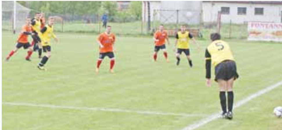
Spotkanie 16. kolejki łódzkiej Grupy III Klasy A pomiędzy GKS Bedno a Magnat Sierpów, zakończone wysoką wygraną 6:0 piłkarzy z Bedna.

Piłka nożna | Rozgrywki Klasy A Grupy Łódź III