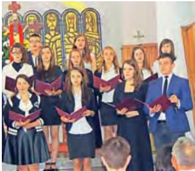
Młodzież z Gimnazjum im. Jana Pawła II podczas uroczystości z okazji kanonizacji ich patrona w kościele pod wezwaniem św. Floriana w Bedlnie. ALEKSANDRA GRUBCZEWSKA

Za muzyczną oprawę przedstawienia i całej uroczystości od-