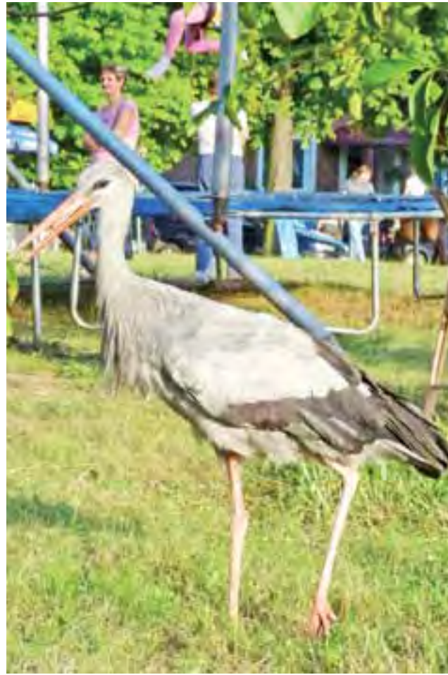
Bocian, który woli towarzystwo ludzi niż innych bocianów , dwukrotnie nie odleciał na zimę do ciepłych krajów. To zdjęcie zrobiliśmy latem 2013 roku, podczas festynu gminnego z okazji uroczystości św. Rocha.

Radość obserwatorów z jego powrotu tej wiosny trwała jednak krótko. Kilka dni później przyleciał ojciec bociana i wraz kilkoma innymi ptakami wy-