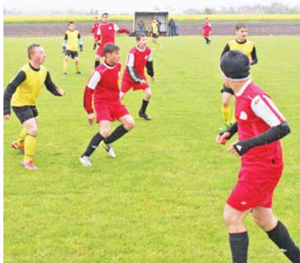
Spotkanie GKS Bedno z Andrespolią Wiśniowa Góra zakończyło się wygraną piłkarzy z Bedna 4:1.