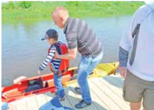
1 maja popływać mogli także najmłodsi – oczywiście pod opieką kogoś z rodziny lub instruktora.

Zadbano też o to, aby warsztaty były okazją do rekreacyjnego spędzania wolnego czasu