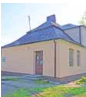
Remont świetlicy wiejskiej w Mnichu powoli dobiega końca. Niestety, w tym roku stare okna nie będą wymienione.

Nową elewację, dach i rynny robiła firma Szym-Bud z Żychlina. W środku terakotę ułożyli pracownicy robót publicznych. Pomieszczenie zostało pomalowane. Do ułożenia w pierwszym pomieszczeniu została wykładzina PCV, którą zakupiono już wcześniej. dag