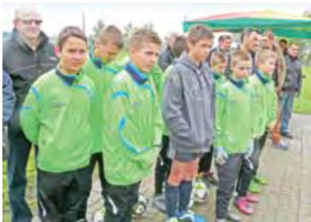
W uroczystości uczestniczyli też juniorzy złakowskiej drużyny.

Niewielki budynek powstał w związku z przypadającym w ubiegłym roku 30-leciem istnienia klubu. Uroczystości związane z tym świętem już się odbyły, ale otwarcie opóźniło się w czasie. Zawodnicy faktycznie jednak korzystają z budynku już