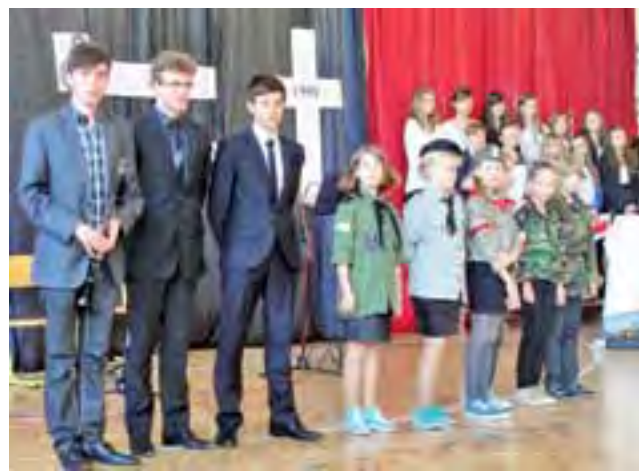
Apel został przygotowany w ramach obchodów Miesiąca Pamięci Narodowej.

Najpierw uczniowie obejrzelili prezentację multimedialną, wracającą pamięcią do zmagania polskiego narodu i walk na frontach począwszy od II wojny światowej po Katyń i do Powstania Warszawskie-