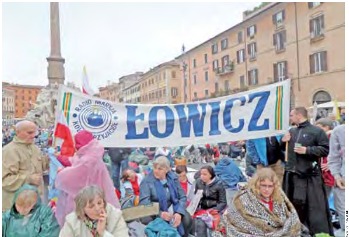
Grupa pielgrzymów z Łowicza była widoczna przede wszystkim na placu Navona, gdzie oglądali mszę kanonizacyjną wspólnie z wieloma innymi pielgrzymami na dużym telebimie.

Pielgrzymi poznawali się ze sobą. Czarnoskórzy pielgrzymi z Afryki fotografowali się z blondynkami.