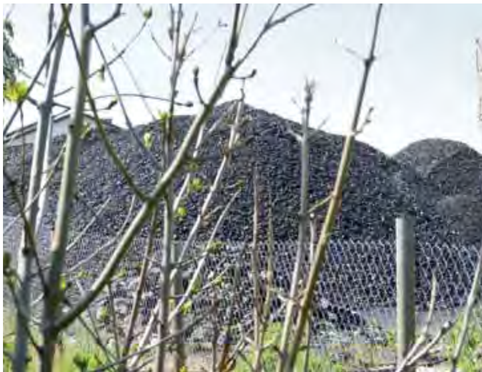
Sortownia węgla w Jackowicach jest uciążliwa dla mieszkańców ze względu na zapylenie, jakie powstaje podczas oddzielania poszczególnych frakcji.

Przedmiotowa nieruchomość znajduje się na terenie o łącznym typie zagospodarowania, na jej części niewskazana jest realizacja obiektów szkodliwie oddziałujących na środowisko zamieszkania, obok niej są tereny z zakazem realizacji zabudowy mieszkaniowej jako funkcji sa-