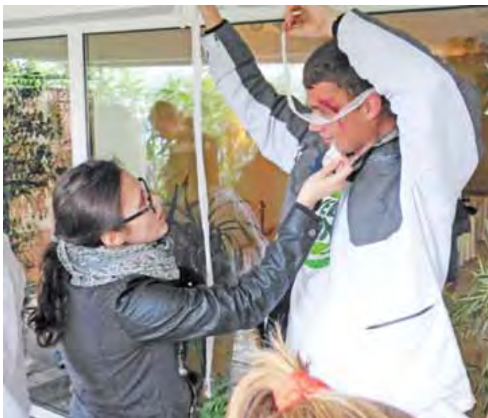
Jednym z kilku praktycznych sprawdzianów podczas zawodów było zakładanie opatrunków.