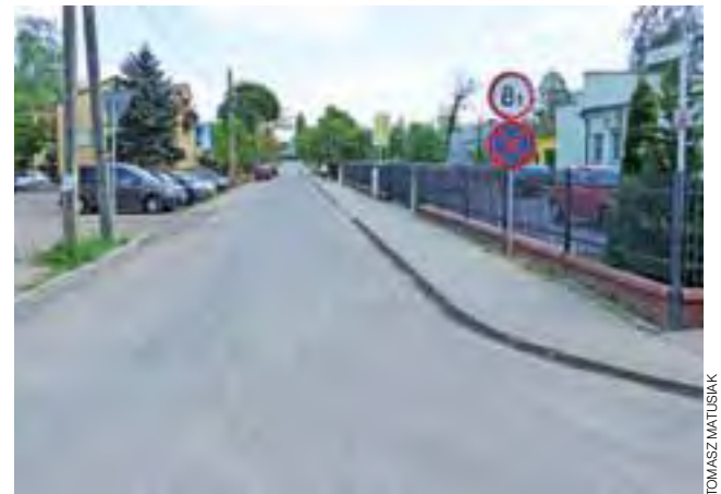
Ulica Mostowa w Łyszkwicach. Po prawej stronie znajduje się przedszkole.