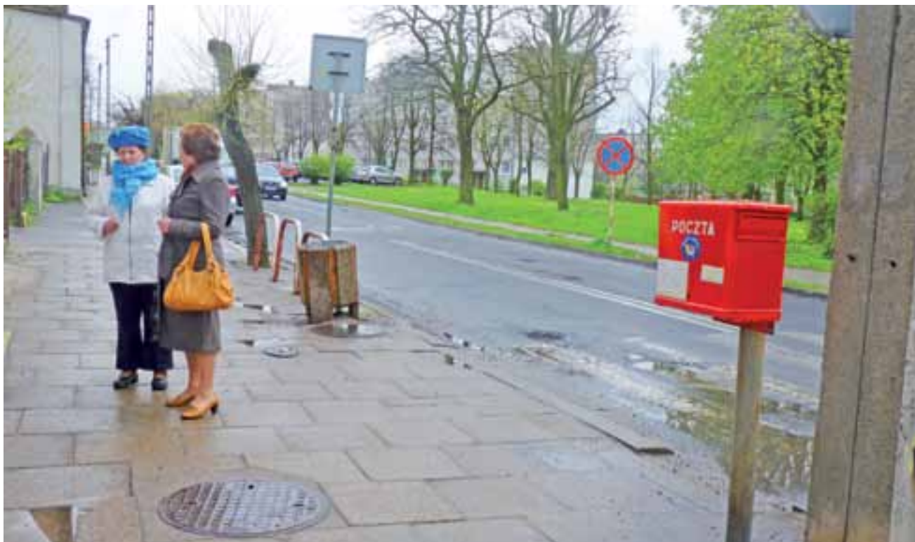
Na terenie Żychlina jest coraz mniej skrzynek pocztowych. Zostały tylko cztery: ta koło poczty przy ulicy Łukasieńskiego, dwie przy Narutowicza i jedna przy Barlickiego. Na osiedlu Wyzwolenia zniknęły ostatnie - ale jednak ma być zainstalowana ponownie.

Poczta Polska | Dlaczego znikają skrzynki pocztowe