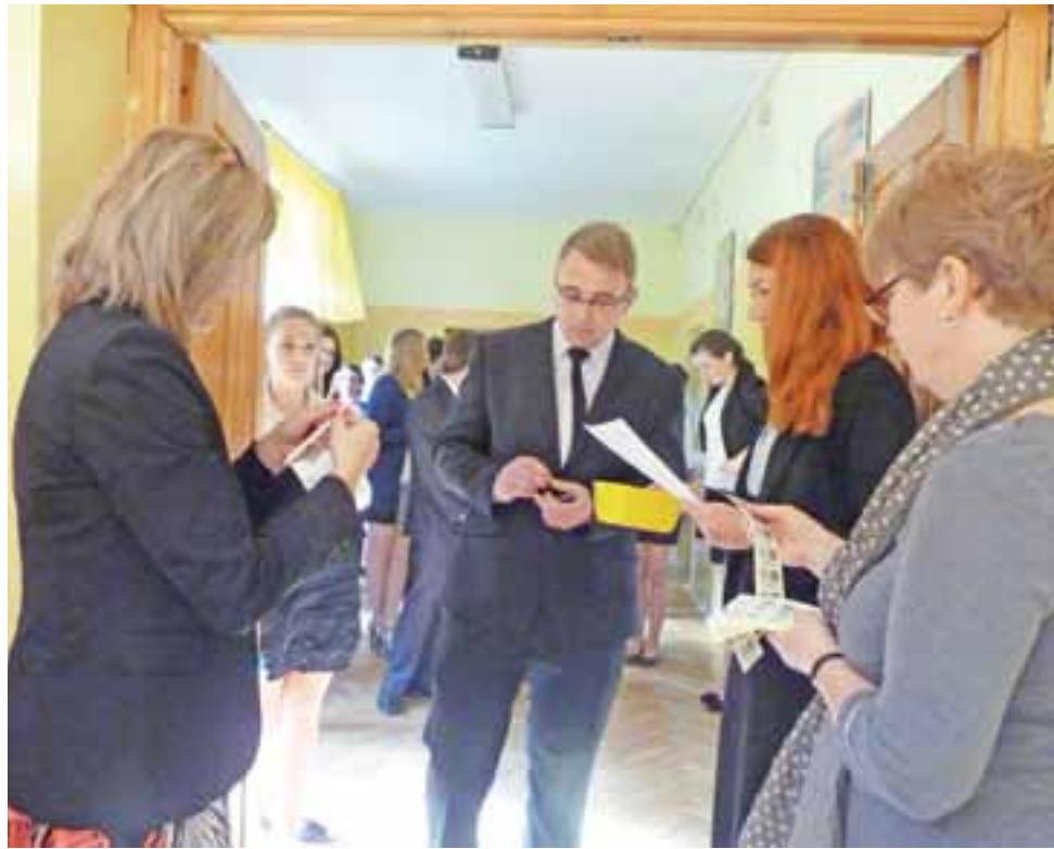
Maturzyści z LO Mickiewicza przed wejściem na salę losowali miejsca na egzaminie.