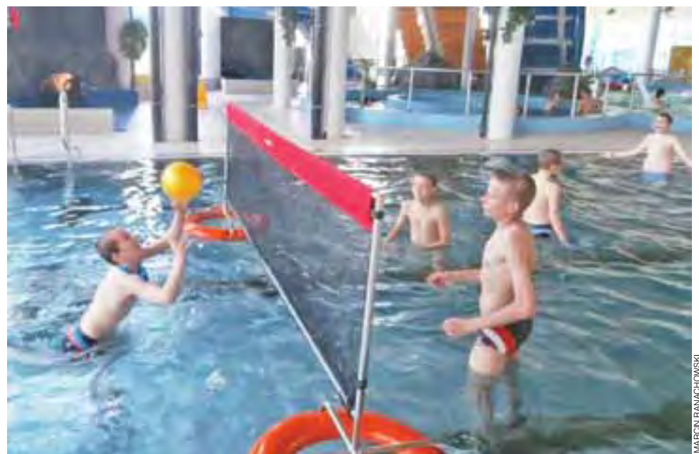
Uczestnicy wyjazdu do Aquaparku w Kutnie podczas gry w siatkówkę w basenie.

Wyjazd ten był częścią zadania publicznego pn. „Zadbaj o formę-przewyciężaj słabości” – realizowanego przy wsparciu finansowym z budżetu Gminy Żychlin. mr