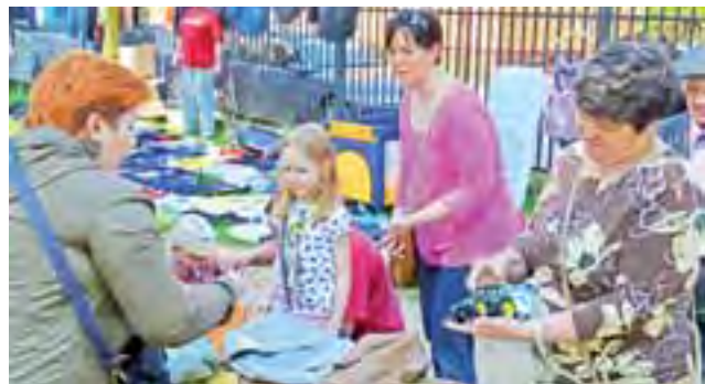
Nieważne czy dla sprzedających czy dla kupujących – wyprzedaż była okazją do zabawy dla całych rodzin.