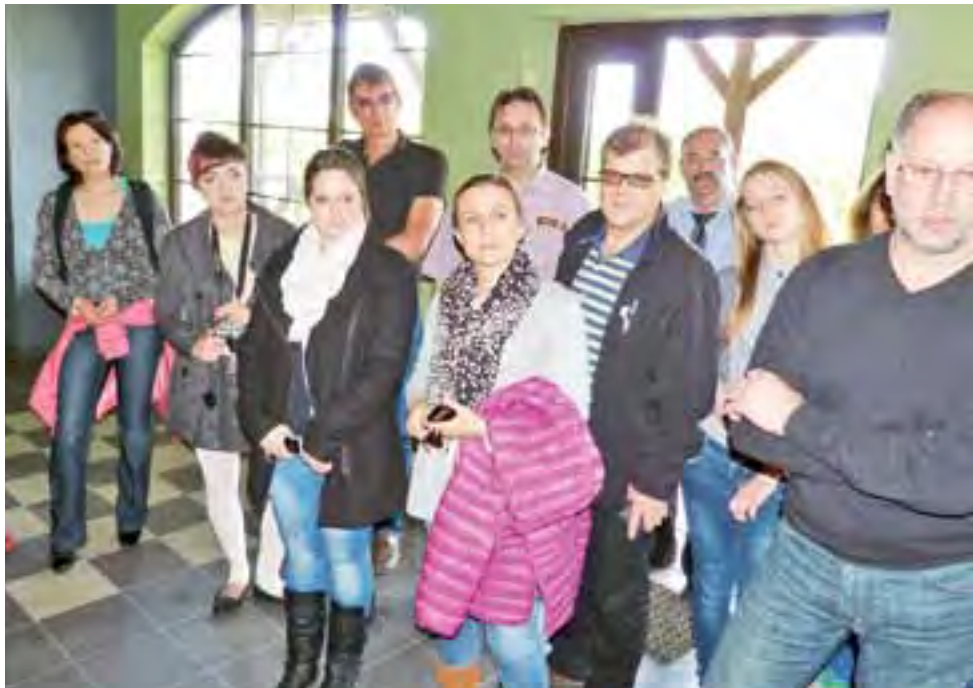
Grupa z zainteresowaniem zwiedziła Browar Bednary, wyrażając duże zdziwienie, że firma otrzymała dotację z PO Ryby, w którym nie chodzi o rozwój rybactwa, ale o działalność będącą alternatywą dla niej.