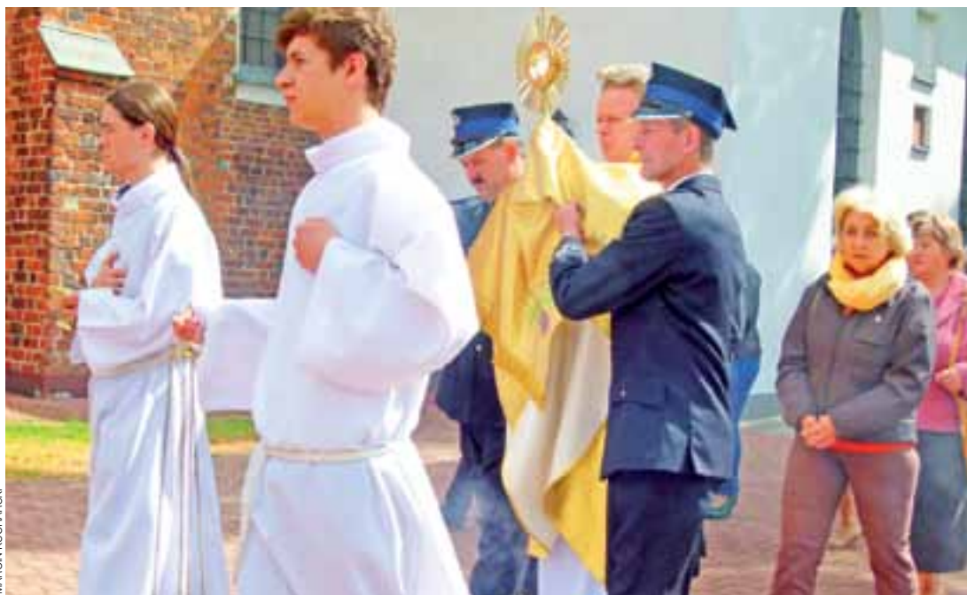
Asystę procesyjną po mszy św. w kościele św. Ducha stanowili strażacy w galowych mundurach.