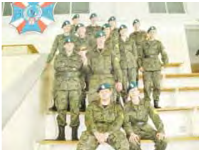
Drużyna LO im. A. Mickiewicza w Żychlinie.