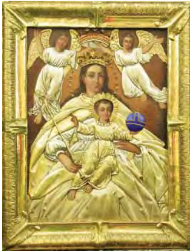
Obraz Najświętszej Maryi Panny Suserskiej, który 15 sierpnia zostanie koronowany na prawach papieskich.

Obraz spełniał trzy warunki: jest to obraz starożytny, otoczony nieprzerwanym kultem i są z nim związane nadzwyczajne wydarzenia.