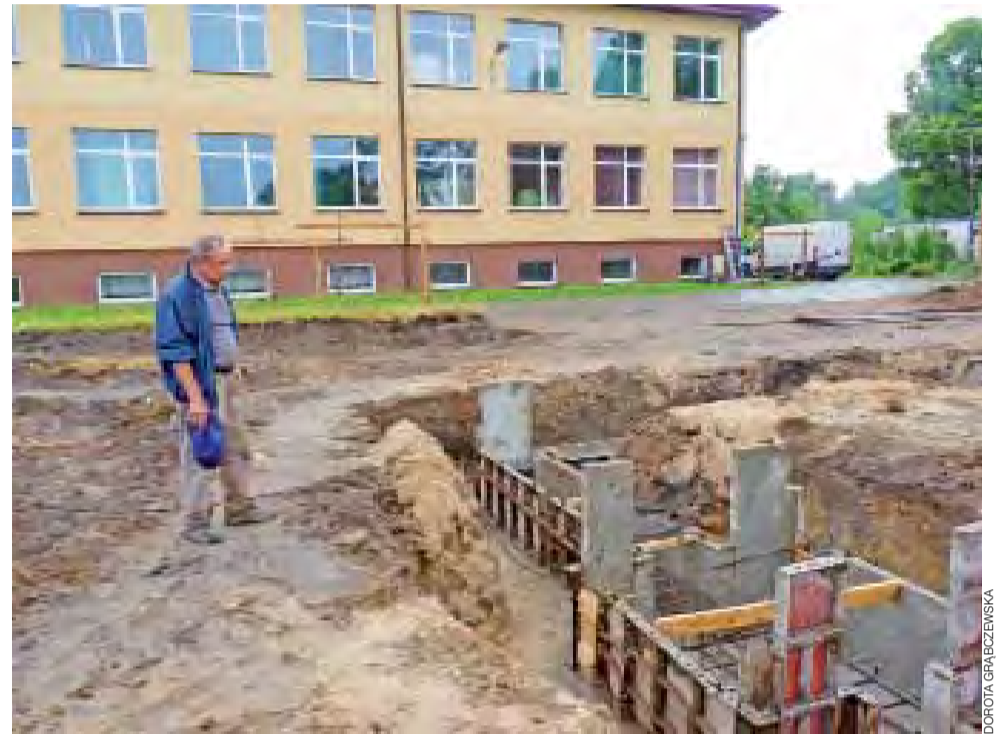
Salę gimnastyczną przy Zespole Szkół w Oporowie buduje gostyniński Hydropol. Przygotowano już szalunki pod wylewanie stóp i ław fundamentowych, które w tym tygodniu miały być zrobione.

Jak wyjaśnia nam majster budowy, po wylaniu ław i stóp będzie ocieplanie i izolowanie wylanych elementów, później musi iść izolacja pozioma, by wreszcie przystąpić do wylewania właściwych fundamentów. Jeśli aura pozwoli, to ściany będą murowane w połowie sierpnia.