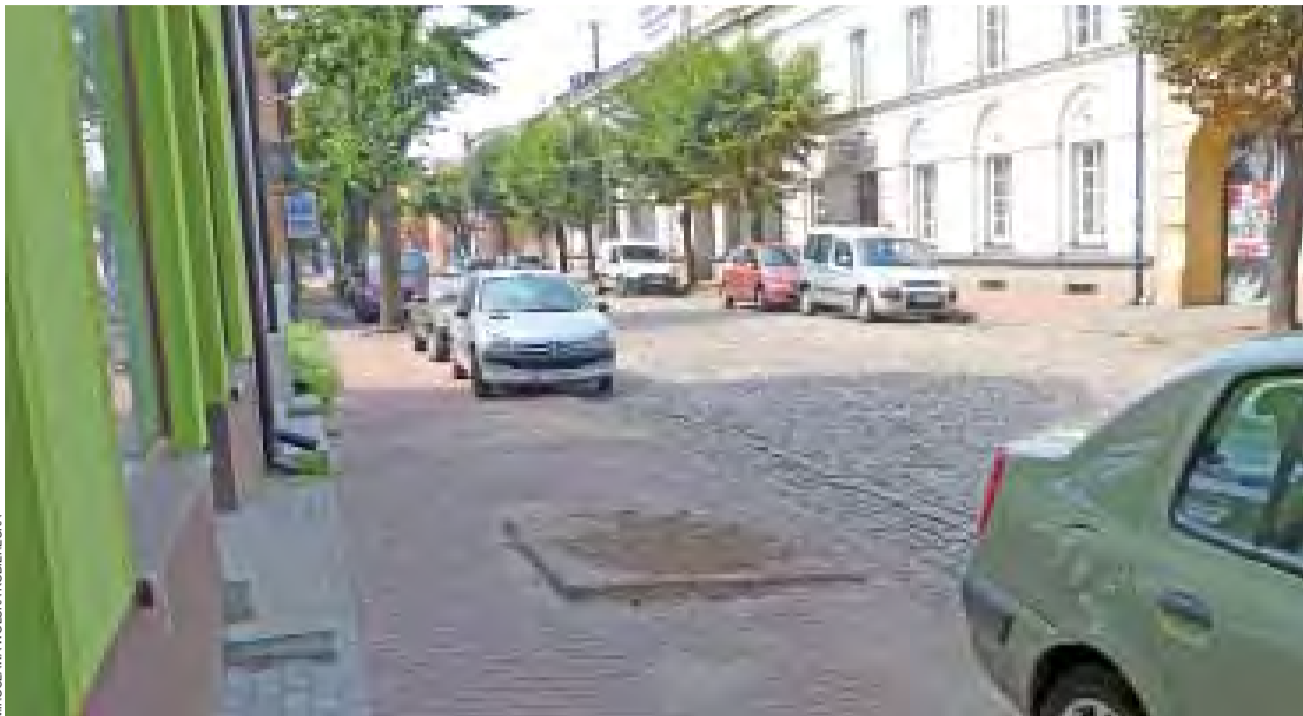
Miejsce po drzewie naprzeciwko ŁOK zajmuje dużą część szerokości chodnika. Nowe drzewko ma być tu posadzone jeszcze w tym roku.