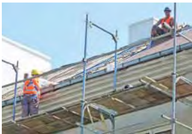
Trwają prace przy układaniu papy termozgrzewalnej.

I znów inwestycja będzie rozłożona w czasie, bowiem powierzchnia do skucia jest bardzo duża.