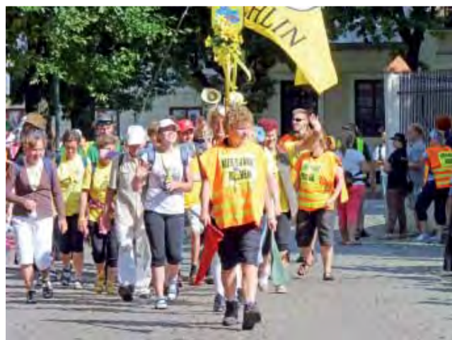
Grupa Cytrynowa wyruszyła z Łowicza jako trzecia.

Reklamy ramkowe można zamawiać kontaktując się z naszym działem reklamy: reklama@lowicznanin.info, Łowicz, Pijarska 3a, tel. 46/837-46-57, kom. 500-105-696.