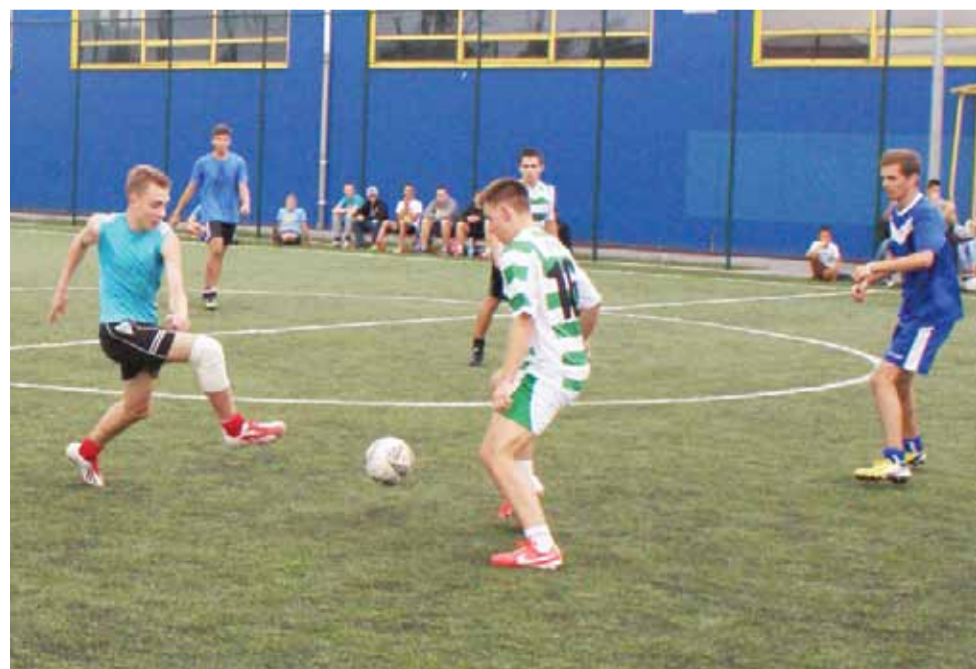
Jeden z meczów trzeciej kolejki ŻOLPN: Young Dream Team kontra Gladiatory z Miasta Noży.

Sześć osób z Piły wyruszyło na wyprawę rowerową, planując do przemierzenia w ciągu 12 dni ponad 400 km. Na trasie śmiazków znalazło się także Kuno i Żychlin. Rowerzyści wyruszyli w niedzielę rano – 3 sierpnia, z Kutna. W Kutnie przyłączyli się do nich rowerzyści z miasta powiatowego, którzy pojechali razem z pilanami z Kutna, przez Oporów - do Żychlina. Przy okazji rajdu rowerzyści zwiedzają najciekawsze miejsca, które mijają na trasie wyprawy. Każdego dnia rowerzyści z Piły planują pokonać na rowerze ok. 70 km. Ze Żychlina pojechali do Wyszogrodu. mr