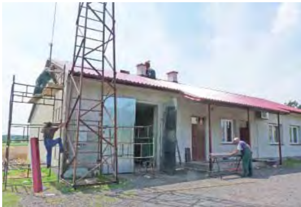
Gdy byliśmy w Orłowie Kolonii, firma kończyła robienie dachu, przed nimi była elewacja budynku.

Gmina Bedno | Nowe dachy w Orłowie Kolonii i Mirosławicach