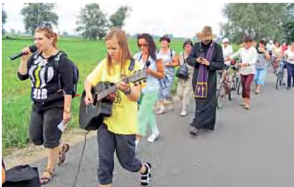
5 sierpnia Grupa Cytrynowa wyruszyła do Częstochowy. Przed pątnikami 10 dni pielgrzymowania.

parę kilometrów, inni aż do Łowicza. Wielu z nich z różnych powodów nie może pielgrzymować przez 10 dni, jednak chce choć przez jeden dzień poczuć atmosferę pielgrzymki.