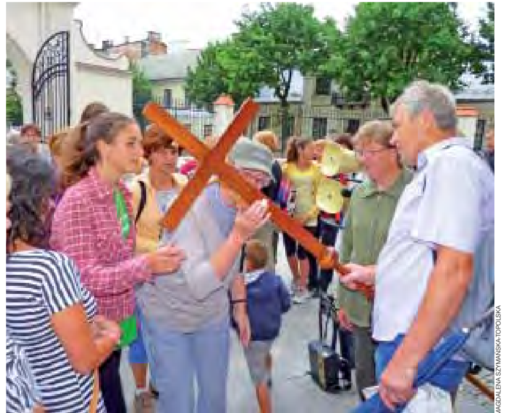
Tuż po zakończeniu mszy św. pątnicy całowali krzyż, który był niesiony na czele pielgrzymki.

Nowy program nauczania religii wszędzie będzie obowiązywał od 2015 r., dlatego wszystkie dzieci w Polsce przystępować będą do I komunii św. ponownie w 2017 r. One wszystkie będą mieć katechezę już według nowego programu. mwk