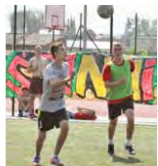
FC Łowicz nie przegrał w Warcie żadnego meczu.