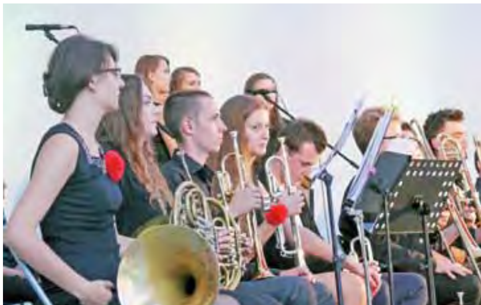
W skład orkiestry wchodzi około 60 młodych i utalentowanych osób, na zdjęciu sekcja dęta.