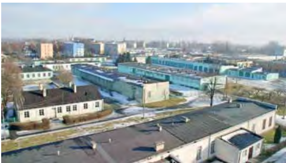
Teren byłej jednostki wojskowej w Łowiczu zajmuje blisko 6 hektarów i stoją na nim łącznie 32 budynki w różnym stanie technicznym.

Burmistrz zaprzeczył też, jakoby kiedykolwiek mówił, że wyburzenie znajdujących się na terenie jednostki budynków mia-