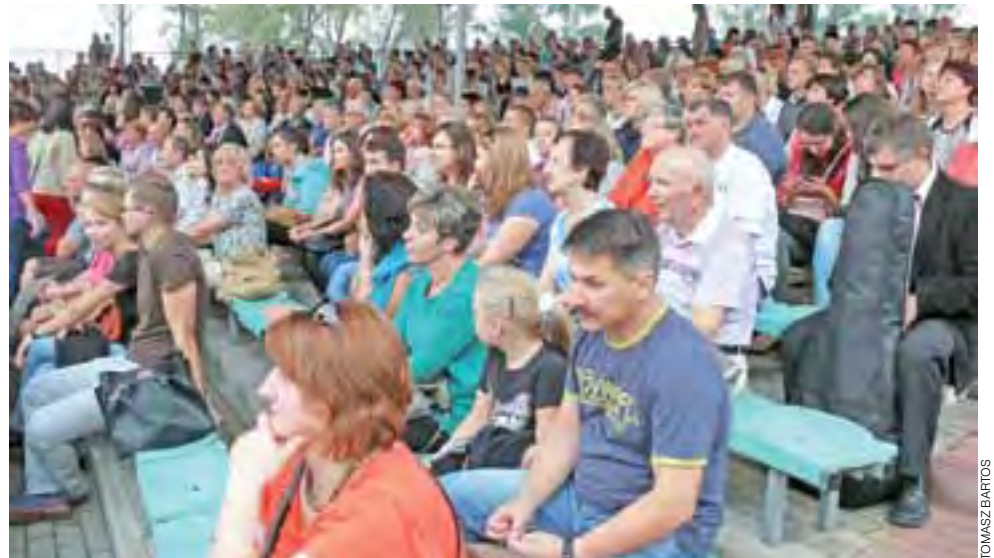
Widownia, podobnie jak rok temu, kiedy Sonus grał muzykę filmową, wypełniła się do ostatniego miejsca.

Łowicz | Koncert na muszli, z oświadczeniami w tle