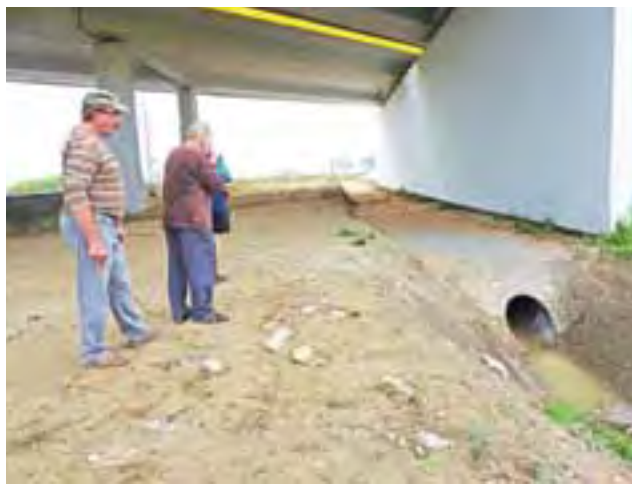
Niecały miesiąc temu otwarty rów pod wiaduktem A1 został przykryty. Ułożono rurę o średnicy 80 cm, ale gołym okiem widać, że nie ma zachowanych odpowiednich spadków, gdyż woda u wejścia do rury stoi nawet po małym deszczu.