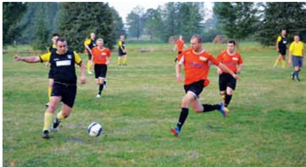
W wyjazdowym meczu drużyna GKS Bedno pokonała Magnat Sierpów 2:0.