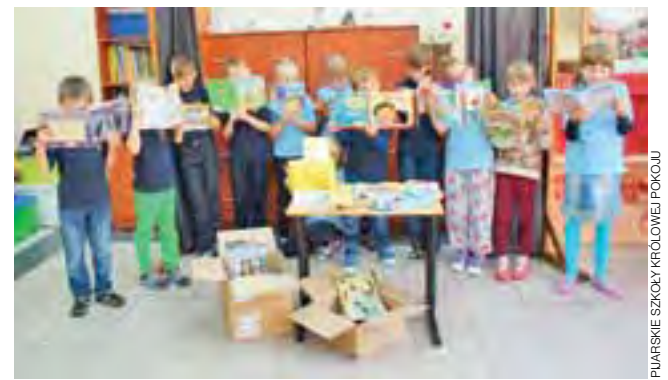
Uczniowie Pijarskiej Szkoły Podstawowej w Łowiczu z książkami z Ameryki.