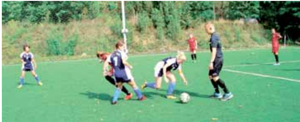
Mimo zaciętej walki, drużynie dziewcząt z Gimnazjum Żychlin nie udało się awansować do rozgrywek finałowych w Orlikowej Lidze Mistrzów w piłce nożnej.