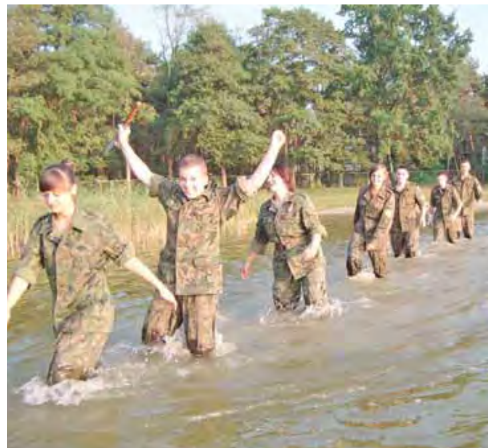
Grupa mundurowa z LO im. Adama Mickiewicza podczas biwaku w Koszelówce. W dniach od 19 do 21 września młodzież grup mundurowych z poszczególnych klas liceum wzięła udział w biwaku, podczas którego zaprawiała się w rzemiośle żołnierskim.