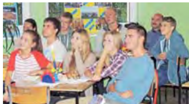
Pograżeni we wspomnieniach uczniowie oglądają prezentacje.

Uczniowie mieli też za zadanie przeprowadzić wywiady z mieszkańcami Zemplinskiej Sirawy na temat ich trybu życia, aktywności