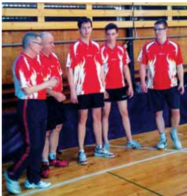
Zespół Księżaka Łowicz trzeciego sezonu rywalizuje w II lidze.

Pozostałe wyniki meczy 1. kolejki IV ligi: KS Elta II Łódź – UKS Fungis II Maków – 1:9, WKS Proсна Wieruszów – LKS Jutrzenka II Bychlew – 8:2, ULKS Moszczenica – MKS Jedynka Łódź w innym terminie i mecz LKS Astoria Szczerców – KTS Sieradz odbędzie się 26. września. zł