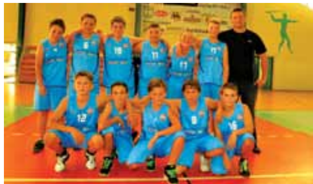
Ekipa Księżaka Łowicz z rocznika 2002 z trenerem.

■ Melo Błonie – GTK Głowno 35:62 (23:5, 11:12, 18:13, 10:5)