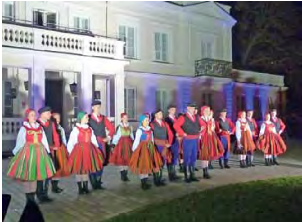
Na uroczystości nie mogło zabraknąć Regionalnego Zespołu Pieśni i Tańca Sanniki, który po występie zebrał gromkie brawa.