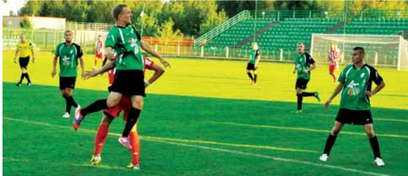
W meczu z Pogonią Grodzisk Mazowiecki nie brakowało twardej walki.

Tak się jednak nie stało. Przed pierwszym gwizdkiem sędziego na trybunach nie zasiadało nawet 100 widzów. Również niektóre z osób pełniących ważne funkcje na meczach dowiedziały się o tym w ostatniej chwili. Spiker zawodów dostał telefon z klubu na dwie godziny przed pierwszym gwizdkiem sędziego, a i „noszowi” dowiadawali się od osób trzecich. W przerwie wiele osób doszło, ale byli oni mocno zdziwieni, gdy dowiedzieli się, już na trybunach, że zjawili się w przerwie spotkania, a nie chwilę przed jego rozpoczęciem. Oczywiście musieli zapła-