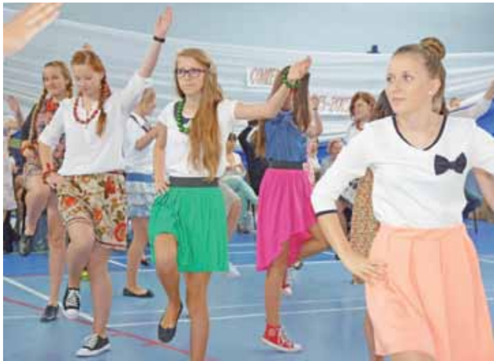
Uczniowie z Gimnazjum w Bedlni w tańcu ludowym „Zasiali górale”.

Poniedziałkowe przedpołudnie goście z 4 krajów Europy spędzili w gimnazjum w Be-