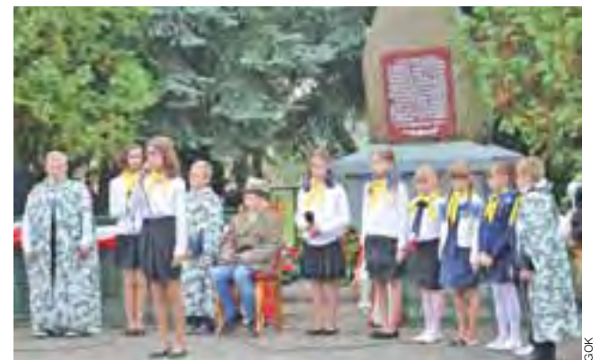
Montaż słowno-muzyczny zaprezentowali uczniowie z Szewc Nadolnych.

złożono biało-czerwone wiązanki, a młodzież z Szewc Nadolnych przygotowała montaż słowno-muzyczny. dag