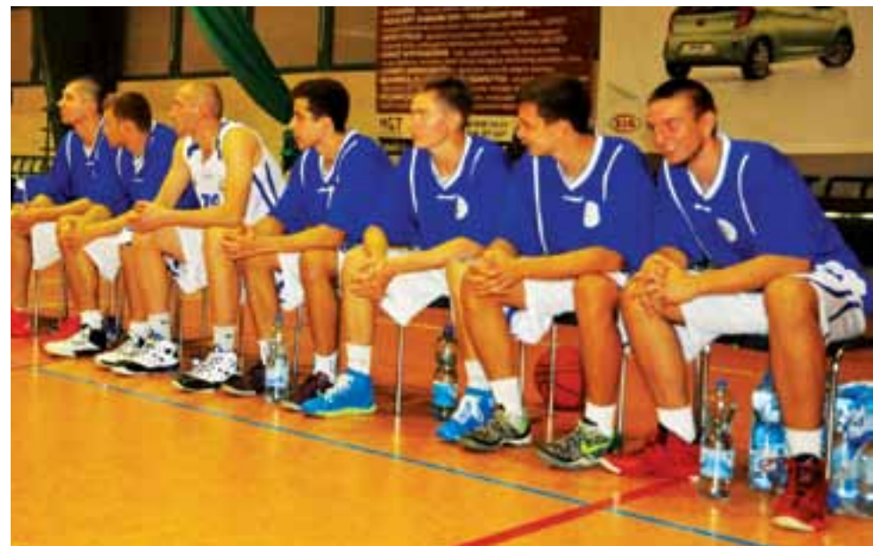
Księżak już czeka na inaugurację II ligi.

Koszykówka | Przygotowania KS Księżak do II ligi