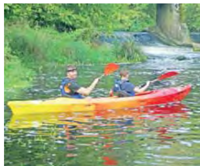
Wychowankowie MOS w Kiernozie po raz pierwszy pływali kajakami, ale chyba nie ostatni. Taka forma turystyki spodobała im się.