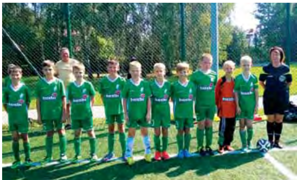
Młodzi zawodnicy z Pelikana 2004 często trafiają do bramek rywali.

Piłka nożna | Skierniewicka Liga Orlika E 1