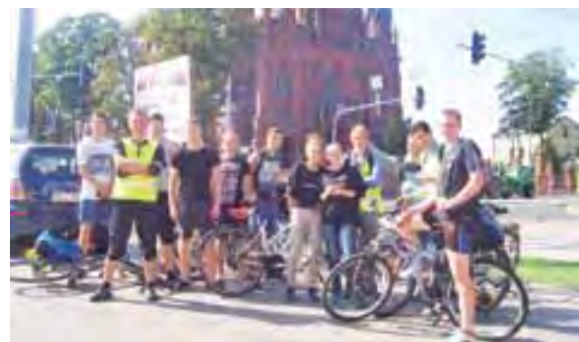
Grupa rowerzystów przed kościołem w Zdunach.