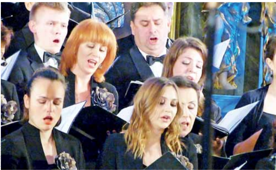
Chór Filharmonii Łódzkiej nie ma tak długiej historii jak cała filharmonia, ale 45 lat to też piękny wynik.

Łowicz | Koncert muzyków Filharmonii Łódzkiej