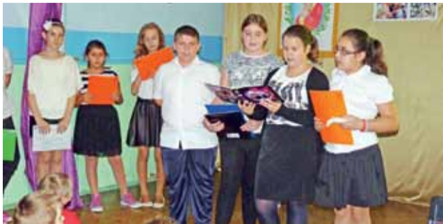
Uczniowie klasy V z SP 1 zaprezentowali montaż słowno-muzyczny.

Po nim wystąpi kabaret Bi-Ba-Bo – to najstarszy łódzki kabaret istniejący od 1972 roku składający się z emerytów i rencistów. dag