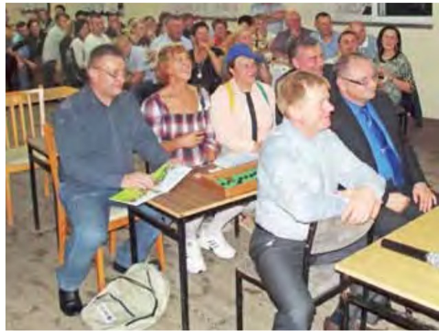
Lekcja o ziemniaku. Program kabaretowy z udziałem gości.