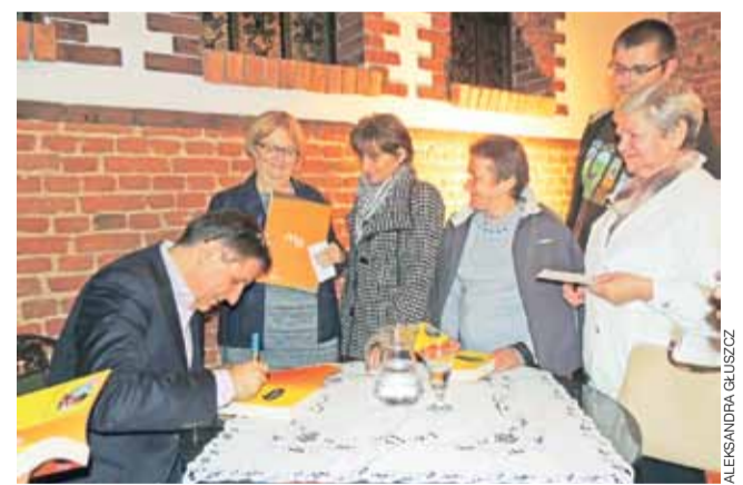
Chwila dla fanów (zdjęcie po prawej).

Do Kabulu w Afganistanie leciał 17 godzin. Grozę sytuacji odczuł, gdy miał lecieć, już w Afganistanie, helikopterem do polskiej bazy przez wąski wąwóz. Pokazano mu guzik w helikopterze, który ma nacisnąć, gdyby spadł, a on by przeżył, guzik ten zniszczy w ciągu dwóch minut helikopter, ale jednocześnie włączy system naprowadzający na miejsce Amerykanów. Potem było szkolenie jak ma się położyć i czekać na ratunek i absolutnie nie może siedzieć czy wstać,