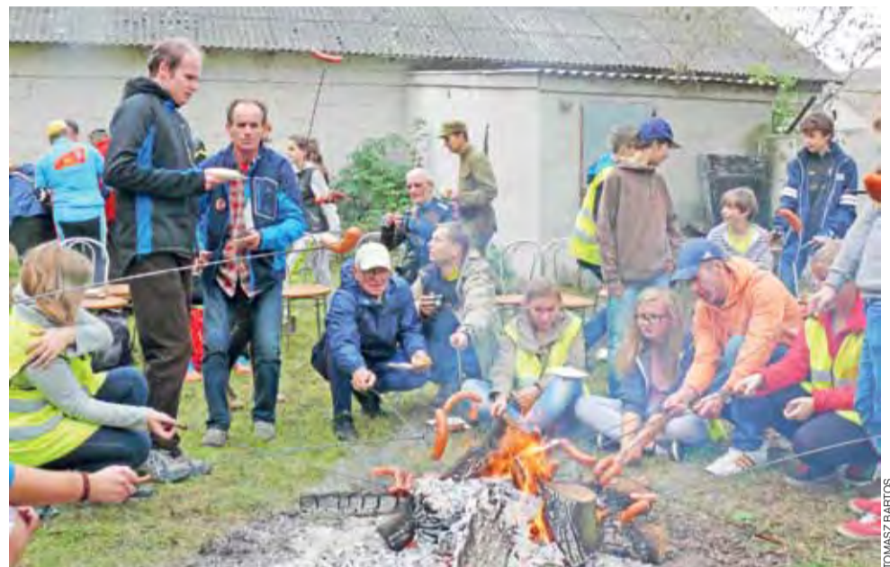
Po niedzielnych uroczystościach przy pomniku cichociemnych rajdowicze spotkali się przy ognisku na terenie strażnicy OSP w Czatolinie.

Nie tylko jednak Cichociemnym poświęcony był rajd,