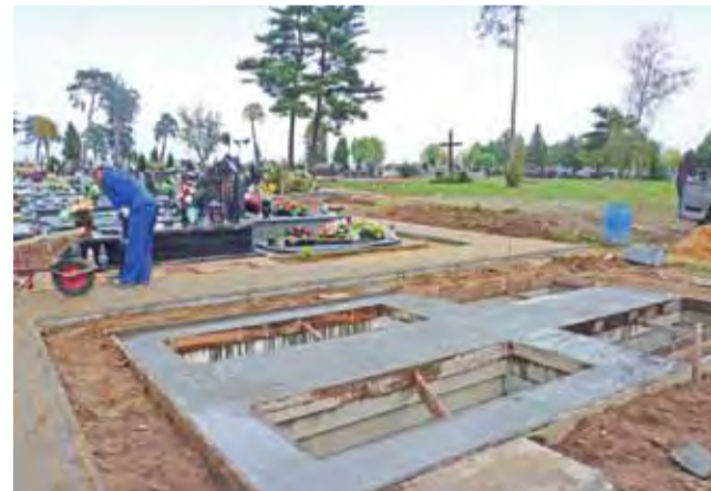
Aleiki na nowej części cmentarza zostały zrobione. Teraz trwa budowanie piwnic grobowych wzdłuż alejek.