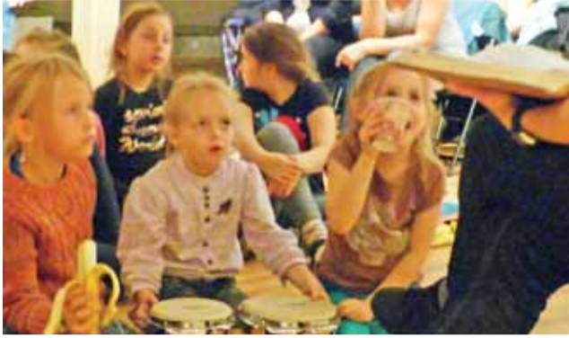
Dzieci z zaciekawieniem słuchają jednej z trzech historii.