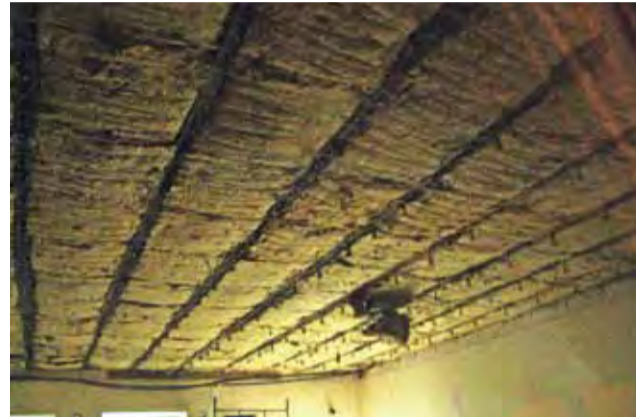
Tak dziś wygląda sufit. Wełna mineralna, zapewne pod ciężarem wody, też się wybrzuszyła.

Błędem urzędników było to, że inwestycję zaczęto nie od tej strony, co należało. Pierwszy