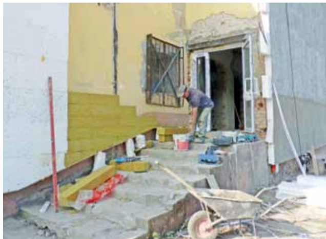
Dwuetapowa modernizacja budynku po dawnym kinie Lech na potrzeby sali gimnastycznej będzie opóźniona. Termin zakończenia prac to 17 października, a prace sporo do wykonania na zewnątrz i wewnątrz budynku.

W tym roku zakres prac nie uwzględniał budowy bieżni i urządzeń lekkoatletycznych. Na razie w jej miejscu posiano trawę, by obiekt sprawiał este-