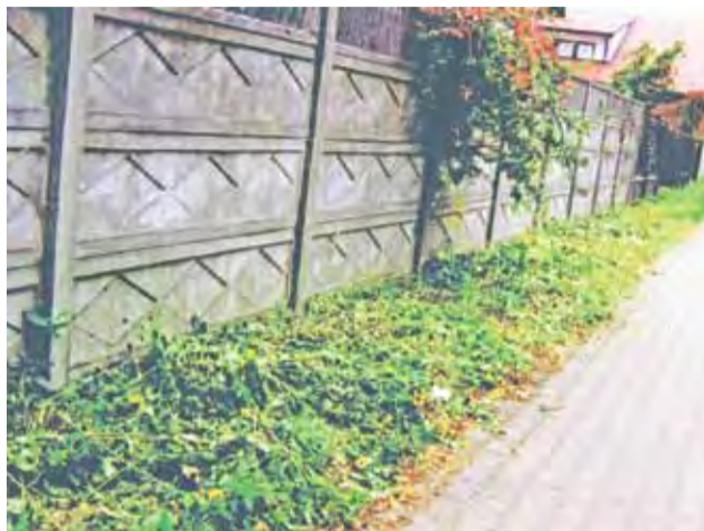
Wycięte przy chodniku rośliny odsłoniły betonowe ogrodzenie nieruchomości przy ul. Gen. Kutrzeby, obok zdjęcie takich samych dzierzaw, rosnących w ogródku.