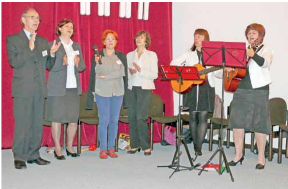
Wspólny śpiew wychwalający Pana to stały element spotkań członków grup Odnowy w Duchu Świętym. Tak też było w łowickim seminarium w czasie kongresu.