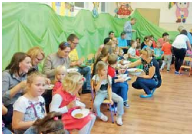
Po emocjach konkursowych przyszedł czas, by zjeść placki ziemniaczane i frytki.

Bohaterem piątkowego spotkania był ziemniak we wszelkich możliwych odsłonach. O ziemniaku opowiadano bajki, śpiewano piosenki, recytowano wiersze. Każdy z konkursów sprawnościowych poprzedzony był rymówką o ziemniaku. Rodzice z dziećmi aktywnie brali