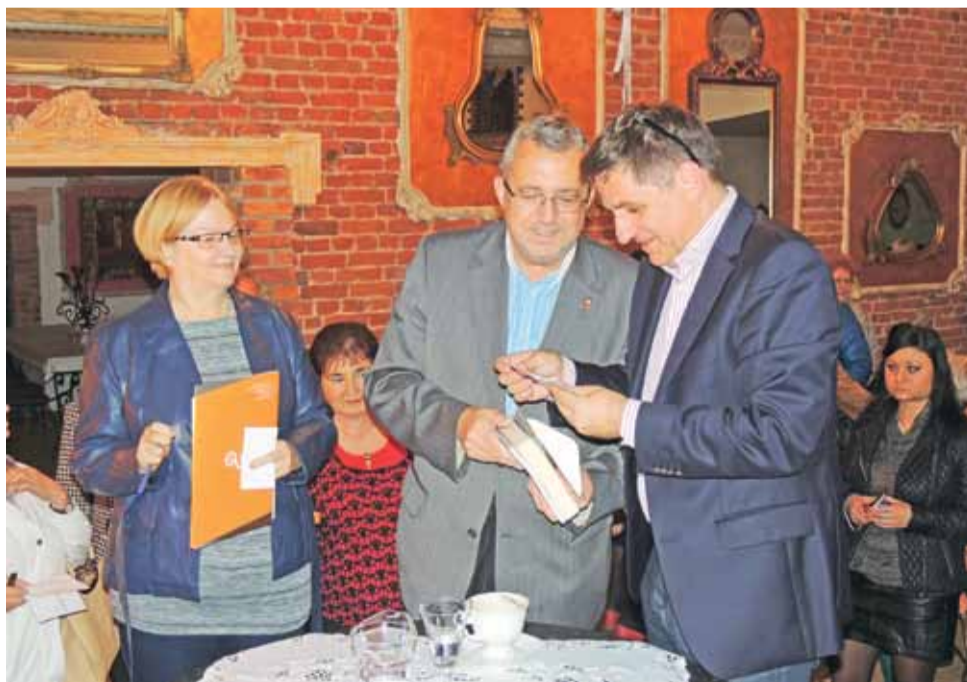
Chwila dla fanów.

– W przerwie w pracy pojechałem do jednej z galerii robić zakupy, wysiadając z samochodu rozmawiałem przez telefon;