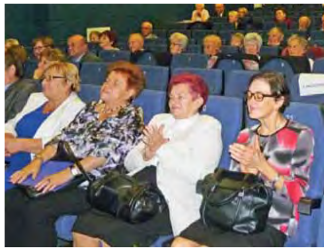
Liczne grono łowickich diabetyków przybyło na spotkanie do kina Fenix.