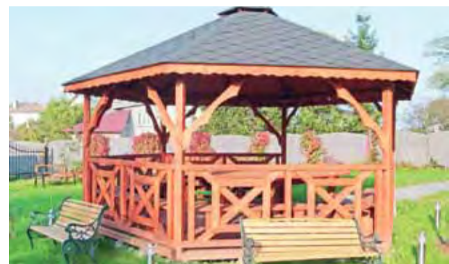
Jest już nowa altana, a także plac zabaw i mini siłownię na powietrzu.