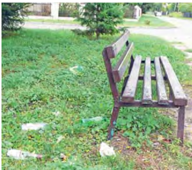
Bałagan przy ławce w sąsiedztwie ulicy gen. Kutrzeby: widać leżące w trawie butelki po alkoholu.

Burmistrz przyznał łowiczanie rację i uznał, że kwiaty te nie powinny nikomu przeszkadzać i dopilnuje, aby ich w przyszłości nie wycinać. – Nie wydałem specjalnego polecenia, aby je wycinać, choć oczywiście ponoszę odpowiedzialność za to, co robione jest na polecenie Urzędu Miejskiego – powiedział nam, oceniając, że być może w tej sprawie była pewna nadgorliwość pracownika. ■