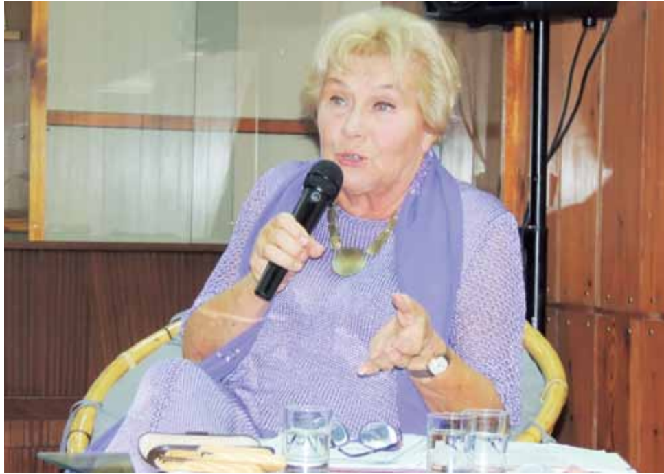
Teresa Lipowska zaskoczyła zebranych swoją energią i zdecydowaniem.

Pani Teresa nie przypominała na spotkaniu Basi Mostowiak i jak sama twierdzi, nie należy ją z nią utożsamiać. – Choć z drugiej strony jestem Basią już 15 lat i po tylu latach scenarzysta piszą trochę pode mnie. A właściwie nie muszę w serialu grać, bo tak jak moja bohaterka kocham