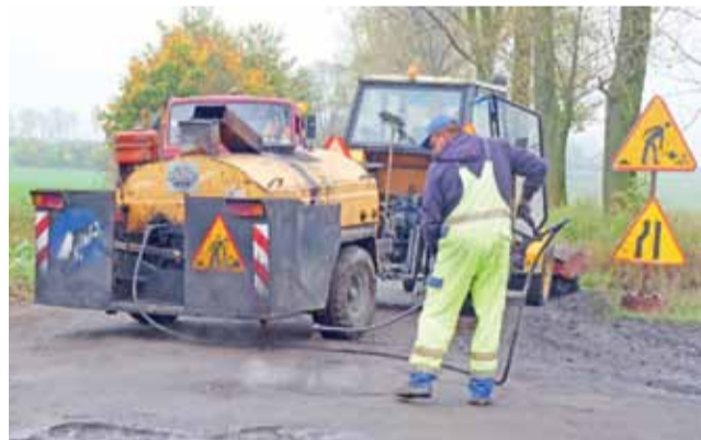
Akurat w dniu protestu mieszkańców gminy Oporów i Żychlin, drogowcy wzięli się za łatanie dziur po minionej zimie.

Mieszkańcy zapowiadają, że środowy protest to dopiero początek walki mieszkańców o godny dojazd do domów. Jeśli nadal nie będzie działania starostwa, będą kolejne protesty. Tym razem rolnicy zapowiadają, że ciągnikami zablokują Kutno i starostwo. ■