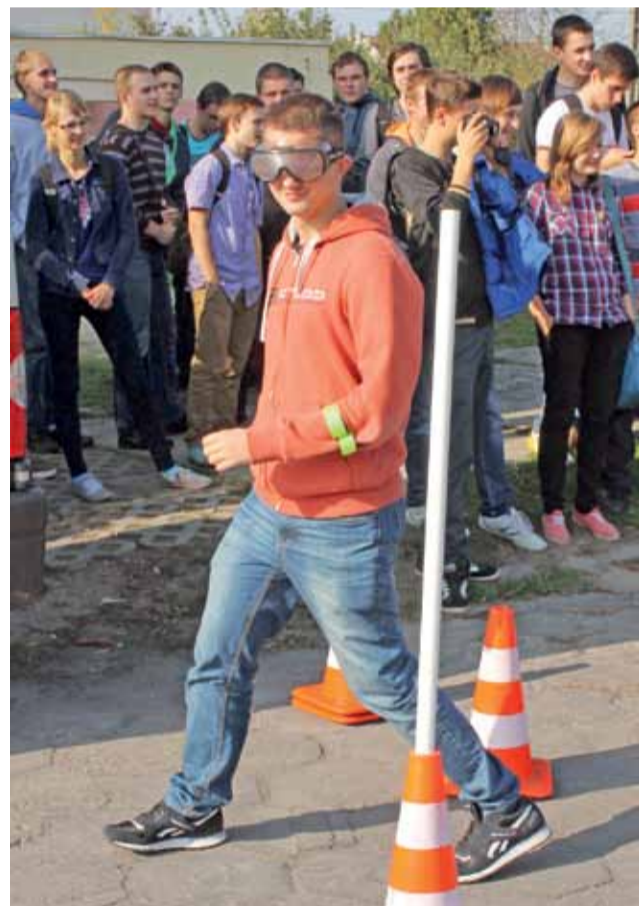
Poruszanie się w alkogoglach na torze przeszkód nie było proste, tak samo jak jazda samochodem.

Takie ćwiczenia pozwalają wyobrazić sobie, jak bardzo zmienia się funkcjonowanie organizmu po spożyciu alkoholu. opr. tb