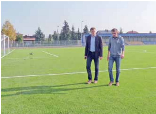
We wtorek rozpoczęto odbiór stadionu miejskiego w Żychlinie.

We wtorek, 14 października rozpoczął się odbiór stadi-