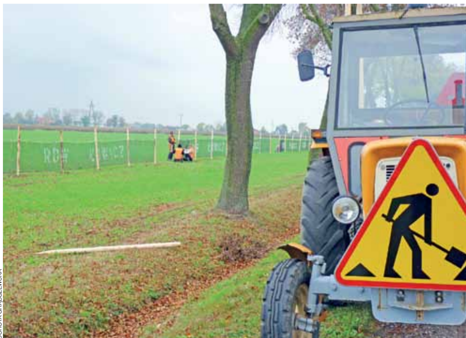
Pracownicy Zarządu Dróg Wojewódzkich przy pracy wzdłuż drogi 573. Pierwszy śnieg może być już niedługo.

Sołectwa: Dębowa Góra, Wewiórz, Głuchów. Kandydaci: 1. Konrad Olejniczak z Józefowa, 43 lata – KW PSL. 2. Tomasz