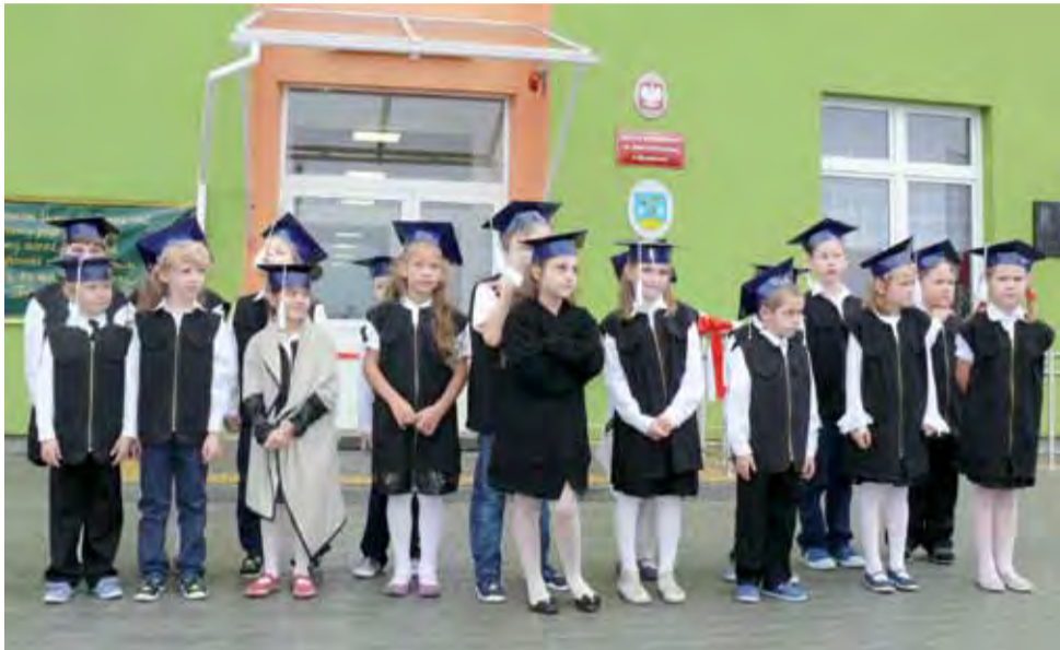
W czasie uroczystości otwarcia szkoły w Mysłakowie był też czas aby 18 uczniów klasy I złożyło ślubowanie.