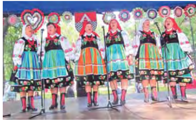
Podczas ostatniego przeglądu w Aleksandrowie Łódzkim III miejsce wyśpiewały Szewcowianki.

20 września zespoły śpiewacze z gminy Bedno po raz pierwszy wystąpiły na Międzypowiatowym Przeglądzie Kapel i Zespołów Śpiewa-