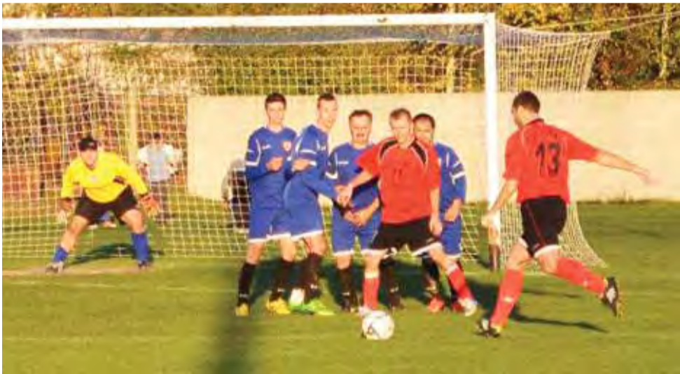
Jedna z wielu akcji GKS Bedno pod bramką Dąbrowianki Dąbrowice.

Następna, 10. kolejka łódzkiej klasy A grupy III odbędzie się w dniu 25 października (sobota), GKS Bedno zagra na wyjeździe z drużyną GLKS Sarnów – na boisku w Dalikowie. mr