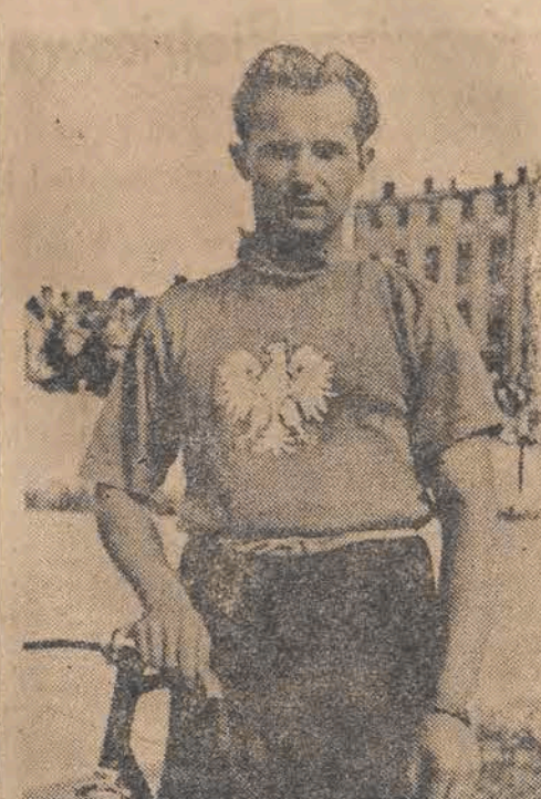
Zeszłoroczny mistrz Polski Kupczak

Ale w mistrzostwach decyduje nie sama szybkość. Kolosalne znaczenie będzie miała tutaj strategia i taktyczne rozwiązanie wyścigu. Na Kupczaka znaleźć skuteczną broń nie jest rzeczą łatwą. W pełni swej formy krakowianin nie tylko posiada doskonałą końcówkę, to znaczy maksymalne wyzbycie z siebie szybkości na ostatnich metrach, ale również dysponuje potrzebną dla sprintera wytrzymałością, o czym przekonaliśmy się w roku zeszłym w Krakowie, kiedy pomimo długiego finiszu narzuconego przez Beka krakowianin potrafił wyminąć go na taśmie.