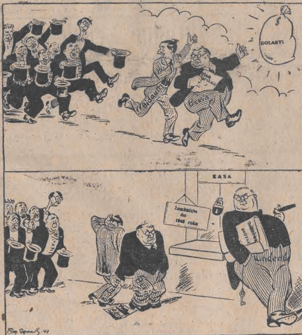
Bieg po dolary zakończył się przed zamkniętą kasą.