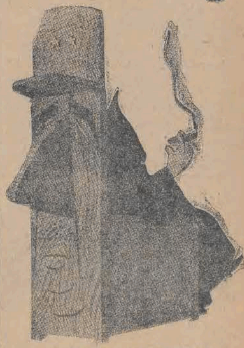
Co kryje się za de Gaulle'm? Najczarniejsza reakcja — faszyzm

PRAGA PAP. Jak donosi dziennik „Prace” silna grupa banderowców, operująca na zboczach gór Popov nad Varną w Tatrach słowackich, usłowała w tych dniach przedrzeć się przez zwarty pierścień czechosłowackich oddziałów wojskowych. W potyczce, jaka się przy tym wywiązała, kilku banderowców zostało zabitych, a kilkunastu wzięto do niewoli. Reszta wycofała się w góry, ścigana przez czechosłowackie oddziały wojskowe.