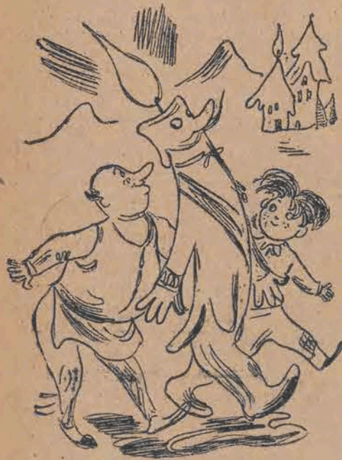
109. Za Gromnica szli ulicą Cała pokapana świeca, A za nimi tłum miejscowy. Same zapalone głowy.