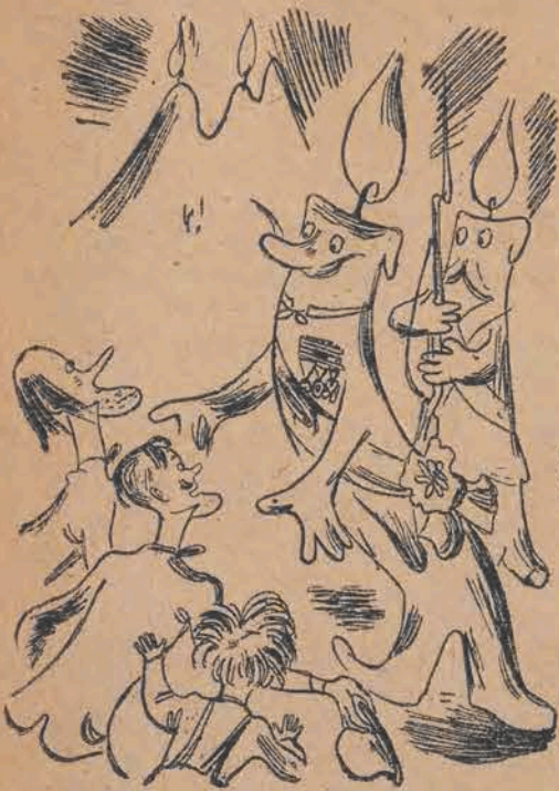
108. Wódz Gromnica, wraz ze swiata, Uroczyscie ich powital, I poprosil, by zechcieli Miasto zwiedzić przy niedzieli.