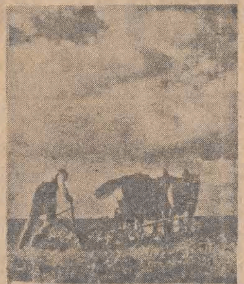
Po żniwach — rolnik zabiera się do nowej pracy

Według tymczasowych wyników nadeszłych z Węgier, jednolity front skupiający w swych szeregach cztery partie demokratyczne Węgier, odniósł zwycięstwo nad partiami pravicowymi, na które stawiali legalni opozycjoniści oraz ukrywający się jeszcze zdrzący reakcyjni. W zwycięskim bloku demokra-