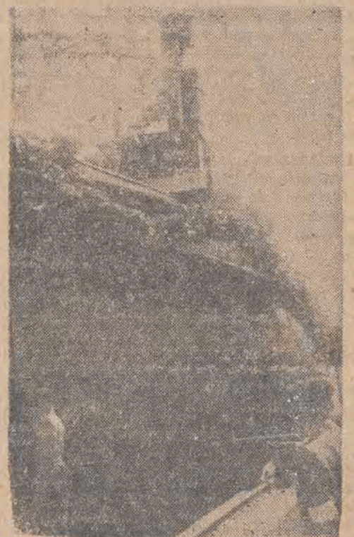
Holownik „Bolesław Chrobry“ zremontowany, na odbudowanej przez Polską Żeglugę na Odrze stoczni „Bałtyk“ w Szczecinie.

Zasada zespołowości jest podstawą pracy robotników „Żegluga na Odrze“. W kompleksie zagadnień bieżącej pracy nie zapomniano również o odcinku społeczno - politycznym. Na terenie przedsiębiorstwa istnieje koło PPR, liczące około 100 członków na ogólną liczbę 400 pracowników. Istnieje świetlica robotnicza. Na nadbrzeżu „Huk“ zorganizowano wzorową łaźnię dla robotników. W kąpielisku Międzyzdroje „Żegluga“ posiada specjalne domy wypoczynkowe dla swoich pracowników.