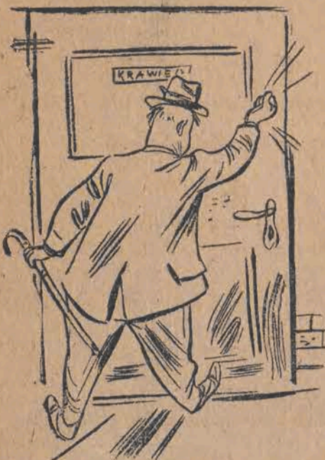
5. I dopiero kiedy klient, groźnie w drzwi pięściami bije.