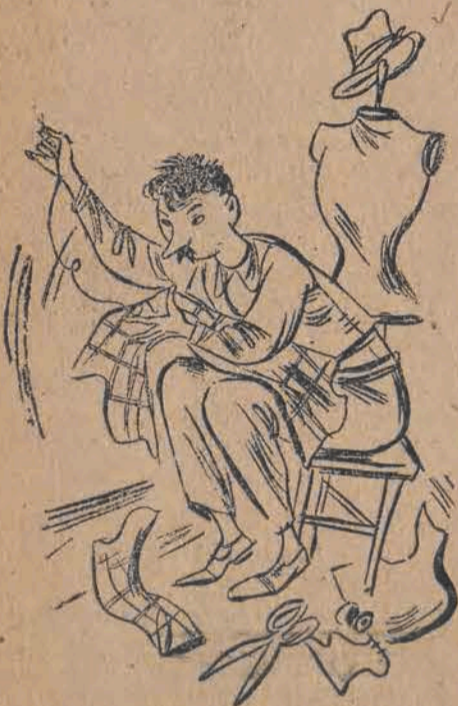
6. Jan nawleka przedko igłę, Tempo pracy niedościgłe.