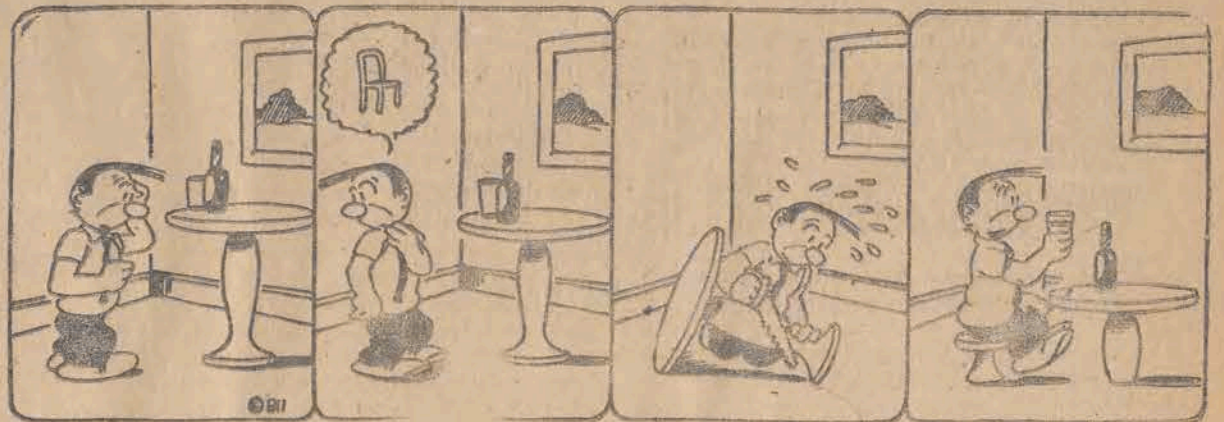
Za wysoki stolik!