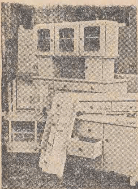
Ten piękny białokremowy komplet mebli kuchennych kosztuje 27 tysięcy złotych na 9-miesięczne spłaty

Staniały meble - w Centrali Przemysłu Drzewnego Łódź