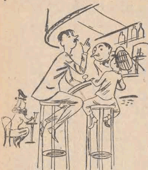
30. — Kupię Ci z łososiem bułkę, potem zawiążemy spółkę!