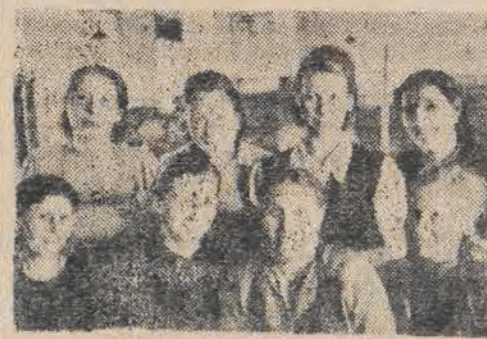
Przodownicy Tkalni Nr 4

Wciąż jeszcze znajdują się w Łodzi nieczynne krosna i wrzeciona. Dla uruchomienia potrzebni są tkacze i przadki. Przemysł włókienniczy dotkliwie odczuwa brak wykwalifikowanych robotników. Rzecz prosta, że w tej sytuacji przejście na większą obsługę maszyn przyczynia się natychmiast do znacznego wzmożenia produkcji. W ostatnich tygodniach — piszemy o tym codziennie w naszej gazecie — liczba ochotników, zgłaszających się do większej obsługi maszyn, wciąż wzrasta. Na-