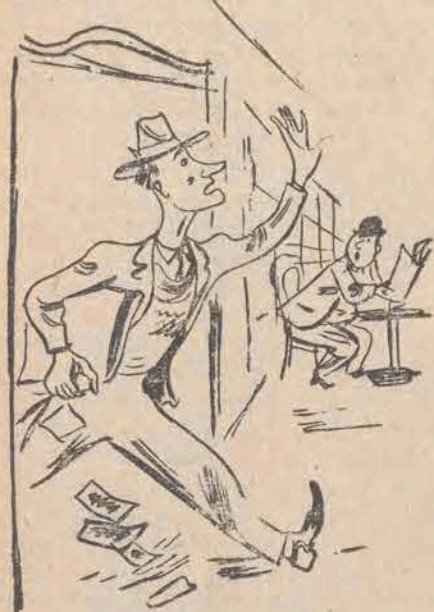
31. Nagle ktoś do baru wpada — Dolar spada! Białda Białda!