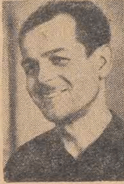
ob. Błaszczyk 203 proc. normy