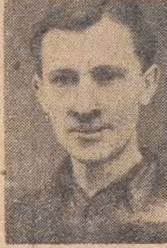
tow. Marusik 300 proc. normy

„Robotnicy z PFAE, przystępując do współzawodnictwa pracy (patrz „Głos Robotniczy” z 13, 11. br.), powiedzieli: „Wyścig uda się, jeśli Wi-Fa-Ma dostarczy nam na czas odlewów”. Nie obyło się bez zastrzeżeń pod adresem Włodzkiej Fabryki Maszyn. Robotnicy z PFAE wiedzieli jedno — że brak jest odlewów i zbyt pochopnie wyciągnęli wniosek: „Wi-Fa-Ma nie najlepiej pracuje”.