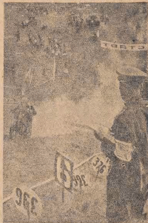
Wielką popularnością cieszy się w ZSRR sport motocyklowy. Oto fragment z wyścigu terenowego z przeszkodami, odbywającego się rok rocznie pod Moskwą.