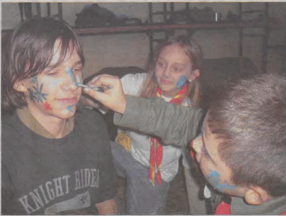
Atrakcją dla zuchów była możliwość pomalowania starszych kolegów.

Dzięki temu zwiadowi harcerze dowiedzieli się między innymi iż nazwa miejscowości pochodzi od braci Żelazkowskich, którzy mieli tu swój pałacyk i którzy byli fundatorami odnowienia miejscowego kościoła po pożarze. W miejscowości tej mieszkała też w leśniczówce pisarka Maria Rodziewiczówna. Tutaj zmarła i została pochowana, dopiero po jakimś czasie ciało pisarki przeniesiono na cmentarz na Pową-