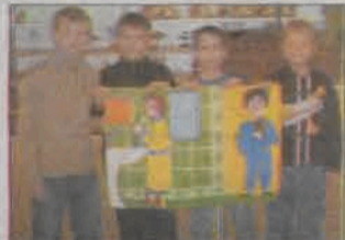
Absolwenci przedszkola podczas warsztatów plastycznych tworzyli takie obrazki.

Najmłodsi pod okiem wychowawczyń mogli zwiedzić placówkę, zobaczyć wszystkie sale i pomieszczenia. Dla starszych przygotowano ciekawą ofertę - warsztaty komputerowe, warsztaty plastyczne, w ramach których wykonywano między innymi pracochłonne obrazki z powija-