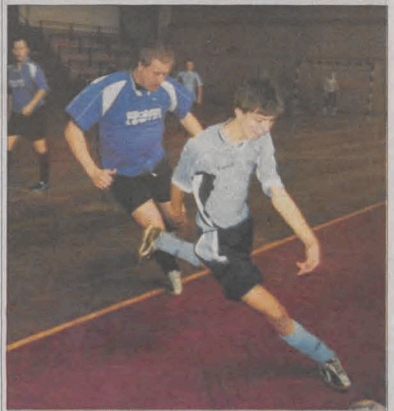
Agros znowu wygrał i wciąż zespół ten ma spore szanse na awans.