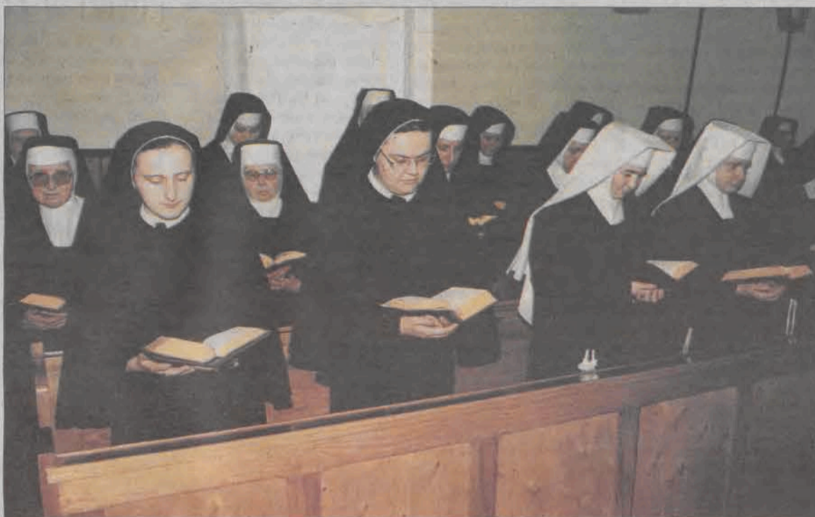
Bernardynki trzy razy w ciągu dnia oddają się wspólnej modlitwie.

Dopiero po profesji czasowej następuje profesja wieczysta, poprzez złożenie ślubów wieczystych - tych samych co we wcześniejszym okresie, jednak tym razem już na całe życie. Podczas składania ślubów