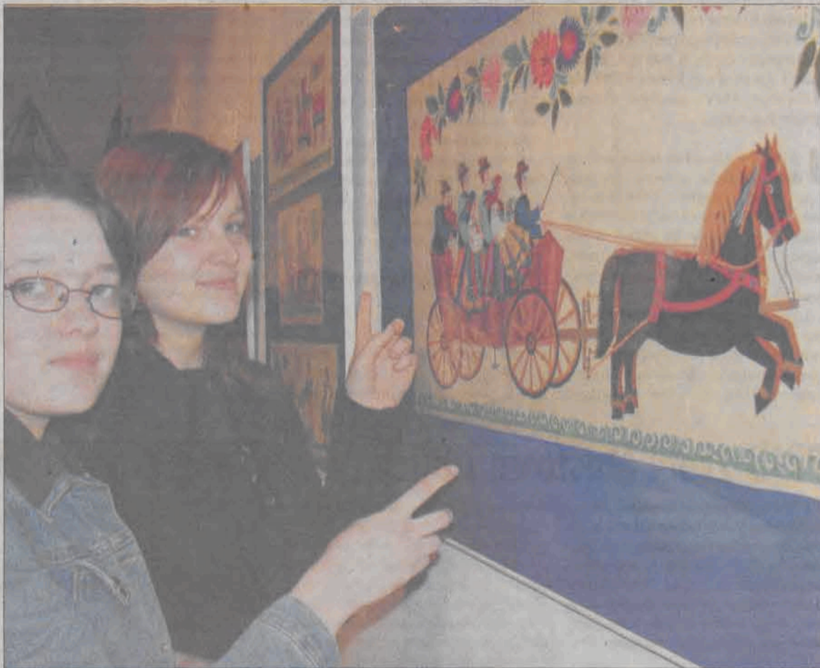
Wycinanki, które niedawno można było oglądać w łowickim muzeum, prezentowane będą w Bułgarii.