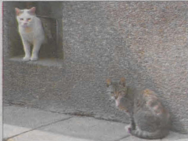
Koty na osiedlu Tkaczew czeka sterylizacja, zapobiegnie to ich nadmiernemu rozmnażaniu.

noszonych przez te zwierzęta - powiedziała.