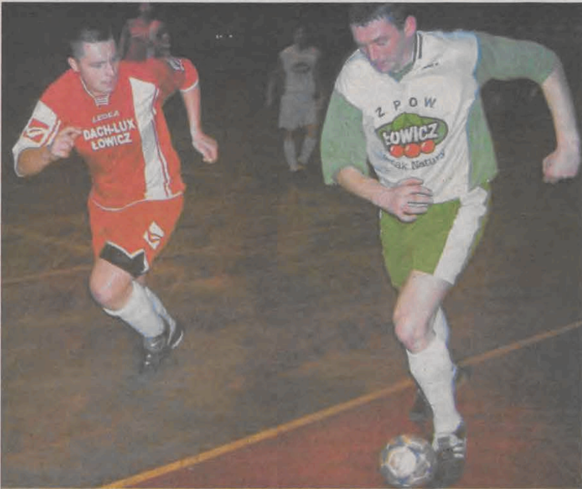
W ostatnim meczu tego sezonu Dagram-AT wygrał z Dach-Luksem aż 8:5.