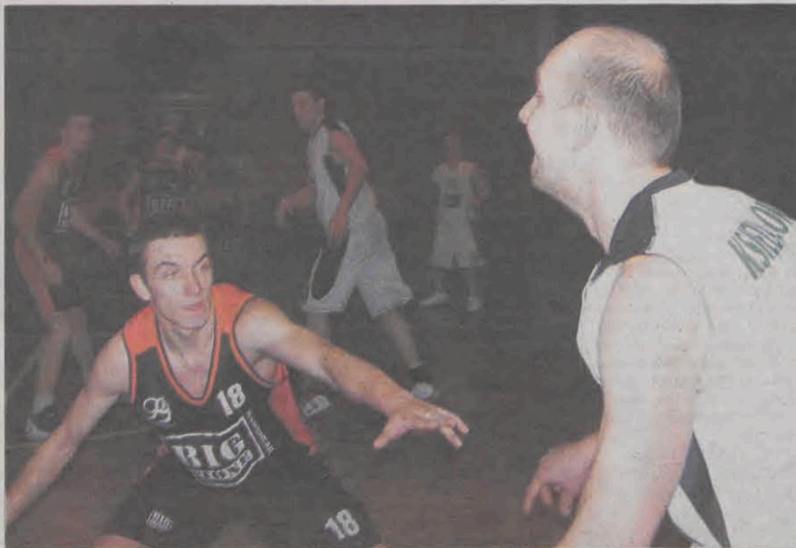
Koszykarze Księżaka zagrają już na pewno w finale rozgrywek wojewódzkich oraz pod koniec marca w turnieju strefowym w Bydgoszczy.

Koszykówka - drugi mecz półfinałów play-off III ligi ŁZKosz