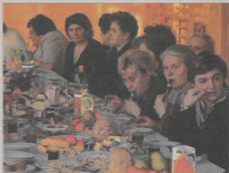
Panie z Kół Gospodyń Wiejskich z terenu gminy Kocierzew spotkały się przy suto zastawionych stołach.

zajęcia z grami stołkowymi. Codziennie czynna jest biblioteka, czytelnia internetowa, wypożyczalnia kaset wideo, bilard. W czasie ferii codziennie w 2 gry przy stole bilardowym zagrać można bezpłatnie. Korzystać można też z Dartsa i gier TV. Odbywają się zajęcia gry w szachy i tenisa stołowego. (tb)