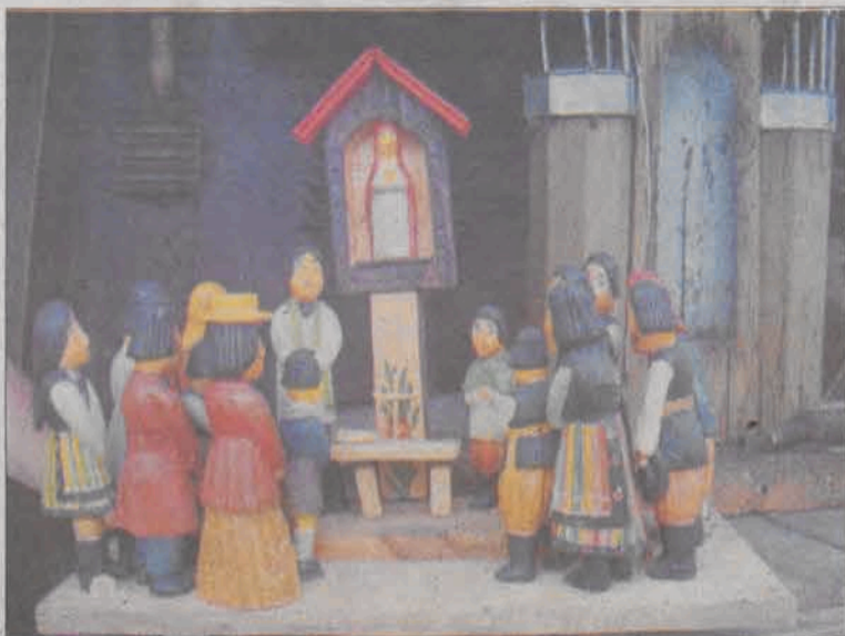
Nabożeństwo majowe w ludowej rzeźbie Adama Głuszka.

kle drewno lipowe, czasem sosnowe czy topolowe. Wszystkie jego rzeźby są polichromowane. Początkowo malował je farbami plakatowymi, obecnie stosuje barwniki akrylowe, sporadycznie lakiery. Zafascynowany rodzimą kulturą, posiadając o niej dużą wiedzę, wprowadza do rzeźby sakralnej motywy zaczerpnięte z łowickiej sztuki ludowej. Za całokształt działalności na rzecz rozpowszechniania sztuki ludowej i folkloru