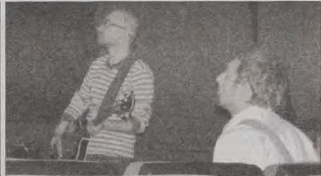
Muzycy odpowiadali dźwiękiem na każdy gest filmowych postaci.

Poza pracę zawodową zaangażowany jest w działalność strażacką, od 18. roku życia dowodził sekcją sportowo-pożarniczą Ochotniczej Straży Pożarnej w Szczawinie Kościelnym, był naczelnikiem tej jednostki, od 2006 roku jest jej prezesem. Jest też członkiem zarządu gminnego OSP w Szczawinie Kościelnym, w ostatnich wyborach samorządowych zdobył mandat radnego gminy. (mwwk)