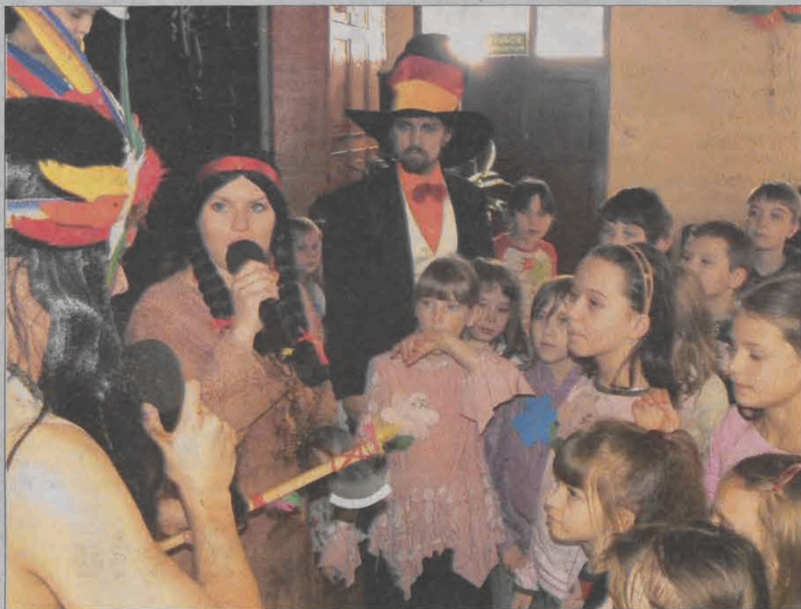
Indianie i czuwający nad wszystkim bajkopisarz - tuż przed kolejnym zaproszeniem do konkursu.

zi, a to za sprawą porozumienia między Domem Kultury w Zdunach a Gminnym Ośrodkiem Kultury w Kiemozi. Obie instytucje chcą angażować młodzież i dzieci do zajęć mających zbliżyć obie miejscowości. Po wizycie dzieci z Kiemozi w Zdunach kolejną taką inicjatywą ma być wspólny plener malarski w parku w Kiemozi.