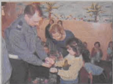
- Nie używamy kajdanek wobec dzieci - zapewniali policjanci.

Dzieci - przyznać trzeba, że nieco rozbrzykane, ale to przecież czas ferii - najbardziej zaciekały policyjne gadżety. Oglądały i przymierzały policyjne kaski, które policjanci zakładają np. w akcjach z udziałem pseudo kubiców. Nie mniej ciekawe były