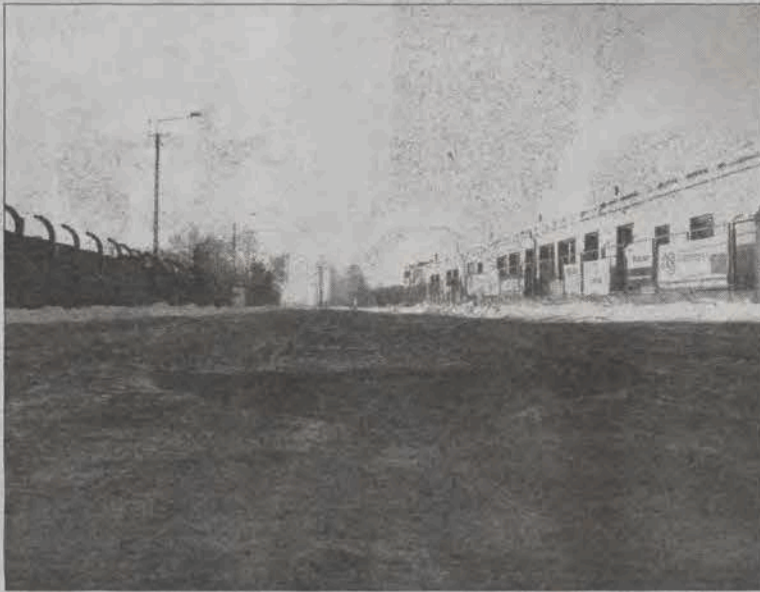
Wszyscy jeżdżący ulicą Malszyce chętnie by zapomnieli o dziurach jak leje po bombach, na których można było zniszczyć podwozie samochodu.