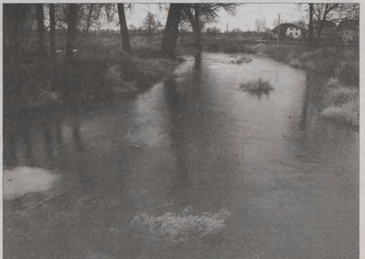
MROGA PEŁNA PO BRZEZI. Kilka dni opadów śniegu wystarczyło, aby dziś roztopiający się śnieg wypełnił rzekę Mrogę przepływającą przez gminę Bielawy po brzegi. Co roku jest ona przyczyną podtopień przylegających pól oraz zabudowań w granicach samych Bielaw. W ubiegłym roku koryto rzeki uregulowano i usypany został wał od strony miejscowości, co ma zapobiec kolejnym podtopieniom. Jeżeli tegoroczna odwilż zakończy się w tym miesiącu, zagrożenia uda się uniknąć. (eb)