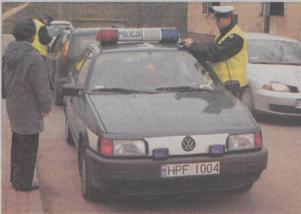
W ciągu kilku minut patrol policyjny na ulicy Tkaczew zatrzymał trzy samochody niestosujące się do zakazu wjazdu.