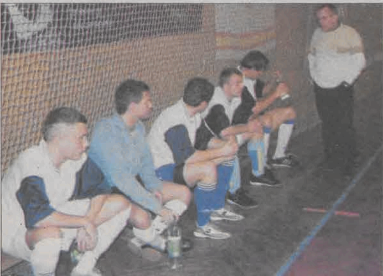
Mistrzowski tytuł po raz drugi wywalczył Oldboy.