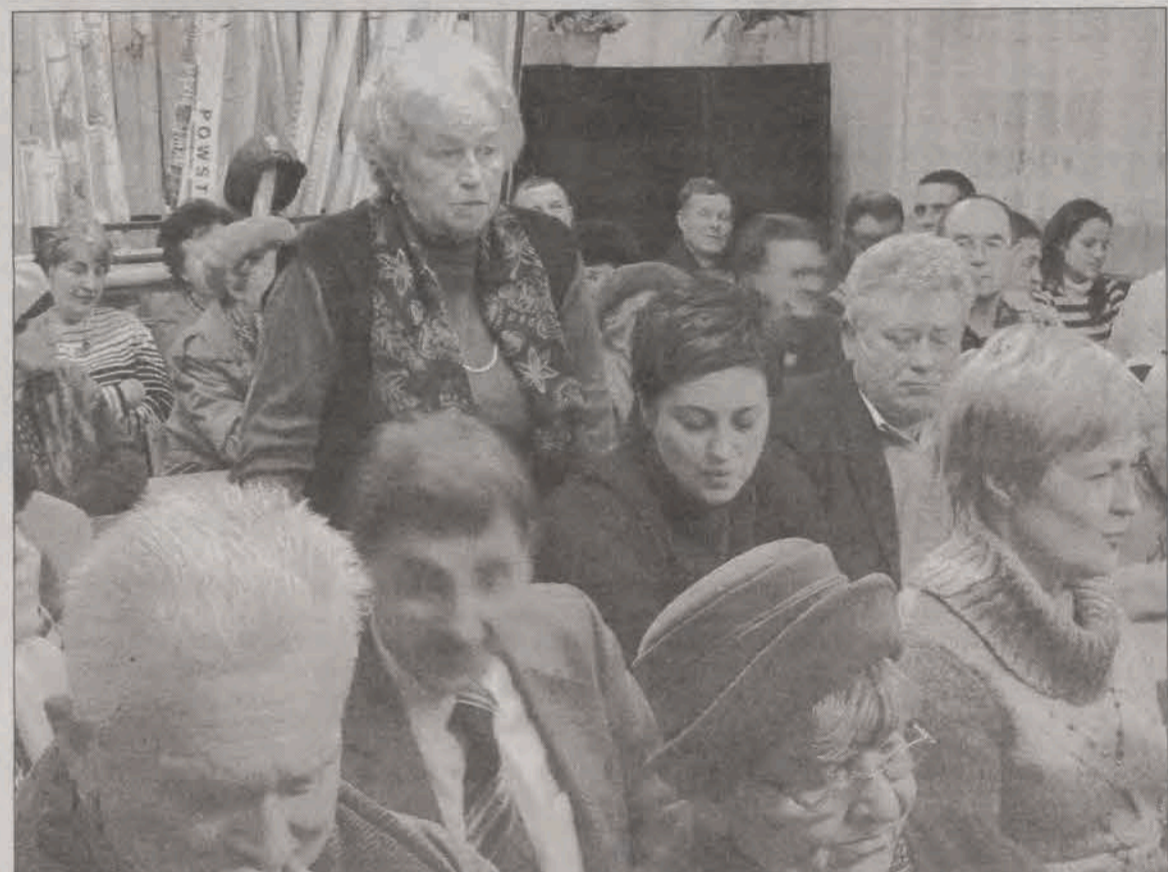
W spotkaniu z burmistrzami na osiedlu Korabka uczestniczyło ok. 50 osób, podobnie na Zatorzu, najranniej było ok. 10 było na Starym Mieście.

Dziś, tj. w czwartek 8 lutego, w sali radzieckiej łowickiego ratusza o godz. 16.00 odbędzie się drugie spotkanie Społecznej Grupy Doradców Gospodarczych przy Burmistrzu Miasta Łowicza. Pierwsze odbyło się 24 stycznia. Wzięło w nim udział kilkanaście osób, a poświęcone było sprawom organizacyjnym. Organ ten będzie miał za zadanie współdziałanie z samorządem, m.in. w zakresie aktywizacji gospodarczej Łowicza, opiniowania przedsięwzięć gospodarczych oraz wspólne z miastem działania związane z promocją Łowicza. Na dzisiejsze spotkanie burmistrzowie zapraszają wszystkich łowickich przedsiębiorców, jednocześnie przypominają, że jeżeli ktoś chce formalnie należeć do grupy, musi złożyć stosowną deklarację. Ta jest do pobrania na stronie internetowej ratusza: www.łowicz.ue