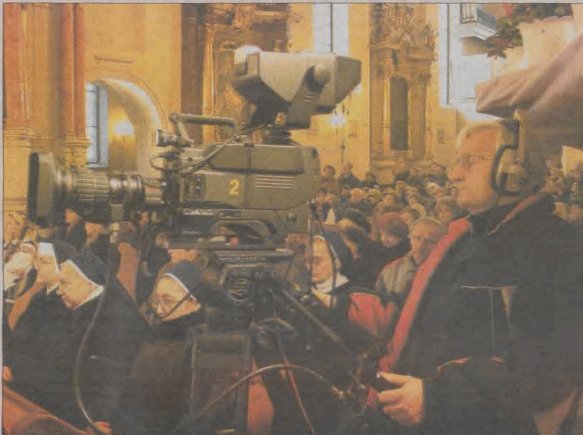
Kościół w czasie mszy był wypełniony wiernymi.

Msza święta, którą można było obejrzeć także poza granicami kraju, miała bogatą oprawę, śpiewała schola działająca przy parafii, a w pierwszych rzędach ławek zasiadły łowiczanki w strojach ludowych, dalej siostry zakonne i pozostali parafianie. Świątynia