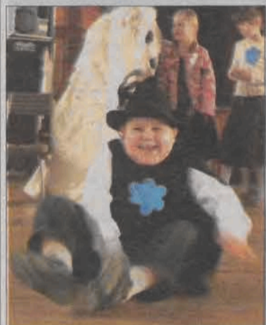
Wiele radości sprawiły dzieciom wyjścia na „jabłuszkach” po parkiecie sali widowiskowej w zastępstwie śniegu.

Warte podkreślenia jest to, że bal w Zdunach był pierwszą imprezą integracyjną, na której spotkały się dzieci ze Zdun i Kiemozi.