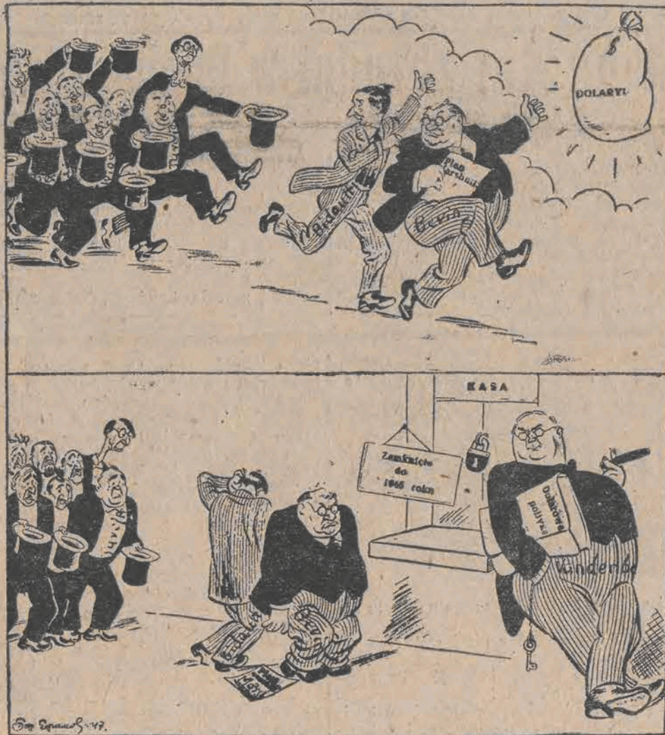
Bieg po dolary zakończył się przed zamkniętą kasą.