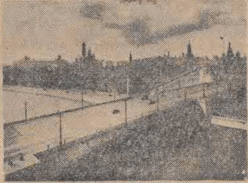
Kreml od strony rzeki Moskwy