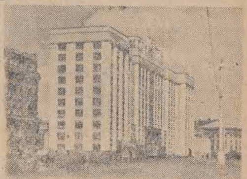
Dom Rady Ministrów ZSRR