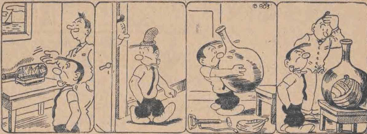
Okręt we flasce!