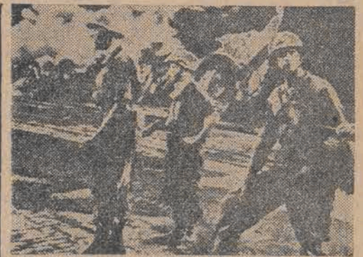
Walki uliczne w Molang

ciowa amerykańskich mas pracujących znacznie się obniżyła w ciągu ostatnich miesięcy. W dniu 23 września „Zjednoczenie Post. powych Obywateli Amery-