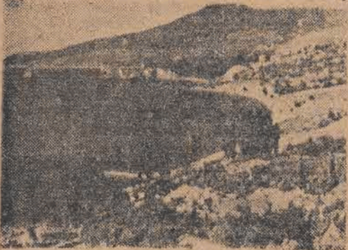
Ogólny widok Arteku

„Jest tam Polak, Rosjan i Czech też morowy,