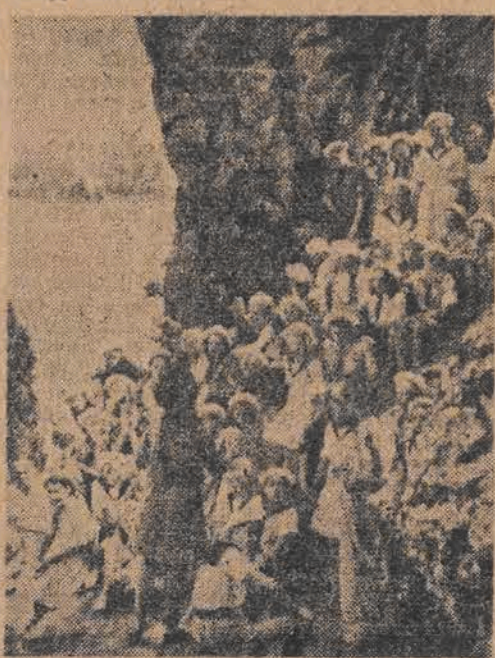
Dzieci rosyjskie, polskie i czeskie na skale „Sławy” w Arteku

zku Radzieckiego nie tylko miłe i wesołe wspomnienia i piosenki, ale również wielką lekcję walki i trudu.