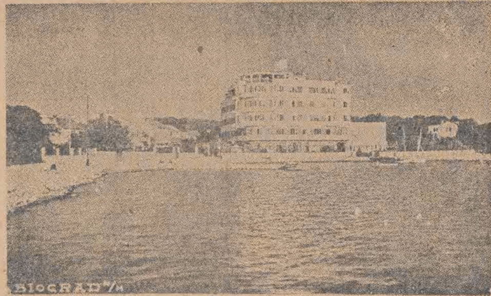
Włókniarze łódzcy ślą pozdrowienia z pięknej Inaostawii