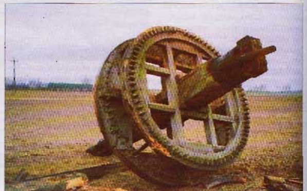
Wielkie koło zębate zaryło osię w pole