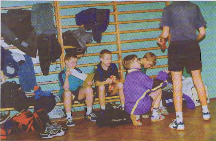
Łowicka pingpongowa młodzież doznała porażki w meczu IV ligi z bardziej doświadczony zespołem Tajfunu Skararki. O meczach tych czytaj na str. 30.