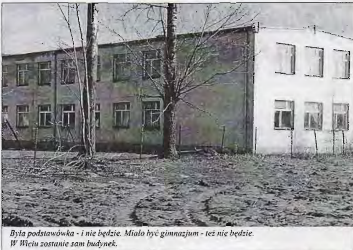
Była podstawówka - i nie będzie. Miało być gimnazjum - też nie będzie. W Wiczu zostanie sam budynek.

Jeszcze wokół konfliktu o gimnazjum w Kocierzewie