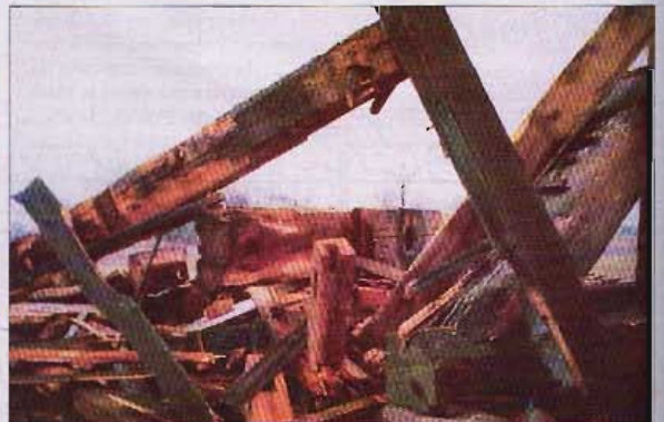
Obraz jak po wojnie. Tyle tylko zostało.