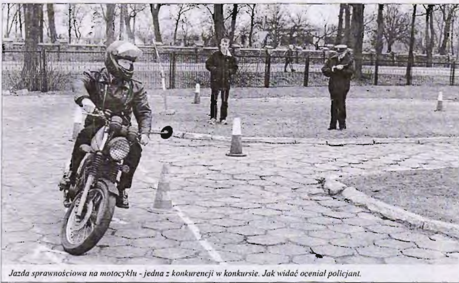
Jazda sprawnościowa na motocyklu - jedna z konkurencji w konkursie. Jak widać oceniają policjanci.