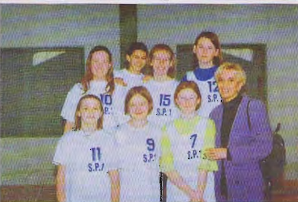
Dziewczęta z SP1 Łowicz są faworytkami w dzisiejszym turnieju mini - siatkówki rozgrywanych w hali OSiR Nr 2 w Łowiczu