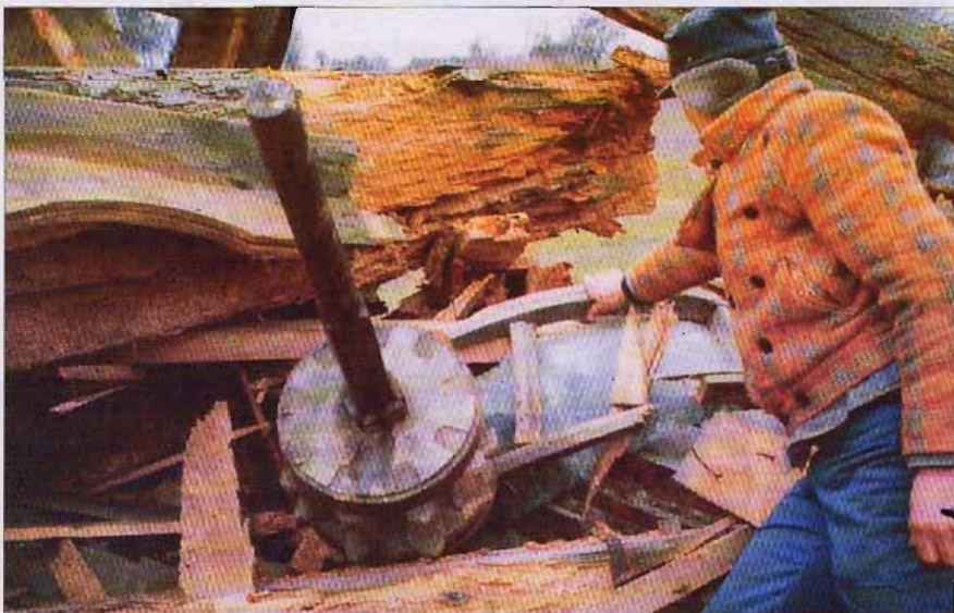
Z bliska dopiero widać, jak bardzo zniszczone były belki konstrukcyjne.