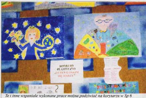
Te i inne wspaniałe wykonane prace można podziwiać na korystarzu w Sp 6