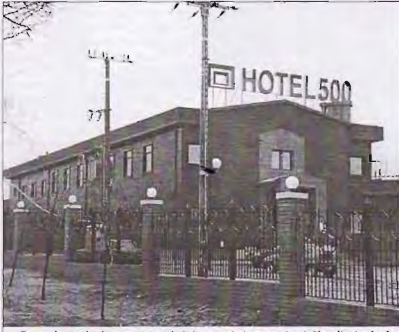
Perspektywa budowy autostrady już owocuje inwestycjami. Na zdjęciu: budowany „Hotel 500” w Strykowie - w pobliżu planowanego skrzyżowania autostrad A1 i A2

„W najbliższym sąsiedztwie Warszawy”. Ta deklaracja ministra Syryjczyka jest ważna. Oznacza ona bowiem, że przebieg trasy A-2 na odcinku od Strykowa w stronę stolicy nie będzie odbiegać od pierwotnych założeń, przewidujących jej poprowadzenie w pobliżu Główna, Łyszkowie, następnie przez okolice Dzierżgówki, na południe od Nieborowa, przez okolice Bolimowa i Miedniewie dalej wprost na Warszawę. Protesty ekologów i mieszkańców Ursynowa, bojących się przewidywanego przebiegu autostrady właśnie przez tę gęsto zamieszkałą dzielnicę stolicy dały tyle, że obecnie ministerstwo ochrony środowiska przygotowuje trzy alternatywne warianty trasy - ale każdy z nich prowadzi w bliskim sąsiedztwie Warszawy. Oznacza to, że odrzucono w praktyce inne, odległe od stolicy, warianty przebiegu autostrady przez Górę Kalwarię czy nawet na północ od Modlina. Nie sposób nie zauważyć, że każdy z tych wariantów byłby (oprócz jego absurdów ekonomicznych - oddalenie trasy od stolicy, a przez to wolniejszy zwrot kosztów budowy) dużo mniej korzystny dla Łowicza i okolicy. Autostrada omijałaby Łowicz po prostu z daleka.