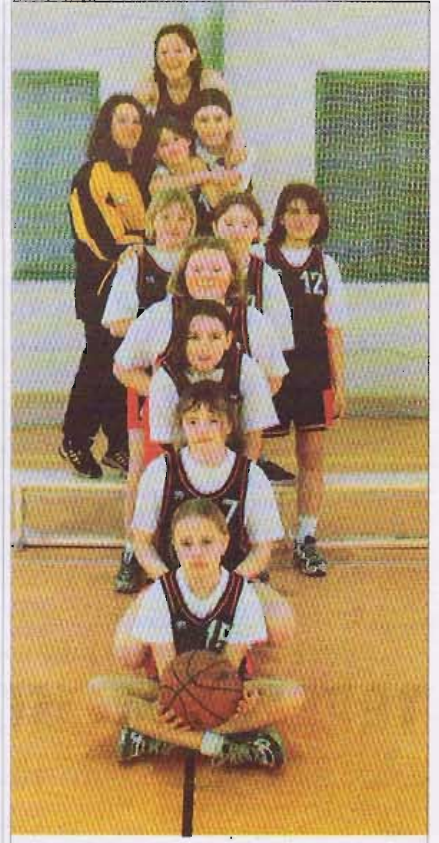
Klasą dla siebie była koszykarska drużyna szóstoklasistek z SP 4. O zawodach czytaj na str. 29.