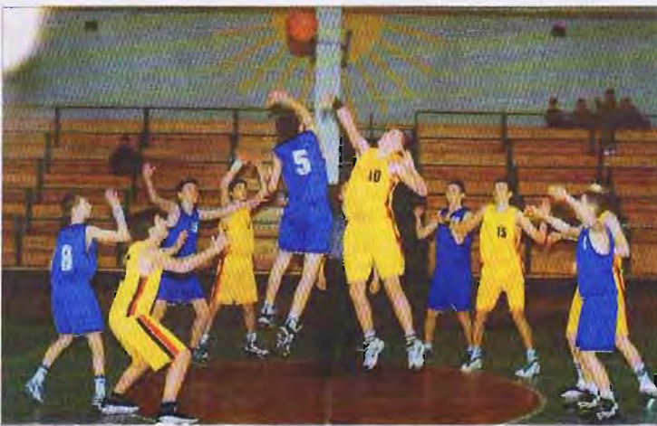
Młodzieży VOX-OSIR Łowicz rozpoczęli rundę finałową o miejsce 1-8 od pewnego zwycięstwa ze Startem. O rozgrywkach młodzieżowej koszykówki czytaj na str. 27.