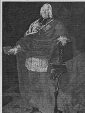
Portret arcybiskupa gnieźnieńskiego Adama Ignacego Komorowskiego, malarz nieokr. ok. 1758 r., Katedra p.w. Wniebowzięcia NMP w Łowiczu

Wystawa będzie ekspozowana do 30 kwietnia bieżącego roku.