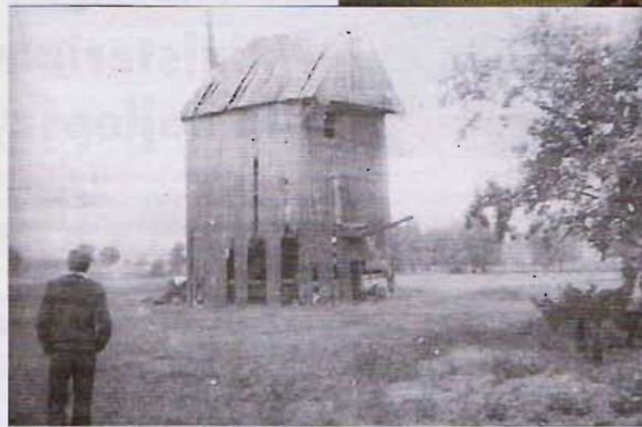
Tak wyglądał wiatrak w Brzezimach jeszcze w latach 70-tych