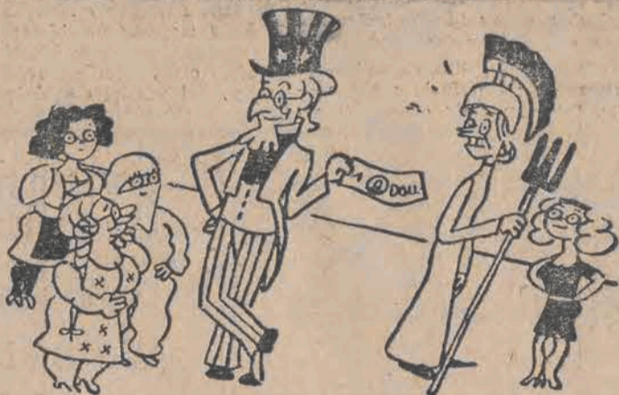
Wuj Sam: Pożyczę wam dolary, ale musicie kupować moje BOMBO-nierki.

W konferencji wzięło udział przeszło 50-ciu dziennikarzy alianckich i niemieckich.