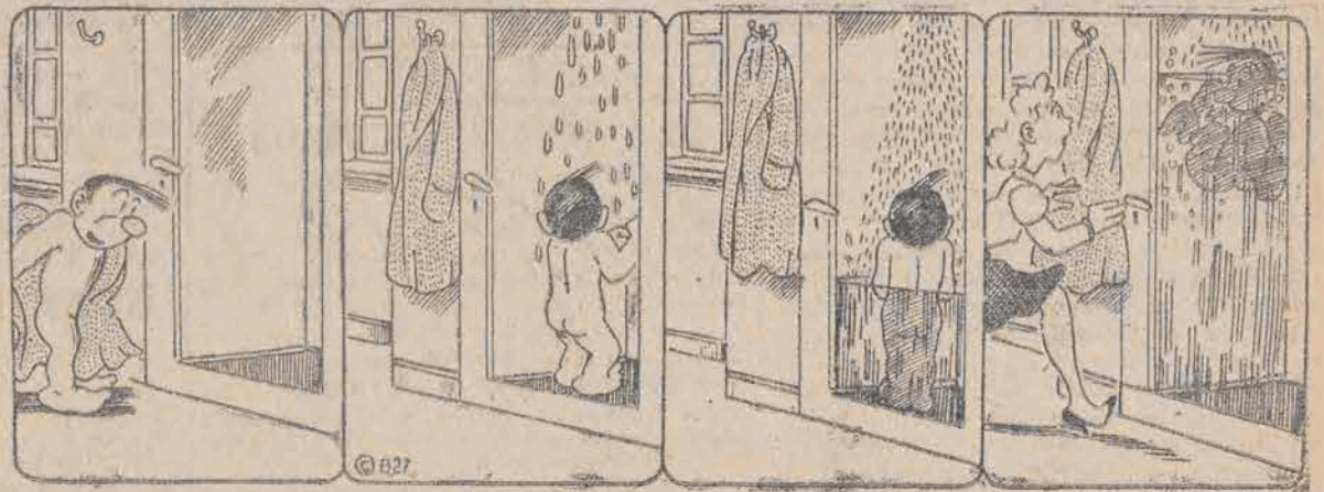
Trzeba się wykąpać. Prysnąć to dobra rzecz! Wody przybywał. Ratunek w ostatniej minucie!