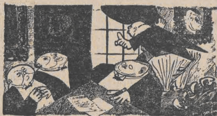
Panowie! Robić „wygłodzone mi my”, bo nadchodzi nowa komisja żywnościowa z USA.