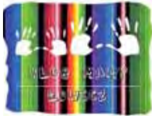
Logo Klubu Mamy Łowicz.

Na forum poruszane są przede wszystkim różne tematy. Między innymi te dotyczące wychowania czy też karmienia dziecka. Można dowiedzieć się, jakie produkty spożywcze są najbardziej zdrowe dla malucha, a jakich się wy-