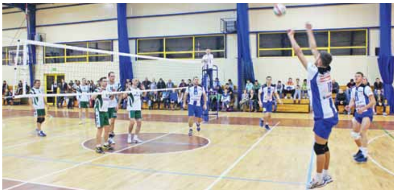
Mecz seniorów Volley Team Żychlin kontra AZS WSGK Kutno, zakończył się wygraną siatkarzy z Kutna.

Drużyna seniorów Volley Team Żychlin, grająca w III Lidze Mężczyzn, kolejny mecz