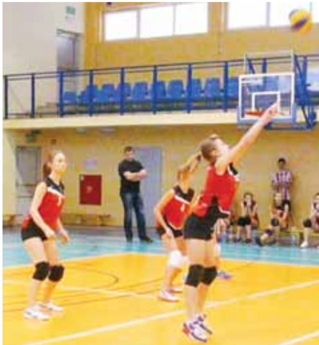
Wygrany 2:1 mecz drużyny Mickiewicz Żychlin z UKS Strzelce.