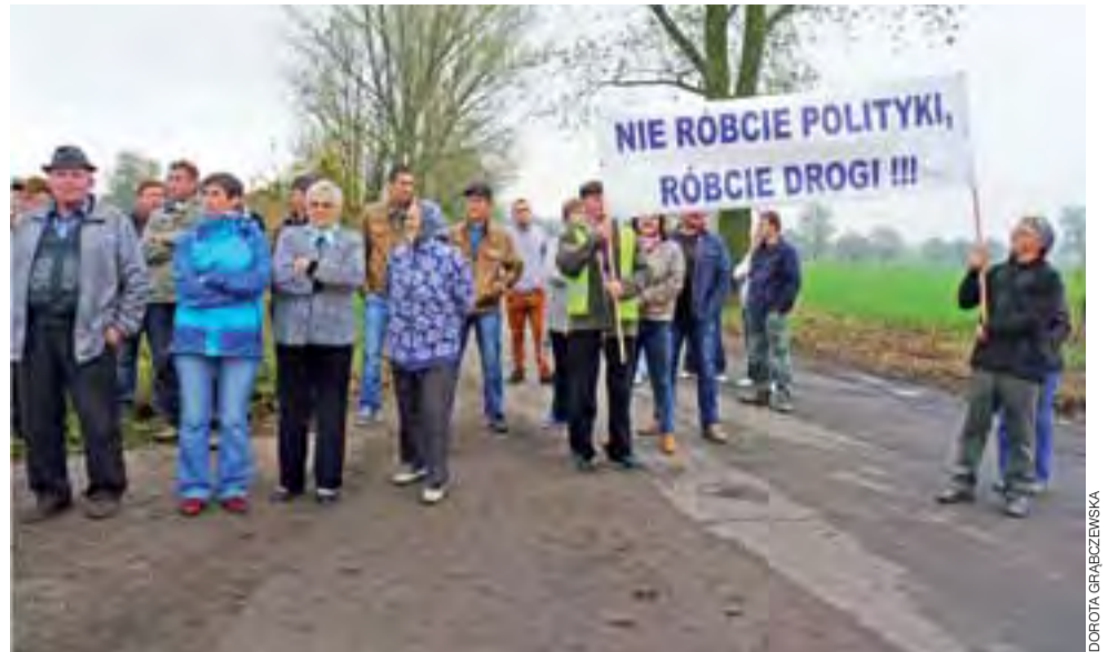
Mieszkańcy gmin Oporów i Żychlina wyszli na drogę, by protestować przeciwko bierności i braku remontów na drogach powiatowych.