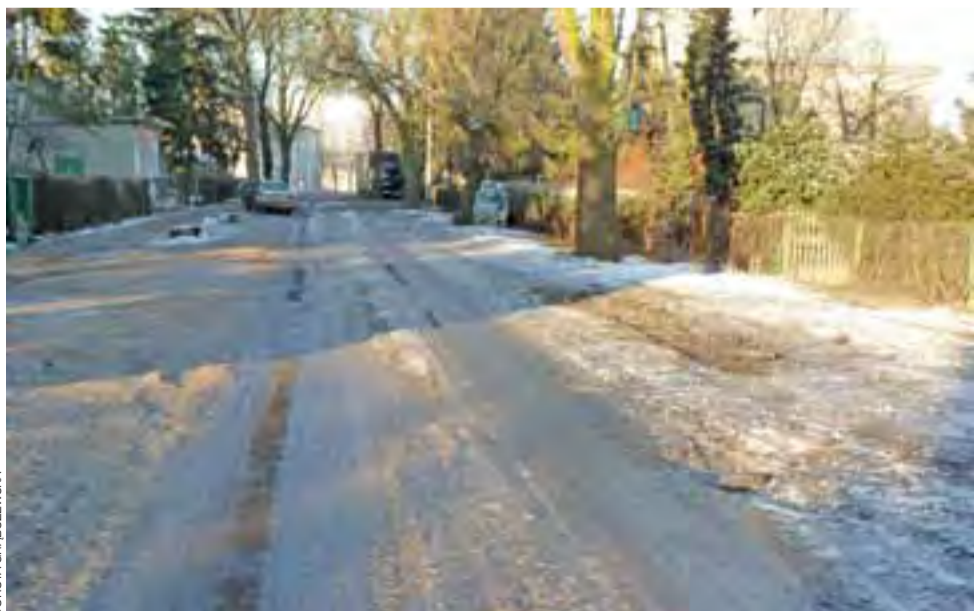
Ulica Jabłonkowa od lat po opadach zamienia się albo w lodowisko, jak 30 grudnia, albo w jezioro wody. Potrzebna jest budowa nowej kanalizacji deszczowej. Póki co, gmina się broni, uważając, że to zbyt kosztowna inwestycja.

Okazało się, że samochód o wartości 37 tys. zł wraz z dowodem rejestracyjnym przywłaszczył sobie 41-letni mieszkaniec powiatu kutnowskiego. Okoliczności zdarzenia wyjaśniła policja w Żychlinie. dag