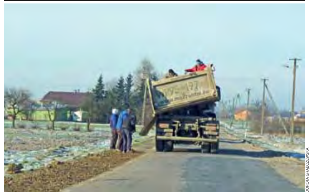
Pod koniec roku – 30 grudnia – drogowcy na zlecenie Wojewódzkiego Zarządu Dróg Mazowieckich uzupełniali pobocza wzdłuż drogi 583 z Pacyny do Żychlina. Tłuczeń nie tylko wyrównał pobocza, ale też je nieco podniósł, co sprawia, że uskok pomiędzy drogą asfaltową a poboczem jest mniejszy. To ważne, zwłaszcza zimą, gdy drogi są śliskie. Większość drogi jest bardzo wąska i kierowcy przy mijaniu się z ciężarowym samochodem często muszą zjeżdżać na pobocze. Teraz będzie bezpieczniej. dag