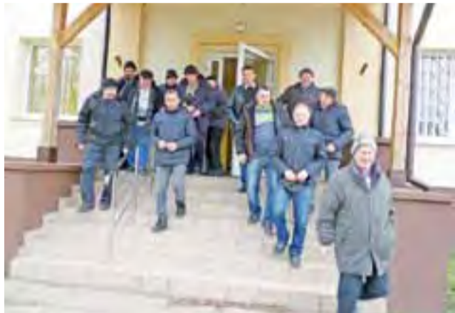
5 stycznia 18 plantatorów z gminy Żychlin z rejonu: Sleszyn, Biała, Zagody, przyszło na spotkanie z dyrekcją cukrowni Dobrzelin, by dowiedzieć się, czy ich buraki zostaną odebrane z pola, czy tam zgniją.

Podczas spotkania rolnicy podkreślali, że niektóre kombajny buraczane są wyeksploatowane i nie nadają się do użytku (kombajny należą do prywatnych przedsiębiorców, którzy wygrali przetargi w KSC). W trakcie kopia odpadły lemiesz. Wiele buraków zostało w polu, nie zostały przez kombajn zebrane. I tu również dyrektor przyznał rację rolnikom. Jak podkreślał, najgorzej było na terenie gminy Witonia. Po przejściu kombajnów jedna czwarta buraków została w polu, co oznacza straty dla tamtejszych rolników.