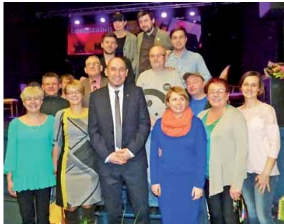
Ekipa ŁOK w komplecie. Nie mogło być inaczej. Każdy tego dnia chciał być w kinie, aby osobiście cieszyć się z uhonorowania szefa. Każdy z nich ma swój wkład w jego sukces.