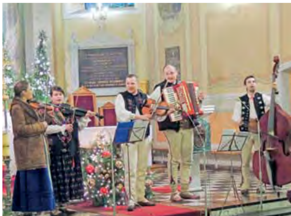
Góralaska kapela w kościele w Żychlinie przeniosła zebranych do „do stóp Skrzycznego”.

W pastorałkach i przyspiewkach góralskich publiczność mogła usłyszeć „wyskanie”, czyli specjalne glissando – wywodzące się z okrzyku pasterkiego.