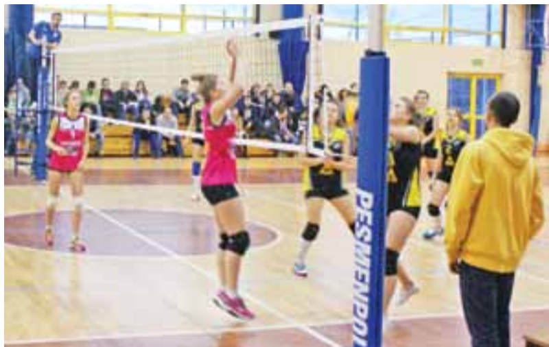
Żeńska drużyna Volley Team Żychlin w przegranym 0:3 meczu z Gostynin Team.