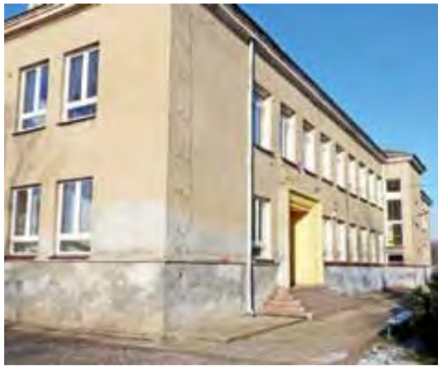
Jedną z dwóch inwestycji zaplanowanych na 2015 rok jest termomodernizacja budynku po dawnej szkole w Skrzyszewach, w którym teraz znajduje się przedszkole.

Największą część budżetu stanowi oświata oraz edukacyjna opieka wychowawcza (światlice), choć w gminie jest te-