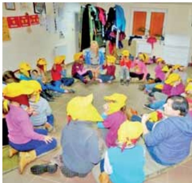
W świetlicy pod basztą gen. Klickiego w sobotę czas spędzają zarówno zuchy (na zdjęciu) jak i harcerze. Niestety, pomieszczenie jest ogrzewane grzejnikami elektrycznymi (widać je na ścianach).

społecznie w pracę wychowawczą z dziećmi i młodzieżą – mówi Stefaniak podkreślając, że są to ludzie bardzo oddani temu, co robią, to oni tworzą atmosferę panującą w szczepie. Trzeba też przypomnieć, że hufiec ZHP w pewnym okresie podupadł, groziło mu nawet rozwiązanie, od 2001 roku przez wiele lat z mozołem podnosił się na nogi. Pojawienie się szczepów oznacza jedno: ZHP w naszym mieście i powiecie ma się coraz lepiej. Są jednak problemy, z którymi młodzi ludzie nie poradzą sobie bez pomocy. Chodzi przede wszystkim o pomieszczenia, w których mogłyby odbywać się zbiórki.