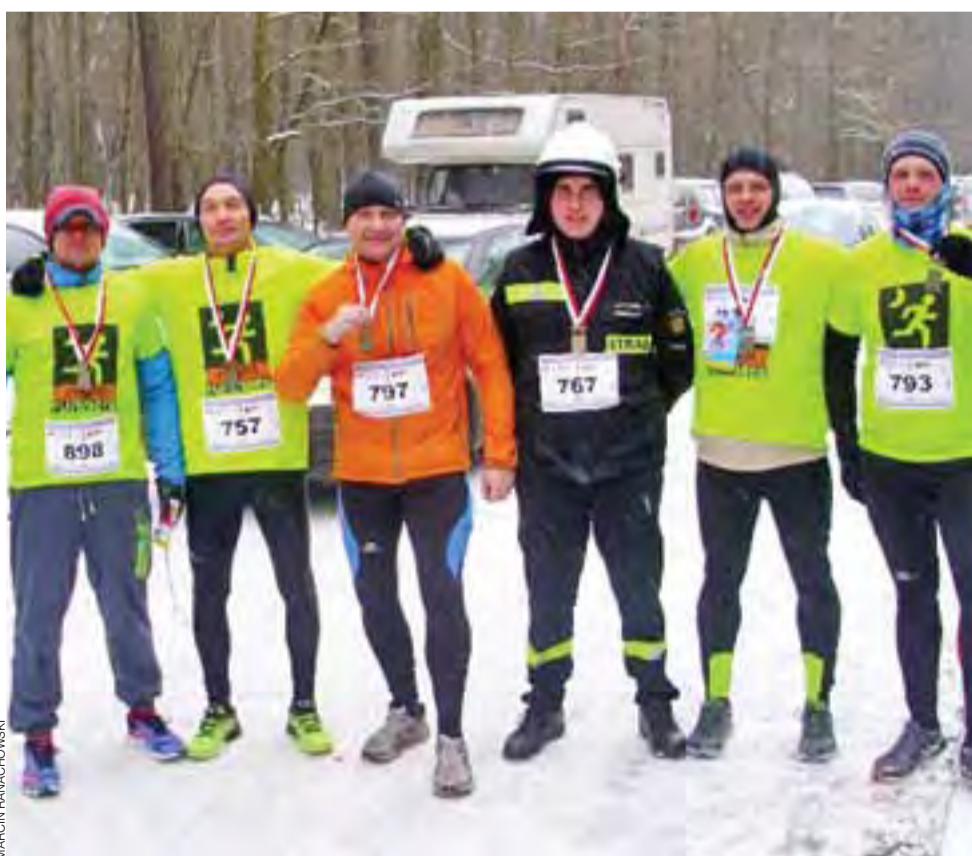
Grupa Nocnych Biegaczy z Żychlina, biorących udział w Biegu Sylwestrowym w Łodzi.

■ Volley Team Żychlin (seniorzy) – AZS WSGK Kutno 1:3 (24:26, 27:25, 17:25, 23:25)