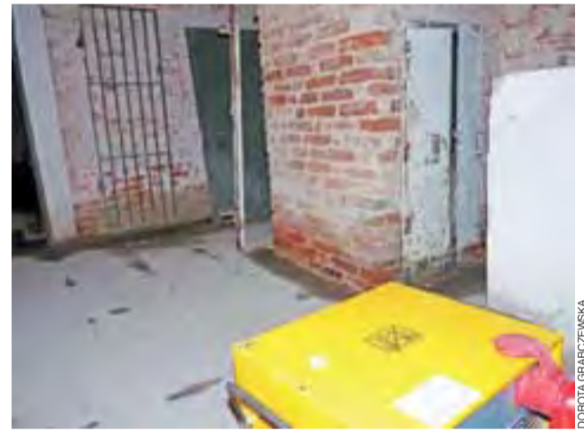
Piwniczne pomieszczenia biblioteki zalane 30 grudnia wodą na skutek awarii są osuszane za pomocą dmuchawy ciepłego powietrza.

– Jestem bardzo zadowolona i pełna podziwu dla pracy strażaków, którzy przyjechali z profesjonalnym sprzętem. Resztki wody usunęli za pomocą wodnego odkurzacza. Użyli też nam dmuchawę na ciepłe powietrze, którą osuszamy mury piwnicy z wilgoci – dodaje dyrektor. – Sytuacja jest już opanowana. Niestety, urządzenia w węźle ciepłym zostały zalane.