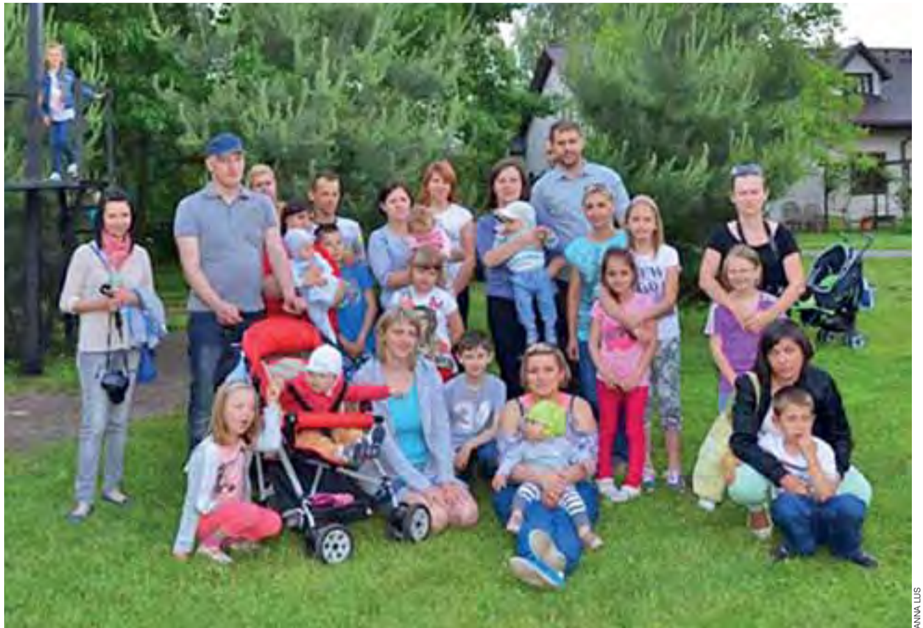
Fotografia wykonana w dniu imprezy w nieborowskiej Stajni u Kowala. To tylko część osób zaangażowanych w Klub Mamy Łowicz.

Jestem już mamą po raz drugi, od pierwszej ciąży minęło prawie 10 lat, wiele spraw np. dotyczących karmienia niemowlęcia się zmieniło