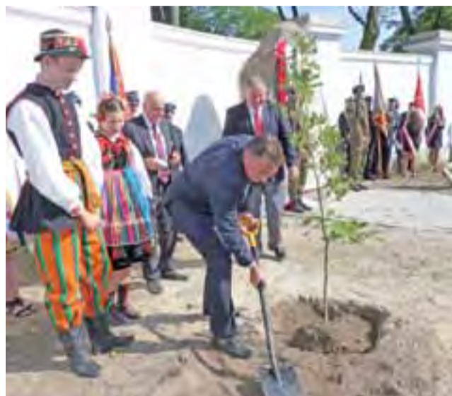
17 września, w 75 rocznicę wybuchu II wojny światowej i wejścia tego dnia wojska do Lusznyna, odsłonięto obelisk poświęcony mieszkańcom Lusznyna, który zginęli podczas wojny. Posadzono też dąb wolności.

Tragiczny wypadek. 20 grudnia na drodze krajowej 92 w Pniewie doszło do tragicznego wypadku drogowego, w którym zginęło 2 mieszkańców gminy Bedlno w wieku 28 i 36 lat. Wszystko przez pijanego kierowcę, mieszkańca Pniewa, który z dużą siłą uderzył swoim samochodem w ich pojazd. Samochód odbił się od barierki i wpadł wprost pod ciężarówkę. Zginęli na miejscu. dag