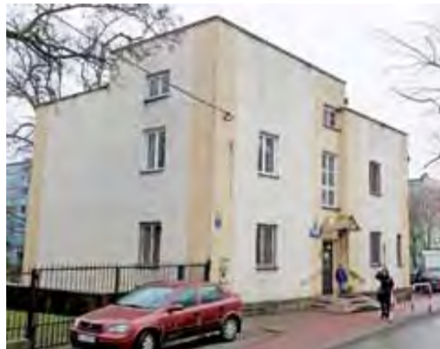
Dawna siedziba Zakładu Gospodarki Mieszkaniowej w Łowiczu mogłaby być siedzibą rosnącego w siłę łowickiego Hufca ZHP, który boryka się z poważnymi problemami lokalowymi.

Harcerze, z którymi współpracujemy, to bardzo przyjemna młodzież. Nie mamy problemów związanych np. z jej zachowaniem. Nasza współpraca przyniosła w tym roku organizację np. Dnia Dziecka, na który pod basztą zjechali rodzice z pociechami prawie z całego miasta, a ostatnio przed Bożym Narodzeniem udało się zorganizować uroczyste plenerowe ubieranie choinki. Nie chcielibyśmy tej współpracy zrywać, bo przynosi dobre owoce.