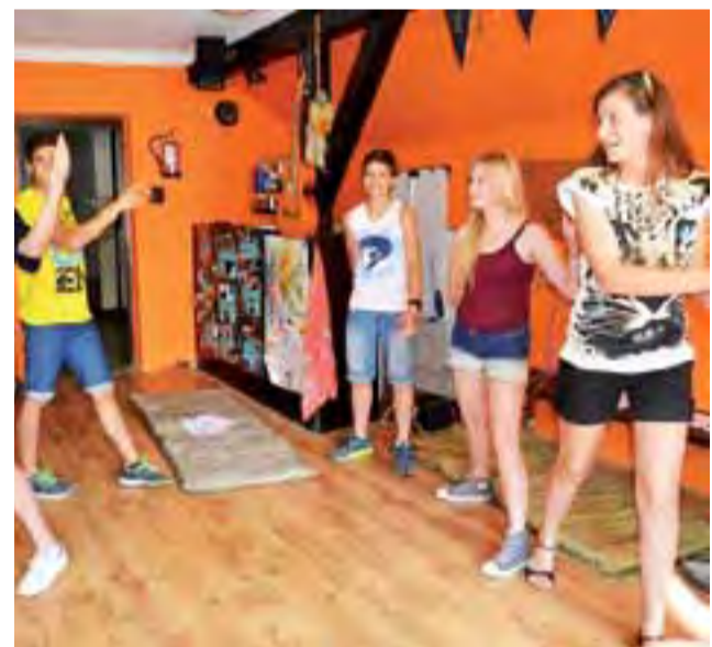
W połowie ubiegłego roku w harcówce przy ul. Mostowej odbyły się warsztaty instruktorskie. Jak widać pomieszczenie nie jest duże, ale pozwala pracować harcerzom.