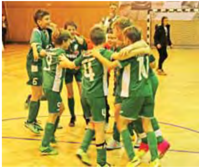
Tak cieszyli się zawodnicy Pelikana po zwycięstwie w meczu o III miejsce.

O zwycięstwie w finale zdecydowały rzuty karne, które lepiej wykonywali gracze Wisły Płock, którzy pokonali Kasztelanę Sierpc 6:5. Pierwsze cztery drużyny otrzymały puchary, zaś wszyscy zawodnicy pamiątkowe medale. Najlepsi zawodnicy w drużynach zostali nagrodzeni statuetkami, zaś najlepszy bram-