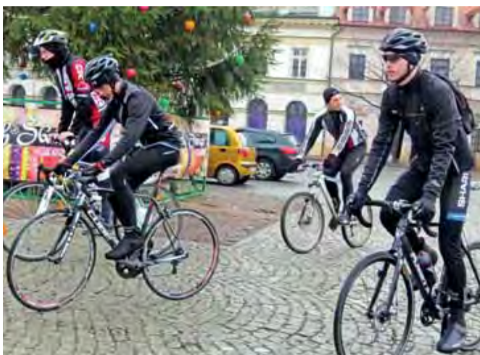
Kolarze wyjechali w ponad 70-kilometrową trasę do Skierniewic i z powrotem w samo południe 1 stycznia.

Jeśli pogoda nie będzie pozwalała na dłuższe rowerowe wypadki, chcą pokonywać na rozpoczęcie sezonu symboliczną trasę ze Starego na Nowy Rynek w Łowiczu. – Ambitnie rozpoczęliśmy sezon 2015. Symboliczną trasę ze Starego na Nowy Rynek w Łowiczu, z uwagi na dobre warunki pogodowe, wydłużyliśmy do 70 km – przez Skierniew-