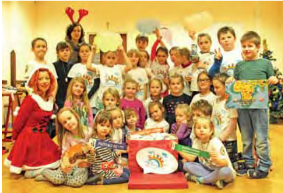
„Tęczowi Marzyciele”, którzy wystali bandażę do Afryki, uczestniczyli też w zajęciach mających na celu przybliżenie im problemów mieszkańców tego kontynentu.

– Pod koniec listopada dostaliśmy wiadomość na naszego