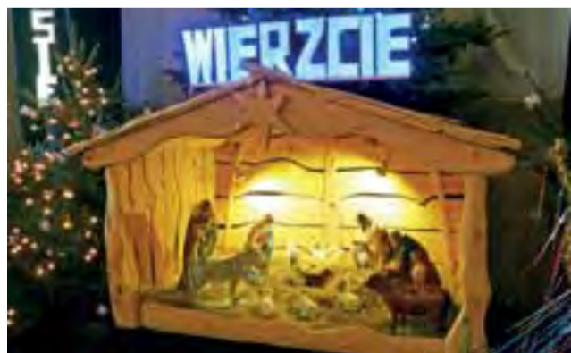
Szopka z kościoła Świętego Ducha w Łowiczu.

W kościele sióstr bernardynek miejscem narodzenia Jezusa jest grota skalna. W kościele pijarskim postacie ustawione są wprost na posadzce, nie ma przy nich dodatkowej dekoracji, poza choinkami, owieczkami i planszą z św. Kalasajuszem. W niektórych kościołach przy szopkach widnieją napisy: „Wierście”, „Wierście w Ewan-