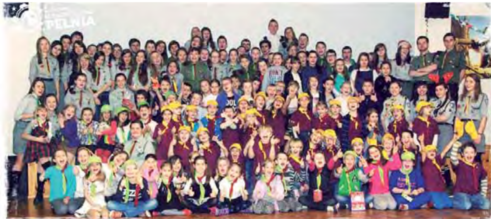
Zuchy i harcerze ze Szczepu Pełnia, w sumie 140 osób, spotkali się przed świętami w sali gimnastycznej II Liceum Ogólnokształcącego w Łowiczu, na wspólnej wigilii.