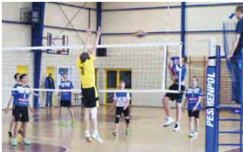
Juniorska drużyna Volley Team Żychlin w przegranym 1:3 meczu z Iskra Volley Team.

Piłka siatkowa | „Gram z Volley Team Żychlin”