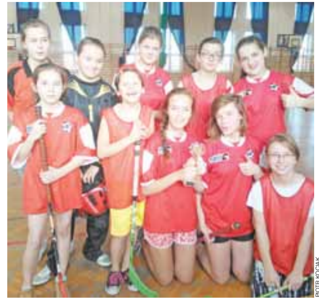
Ekipa dziewczyn z SP Bielawy zajęła w rejonie 4. miejsce.