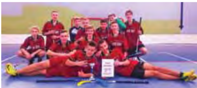
Chłopcy ze Zdun po raz trzeci z rzędu wygrali Gimnazjadę Rejonową w unihoku.

Pierwszym przeciwnikiem Nowych Zdun była drużyna