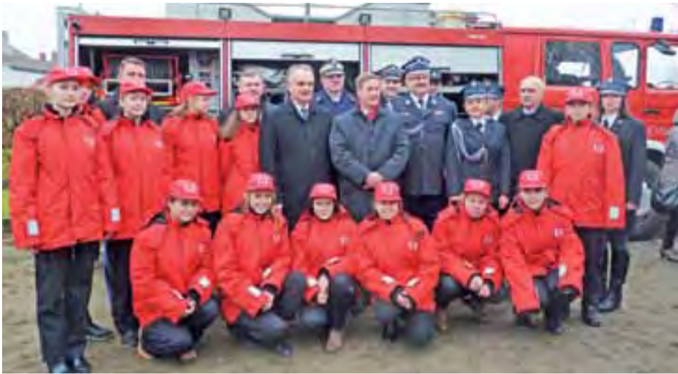
W sadzeniu 600 dęba wolności uczestniczyły dziewczęta z LO pożarniczego w Zespole Szkół w Żychlinie przy ulicy Narutowicza. Powody do radości mili też strażacy z OSP w Śleszynie, którzy odebrali nowy samochód gaśniczy oraz OSP Emit, który otrzymał używany wóz gaśniczy z PSP w Skierniewicach. Gościem honorowym był Waldemar Pawlak, prezes ZG ZOSP w Warszawie.