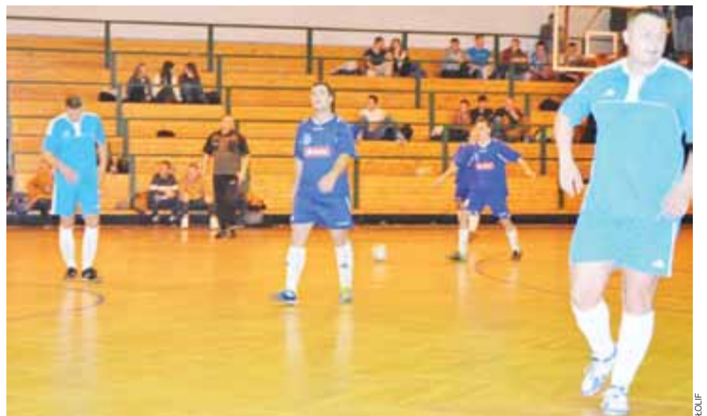
W meczu Alcatraz (błękitne stroje) z Laktozą (niebieskie stroje) było bardzo ciekawie i padł aż 10 goli!