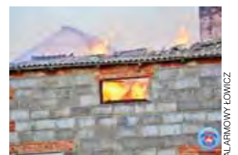
Ogień strawił cały warsztat oraz część zabudowań gospodarczych.

DiMa to firma z duńskim kapitałem, która zajmuje się spawaniem konstrukcji stalowych dla budownictwa, rolnictwa i przemysłu. W Polsce istnieje od kwietnia 2006 roku. dag