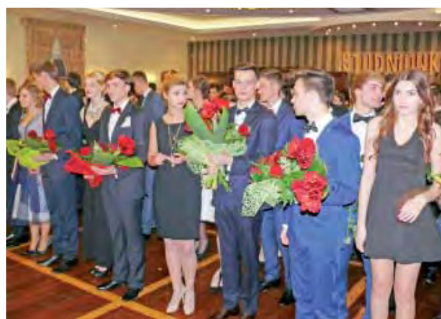
Przed odtańczeniem poloneza uczniowie klas IIIc i IIIb stoją z kwiatami, które za chwilę zostaną wręczone nauczycielom.