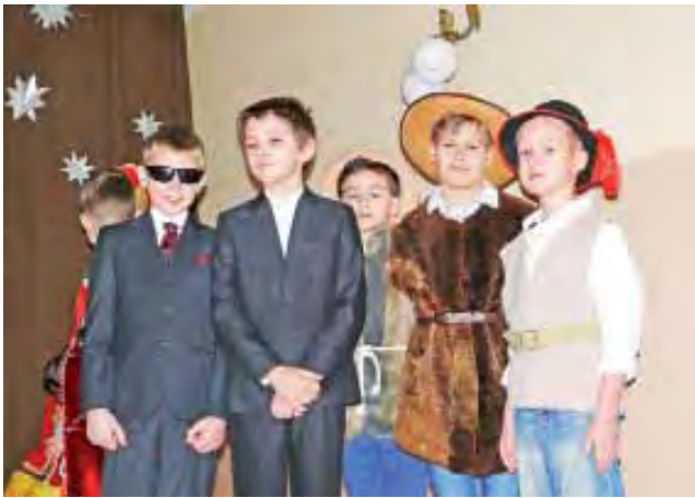
Tradycyjne jasełka, uzupełnione o wątki współczesne, np. zajętych sprawami doczesnymi biznesmenów, wystawili w parafii na Korabce uczniowie „Trójki”.