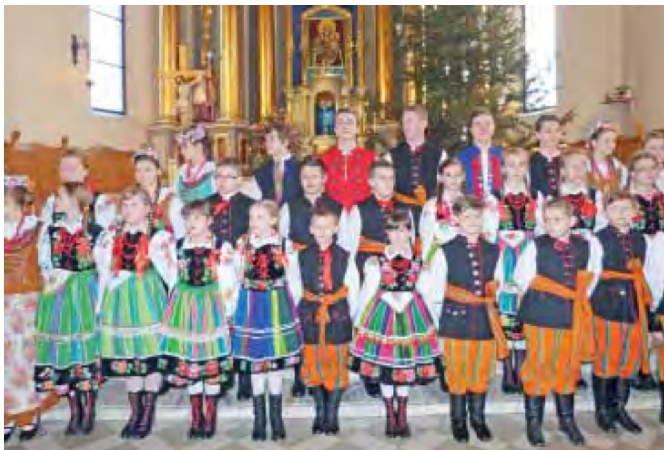
Koderki występowały w kościele Świętego Ducha w licznej, 40-osobowej grupie.

W niedzielę, 11 stycznia, Koderki będą śpiewać kolędy w łowickiej katedrze, podczas mszy św. o godz. 10.30. mwk