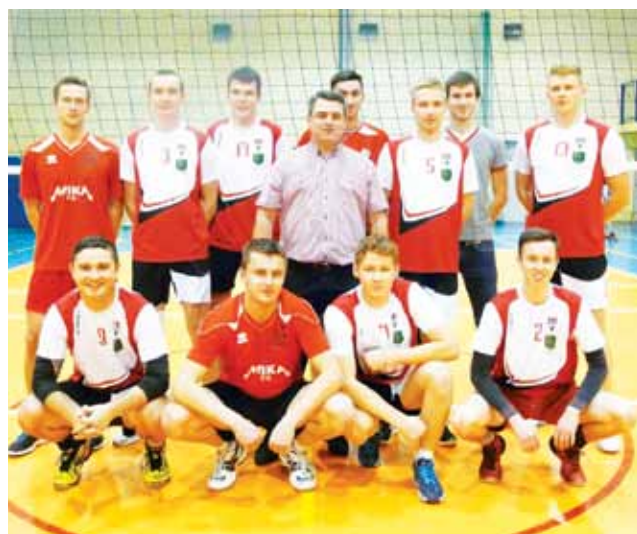
Siatkarze GKS Bedno podczas rozgrywek II Ligi Mężczyzn.