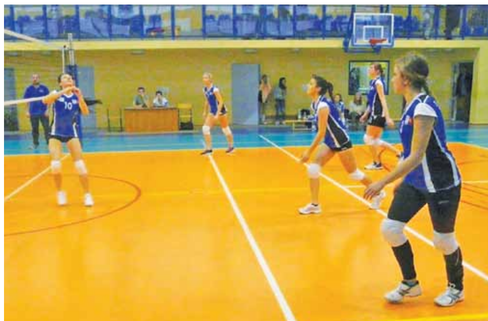
Siatkarki Zespołu Szkół Żychlin w wygranym 2:0 spotkaniu 7. kolejki KALS Kobiet z drużyną Kasprowicz Kutno.