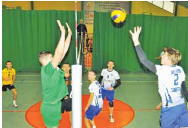
Bzura Sobota pokonał Karasuno Skierniewice 3:1 i umocniła się na 3. miejscu w tabeli AME.

W klasyfikacji najlepiej punktujących prowadzi nadal Woj-