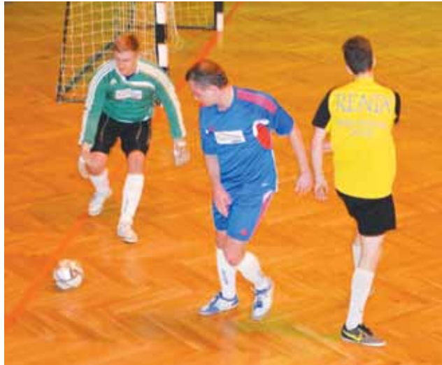
Dach Lux (niebieskie stroje) zremisował 1:1 z Renixem.

Chwilę później na parkiet wybiegli gracze Dach Luxu i Renixu. Oba zespoły przy takim układzie meczów Chińskiej miały o co grać ponieważ oba zespoły mają realne szanse na miejsce trzecie. Renix już od 2. minuty mógł cieszyć się z prowadzenia. Autorem trafienia był niezawod-