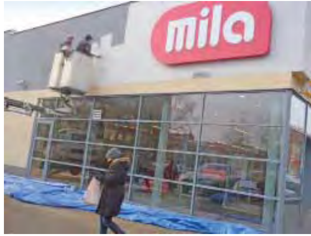
W czwartek kończono zmienianie nazwy z POLOmarketu na Milę w Żychlinie. Uroczyste otwarcie nowego marketu 17 stycznia.

– Nie o nagrodę chodzi, ale o wspaniałą zabawę, jaką miałem w czasie nagrywania filmiku – podkreśla Maciek. dag