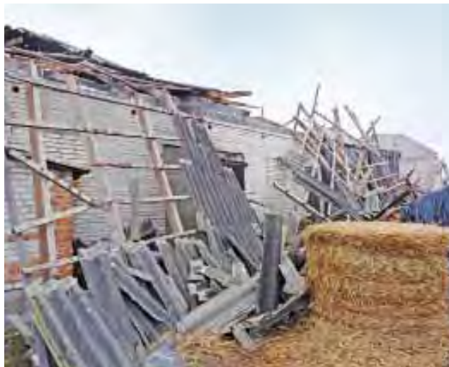
Wichura całkowicie zniszczyła budynek gospodarczy państwa Filińskich z Sejkowic. Pod gruzami zginęło 5 cielaków.

Szukając gospodarstwa państwa Filińskich, znaleźliśmy drugi dom w Sejkowicach z zerwanym dachem, w którym mieszkają państwo Gralak i Bahraj. Ale oni nie wzywali straży,