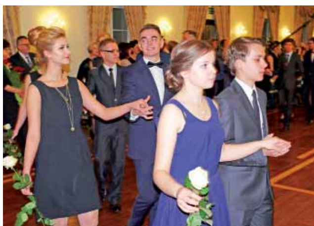
W czasie najważniejszego tańca wieczoru – uczniowie klasy IIIc i klasy IIIb – na pierwszym planie.

Około godz. 6. rano autokary zabrały maturzystów, zapewniając im bezpieczny powrót do domu. Przypomnijmy, że uczniowie I LO otworzyli łowicki sezon studniówkowy. Za dwa dni, 17 stycznia w restauracji Szkiełka w Łowiczu bawić będą się uczniowie ZSP nr 2 na Blichu. tb