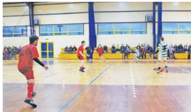
Gladiators z Miasta Noży II kontra Jurnym Buhajem 0:2.

Piłka nożna | Żychlińska Halowa Liga Piłki Nożnej 2015