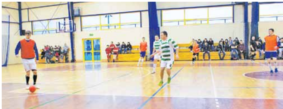
Mecz drużyn: Gladiators z Miasta Noży I kontra MC Zduny, zakończony wynikiem 4:2.