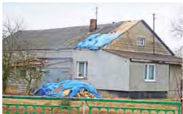
Również w Sejkowicach (gmina Pacyna) wichura zerwała część dachu na budynku mieszkalnym państwa Gralaków.

Na razie gmina nie zamierza doraźnie pomóc rolnikom w formie jednorazowej zapomogi, ale proponuje umorzenie podatku. Wiadomo też, że ubezpieczenie nie wystarczy na pokrycie wszystkich szkód. W szczególności trudnej sytuacji są państwo Filińscy, którzy nie dość, że stracili część zwierząt, to muszą odbudować budynek inwentarsko-gospodarczy. Dorothea Grabczewska