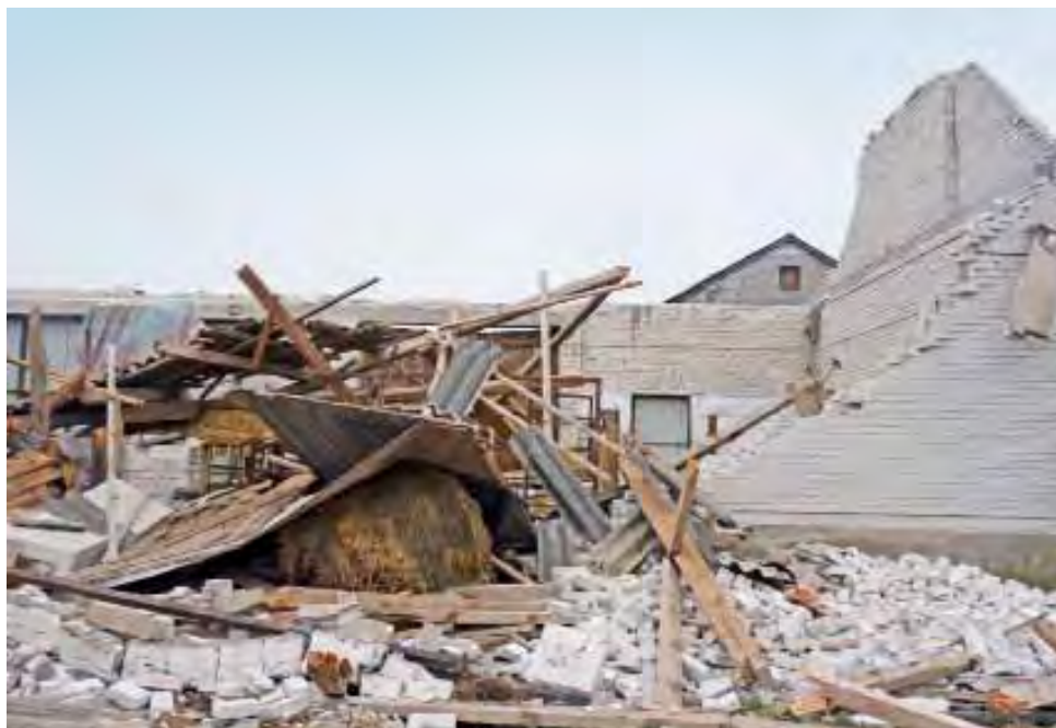
Wichura całkowicie zniszczyła budynek gospodarczy państwa Filińskich z Sejkowic w gminie Pacyna. Pod gruzami zginęło 5 cielaków, kolejne 3 są ranne.

Wichura zmioła nie tylko dach, ale też przewróciła niemal pół tylnej ściany, przewróciła jeden szczyt, a drugi mocno nadwyrężyła. W budynku stało stado półrocznych cielaków o wadze ok. 150 kg. Pięć z nich zginęło na miejscu pod gruzami, dwa następne miały złamane kończyny, jeden złamana najprawdopodobniej miednicę. Gospoda-