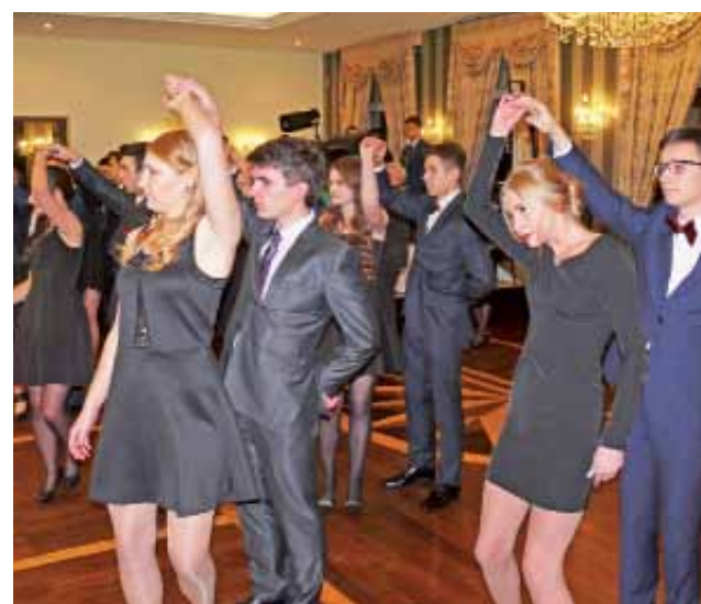
Już w tańcu, uczniowie kl. IIIe oraz kl. IIIb.

czyć dwa polonezy, chociaż wystąpili uczniowie z czterech klas: matematyczno-fizycznej, biologiczno-chemicznej, matematyczno-geograficznej i interdyscyplinarnej. Bawiono się do rana, choć