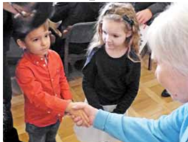
Mimo bardzo młodego wieku , dzieci wiedzą już, jak ważne jest dbanie o środowisko.

Konkurs adresowany był do podopiecznych przedszkoli i szkół podstawowych z terenu powiatu łowickiego. Tematyka prac musiała nawiązywać do segregacji odpadów i recyklingu, natomiast ich forma była dowolna. Wpłynęło 120 różnorodnych prac – zarówno rysunki, malunki, jak i formy mniej standardowe – np. ciekawe rzeczy wykonane z odpadów. Jury postanowiło nagradzać po jednej pracy z każdej placówki, która zgłosiła się do konkursu, która podziękowała na prace indywidualne i zbiorowe. Oceniano zgodność z tematem, pomysł, starano się też zwracać uwagę na to, czy praca wygląda na wykonywaną własnoręcznie przez dzieci.