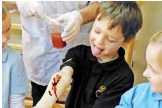
Jak na planie filmowym - uczniowie mieli na sobie sztuczną krew, której proces powstawania śledzili od początku.