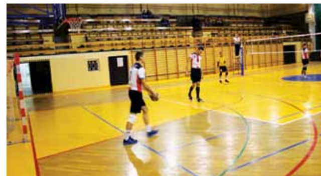
Zawodnik VTŻ przygotowujący się do zagrywki w wyjazdowym meczu z Siatkarzami Drużbice, zakończonym wygraną gospodarzy 3:2.