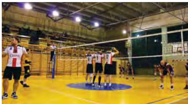
Spotkanie 7. kolejki III Ligi Mężczyzn pomiędzy GLKS Siatkarz Drużbice a Volley Team Żychlin.