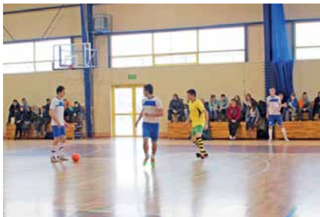
Mecz ŻHLPN pomiędzy MC Zduny a Olimpią Oporów, zakończony wygraną MC 5:0.