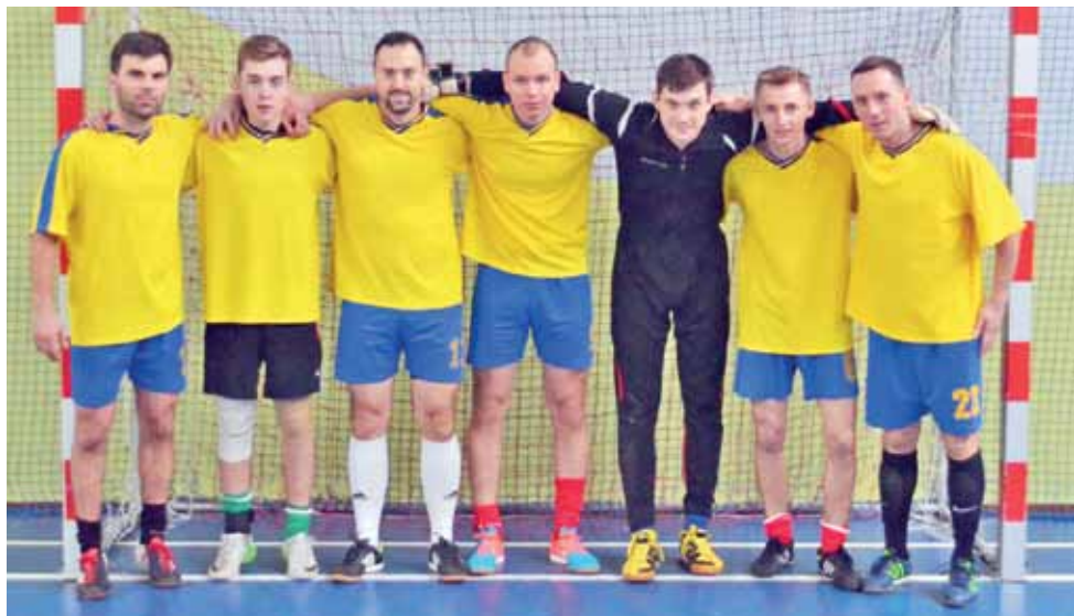
Zwycięska drużyna GKS Bedno II podczas „Zina Cup” o Puchar Prezesa GKS Bedno.