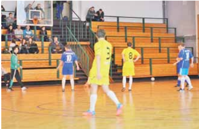
Laktoza sprawiła sporą niespodziankę remisując z faworyzowaną Korabką.