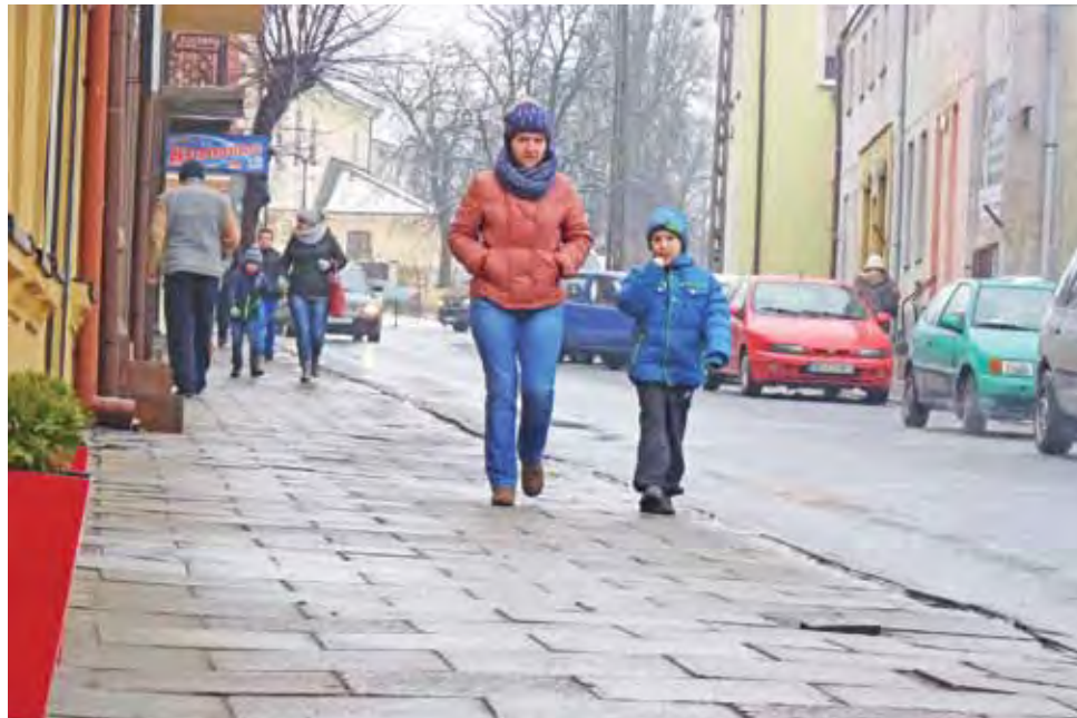
W tym roku rozpocznie się remont części ulicy Narutowicza, od ronda do ulicy Kilińskiego.

I tak na wodociąg w Tretkach zarezerwowano kwotę 304.296 zł, a na ulicę Jabłonkową 438.647 zł. Oferty na wodociąg zostały już otwarte i widać, że inwestycja zostanie zrealizowana za połowę planowanej kwoty. Do tego dochodzi unijna dotacja, więc oszczędności na tej