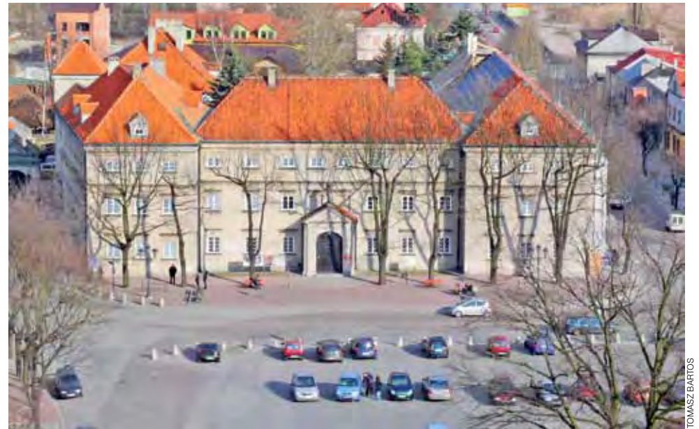
Fragment Starego Rynku widziany z wieży katedry. Pewne jest jedno w przyszłości zniknąć mają z niego parkujące samochody.

Zwrócił też uwagę, że w budżecie gminy nie zostały uwzględnione wydatki na przyłącza odbiorców do kanalizacji sanitarnej. Gmina będzie składała wniosek do Wojewódzkiego Funduszu Ochrony Środowiska i Gospodarki Wodnej w Łodzi o dotację na ten cel, która wynieść może 50% kosztów, maksymalnie 3 tys. zł do jednego przyłącza. Pozostały jego koszt będą płacić mieszkańcy, przy czym jego wysokość znana będzie dopiero po przeprowadzeniu przetargu. mwk