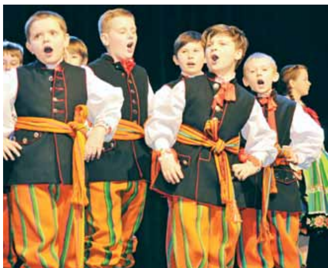
Chłopcy z młodszej grupy Koderki byli bardzo dobrze przygotowani.

W pierwszej części koncertu wystąpił ponad 40-osobowy chór Koderki – połączonych grup młodszej i starszej – z koncertem