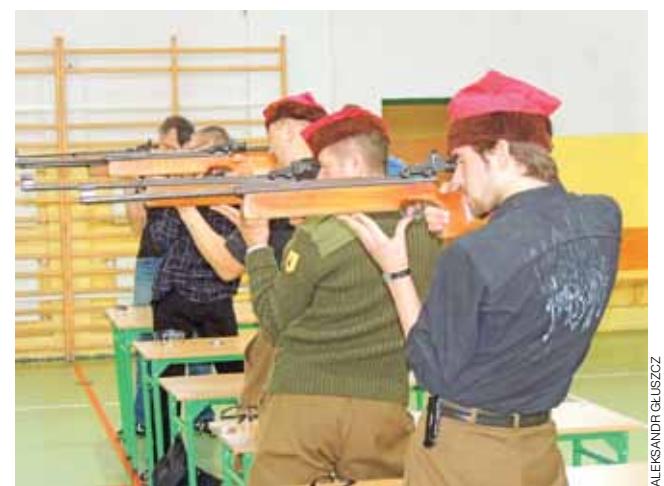
Przedstawiciele 17 Pułku Ułanów Wielkopolskich wywalczyli drugie miejsce w kategorii open.

W kategorii młodzież szkolna startowali uczniowie z ZS w Żychlinie oraz ZS nr 1 w Żychlinie. Swoją rolę w zawodach odegrała również młodzież z ZS z Krośniewic, jednakże nie dotarła, najprawdopodobniej ze względu na złe warunki atmosferyczne.