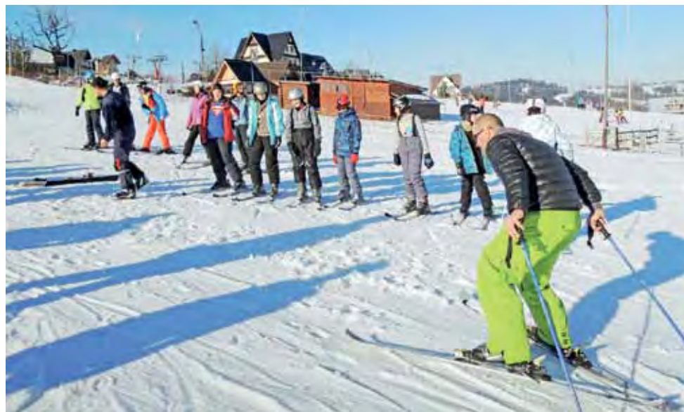
Instruktorzy narciarstwa prezentowali uczestnikom zimowiska, jak jeździć na nartach. Stok Murzschle.

Maturzystki były ubrane w krótkie dziewczęce sukienki. Królowała biel i czerń oraz misternie uplecione fryzury. Młodzi mężczyźni w ciemnych garniturach, których uroku dopełniały zarówno krawaty jak i muszki, bawili się, jak na dżentelmenów przystało. Na nogach maturzystek nie mogło zabraknąć czerwonych podwiązek. – To wszystkim oczywiście na szczęście. Jeśli wierzyć przesądowi, że jaka studniówka taka matura – o wyniki nie ma się co martwić. ag