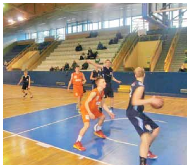
Wyjazdowy mecz koszykarzy UKS Żychlin z zawodnikami PKK 99 Pabianice, zakończony zwycięstwem Żychlina 78:66.