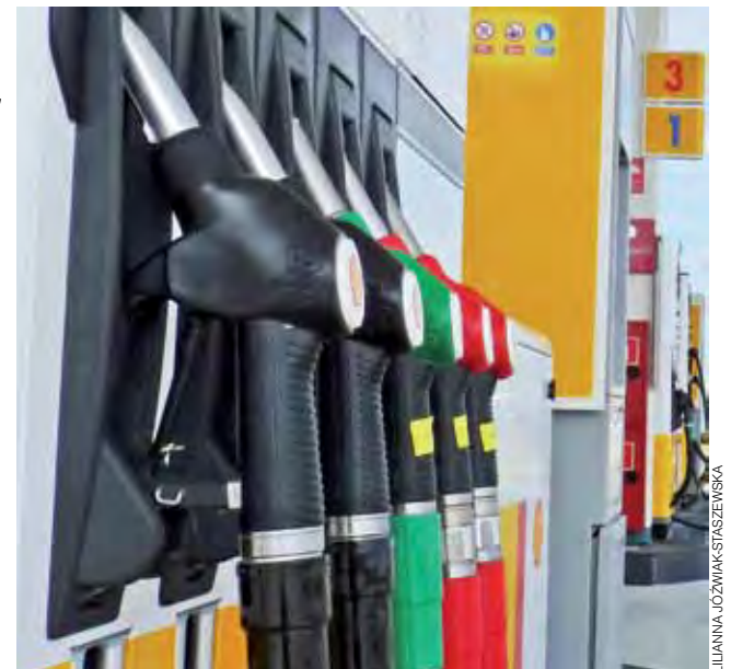
Klienci stacji benzynowych chwytają po nalewak do paliwa, nie zawsze za nie płacąc.

KPP w Łowiczu, w którego rejonie działania są z kolei stacje benzynowe BP przy MOP Parma/Polesie, w ubiegłym roku prowadziła 4 postępowania w sprawie kradzieży paliwa, które zostały zakwalifikowane jako przestępstwa. W jednym przypadku postępowanie jest nadal prowadzone, a w pozostałych zostały umorzone ze względu na niewykrycie sprawcy. Znacznie więcej, bo aż 90 przyjętych zawiadomień o kradzieży pali-