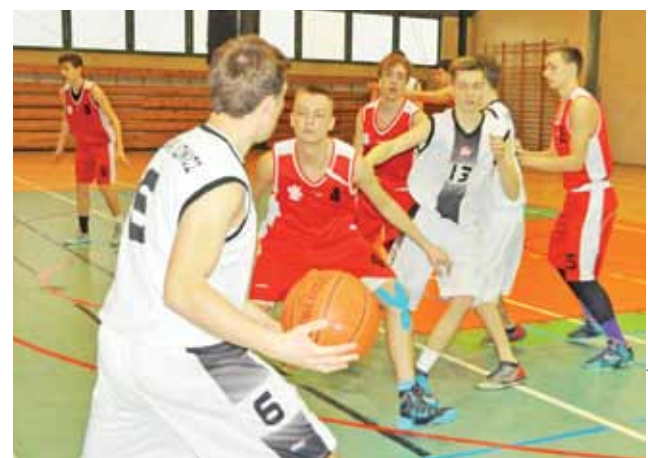
Juniorzy, mimo osłabień, powalczyli z liderem z Łodzi.