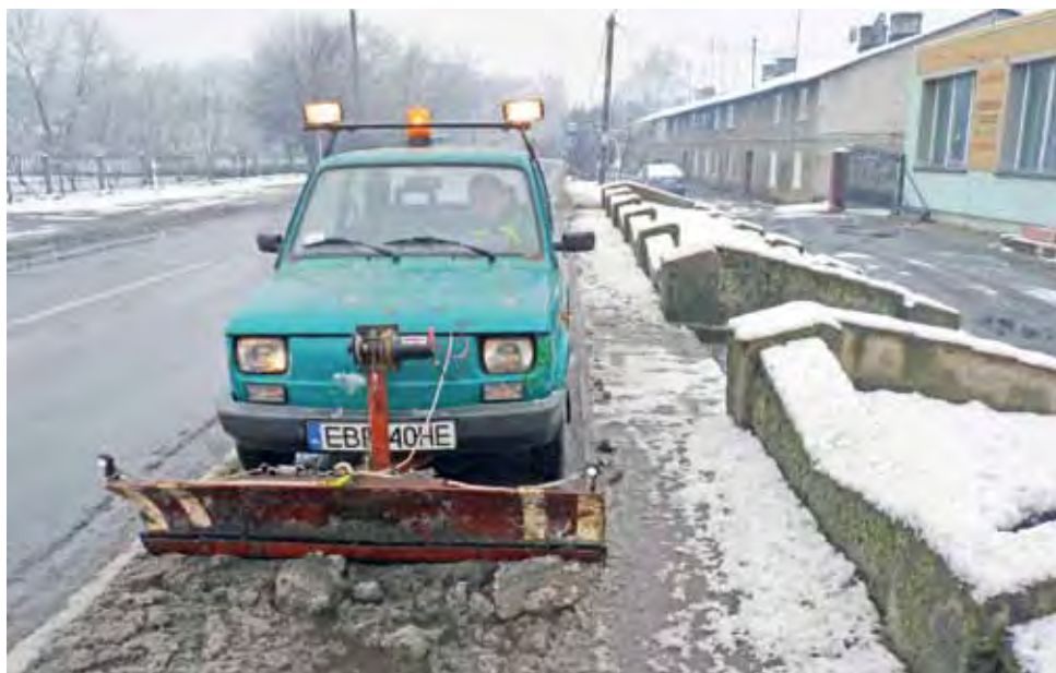
Malucha z pługiem zastaliśmy przy odśnieżaniu chodników dróg wojewódzkich w Dobrzelinie.