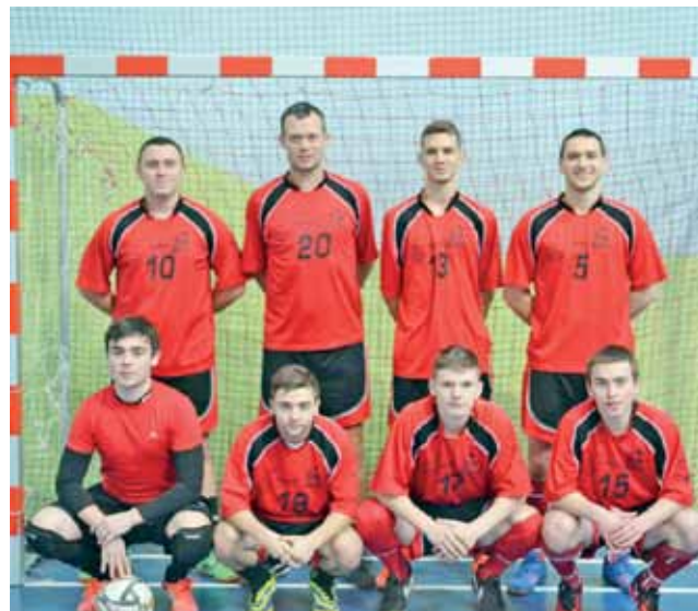
Zespół GKS Bedno I, który zajął trzecie miejsce w turnieju.

Piłka nożna | „Zina Cup” o Puchar Prezesa GKS Bedno