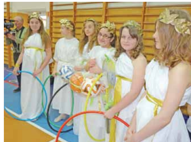
Uczennice z SP 1 występujące w roli olimpijskich bogiń z prezentami od gości – sportowym sprzętem.

zującymi olimpiadę, rozpoczęły sportową prezentację. Uczniowie demonstrowali kolejne dyscypliny sportowe: piłkę siatkową, piłkę ręczną, koszykówkę i piłkę nożną, tenis, unihokej i gimna-