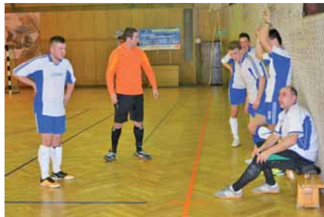
Gracze Zatorza III nie utrzymali prowadzenia i przegrali z Dąbro Łowicz.

W 9. kolejce, niedzielę 1 lutego zagrają: Bezbłędni - KS Ostrowiec (12:00), Ha Ha Ha - Chińska II (12:30), Szkiełka-Akacja (13:00), Bang Bang - Stefan (13:30), Zatorze III - FC CzaQu (14:00), Toreliusz - Orły (14:30), Bezedura - Dąbro (15:00).