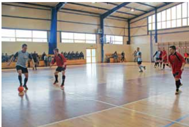
Pierwsze spotkanie 3. kolejki ŻHLPN: mecz na szczycie Shaolin kontra Jury Buhaj, zakończony wynikiem 1:2.