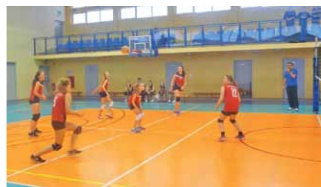
Siatkarki Mickiewicz Żychlin w wygranym 2:0 spotkaniu 9. kolejki KALS Kobiet z drużyną UKS Strzelce.

Najbliższy mecz drużyna Mickiewicz Żychlin rozegra 31 stycznia z drużyną Kasprowicz Kutno. mr