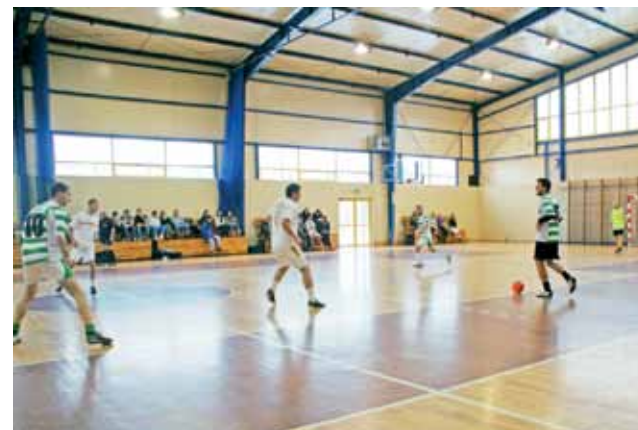
Spotkanie drużyn: Aa chmm Na pewno - Gladiatorzy z Miasta Noży I, które zakończyło się wygraną Gladiatorów 3:1.