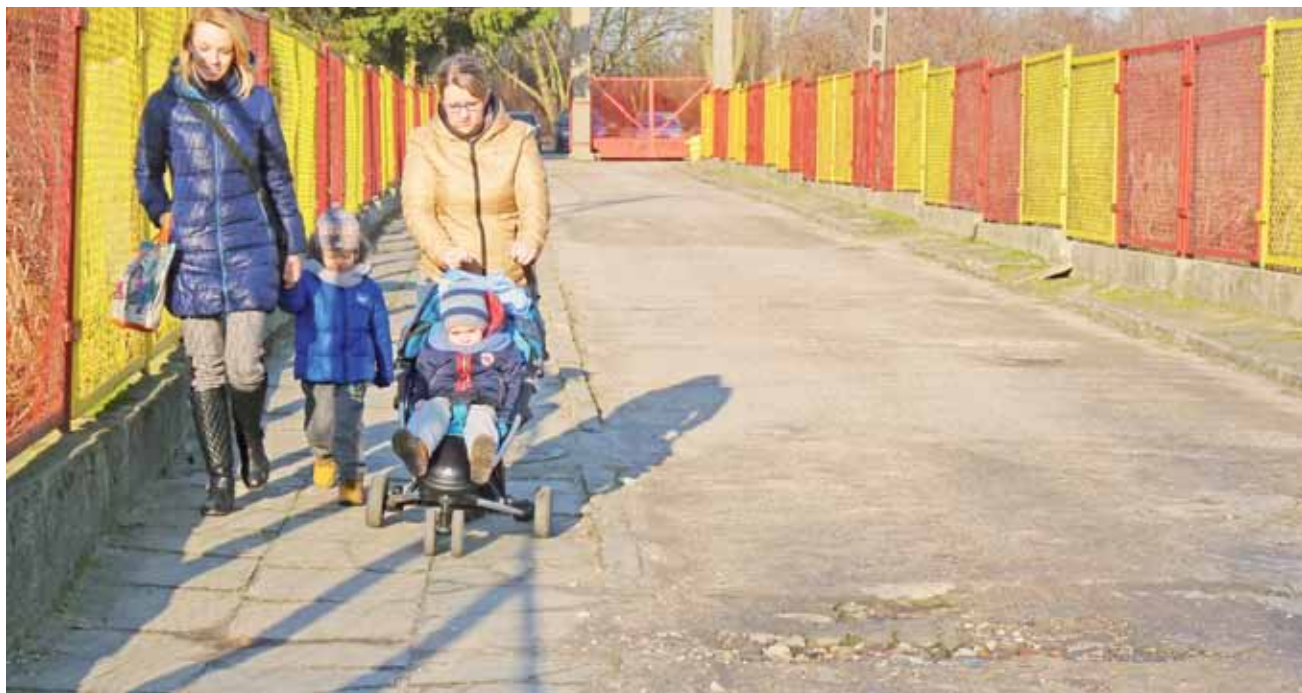
Rodzice i dzieci chodzące do Przedszkola Samorządowego nr 1 muszą chodzić po wypaczonym chodniku i jeździć po dziurawej drodze.