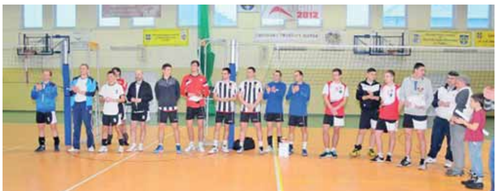
Drużyny biorące udział w VIII Turnieju Piłki Siatkowej Mężczyzn im. Czesława Lichoty w Piątku.