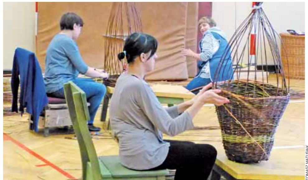
Podczas ostatnich zajęć uczestnicy kursu uczyli się wyrobu dużych koszyków. tm

Naukę plecionkarstwa uczestnicy kursu rozpoczęli od wykonania osłonek na doniczki. Do tej pory nauczyli się też wyrabiać małe kosze do ziemniaków, kosze na grzyby, a także rzeczy gabarytowe, takie jak kosze na bieliznę. Na kolejnych zajęciach poznają techniki wyrobu mebli i form ogrodowych. Większość opiera się na rzemiośle ręcznym, ale są też wspomagające pracę maszyny, służące na przykład do obrób-