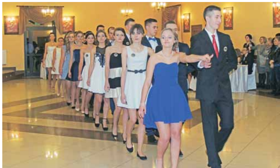
Poloneza czas zacząć – tak zaczęła się zabawa w sali we Franciszkowie.

łami olimpijskimi i, ku zaskoczeniu gości, wbiegli uczniowie szkoły, niosąc mnóstwo dotychczas wywalczonych przez siebie pucharów za sukcesy sportowe. – Sukcesy sportowe mieliśmy, gdy w szkole nie było sali gimnastycznej, więc jestem pewien, że teraz, gdy dajemy dzieciom warunki do rozwijania swoich sportowych umiejętności, będzie ich jeszcze więcej – mówił na zakończenie dyrektor. str. 4