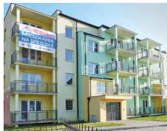
Gmina Żychlin szuka nabywców na mieszkania w stanie deweloperskim, wybudowane przy ulicy Łąkowej 6a, w dawnym bloku TBS Zgierz.

– Zgodnie z umową sprzedaży, zapłata całej kwoty nastąpi