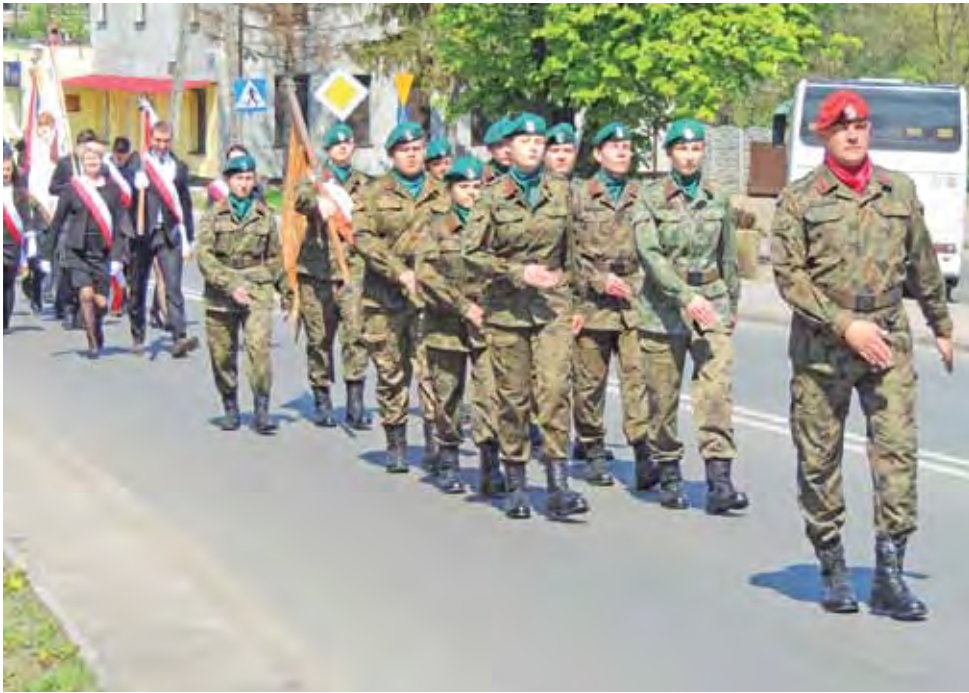
Uroczysty przemarsz z kościoła do Żychlińskiego Domu Kultury. Na czele strzelcy z LO. im. A. Mickiewicza.

Już za kilka tygodni pierwsze prace w parku w Oporowie. str. 7