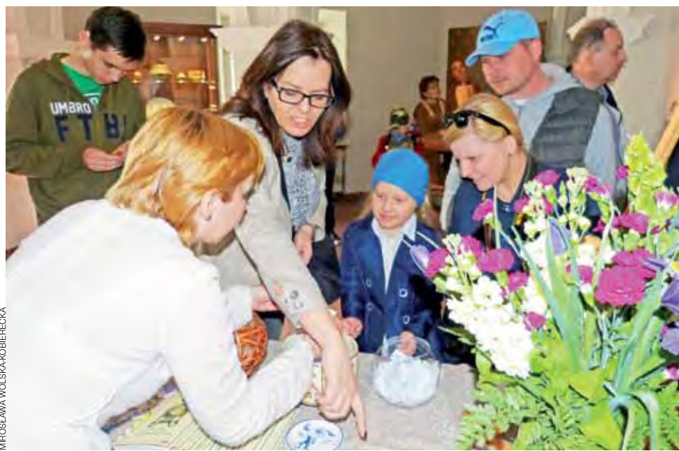
Za największą liczbę punktów w grze godzinnej można było sobie wybrać nagrodę z nieborowskiej majoliki.