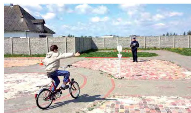
Ważnym elementem konkursu był przejazd rowerem po placu manewrowym.

9 szkół podstawowych i 8 gimnazjów rywalizowało 29 kwietnia w organizowanych na terenie ZSP nr 2 w Łowiczu powiatowych eliminacjach Turnieju Bezpieczeństwa w Ruchu Drogowym.