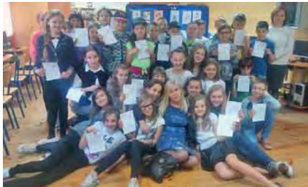
Uczniowie klasy V i III ze swoimi nauczycielkami zaraz po konferencji i warsztatach.

Minikonferencja połączona z wykładem, inscenizacja, konkursy i warsztaty odbyły się w ubiegłą środę w Szkole Podstawowej nr 4 w Łowiczu. Przedsięwzięcie rozgrywało się pod nazwą „Ortografia i gramatyka dla omnibusa i laika”.