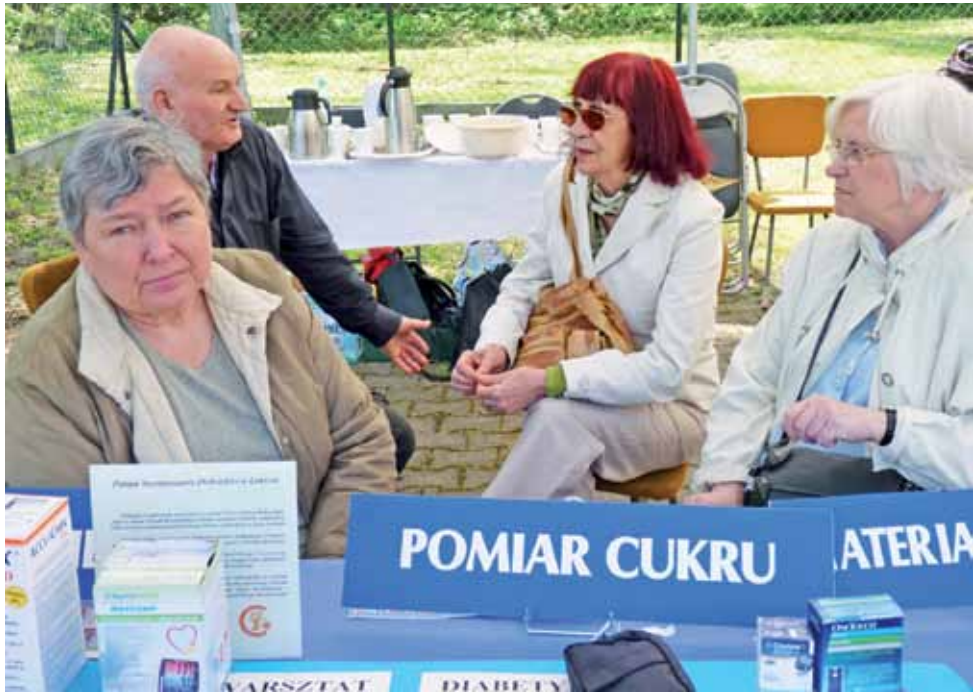
Miejsko-Powiatowe Koło Polskiego Stowarzyszenia Diabetyków w Łowiczu też miało swoje stoisko na pikniku.