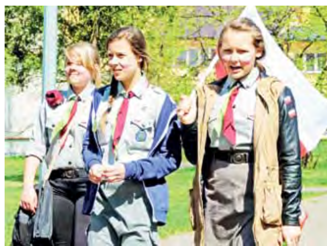
Widząc harcerzy z flagami i pomalowanymi twarzami, wiele osób dopiero przypominało sobie o święcie.

– Prosimy o polubienie go na stronie Fundacji Macte Animo (tylko tam). Jeśli każdy z Was kliknie „Lubię to”, a zajmuj-