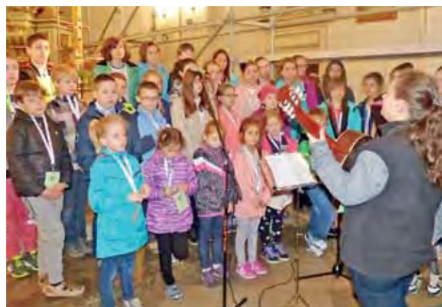
Przeгляд scholi rozpoczął się mszą św., podczas której na rozgrzewkę wystąpiła grupa z Bolesławca.