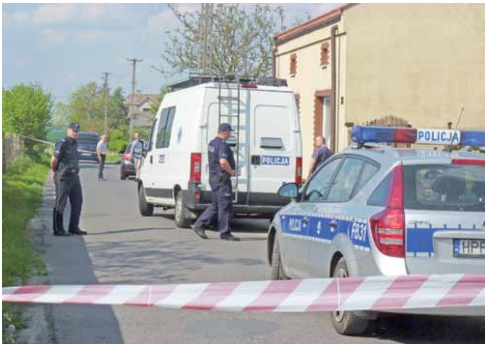
W tym domu, przy ulicy Głowackiego w Żychlinie, w sobotę rano odkryto zwłoki 67-letniej kobiety i ciężko poranioną 10-letnią dziewczynkę, wnuczkę kobiety. Teren został wydzielony przez policję biało-czerwoną taśmą.

Nasz jubileusz | Zaczęliśmy 11 maja 1990 r.