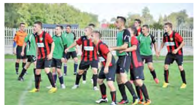
Gracze Victorii (czerwono-czarne stroje) wygrali ważny mecz ze Startem.