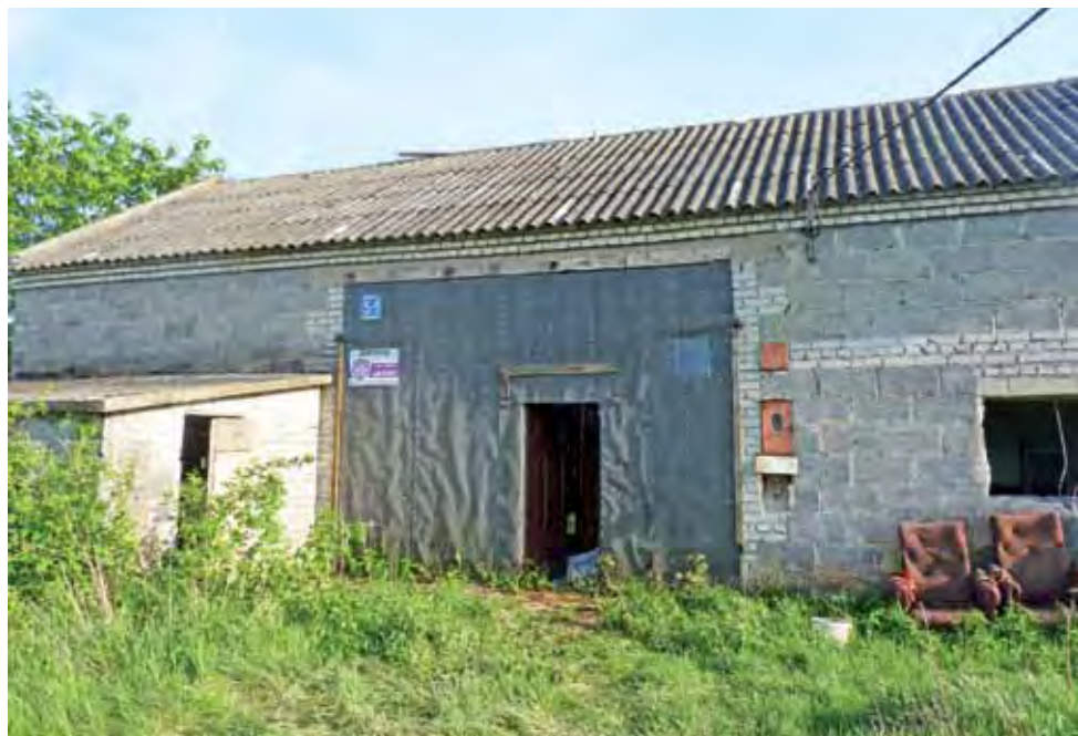
W tym pustostanie, w Sokołówku koło Żychlina, w budynku gospodarczo-mieszkalnym, należącym najprawdopodobniej do rodziny jednego ze sprawców, Grzegorza W., schowali się nieletni zabójcy.