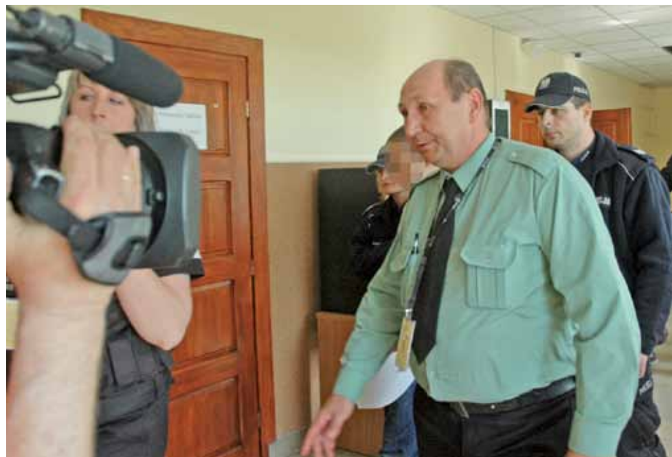
W poniedziałek, 11 maja, do Sądu Rodzinnego i Nieletnich w Kutnie, w asyście licznych funkcjonariuszy i dziennikarzy z różnych telewizji w Polsce, doprowadzono obu sprawców zabójstwa.

Żychlin | Niespełna 16-letni wnuczek zabił babcię, ranił siostrę cioteczną