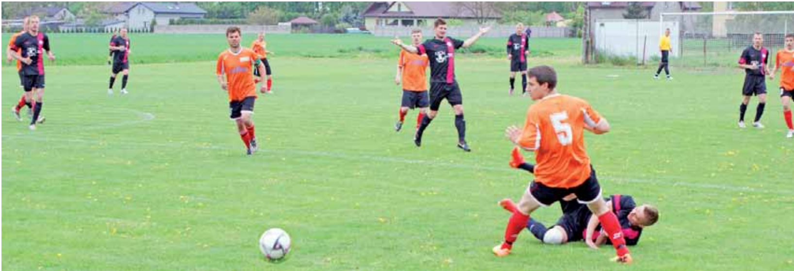
Remis 2:2 w meczu na szczycie łódzkiej klasy A grupy III pomiędzy GKS Bedno a Krośniewianka Krośniewice.

Piłka nożna | Rozgrywki Łódzkiej Klasy A Grupy III