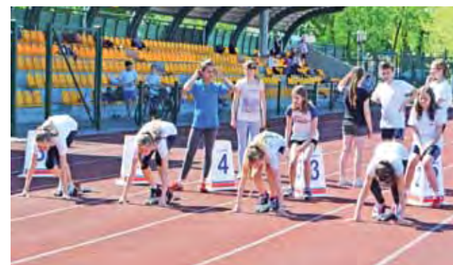
Jedną z konkurencji jest bieg na 60 metrów.