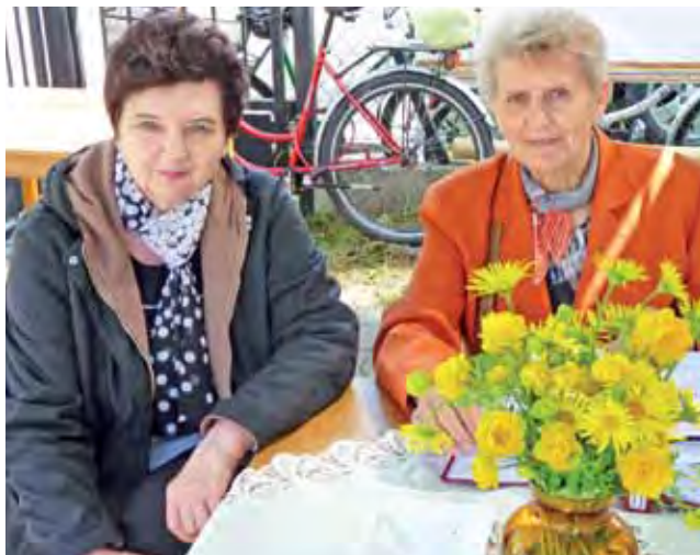
Panie ze Stowarzyszenia „Łowicki Klub Amazonek” na pikniku pojawiają się co roku.