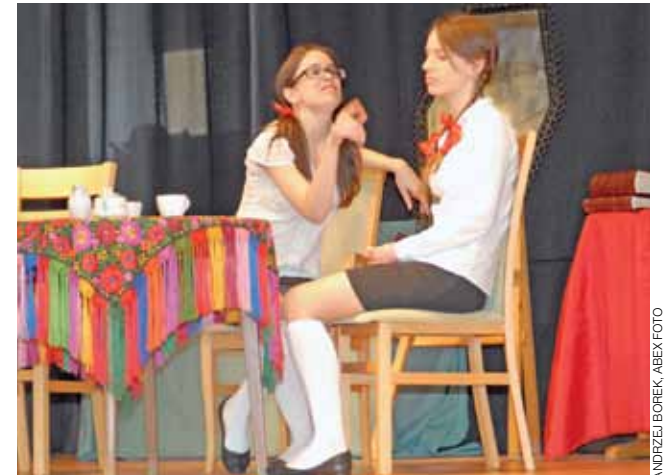
„Moralność pani Dulskiej” na scenie szkoły pijarskiej. Przedstawienia na zakończenie roku klas trzecich stają się tam tradycją.