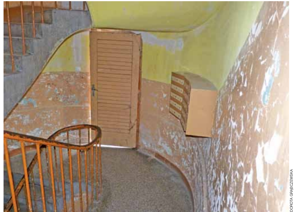
W tym roku zostanie pomalowana klatka schodowa w balkonowcu. Tam też będą wymienione drzwi wejściowe oraz drzwi na poszczególne balkony.

Na 2015 rok zaplanowano też remont elewacji na „porodówce”. Rok temu właśnie w tej kamienicy przeprowadzono gruntowny remont. Wyremontowano dach, by woda nie zalewała mieszkań i korytarza, wymieniono drzwi wejściowe i zrobiono nowe tynki z płyt kartonowo-gipsowych w korytarzu.