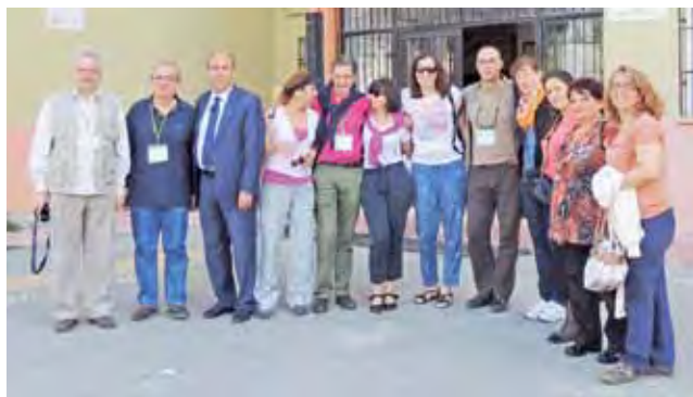
Nauczyciele biorący udział w projekcie Erasmus+ My school, our future – ESL Project przed szkołą w Mersin.

Jednym z elementów projektu jest stworzenie szkolnego ogrodu, by uczniowie brali odpowiedzialność za swoje otoczenie i mogąc je kreować, czuli się lepiej w szkole. Uczniowie projektują