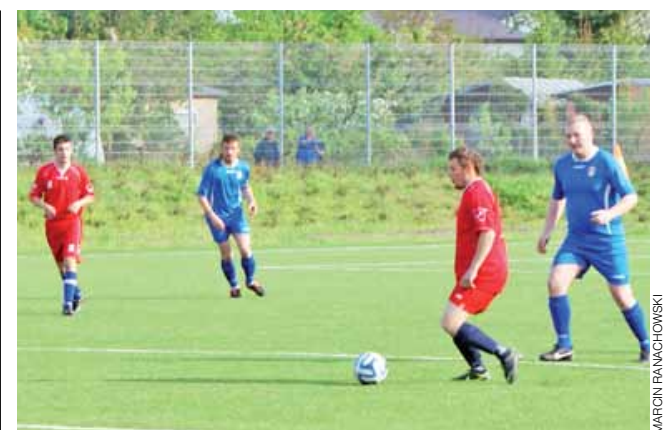
Przegrana Delty Śleszyn w szlagierowym spotkaniu z Iskrą Górą Św. Małgorzaty 1:3.