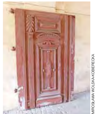
Grube drewniane drzwi w bramie to pamiątka dawnej świetności.