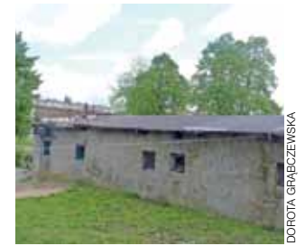
Spółdzielnia Mieszkaniowa Wspólny Dom chce zburzyć komórki przy stadionie, które już kilka razy były podpalane.