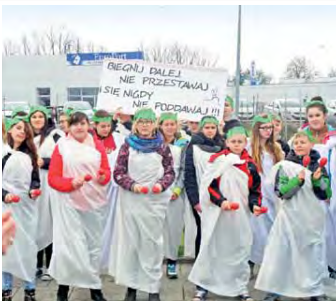
ZESPÓŁ SZKÓŁ SWIĄTO WSI WALISZEWIE

Już po raz trzeci uczniowie Zespołu Szkół Stowarzyszenia Wsi Waliszew i Okolic ze Starego Waliszewa wzięli udział w konkursie Mistrz Kibicowania, zorganizowanym 19 kwietnia podczas łódzkiego maratonu. Konkurs polegał na stworzeniu jak najciekawszego punktu kibicowania na trasie biegu. W tym roku uczniowie z Waliszewa przebrali się za postacie ze Starożytności Grecji. Był wśród nich Zeus, władca Olimpu. Kibicowali przy ul. Denej. W podsumowaniu konkursu zajęli 6. miejsce. W nagrodę dostali bon na sprzęt sportowy. oprac. ewr