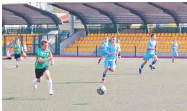
Pelikan 2001 zagrał bardzo ambitnie, jednak uległ SMS-owi 0:3.