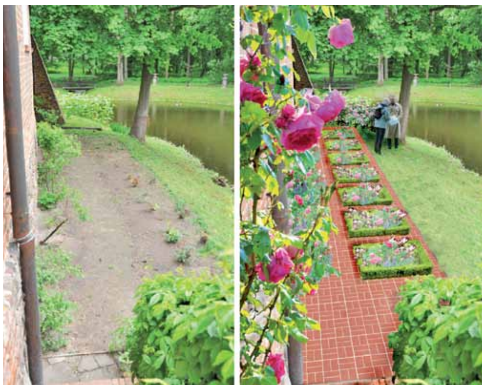
Ogród różany – wizualizacja fragmentu parku w Oporowie. Po lewej stan obecny, po prawej – po rewitalizacji według autorstwa Macieja Rymkiewicza.

Przy betonowych ławach posadowionych naprzeciwko zamku za fosą powstaną różane ogródki. Zostaną one zorganizowane na wzór ogrodu królowej Bony, czyli na kształt stylu ogrodów włoskich z XVI wieku, okresu renesansu, z dużą ilością ziół i przypraw, z mnóstwem pachnącej lawendy, bratków, nagietków, złocieni. Na podwyższonych rabatach, w drewnianych skrzyniach o wymiarach 2,2 na 1,1 m rosną wiosną narcyzy, hiacynty, pierwiosnki, orliki, konwalie, a latem lillie, goździki, malwy, margerytki czy kosańce. Kompozycje na rabatach toną w ziołach: bazylii, majeranku, rozmarynie, szalwii, mięcie, melisie i macierzance. dag