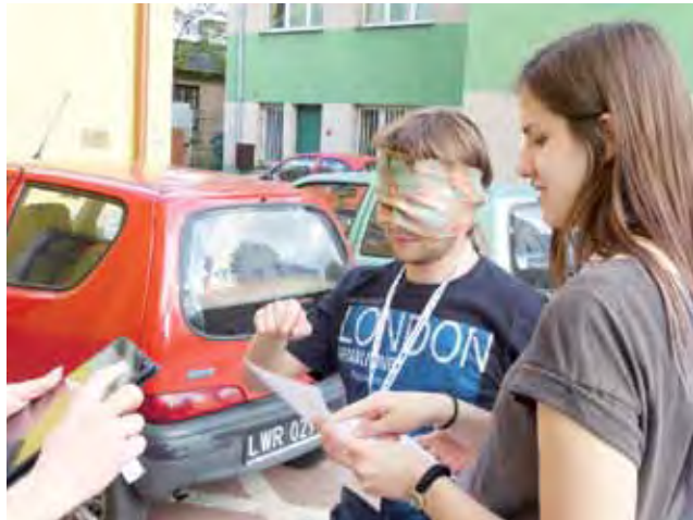
Niektórzy członkowie zespołów musieli działać nawet z zawiązanymi oczami. Na zdjęciu – późniejsi zwycięzcy gry, czyli „Klawesynty”.

czasach znalazł się on na skutek konfliktu z tajnym bractwem czasoprzestrzennych alchemików, które potem utrudniało śmiałkom wykonywanie zadań. Historia brzmi bajkowo, ale animatorzy przemycili w niej nieco wiedzy z historii, a jeszcze więcej z zakresu funduszy europejskich i finansowanych przy ich udziale inwestycji.