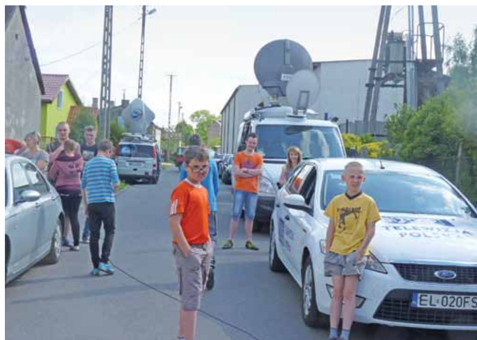
Na miejsce tragedii w Żychlinie przyjechały wozy transmisyjne wszystkich stacji telewizyjnych. Przychodzili też mieszkańcy, uczniowie SP 1 oraz Gimnazjum w Żychlinie.

Sąsiedzi przyznają, że mimo iż wydawał się być spokojny, zachowywał się dziwnie. Nikomu z najbliższych sąsiadów nie mówił dzień dobry, a gdy babka mu zwróciła uwagę: – Powiedz panu dzień dobry – też nie reagował. Koledzy z podstawówki przyznają, że nie raz się z niego się