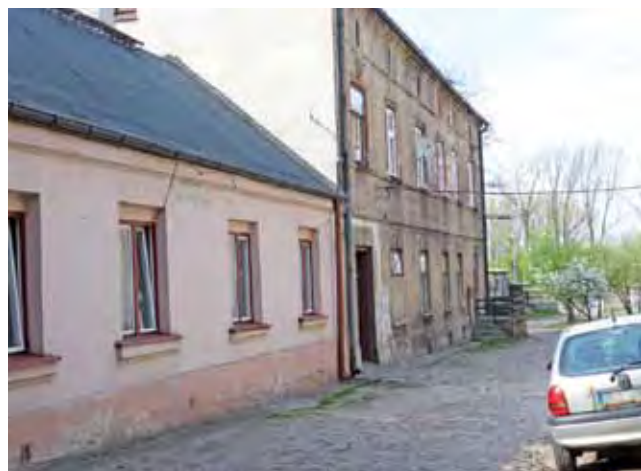
Oficyny w podwórku są wykonane z materiałów gorszej jakości, a ich ściany są cienkie. Czy warto będzie je zachować?