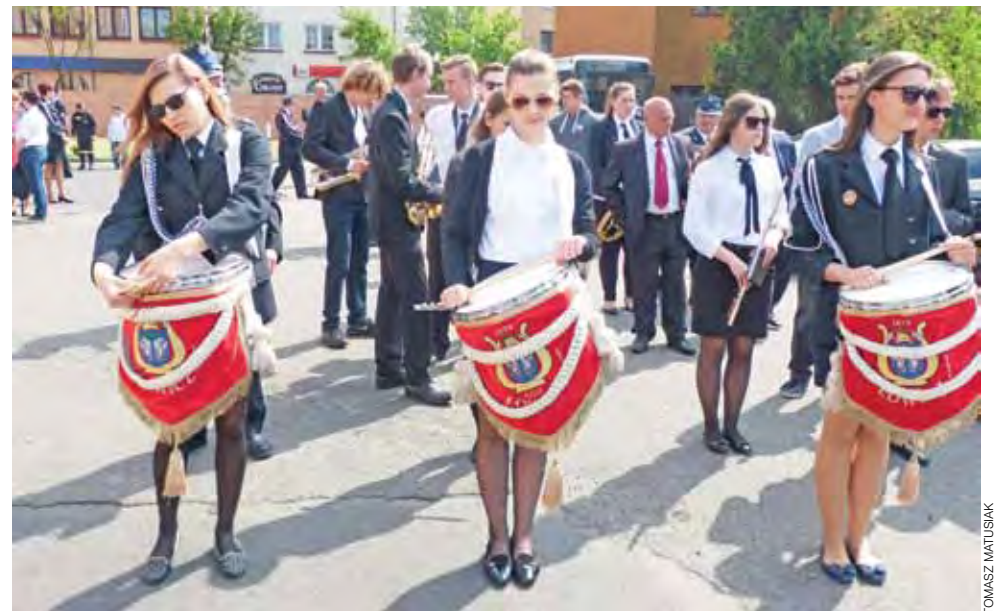
Werblistki z łowickiej OSP przygotowują się do rozpoczęcia uroczystości.

dłużej jako Polfa Łyszkowice, w latach 1976-1999). Większość budynków całego kompleksu zakładu została wyburzona w latach 2001-2003, a zakład przeniesiony do lokalizacji, w której znajduje się obecnie jako Takeda Pharma. Nazwa „Mydlarnia” przetrwała w świadomości mieszkańców do dzisiaj i znajduje się w nazwie wspólnoty mieszkaniowej, która obecnie zarządza obiektem – został on bowiem adaptowany do celów mieszkalnych, podobnie jak sąsiadująca z nim „Podkowa”, również będąca kiedyś częścią zakładów. tm