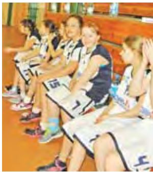
Skrzatki Książka odniosły pierwsze w lidze.

W drugim meczu przeciwnikiem zawodniczek z Łowicza był TK Basket II. Rezerwy okazały się słabsze i nasze najmłodsze zawodniczki mogły się cieszyć