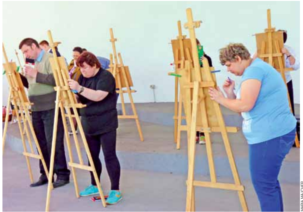
Chętnych do zaprezentowania swojego talentu plastycznego było wielu. Sztalugi na tyłach muszli zawsze były przez kogoś zajęte.

Łowicz | Piknik Europejski już po raz szósty