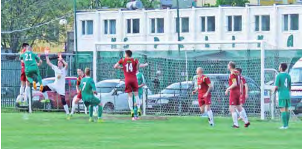
Mocną stron wszystkich czołowych zespołów III ligi są stałe fragmenty gry.