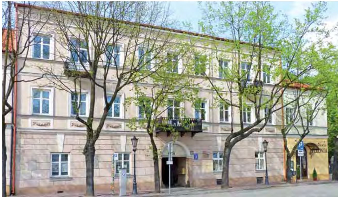
Od Starego Rynku kamienica napoleońska wygląda bardzo okazale, jej elewacja ma wprawdzie niewielkie pęknięcia, ale poza nimi nic nie wskazuje na to, w jak złym jest stanie technicznym.

Przypomnijmy, że cała nieruchomość, w której jest 16 lokali, została skomunalizowana w lipcu 2010 roku. Wtedy to ówczesna