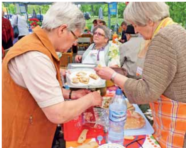
Panie z Uniwersytetu Trzeciego Wieku robiły kanapki z wiejskim smalcem, domowymi ogórkami i wiejskim chlebem.