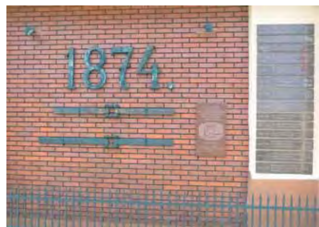
Ekspozycja na ścianie „Mydlarni”, wzbogacona o tablice z chronologią (w prawej części).