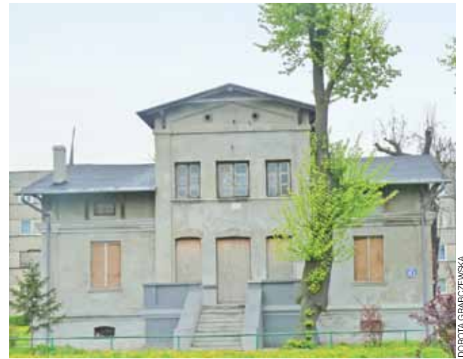
Dworek przy ulicy Narutowicza. Po drobnym liftingu nieruchomość prezentuje się atrakcyjnie.

Po drobnym remoncie dworek od razu zyskał na wyglądzie. Nie straszy, a nawet zacieka swoją architekturą. Wprawdzie procedury sądowe potrwały, jednak jeśli gmina będzie pełnoprawnym właścicielem nieruchomości, obiekt może być sprzedany. Póki co decyzji, co zrobić z dworkiem nie ma. dag