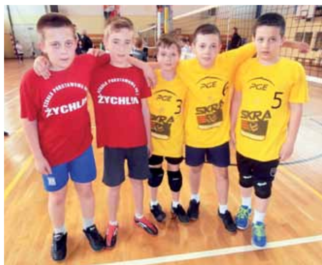
Uczniowie SP Nr 2 Żychlin podczas rozgrywek minisiatkówki Kinder+Sport w Łodzi.

Do rozgrywek ćwierćfinałowych „dwójek” (klasy IV), stanęło 24 zespoły. Drużyny zostały