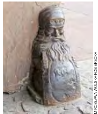
W bramie kamienicy zachowały się solidne, żeliwne krasnale, które chroniły naroże budynku przed powozami.