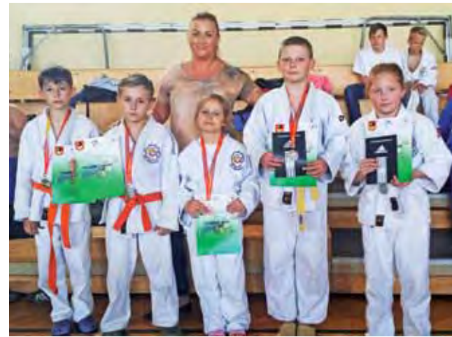
Łowiczanie byli zadowoleni z medali zdobytych w Bielsku.