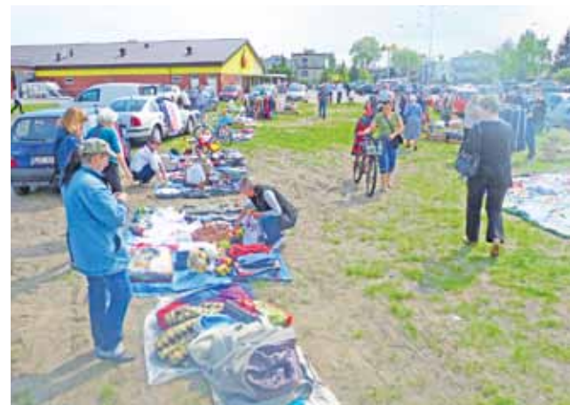
Po godzinie 10 wyprzedaż zaczęła się „rozkręcać”.