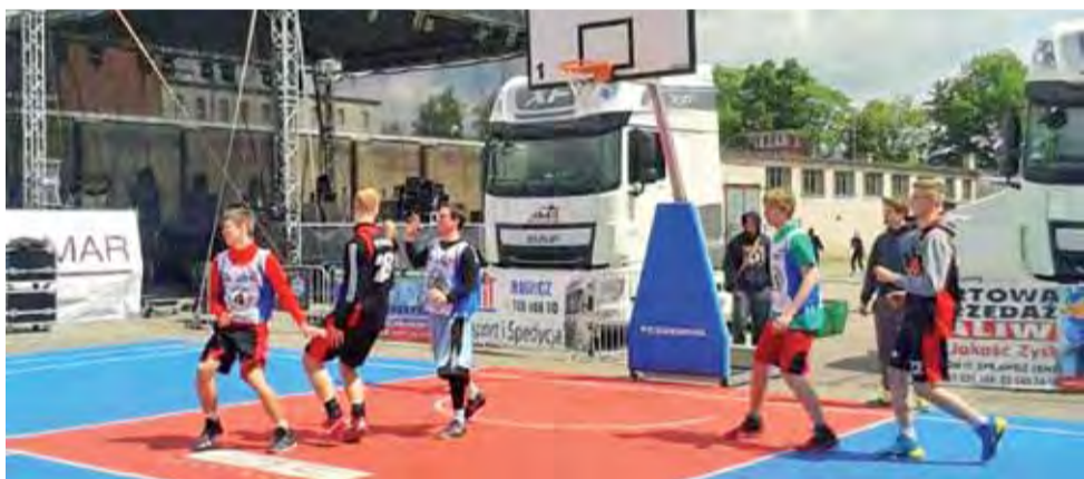
Koszykarze UKS Żychlin podczas finałowego meczu z drużyną Ziomki spod biedronki Rawicz.