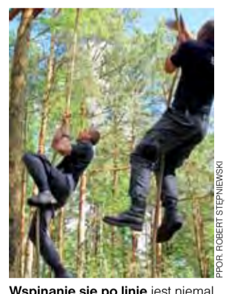
Wspinanie się po linie jest niemal tak samo męczące jak sam bieg.

Osobną kategorią była rywalizacja dyrektorów jednostek, złożona ze strzelania i rzutu granatem. Kierujący Zakładem Karnym w Łowiczu rozstrzygnęli tę rywa-