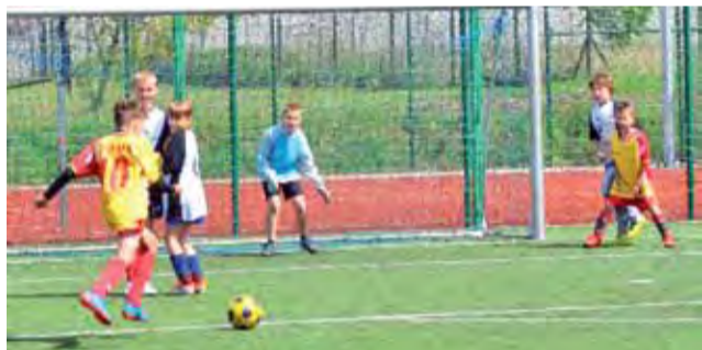
Mecz zawodników z Bedna przeciwko piłkarzom z Kiernozi, podczas I Turnieju piłki nożnej o Puchar Burmistrza Gminy Żychlin. Wygrana w tym spotkaniu należała do Bedna (2:1).

drużyny: Żychlin, Bedno i Kiernozia. Drużyna z Kutna, która miała być czwarta ekipa, niestety nie stawiała się na zawodach. Zespoły grały systemem „każdy z każdym”, 2x15 minut.