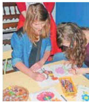
W warsztatach plastycznych chętnie wzięła udział młodzież goszcząca w muzeum.