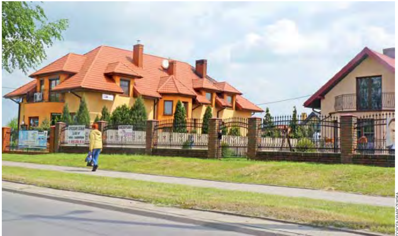
Gdy wyznaczano pierwsze działki przy ulicy Orłowskiego pod zabudowę jednorodzinna, też były obawy, czy znajdą się chętni. Dziś to jest najładniejsze osiedle w mieście. Część osób pozakładała też własną działalność gospodarczą.

Urząd dokonując wyliczeń wysokości dochodów, jakie mogłyby wpłynąć do kasy gminnej ze sprzedaży działek, skalkulował, że cena za metr kwadratowy wyniesie 45 zł, czyli 2,7 mln zł pomniejszone o 290.000 zł za działki prywatne. Przyjmując szacunki urzędu 45 zł/m 2 – to za uzbrojoną działkę 360 metrów kwadratowych ludzie