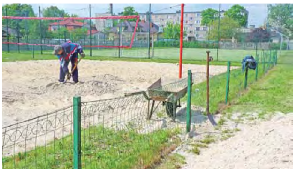
Pracownicy z robót publicznych uzupełniają boisko przy ulicy Łąkowej, do piłki plażowej 16 tonami piasku