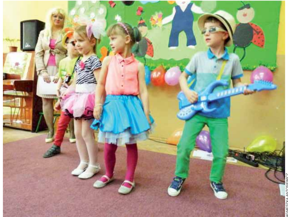
Przedszkolaki zaskakiwały scenicznym ruchem i barwnymi strojami.