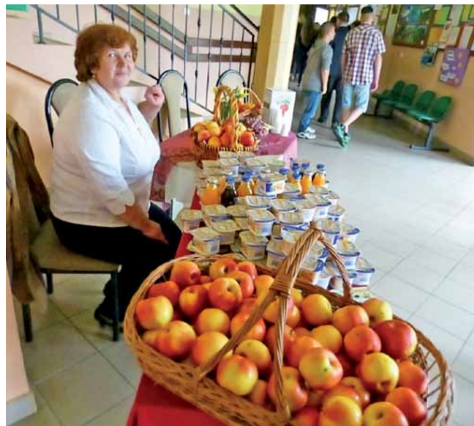
Już przy samym wejściu do szkoły czekał na wszystkich zdrowy poczęstunek.