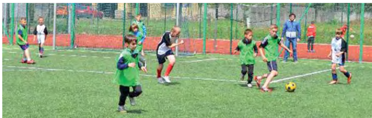
Spotkanie młodych piłkarzy Żychlin kontra Kiernozia, zakończony zwycięstwem graczy z Żychlina 2:1.

Był to pierwszy z serii cyklicznych turniejów, które będą odbywały się na Orliku, na przestrzeni 2015 roku. Następny turniej odbędzie się już 14 czerwca, kolejny zaś w październiku. W turnieju udział wzięły trzy