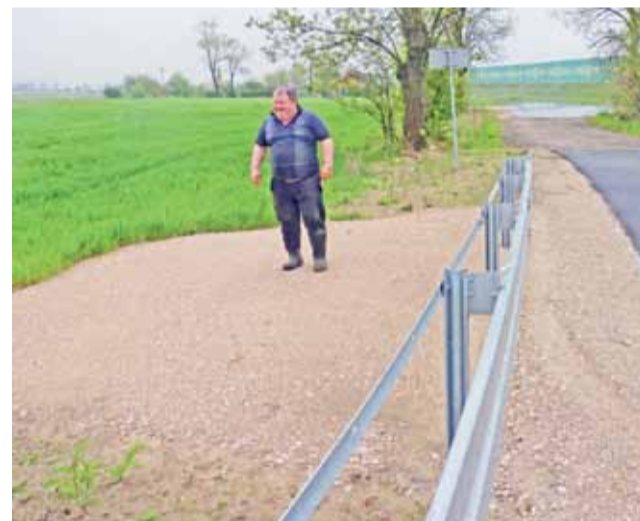
Budimex, drugi wykonawca fragmentu A1, w pobliżu węzła Kutno-Wschód zrobił wjazd na pole, po czym zastawił je barierkami. Po naszej interwencji ma zrobić zjazd na pole za barierkami.

– Dla mnie to apogeum głupoty. Nie wiem, kogo zatrudniają w tych firmach