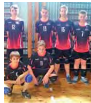
Reprezentacja SP Nr 2 Żychlin podczas ćwierćfinału mini-siatkówki Kinder+Sport w Łodzi.