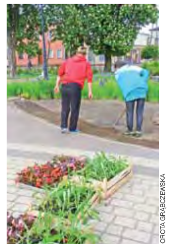
Różnorodne kwiaty były wysadzone na klombie koło fontanny w środę, 20 maja

Zagospodarowanie terenu będzie z pożytkiem dla mieszkańców, ale to również kreowanie pozytywnego wizerunku gminy, zwłaszcza w oczach przy-