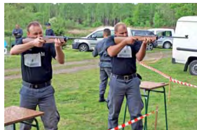
Funkcjonariusze na strzelnicy.

Zawodnicy przystępowali do rywalizacji w mundurach polowych. Mieli do przebiegnięcia dystans 2 km. Po przebiegnięciu pierwszych 100 metrów musieli się zatrzymać na strzelnicy, wziąć wiatrówkę i trafić z niej do tarczy oddalonej o 15 metrów. Następnym zadaniem, na 270 metrze trasy, było wspinanie się po linie na wysokość 5 metrów. Liczył się czas. Na 450 metrze zawodnicy rzucali z 20 metrów granatami ćwiczebnymi do okręgu o średnicy 3,5 metra. Ostatnim z przystanków było drugie strze-