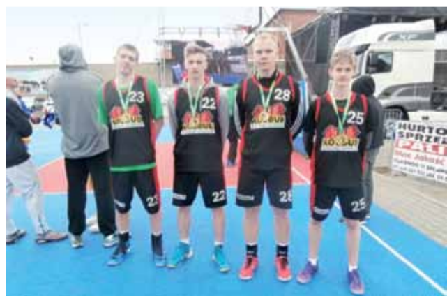
Skład drużyny UKS Żychlin podczas Streetball w Rawiczu w dniu 17 maja 2015.