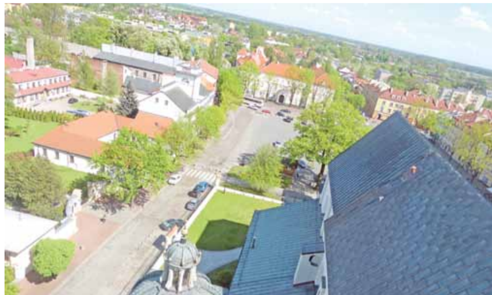
Widok na panoramę miasta rozciągający się z tarasu widokowego jednej z wież bazyliki katedralnej.

Łowicz | Muzeum Diecezjalne otworzyło swoje drzwi