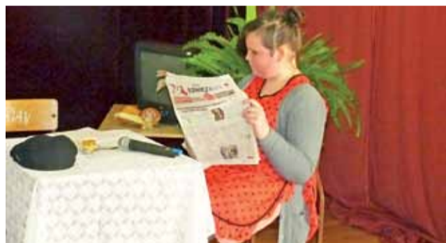
Skąd mama Marlenki wzięła błędne przekonania na temat diety? Na pewno nie z „Nowego Łowiczana”, którego czytała przed obiadem.

staram się do tych zasad stosować na co dzień.