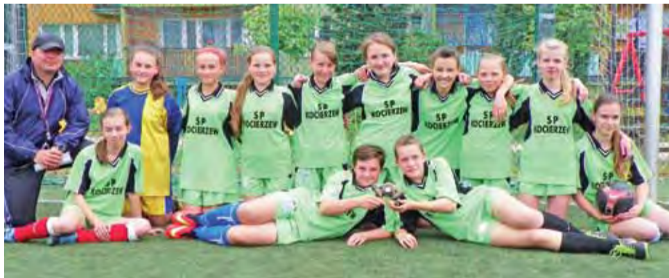
Dziewczyny z SP Kocierzew wygrały w powiecie i zagrają w zawodach rejonowych.

Mistrzynie powiatu, które razem awansowały do zawodów rejonowych z SP Kocierzew grały