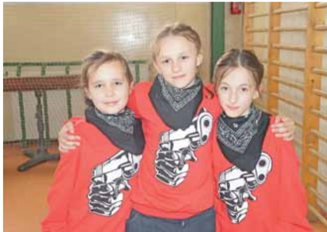
Najmłodsze tancerki łowickiej szkoły tańca DNA Dance Studio.

Podobnie jak dziewczyny wypowiedziała się Małgosia, która też tańczy 2 lata i swoją taneczną pasję chce za wszelką cenę rozwijać dalej i osiągać same sukcesy. ■