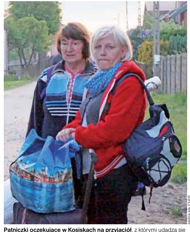
Pątniczki oczekujące w Kosiskach na przyjaciół, z którymi udadzą się w poszukiwaniu noclegu.

Łowicz – Jeżów – Kosiska | Ruszyła 360 Łowicka Piesza Pielgrzymka na Jasną Górę