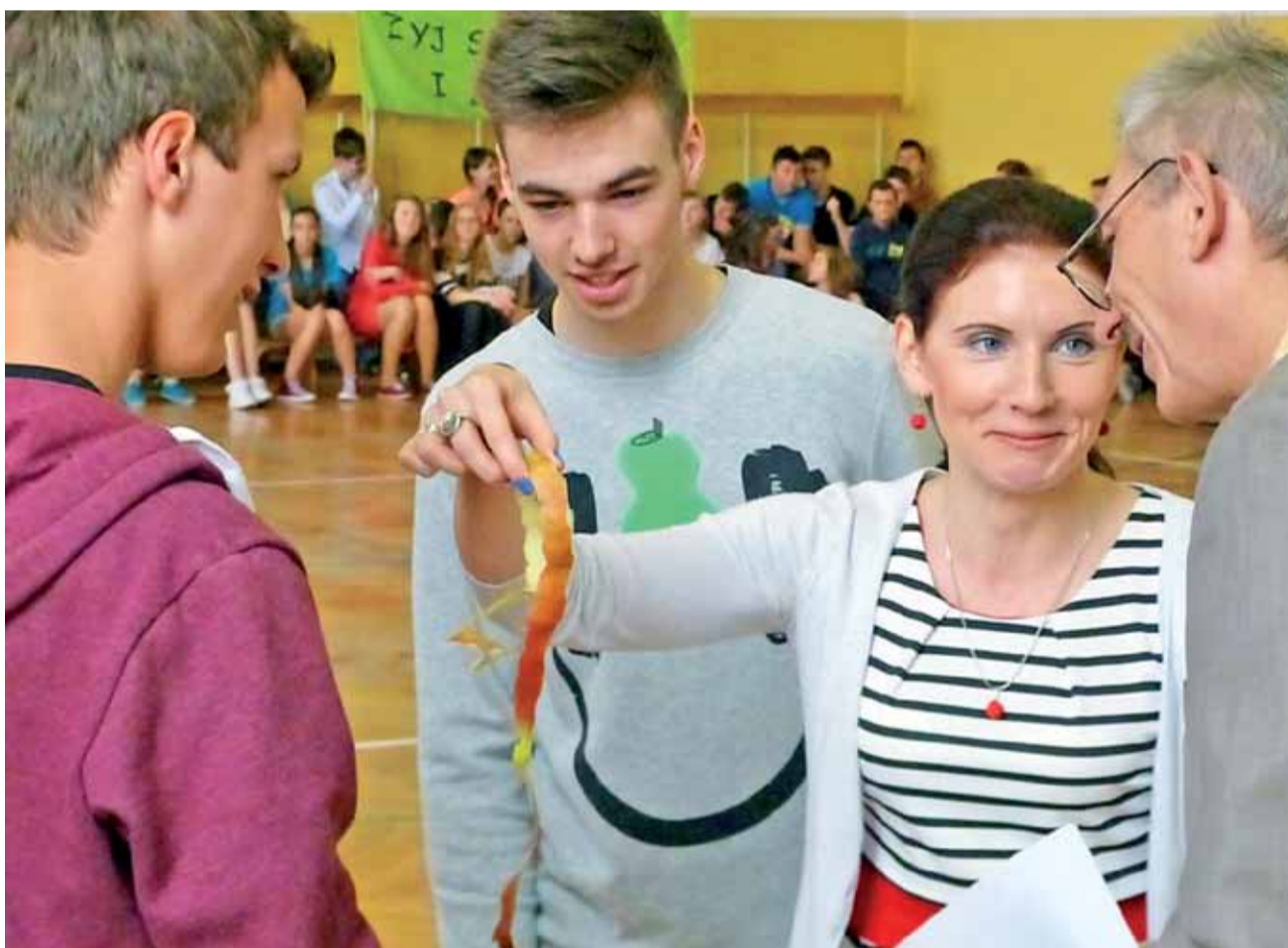
Jury turnieju oceniali poprawność wykonywanych zadań bardzo skrupulatnie i sprawiedliwie.