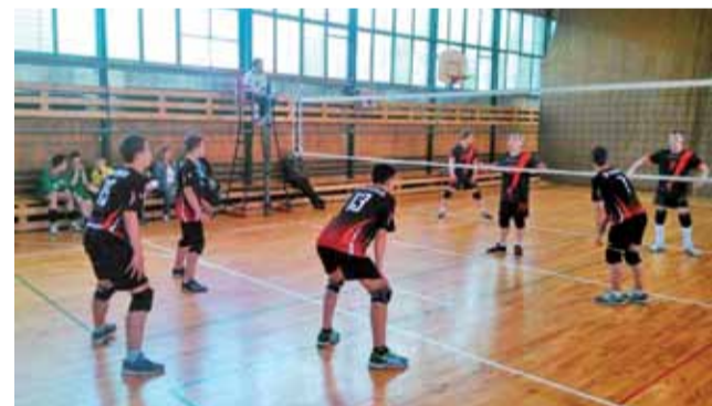
Uczniowie SP Nr 2 Żychlin podczas rozgrywek minisiatkówki chłopców klas szóstych Kinder+Sport w Rawie Mazowieckiej.

Wyniki SP Nr 2 Żychlin: ■ SP Nr 2 Żychlin – Krótka Piłka Łódź 2:1