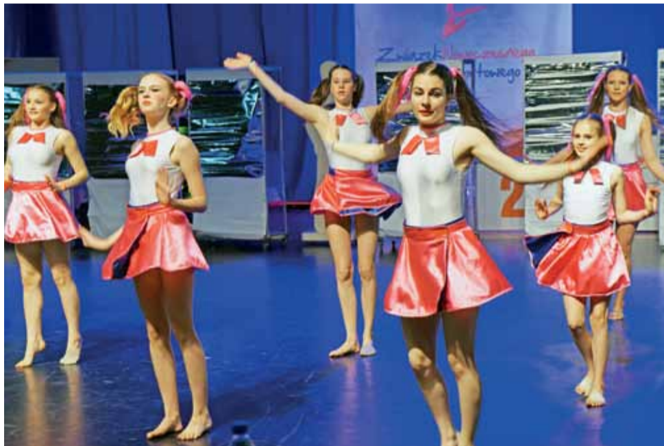
Aż 20 tancerek ze szkoły tańca Egurrola Dance Studio w Warszawie wystąpiło w niedzielę, w technice fantasy, w grupie wiekowej junior. Dziewczęta w swojej grupie wiekowej zajęły pierwsze miejsce.

– Powiedziała nam, że w Łowiczu nic się nie dzieje, nie ma dla dzieci żadnych ciekawych, rozwijających zajęć. To dało nam do myślenia i w krótkim czasie otworzyliśmy nabór