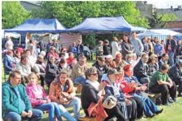
Publiczność podczas festynu dopisała.

Na festyn przybyło wielu mieszkańców Żychlina i okolic, ponieważ atrakcji nie brakowało.