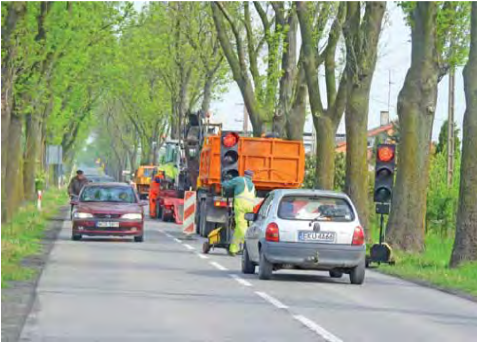
Aby zminimalizować utrudnienia w ruchu, na drodze wojewódzkiej z Żychlina do Gostynina ustawiono sygnalizację świetlną.

NASI DZIENNIKARZE DO WASZEJ DYSPOZYCJI OD 8.30 DO 15.30 Telefon redakcyjny 796 455 333 e-mail: zychlin@lowiczanie.info DOROTA GRABCZEWSKA