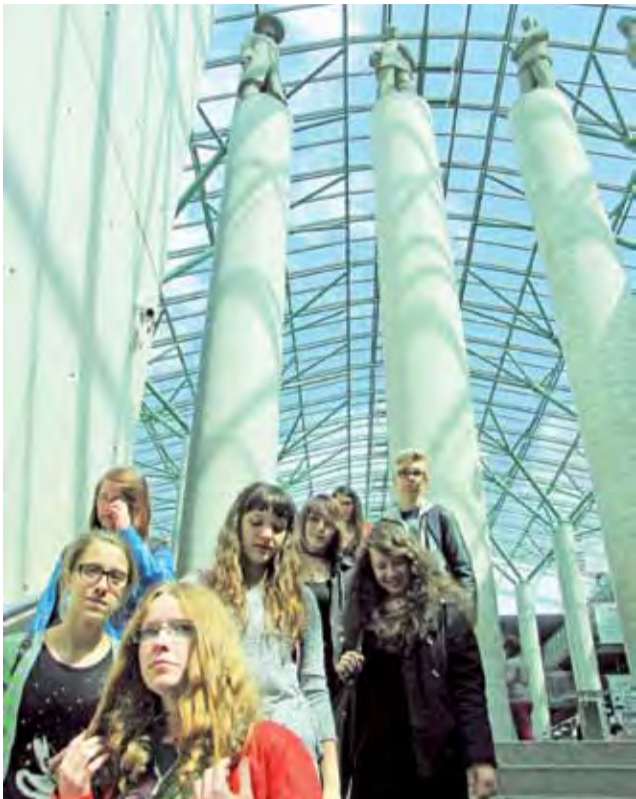
Uczniowie z ZS nr 1 zwiedzali Bibliotekę Narodową w Warszawie i Bibliotekę Uniwersytecką zachwycając się ich architekturą.