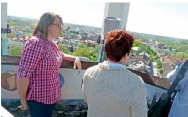
Clue programu stanowiło wejście na taras widokowy, skąd rozciągał się przepiękny widok na panoramę miasta.

Kolejny poziom poświęcono pamiątkom po zwierzchnikach Kościoła, pochodzącym z czasów, gdy Łowicz był rezydencją Prymasów Polski. W gablotach wyeksponowano doskonale za-