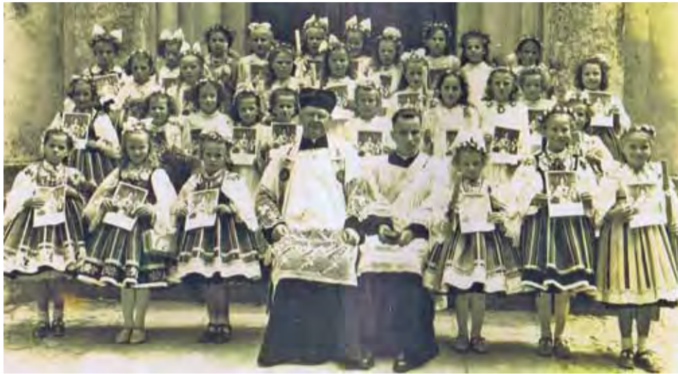
Pierwsza Komunia Święta w parafii kocierzewskiej, lata 50. XX w.