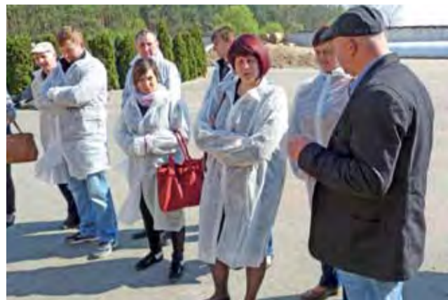
Jedno ze szkoleń dla gminy Kocierzew Południowy. Uczestników przywitała piękna pogoda.