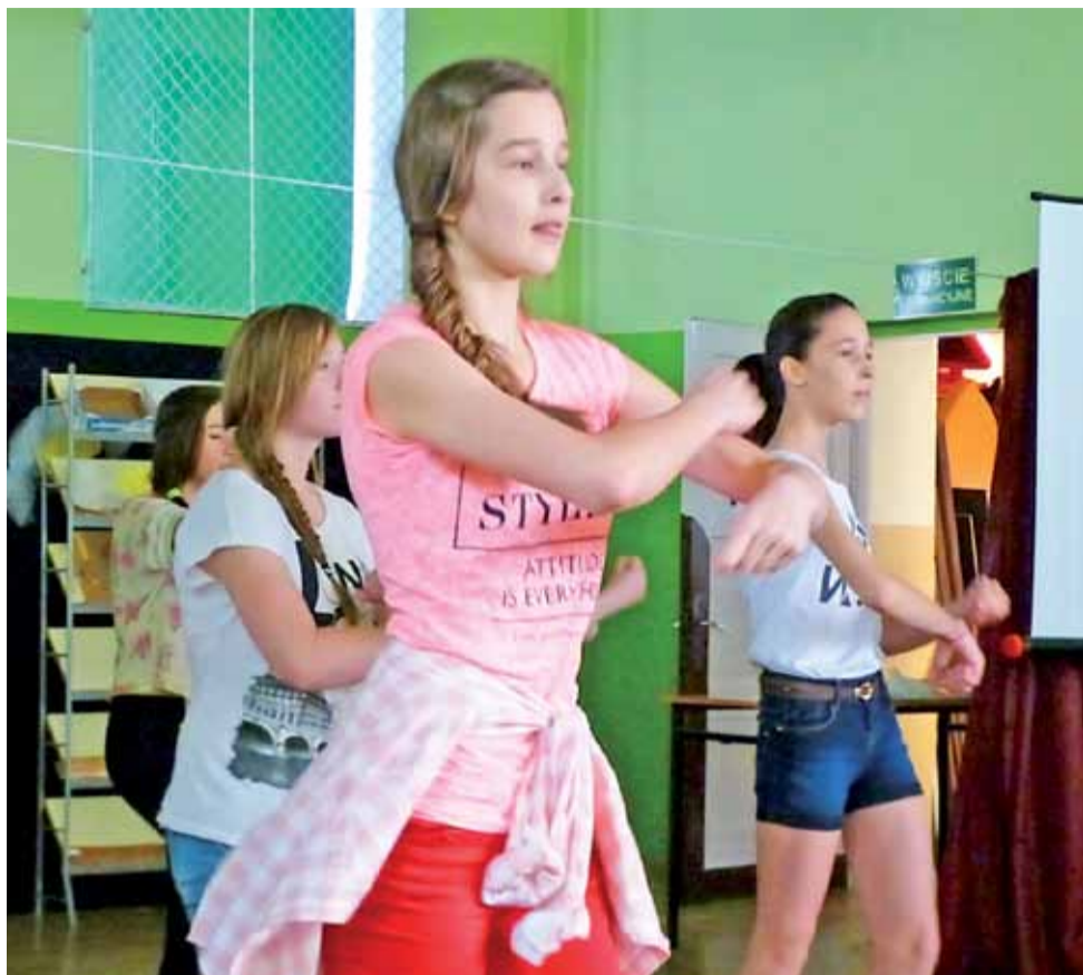
Dziewczęta ze szkoły w Błędowie poprzez tańczenie zumbę pokazały, że lubią ruch i ćwiczenia.