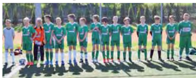
Zawodnicy Pelikana tuż przed meczem z Białką