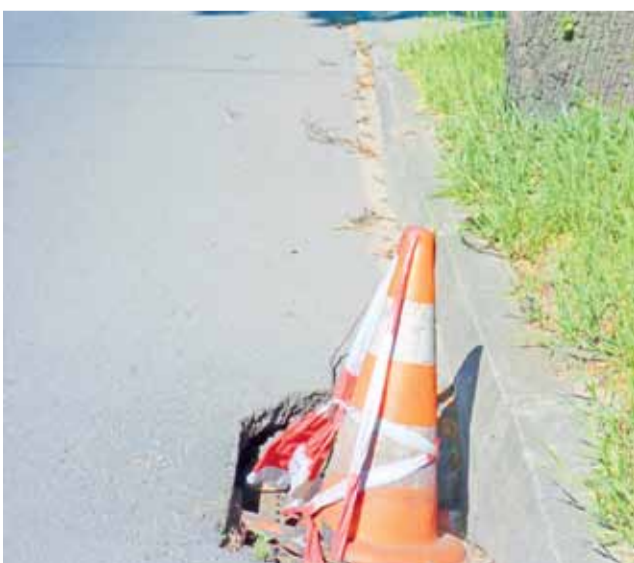
Niczyja studzienka w drodze powiatowej, w ulicy 1 Maja, czeka na naprawę, oby przed Świętem Żychlina, gdy na ulicy będzie wzmożony ruch. DOROTA GRABCZEWSKA