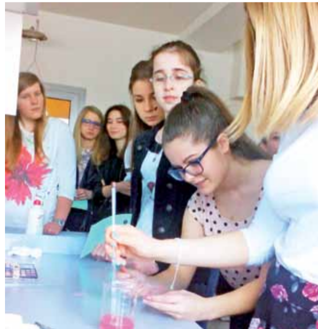
Dziewczeta z Pijarskiego LO wraz ze studentkami łódzkiej politechniki pracują nad własnymi kosmetykami.

– Ja się szczególnie interesuję wszystkim, co związane z komputerami, programowaniem, grafiką