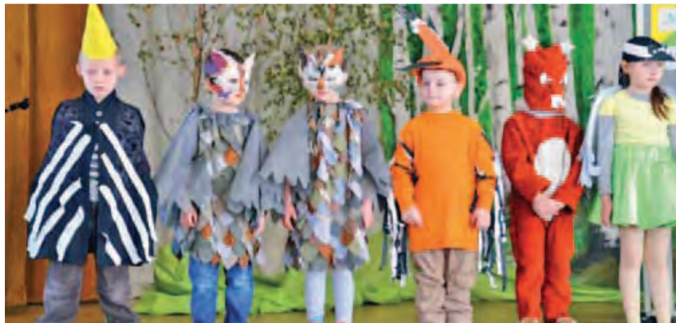
Dzieci z oddziału przedszkolnego filii w Bedlnie prezentowały się w ciekawych strojach przygotowanych przez rodziców