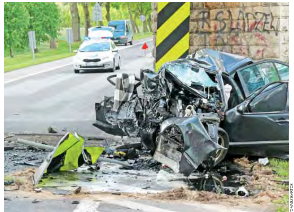
Zniszczenia samochodu świadczą mogą o dużej prędkości, z jaką uderzył on w ścianę wiaduktu. Przód pojazdu został całkowicie zgnieciony.

Przed wiaduktem, który zwęża drogę, od strony Łodzi, stoją dwa znaki nakazujące ograniczenie prędkości, najpierw do 70 km/h potem do 50 km/h, jest też znak informujący o zwężeniu. tb