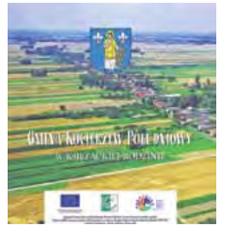
Okładka książki „Gmina Kocierzew Południowy. W książkowej rodzinie”.

Najbardziej interesującym i war- tościowym fragmentem albumu jest część zawierająca reprodukcje