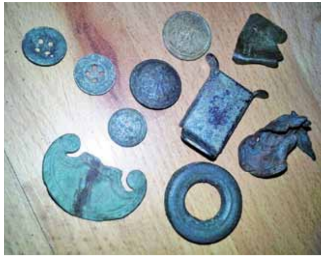
Guziki i fragmenty orzełków znalezione w czasie prac prowadzonych przez Dziesiątków na terenie dawnej jednostki przy ul. Jana Pawła II.