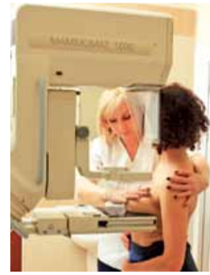
Badanie mammograficzne trwa tylko kilka minut.

Kobiety w wieku 50-69 lat kwalifikują się do badań w ramach Populacyjnego Programu Wczesnego Wykrywania Raka Piersi i nie muszą posiadać skier-