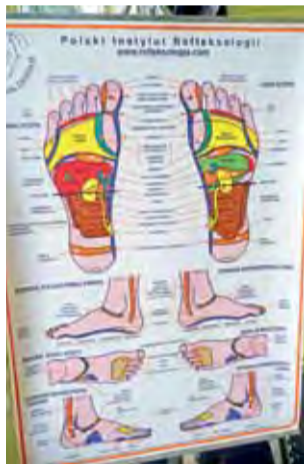
Tablica pokazująca, które obszary stopy odpowiadają za funkcjonowanie jakiego organu w organizmie.

maga w problemach z prostatą. Pomocny będzie przy takich dolegliwościach jak: zapalenie stawów, cukrzyca, stany zmęczenia, przedwczesne starzenie się, bóle pleców, niedowład, bezsenność, depresja, bóle mięśniowe, osteoporoza, nadciśnienie, niedokrwi-