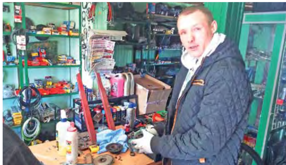
Współpracownik pana Krzysztofa podczas czyszczenia rowerowych części.

Łowicz | Sezon rowerowy: bez troski o dwa koła z relaksu nic nie będzie