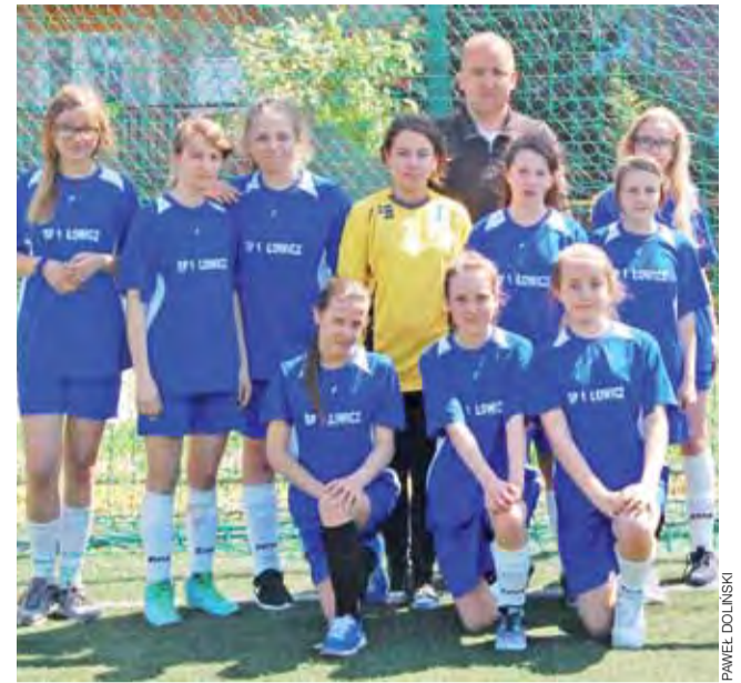
Dziewczyny z SP 1 Łowicz wygrały miejską rywalizację.