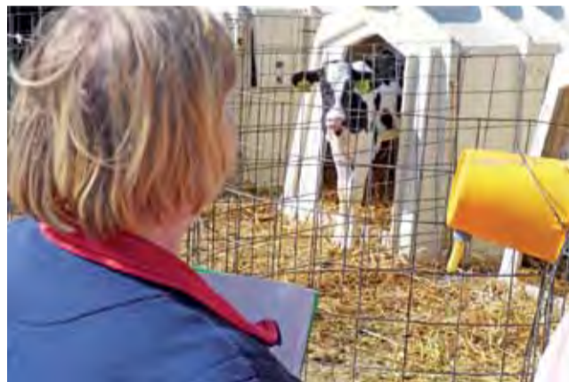
W gospodarstwie w Krępie dużą wagę przykładają do warunków, w jakich trzymane są cielaki.