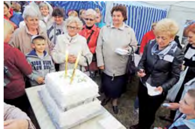
Jubileuszowy tort z okazji 15-lecia WTZ Żychlin

Po zakończonych przemówieniach i oficjalnym otwarciu nastąpiła część artystyczna.