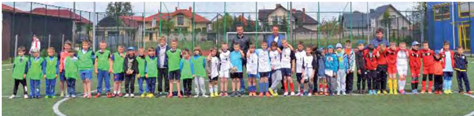
Uczestnicy I Turnieju piłki nożnej chłopców o Puchar Burmistrza Gminy Żychlin na żychlińskim "Orliku".

Piłka nożna | I Turniej piłki nożnej chłopców o Puchar Burmistrza Gminy Żychlin