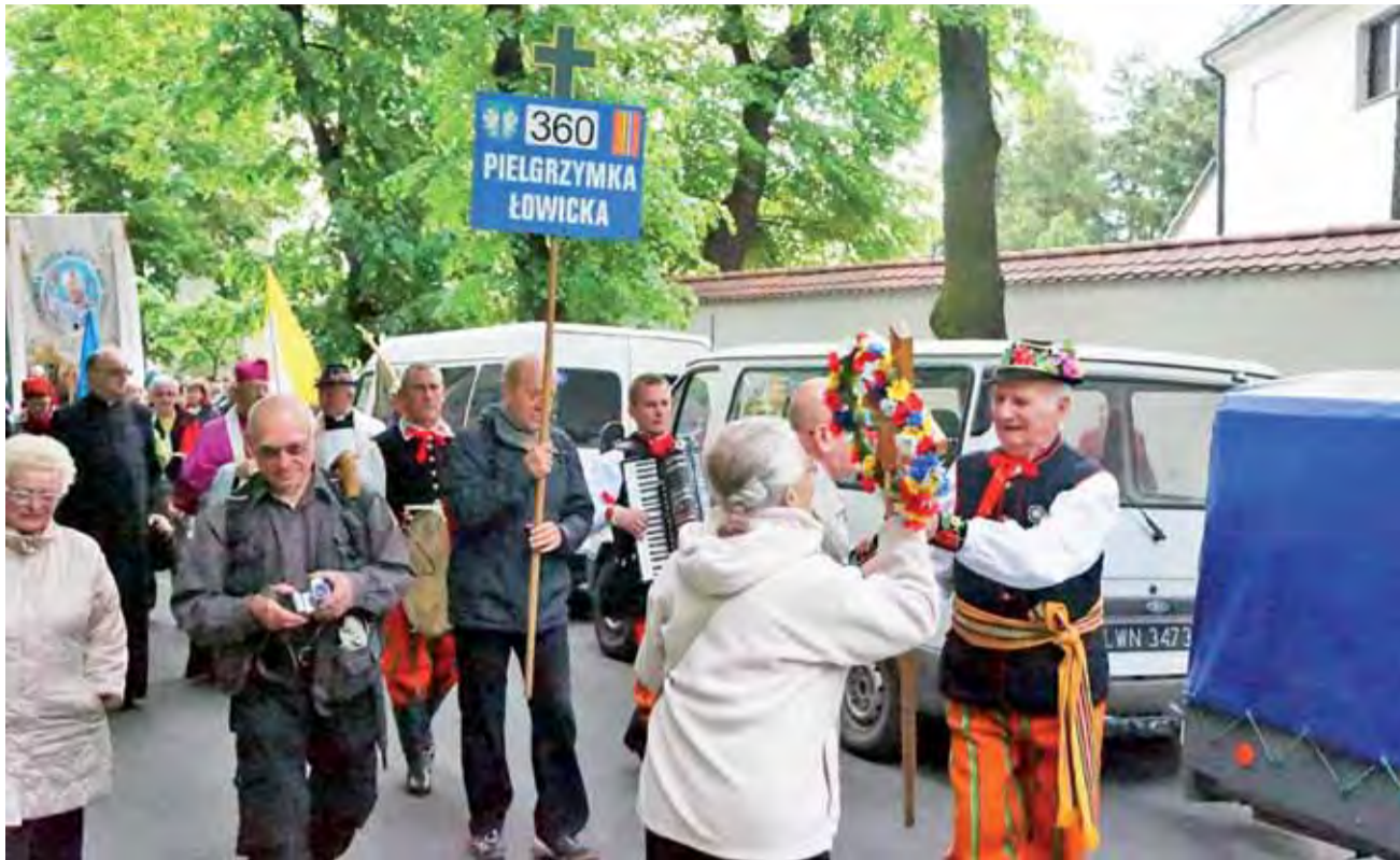
O godz. 7.45 pielgrzymka ruszyła z kościoła sióstr bernardynek. Krzyż całowali stojący przy poboczach wierni.