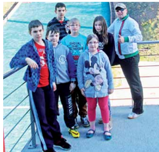
Szachiści z Nieborowa pod skocznia w Wiśle.