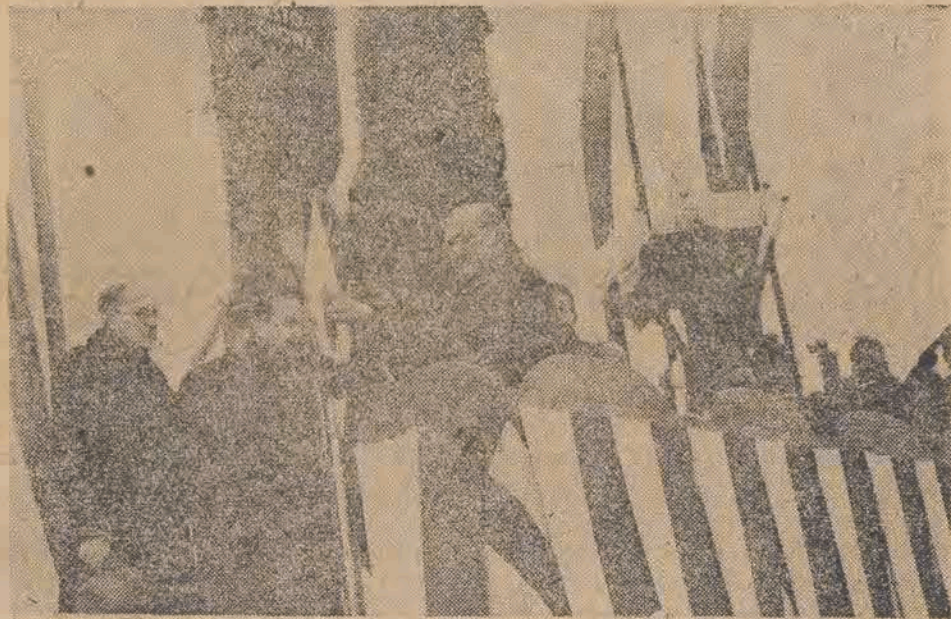
19 b. m. odbyło się pod Łodzią uroczyste otwarcie linii wysokiego napięcia łączącej dwa największe ośrodki przemysłowe Polski: Łódź i Górny Śląsk. Linia została wybudowana w rekordowym tempie i wyłącznie przy użyciu materiałów krajowych. (Na zdjęciu — Min. H. Minc, który po dokonaniu symbolicznego uruc homienia linii, dekorował pracowników zastużonych przy jej budowie).