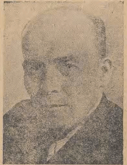
— powiedział na Kongresie Sekretarz Generalny KC PPR, tow. W. Gomułka-Wiesław