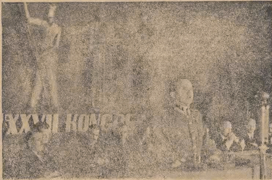
W dniach 14 — 17 br. obradował we Wrocławiu XXVII Kongres PPS. W imieniu rządu i Wojska Polskiego powitał Kongres Naczelny Dowódca W. P., marszałek M. Rola-Zymierski (na zdjęciu). Kongres zakończył się potężną manifestacją jednolitofrontową.