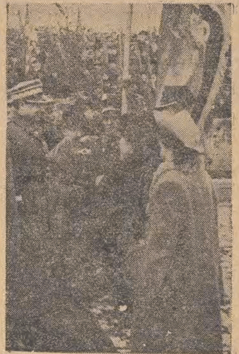
Wręczenie sztandaru Klubowi Sportowemu Szkoły.