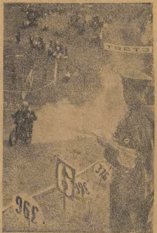
Wielką popularnością cieszy się w ZSRR sport motocyklowy. Oto fragment z wyścigu terenowego z przeszkodami, odbywającego się rok rocznie pod Moskwą.