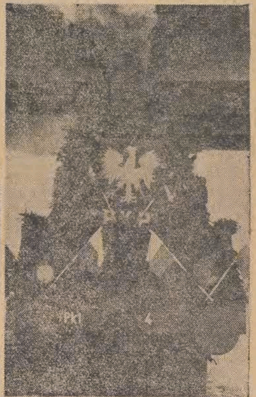
Kolejarze nasi nie tylko przejeżdżają tysiące, a nawet miliony km, ale również budują nowe linie kolejowe. 15 bm. otwarto bardzo ważne połączenie kolejowe Tomaszów-Maz. — Drzewica.