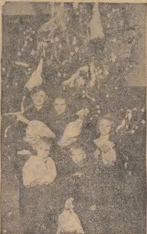
Wszystkie niemal zakłady pracy w Polsce zostały odwiedzone przez popularnego w sferach dziecińczych i młodzieżowych inspektora od podarków gwiazdkowych, św. Mikołaja. Nie trzeba dodawać, że wizyty świętego cieszą się wszędzie gorącym przyjęciem.