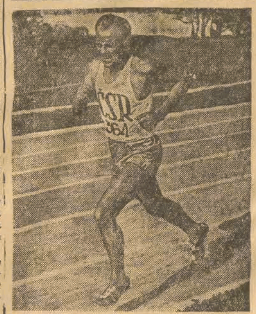
ZATOPEK (CSR), mistrz olimpijski w biegu na 10.000 mtr. uległ w Amsterdamie Szwedowi Ahlendorfowi i Polendrowi Slijkhuisowi — w biegu na 3.000 metrów, zajmując dopiero 3 cie miejsce. D-023540

Podane powyżej nazwiska nie przesądzą ostatecznie składu reprezentacji na Igrzyska Bałkańskie.