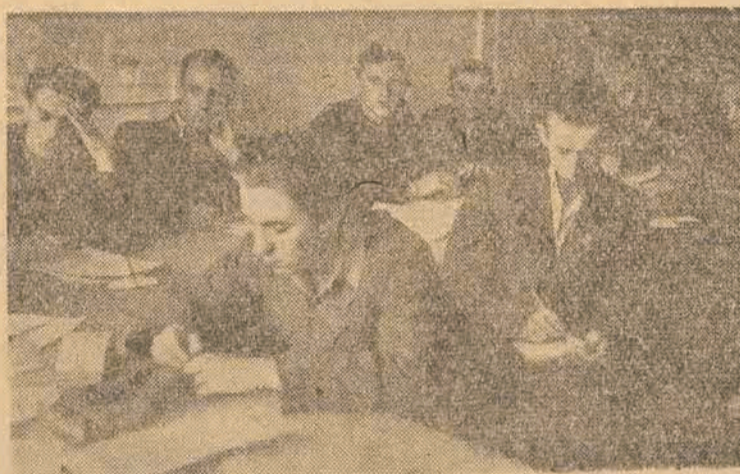
W Zarządzie Wojewódzkim ZMP odbyła się konferencja, przedmiotem której były formy pracy oświatowej, szczególnie na wsi. Opracowano plany, a teraz do dzieła!