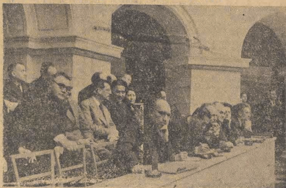
Delegaci partii komunistycznych i robotniczych z całego świata biorą udział w Kongresie w charakterze gości.