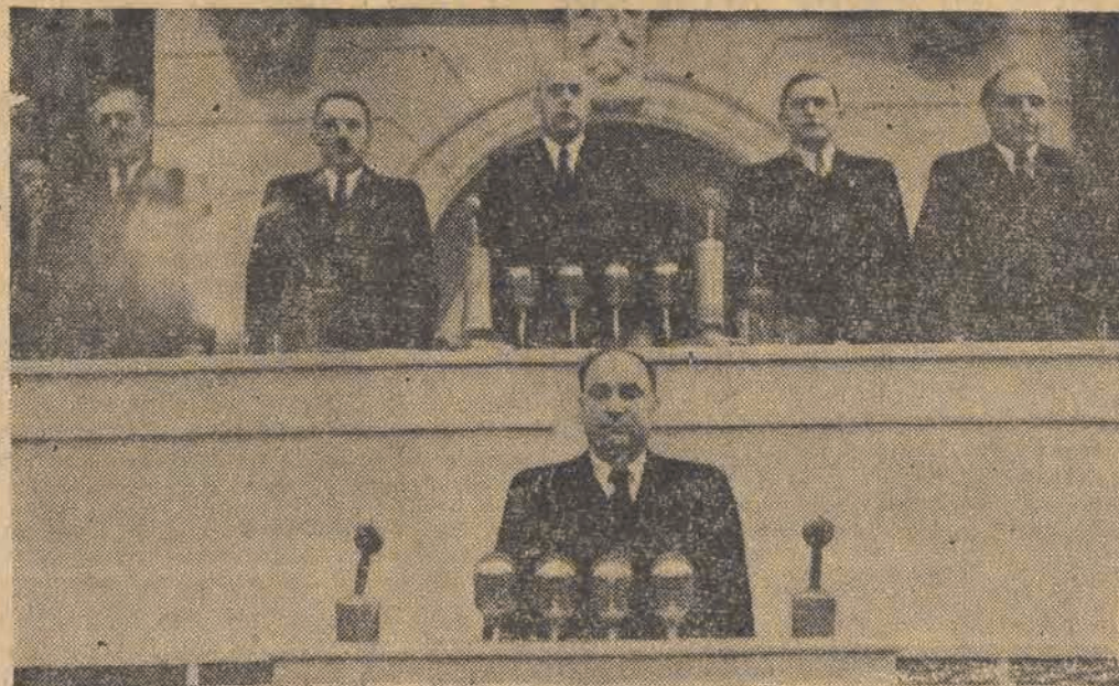
Tow. Ponomarenko wita I-szy Kongres Polskiej Zjednoczonej Partii Robotniczej w imieniu Partii Komunistycznej ZSRR.