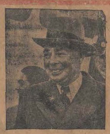
GIBRALTAR, 2.4 — Brytyjski minister wojny Hore Belisha ma odwiedzić Gibraltar w drugie święto Wielkiejnocy

Redakcja: ul. Zwirki Nr. 2. — Administracja: ul. Piotrkowska Nr. 11. Ekspedycja: ul. Piotrkowska Nr. 11. Telefony: Redakcji Nr. 102-28 i 138-28. Administracji Nr. 182-48. Skrzynka pocztowa Nr. 132. Redakcja otwarta dla interesantów tylko od godz. 2 do 5-jej po poł. Redaktor lub jego zastępca przyjmuje od g. 4 do 5 poł. — Administracja czynna — od g. 9 rano do g. 21 bez przerwy. — Wydział Ogłoszeń tel. 182-48. Filia ul. Piotrkowa 11, tel. 102-29. Wydział Prenumeraty tel. 182-48. Opłata pocztowa uiszczona gotówką.