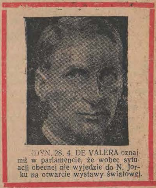
LONDYN, 28. 4. DE VALERA oznajmił w parlamencie, że wobec sytuacji obecnej nie wyjedzie do N. Jorku na otwarcie wystawy światowej.

Redakcja: ul. Zwirki Nr. 2. — Administracja: ul. Piotrkowska Nr. 11. Ekspedycja: ul. Piotrkowska Nr. 11. Telefony: Redakcji Nr. 102-28 i 138-28. Administracji Nr. 182-48. Skrzynka pocztowa Nr. 132. Redakcja otwarta dla interesantów tylko od godz. 2 do 5-jej po poł. Redaktor lub jego zastępca przyjmuje od g. 4 do 5 po poł. — Administracja czynna — od g. 9 rano do g. 21 bez przerwy. — Wydział Ogłoszeń tel. 182-48. Filia ul. Piotrkowska 11, tel. 102-29 Wydział Prenumeraty tel. 182-48. Opiata pocztowa uiszczona gotówką.