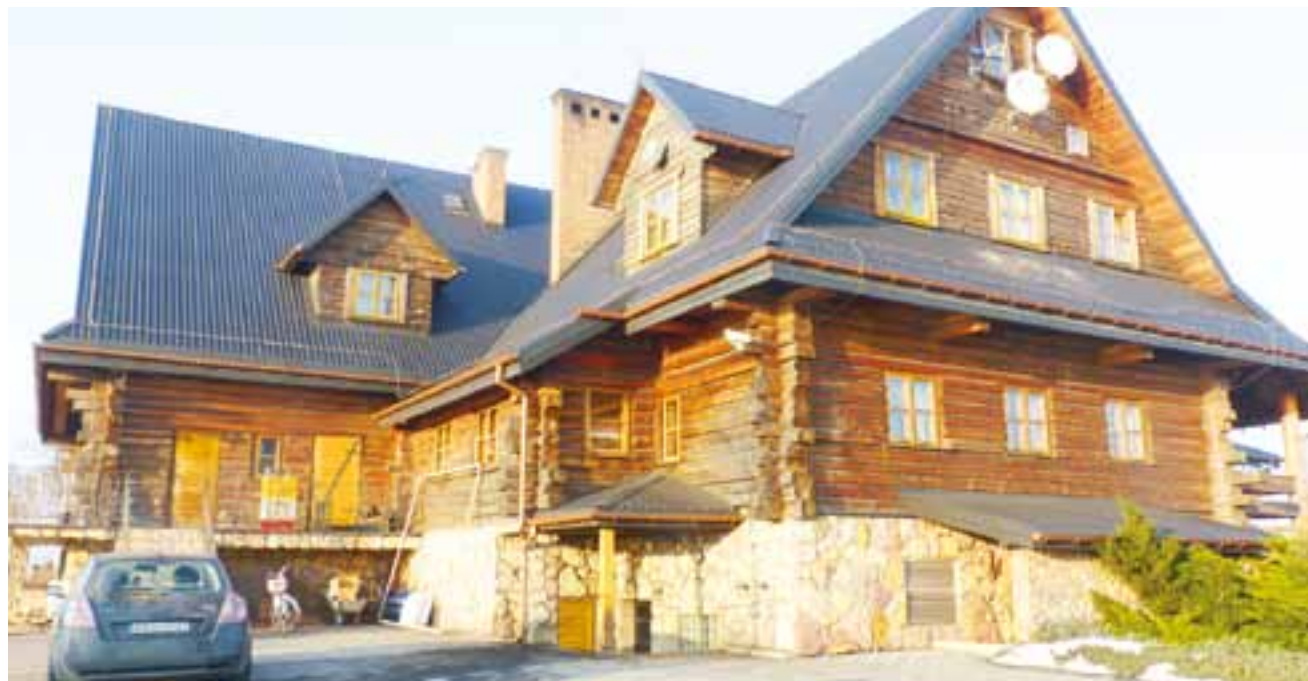
Zajazd „Basior” między Kutnem a Krośniewicami. Tam odbyły się dwa nieformalne spotkania części członków Rady Nadzorczej, na których omawiano planowane zmiany.