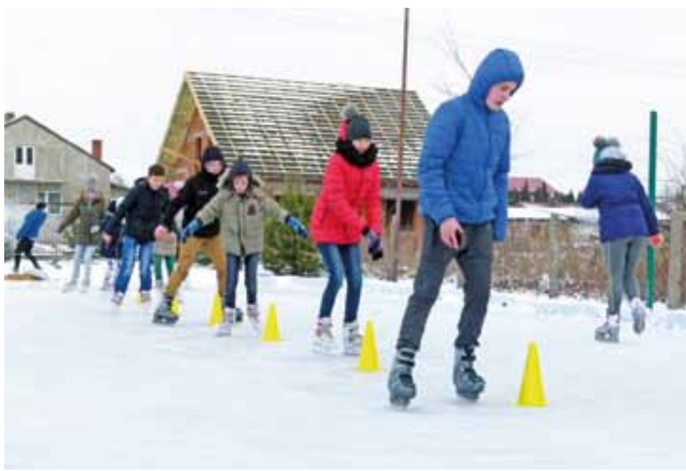
Nauka jazdy ślalomem między pachółkami. Na tafli uczniowie klasy I Gimnazjum w Sobocie.