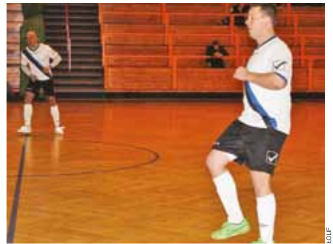
Akacja-Team wygrała z Bezedurą i awansowała do II ligi.