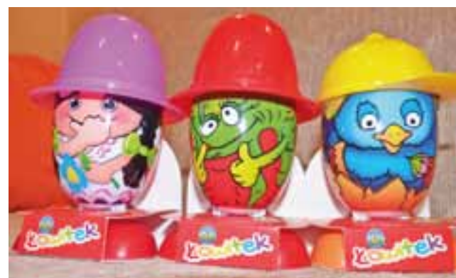
Jeden z najnowszych hitów: serek homogenizowany „Łowitek” – „Najlepszy Produkt 2017 – Wybór Konsumentów” – laur sprzed kilku tygodni, z 19 stycznia.

– obroty za 2016 rok mieliśmy o 4,4% wyższe niż za 2015,