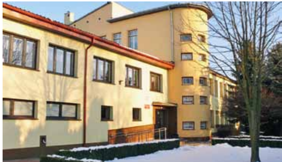
Front budynku Gimnazjum w Kompinie – architektura zdradza przedwojenną przeszłość, ale obecnie, po remontach, to nowoczesny szkolny gmach.

Wójt przyznał, że czuje osobisty żal, głównie z powodu wielu inwestycji w budynek szkoły w Kompinie, że nie będzie wykorzystywany. Już w 1997 r., po zniszczeniach poczynionych po ulewnych deszczach, został on gruntownie wyremontowany, wymieniono w nim stropy i dach. W 2012 r. wybudowano największą w gminie Nieborów salę gimnastyczną, która zastąpiła małą i niefunkcjonalną salę. Budynek został także docieplony, nie mówiąc o wielu drobniejszych