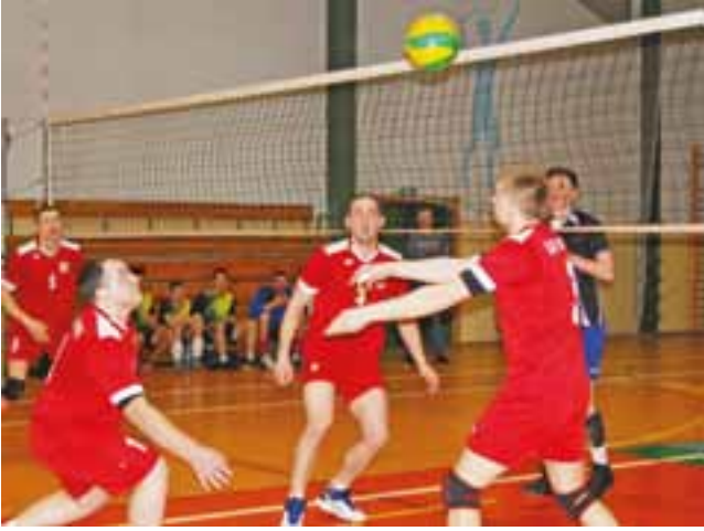
Siatkarze z LKS Retki musieli tym razem uznać wyższość Korabki.