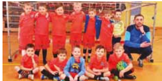
Gracze Soccer Kids byli zadowoleni po turnieju Kids Cup w Głownie.