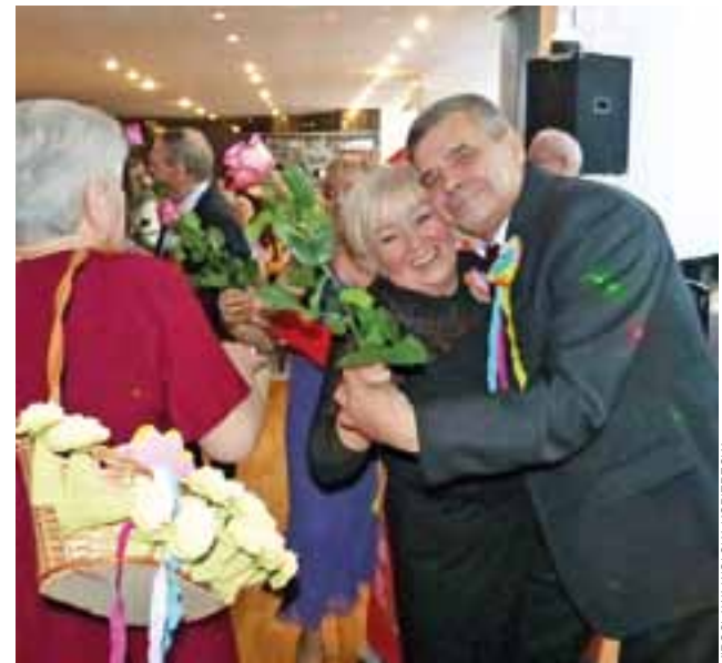
Walc z różą. W tym konkursie zespół muzyczny przypatrywał się tańczącym, aby wyłonić Królową i Króla balu.

Był też konkurs na najlepsze przebranie, który wywołał bardzo duże poruszenie wśród uczestników balu, choć wzięło w nim