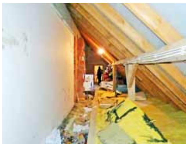
Prace dociepleniowe w pierwszej kolejności rozpoczęły się nad lewą nawą kościoła na Korabce.