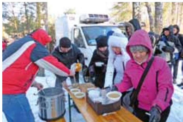
W Joachimowie-Mogiłach, już na początku rajdu, uczestników ugościł wójt gminy Bolimów, fundując gorącą i pożywną grochówkę.