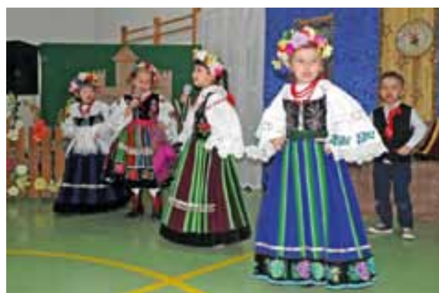
Dzieci w strojach ludowych śpiewały, tańczyły i recytowały wiersze.

Spotkanie było planowane kilkanaście dni wcześniej, ale zostało przesunięte. Odbyło się z opóźnieniem w stosunku do faktycznych dat, kiedy to w kalendarzu są wyznaczone owe dni (przypomnijmy, że są to 21 i 22 stycznia) w związku z chorobami, jakie dotykały ostatnio dzieci