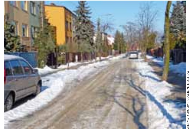
Ulica Słowackiego w Łowiczu w zimowej szacie nie wygląda źle. Dalszych prac na niej mieszkańcy mogą spodziewać się najwcześniej w połowie roku.

Kobieta była też zorientowana, że poprawa nawierzchni ul. Słowackiego oraz chodników na niej została uwzględniona w budżecie partycypacyjnym Łowicza na ten rok, jako inwestycja zgłoszona przez mieszkańców osiedla Dąbrowskiego. Ona sama też na nią głosowała i zachęcała do tego inne osoby. Dlatego prosiła, abyśmy wyja-