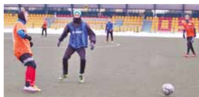
Juniorzy Pelikana (niebieskie kontrasty) zremisowali z seniorami z Bedlna.

Spotkanie z zespołem z Bedlna rozpoczęło się bardzo spokojnie, obie drużyny grały zachowawczo ale nie było widać wielkiej różnicy pomiędzy zespołami pod względem technicznym. Rywale juniorów Pelikana przewyższali graczy trenera Rachubińskiego pod względem fizycznym, ale nie przekładało to się na wydarzenia boiskowe. Jako pierwsi na prowadzenie wyszli gospodarze pojedynku czyli gracze Pelikana, a autorem gola