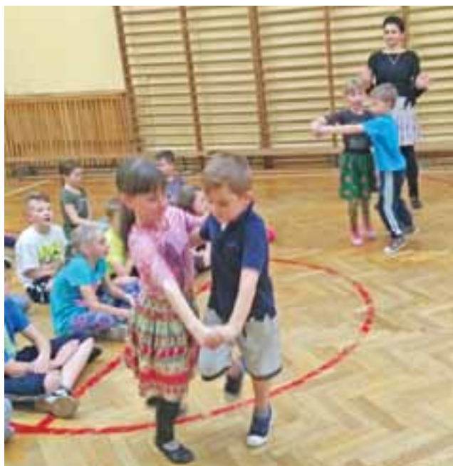
Nasz lokalny zespół „Koderki” oraz ich rówieśnicy z Zespołu Regionalnego „Kębłowo” mieli okazję wymienić się doświadczeniami.

Zespół z Wielkopolski bardzo intensywnie zaplanował sobie czas. Uczestniczył w mszy w Niepokalanowie, zwiedzał pałac w Nieborowie, brał udział