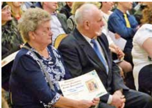
Każda para biorąca udział w przedsięwzięciu otrzymała „Pamiętkę Pierwszej Parafialnej Randki Małżeńskiej”.