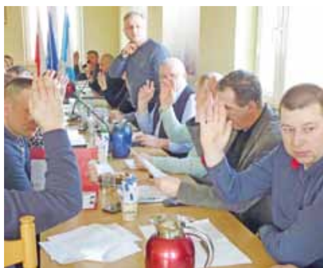
Radni przyjęli większością głosów uchwałę intencyjną ws. projektu dostosowania sieci szkół gminy Łowicz.

Co do jedynego w gminie Gimnazjum im. Janusza Korczaka, to gmina zaproponowała rozwiązanie polegające na jego włączeniu