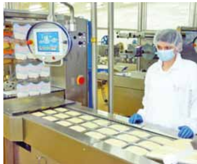
Linia pakowania serów twardej w zakładzie w Łowiczu.