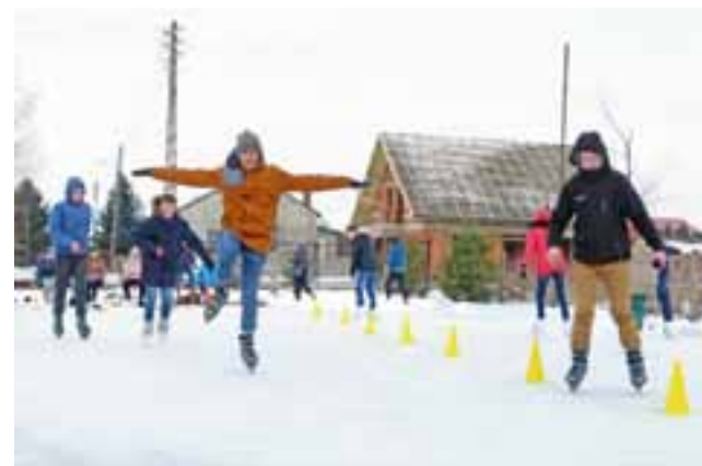
Takie lekcje to lubimy! – twierdzą uczniowie Szkoły Podstawowej i Gimnazjum w Sobocie, którzy na zajęciach wychowania fizycznego uczą się jazdy na łyżwach. Tutaj – zajęcia 10 lutego.

Lodowisko ma powierzchnię 230 m 2 (23 x 10 m), nie jest więc zbyt duże, ale na potrzeby klas wystarczające. Ze względów bezpieczeństwa jednorazowo na tafli może przebywać 25-30 osób. Kiedy odwiedziliśmy Sobotę wczesnym popołudniem 10 lutego,