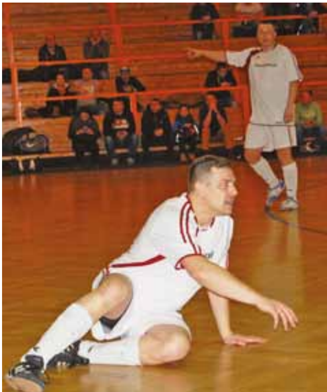
Czy gracze Alcatraz podskoczą do góry i zachowają miejsce w II lidze?