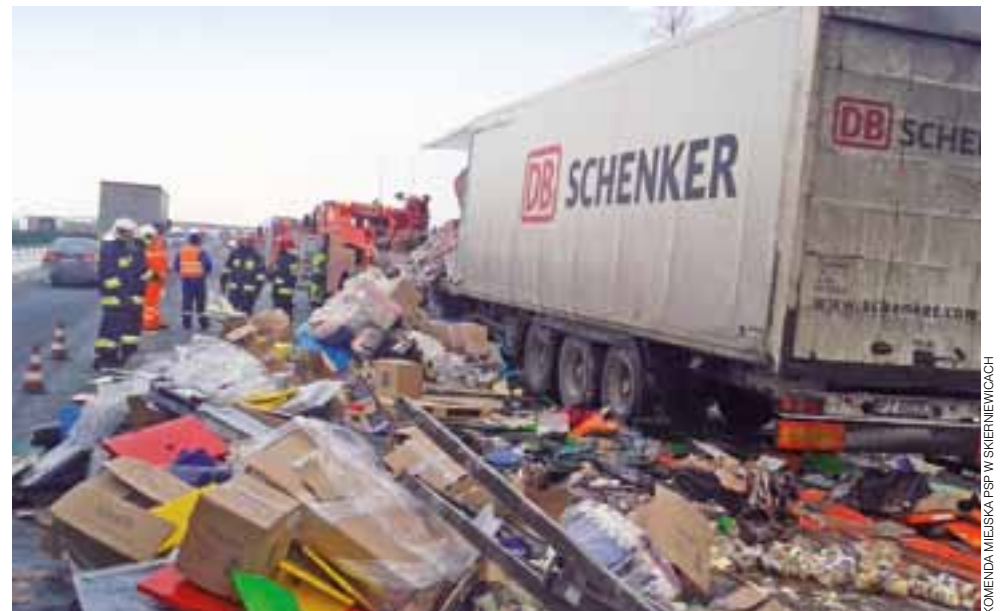
Paczki wiezione przez ciężarówkę Schenker'a rozsypały się na autostradzie, część – jak widać – uległa zniszczeniu. To dlatego akcja udrażniania pasa autostrady A2 w kierunku Warszawy trwała tak długo.

Zderzenie na nitce A2 w kierunku Warszawy spowodowało utrudnienia w ruchu w kierunku stolicy na wiele godzin. Rano udało się udrożnić lewy pas, jednak najlepiej było zjechać z autostrady na zjeździe Skierniewice, którzy wyznaczili objazd policjanci.