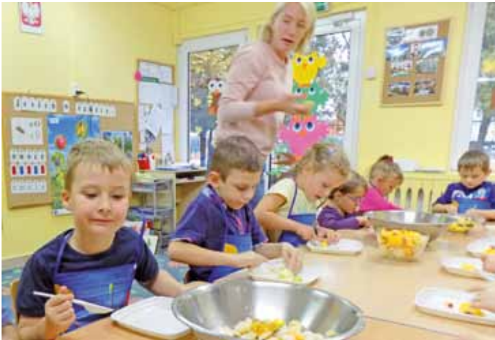
W Przedszkolu nr 10 realizowany jest program edukacyjny Eko-Książek, w ramach którego dzieci wzięły udział w zajęciach kulinarnych dotyczących zdrowego odżywiania się.