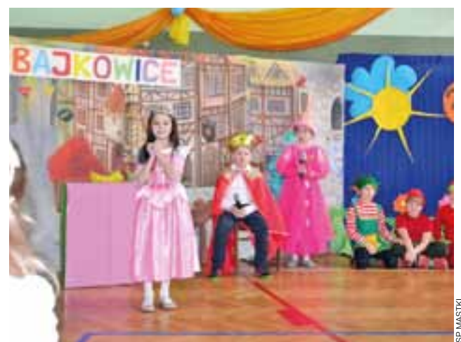
Młodzi aktorzy z Mastek ze sceny dla swoich babć i dziadków.