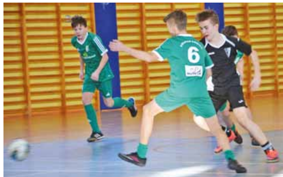
Pelikan 2002 podczas halowego turnieju w Głownie

■ KKS Kuluszki – KS Stal-2002 Głowno 1:8