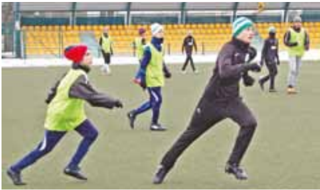
Gracze Pelikana 2003 (czarne dresy) nie przestraszyli się starszych rywali.