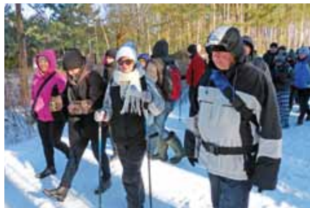
Rajdowicze wyruszają na trasę. 175 uczestników rajdu zostało podzielonych na mniejsze grupy, a każdą z nich zajmował się jeden z przewodników PTTK.

Mówił też o walce, gdyż Rosjanie zdecydowali się zlikwidować ten oddział, gromadząc do walki ok. 2 tys. żołnierzy, którzy 7 lutego 1863 r. uderzyli z dwóch stron: od rzeki Rawki i wsi Grabie. Zacięta walka trwała ok. 1,5 godziny. Zginęło w niej ok. 100 Rosjan, a powstańców 15 – pochowanych w miejscu, gdzie stoi pomnik. 16 powstańców Rosjanie wzięli do