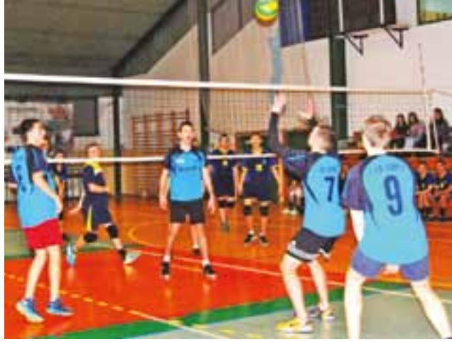
Ekpa I LO Łowicz nie dała większych szans UKS Pijarskiej.

Piłka siatkowa | 6. kolejka SAM, czyli Siatkarskich Amatorskich Mistrzostw Łowicza