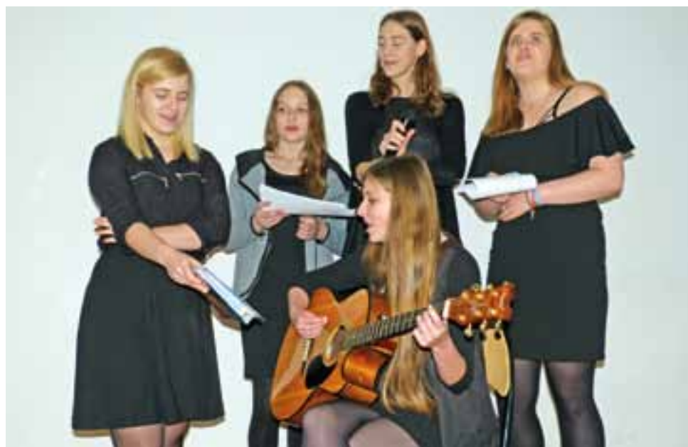
Dziewczęta ze scholi parafii Chrystusa Dobrego Pasterza zaśpiewały kilka piosenek o miłości, m.in. szlagier Czerwonych Gitar sprzed lat pt. „Tak bardzo się starałem”. Widownia im wtórowała.

Randka małżeńska rozpoczęła się mszą św. o godz. 15.00, odprawioną specjalnie dla małżeństw w kościele Chrystusa Dobrego Pasterza. Podczas liturgii zostały odnowione przyrzeczenia małżeńskie.