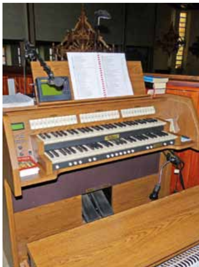
Nowe organy na chórze kościoła na Korabce są już zamontowane i gotowe do grania.