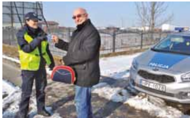
W Walentynki kierowcy zamiast mandatów dostawali od policjantów zapachowe serduszka.

Jak wyjaśniła nam rzecznik, to pierwsza edycja wojewódzkiej akcji. Przylączyły się do niej kome-