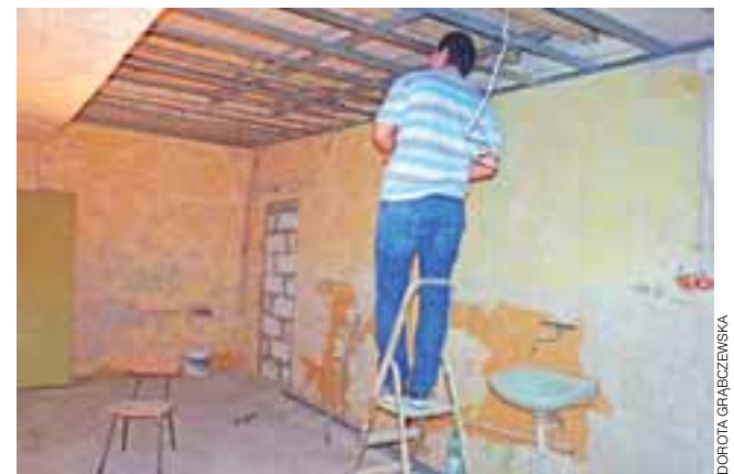
Rozpoczął się remont pracowni muzycznej w Żychlińskim Domu Kultury. Trwa montaż podwieszanego sufitu.

Mobilny Punkt Informacyjny Funduszy Europejskich znajduje się w Łowiczu, ul. Świętojańska 1 i w Plocku, ul. Kolegialna 19. dag