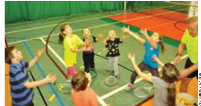
Gry i zabawy z tenisem ziemnym to dobry pomysł dla młodych sportowców.

Teraz czekamy na akcję Lato z OSiR 2016.