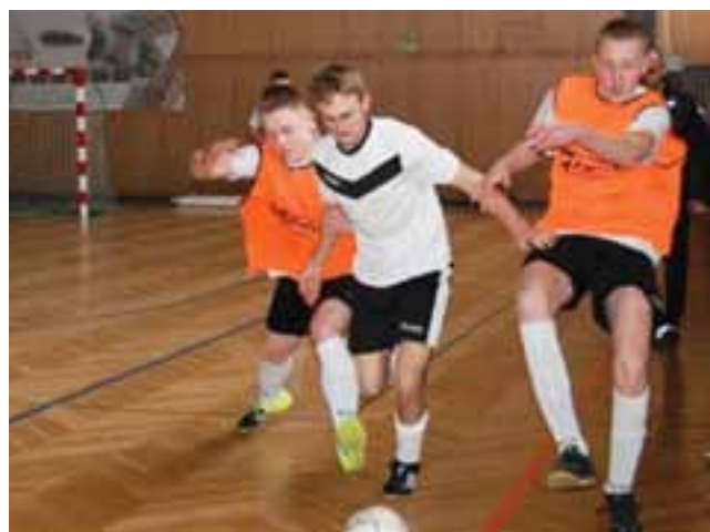
Zacięta walka pomiędzy graczami Karczmy Bednarskiej Bednary (pomarańczowe trykoty) oraz Korony Junior Wejście.

W sobotę 27 lutego rozegrana została runda preeliminacyjna Puchar Burmistrza w halowej piłce nożnej. O prawo gry w kolejnej rundzie rywalizowały drużyny z III i IV ligi.