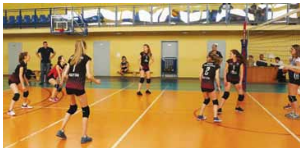
Spotkanie 15. kolejki Ekstraklasy drużyny Żychlińskiej Akademii Siatkówki Volley Team przeciwko Staszic Kutno, zakończone wygraną żychlinianek 2:1.

Następne rozgrywki Ekstraklasy Kobiet z udziałem żychlińskich drużyn odbędą się w sobotę,