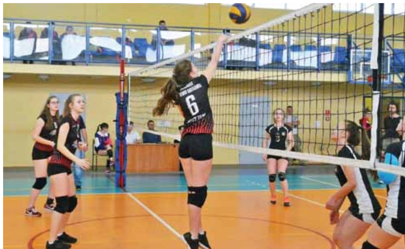
Drugie spotkanie Żychlińskiej Akademii Siatkówki Volley Team podczas 15. kolejki ligi kontra Victoria Koło, wygrane przez Żychlińską Akademię 2:0.