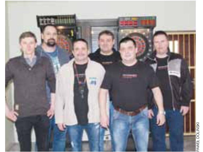
I znów niepokonany Krokody-Leg Łowicz...