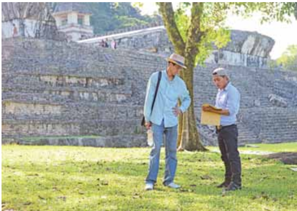
Ruiny świątyni Majów na Jukatanie. Ślady cywilizacji w leśnej dżungli.

dy gdzieś zmierza, każdy dokądś goni, każdy próbuje coś załatwić. Ryk jest potworny. Orkiestra aut, ciężarówek, autobusów i motocykli. Tyle, że każdy gra na własną nutę. Odnaleźć się tu nie jest łatwo,