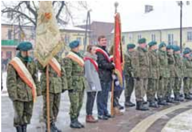
Obchody zorganizował ZS nr 1 im. Adama Mickiewicza. Na uroczysty apel pamięci przybyły poczty sztandarowe gimnazjum i liceum, grupa mundurowa oraz harcerze.

Narodowy Dzień Żołnierzy Wyklętych został ustanowiony świętem narodowym 3 lutego 2011 r. przez Sejm RP. Żołnierze