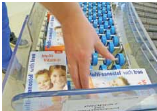
Multi-Sanostol jest produktem znanym od lat. Mimo dużej konkurencji, nie tylko utrzymuje się na rynku, ale zwiększa swoją popularność.

Na przełomie listopada i grudnia została zainstalowana w zakładzie nowa linia do pakowania tabletek i kapsulek w blistry, która została uruchomiona pod koniec stycznia. Jest to teraz najnowocześniejsza z linii działających w zakładzie. Składają się na nią takie urządzenia jak: blistrowaczka, kartoniarka, waga dynamiczna, moduł do naklejania etykiet oraz znaków i kodów potwierdzających oryginalność produktu, banderolownica oraz kartoniarka zbiorcza. Linia ta daje możliwość