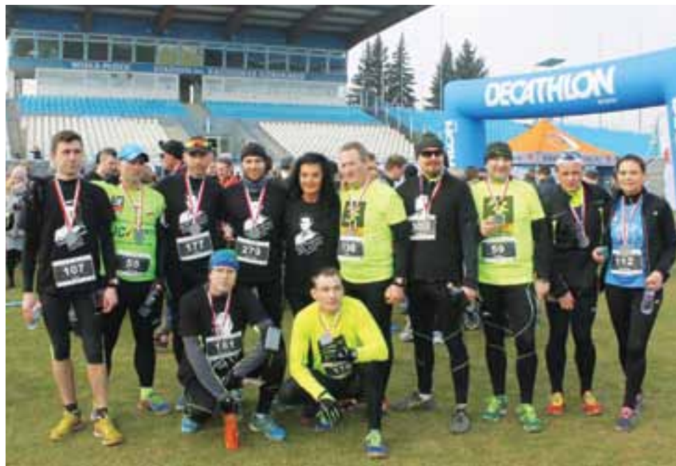
Rozbiegani Żychlin oraz inni żychlińscy biegacze, którzy upamiętnili Żołnierzy Wyklętych.

Lekkoatletyka | Bieg Pamięci Żołnierzy Wyklętych „Tropem Wilczym 2016” w Płocku