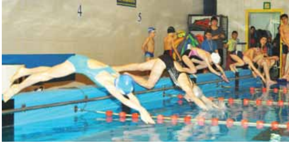
Najmłodszy mogli sprawdzić swoje umiejętności pływackie i rywalizować z innymi.