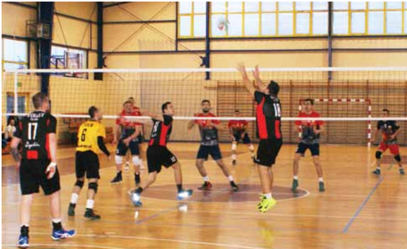
Lider za mocny dla drużyny z Żychlina. Volley Team przegrywa na własnym parkiecie 3:0.

Trzecia odsłona to kontrolowana gra drużyny przyjezdnej,