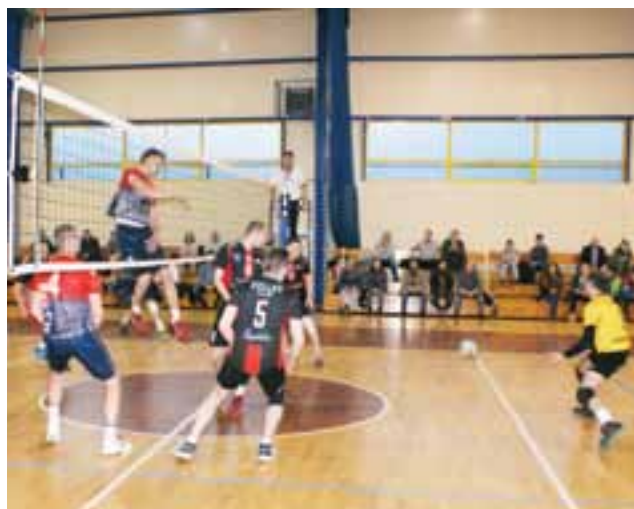
Spotkanie pomiędzy Volley Team Żychlin a ULKS MOSiR Sieradz, niestety zakończone przegraną gospodarzy 0:3.

która nie dała szans gospodarzom, zwyciężając set do 17.