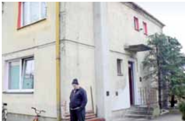
Komunalna nieruchomość. Przedmiotem sąsiedzkiego sporu jest m.in. konieczność korzystania z jednego wejścia do budynku (mężczyzna na zdjęciu nie jest właścicielem żadnego z mieszkań).

Stwierdza natomiast: – Chcieliśmy sprzedać te mieszkania, ale warunkiem jest wydzielanie odrębności lokali, co okazuje się niemożliwe przy wspólnym wejściu. Próbowaliśmy rozwiązać ten problem poprzez budowę zewnętrznych schodów z klatką prowadzącą na pierwsze piętro, ale wycena opiewała na aż 30 tys. zł. To bardzo dużo, więcej, niż gmina uzyskałaby ze sprzedaży mieszkania. Dla porównania mogę powiedzieć, że za sprzedaż w tym budynku mieszkanie z osobnym wejściem otrzyma-