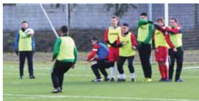
Jeden z rzutów wolnych wykonywanych przez drużynę KS Żychlin w meczu z Witonianką na stadionie miejskim w Żychlinie.