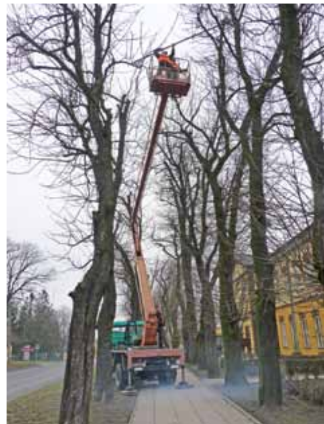
Gniazda gawronów znajdujące się na kasztanowych drzewach przy ulicy Narutowicza zostały ściągnięte. Spółdzielnia musiała wynająć podnośnik, by zdjąć wysoko posadowione gniazda. Teraz ludzie będą mogli bezpiecznie chodzić bez obawy, że spadną na nich ptasie odchody.

Ostatnie przycinanie drzew oraz ściąganie gniazd było 3 lata temu. W tym czasie ptaki zdążyły już odbudować wiele gniazd i znów spacer aleją mógł się skończyć nieprzyjemnie. dag