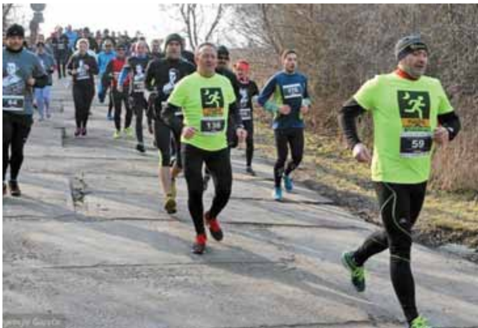
Na trasie plockiego Biegu Pamięci „Tropem Wilczym 2016”.