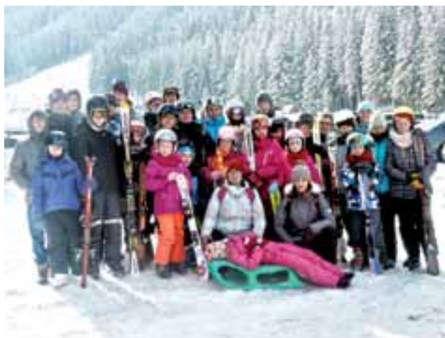
Grupa feriiowiczów z żychlińskiej Skakanki podczas zimowisku na Słowacji.

Dwa razy byli też na pobliskich termach. Na zewnątrz temperatura około zera, a woda 38 stopni Celsjusza. To dopiero była frajda, plawić się w ciepłej wodzie, gdy na zewnątrz chłód. Niezapomniany też był wieczór orawski,