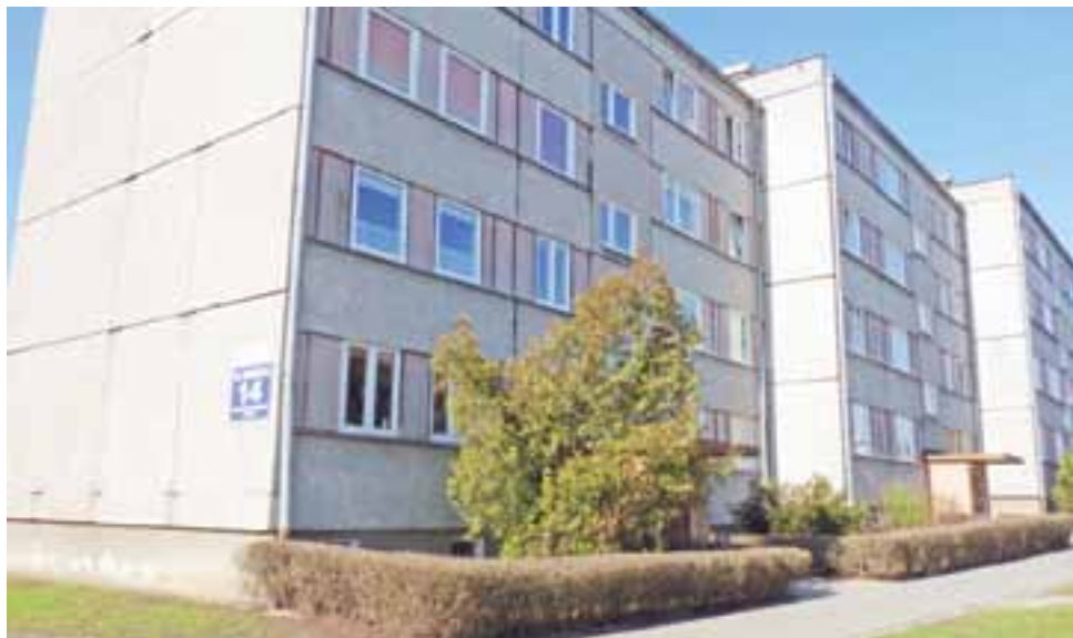
Czy uda się przekonać lokatorów spółdzielczych bloków, by budynki poddać termomodernizacji? W innych miastach już od kilku lat cieszą się z docieplonych bloków.

Spółdzielnia nie zniechęciła się jednak takim stanowiskiem lokatorów i zleciła wykonanie audytu energetycznego na blok Traugutta 14. W styczniu 2016 roku zorganizowała kolejne spotkanie i wysłała po raz kolejny ankietę do lokatorów, aby ci wypowiedzieli się na temat termomodernizacji. Tym razem zgodę wyra-