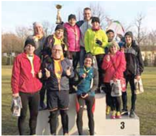
Mocna reprezentacja Ziemi Łowickiej w Dobrej.