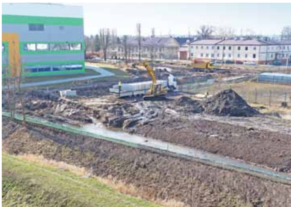
Prace nad korytem Bobrowki, mniej więcej w połowie realizacji. Widok z dachu biurowca zakładu z 25 lutego.

Kazik Staszewski zapełnił widownię na swoim koncercie str. 23