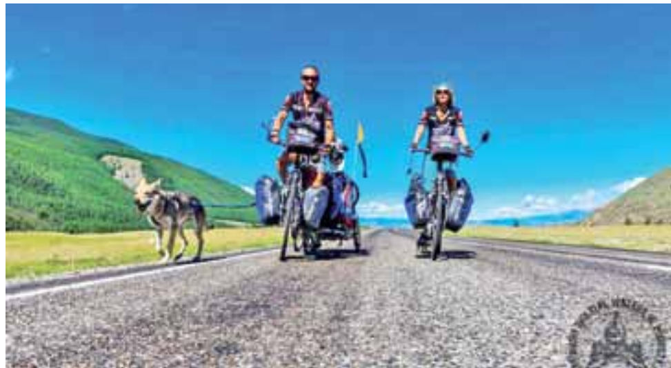
Oni dwoje i pies na drogach Mongolii.

Wjazd na pokazy jak co roku za friko! Start imprezy o godz. 13.45. mg