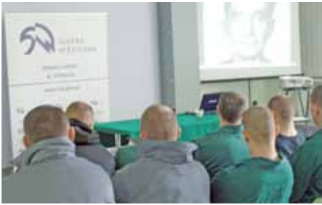
Osadzeni zapoznają się z postacią wielkiego bohatera II wojny światowej – rotmistrza Witolda Pileckiego.